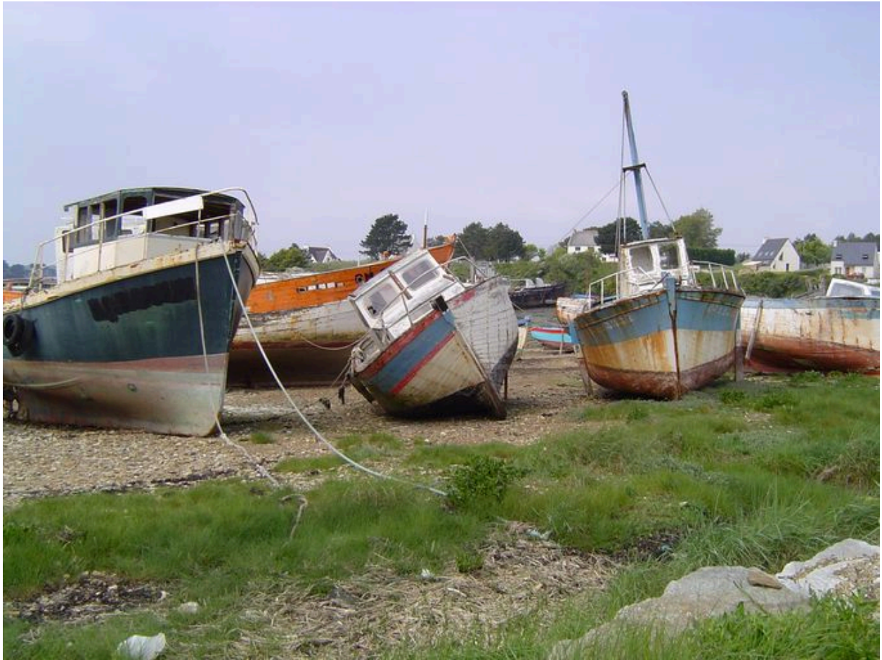
Vue générale du cimetière de bateaux de Rostellec