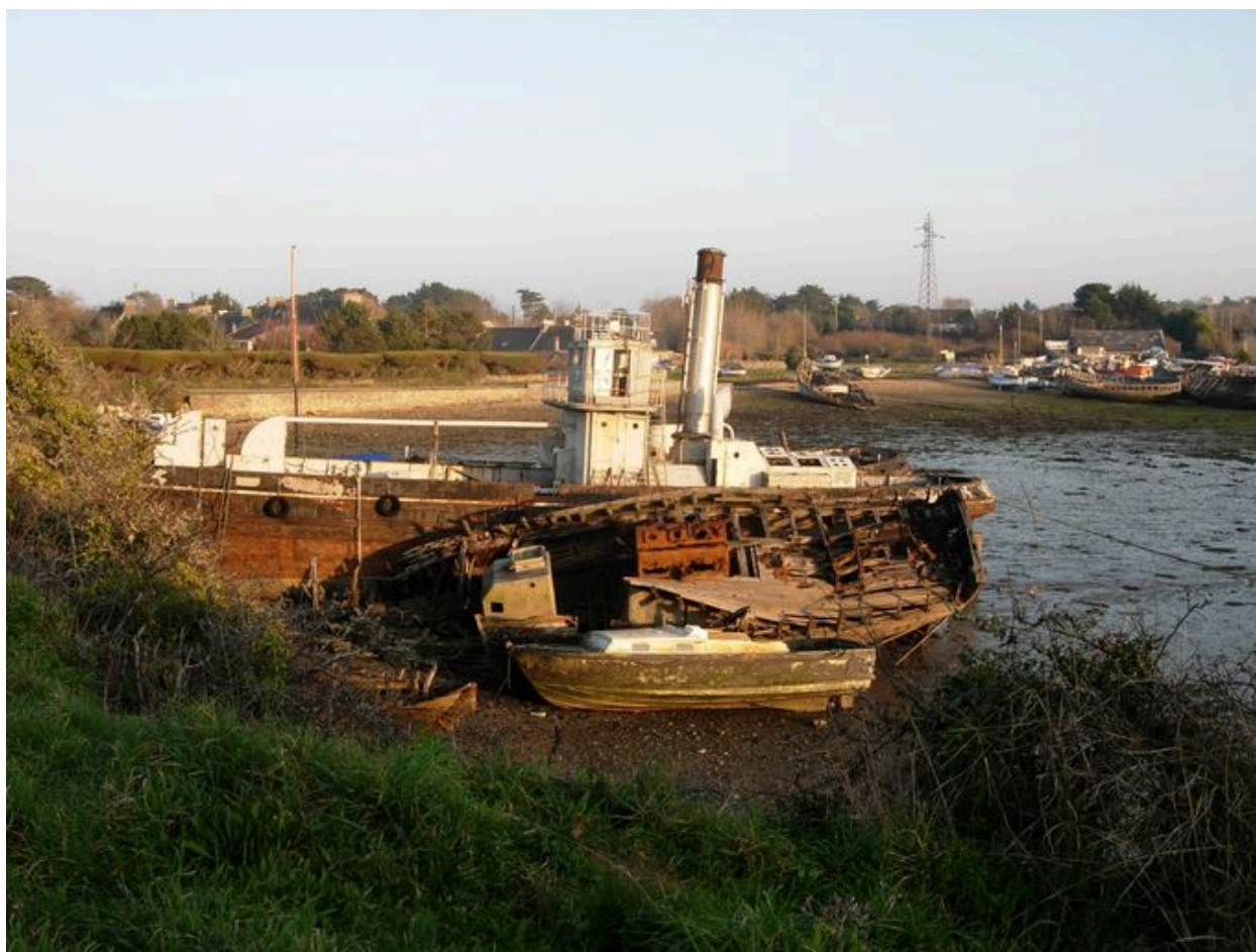
Les deux gabares à eau abandonnées (l'Averse et l'Ondée)