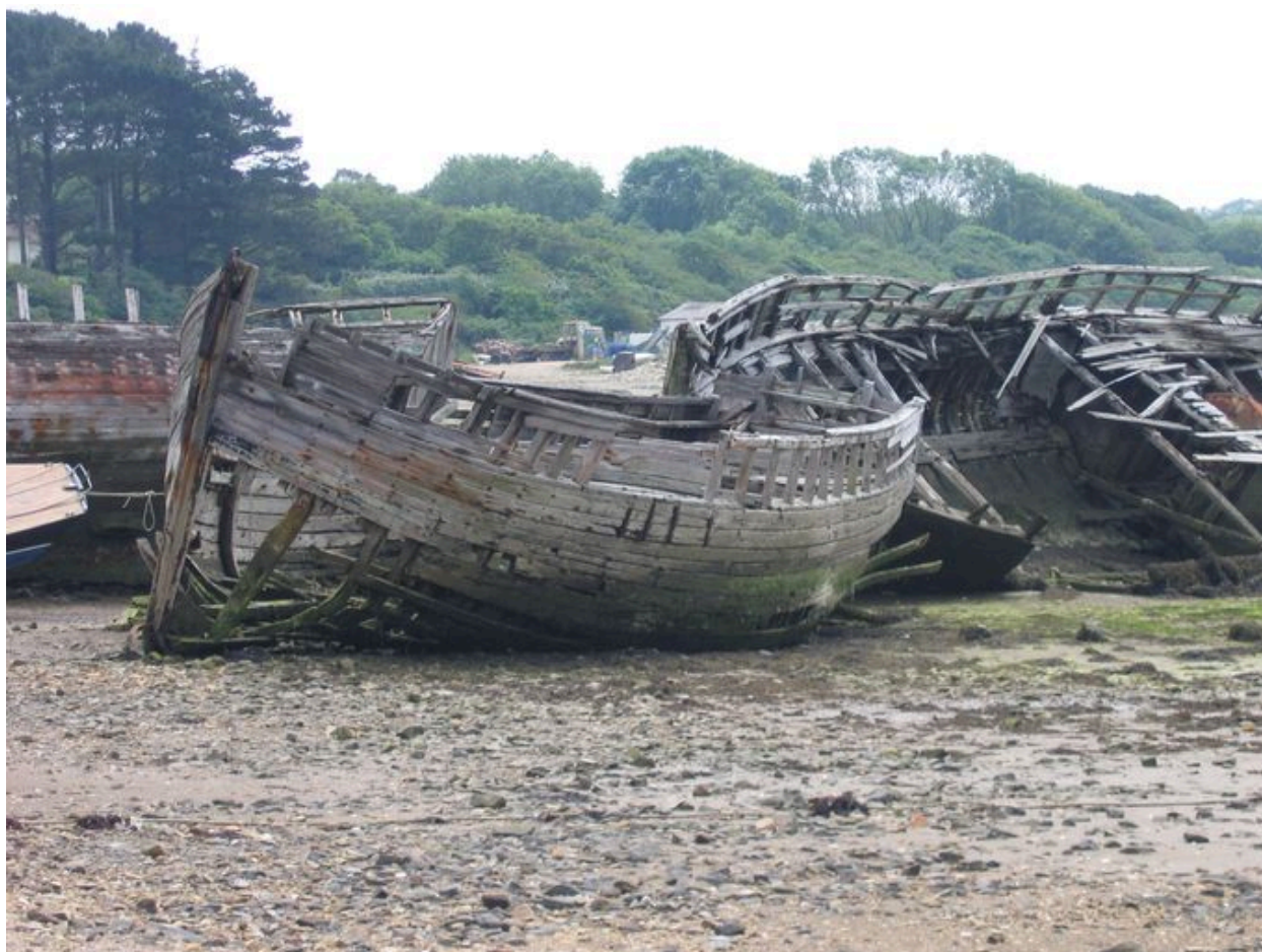
Bateaux à l'abandon à Rostellec