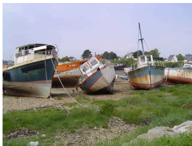
Vue générale du cimetière de bateaux de Rostellec