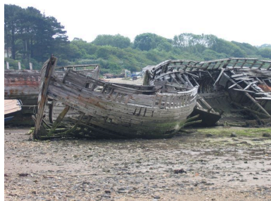
Bateaux à l'abandon à Rostellec