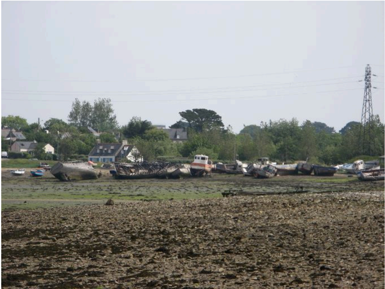
Vue générale du cimetière de bateaux de Rostellec