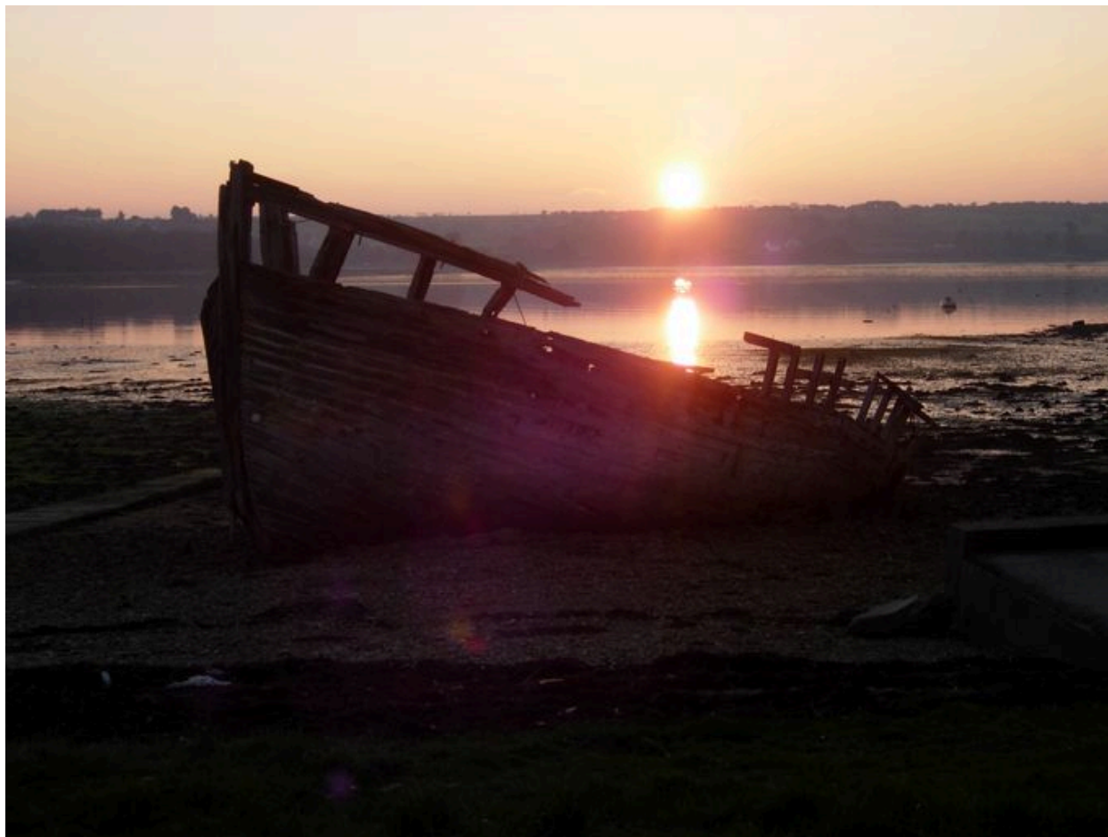
Bateau à l'abandon dans l'anse de Rostellec