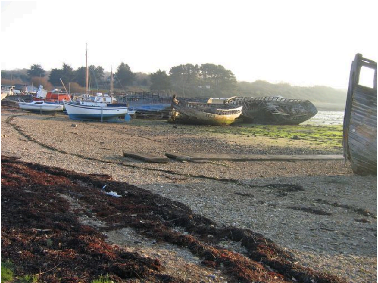
Cimetière de bateaux de Rostellec