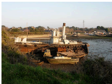
Les deux gabares à eau abandonnées (l'Averse et l'Ondée)