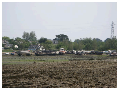
Vue générale du cimetière de bateaux de Rostellec