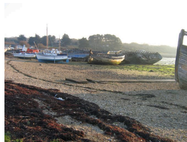
Cimetière de bateaux de Rostellec