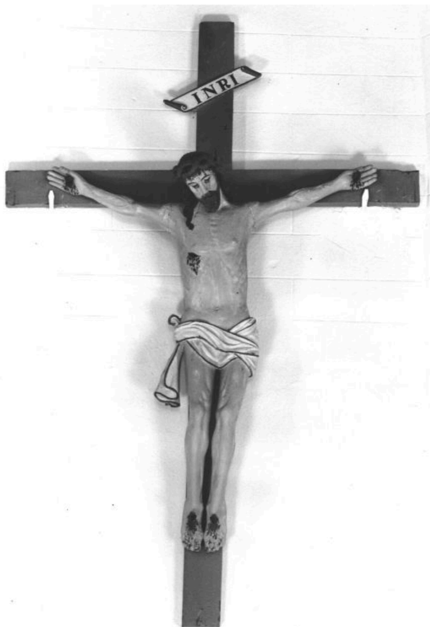
LA GRÉE SAINT-LAURENT, église paroissiale Saint-Laurent, croix Christ, vue générale.