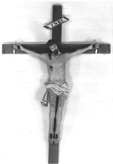
LA GRÉE SAINT-LAURENT, église paroissiale Saint-Laurent, croix Christ, vue générale. IVR53_19935601541X