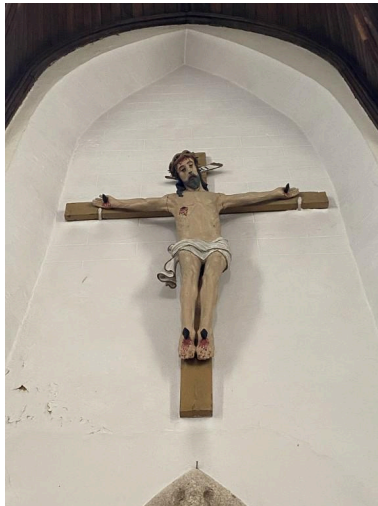
Vue générale IVR53_20255610778NUCA