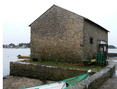
Ancien magasin ostréicole, actuellement hangar d'une station biologique IVR53_20085606116NUCA