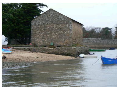
Ancien magasin ostréicole, actuellement hangar d'une station biologique IVR53_20085606117NUCA