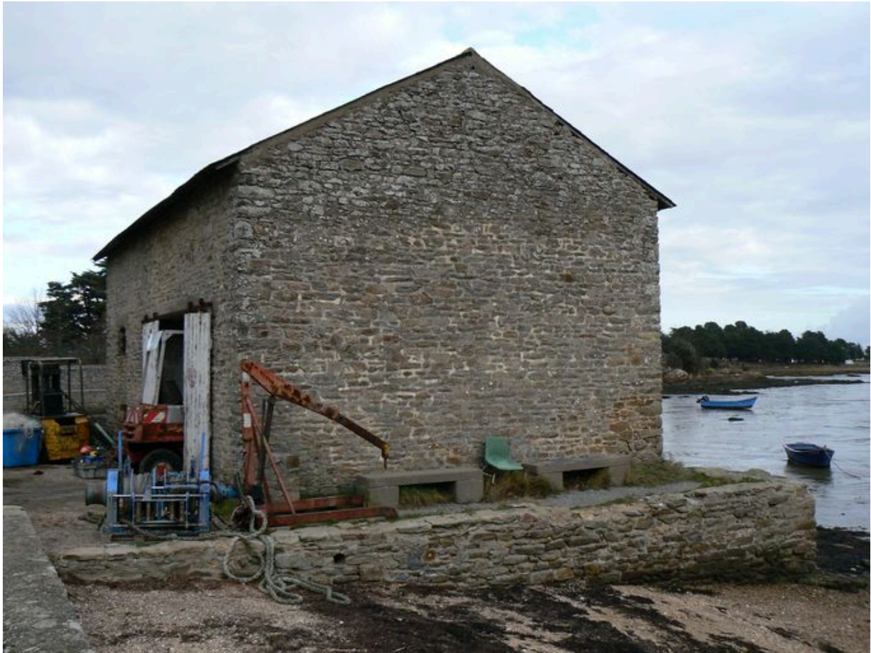
Vue générale d'un ancien magasin ostréicole, actuellement hangar d'une station biologique