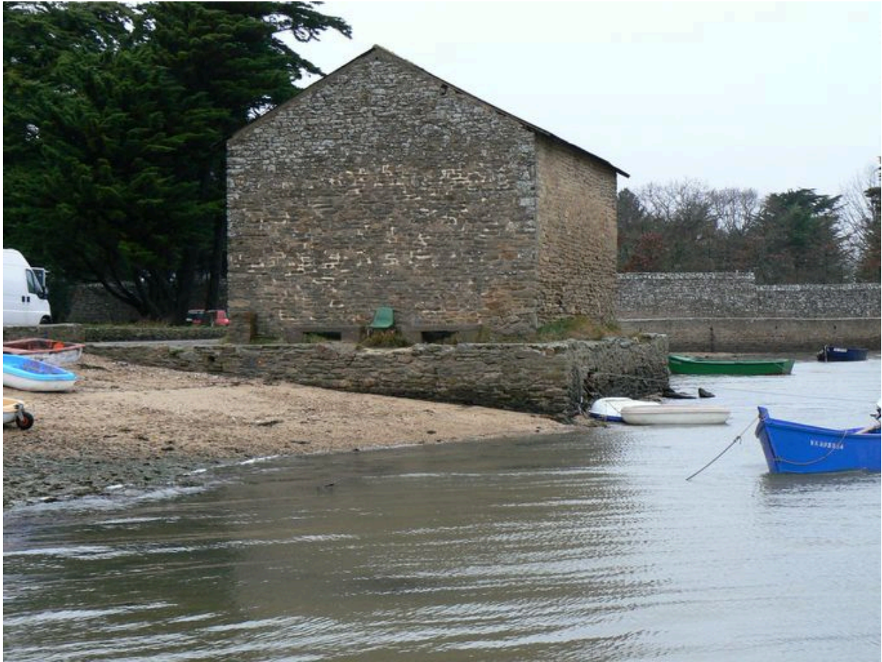
Ancien magasin ostréicole, actuellement hangar d'une station biologique