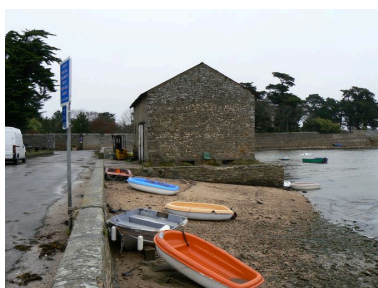
Ancien magasin ostréicole, actuellement hangar d'une station biologique IVR53_20085606118NUCA