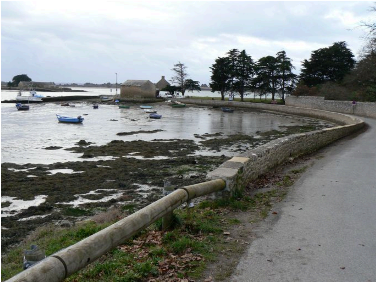
Ancien magasin ostréicole, actuellement hangar d'une station biologique