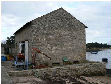
Vue générale d'un ancien magasin ostréicole, actuellement hangar d'une station biologique IVR53_20085606115NUCA