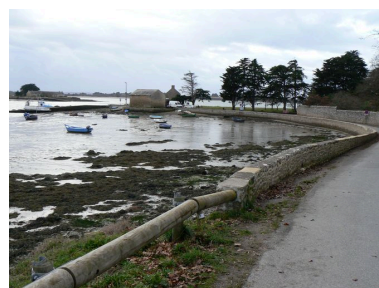
Ancien magasin ostréicole, actuellement hangar d'une station biologique