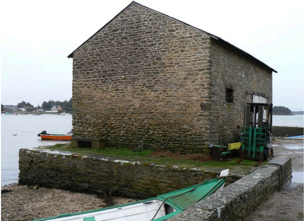
Ancien magasin ostréicole, actuellement hangar d'une station biologique