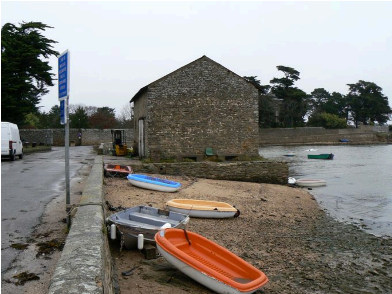
Ancien magasin ostréicole, actuellement hangar d'une station biologique