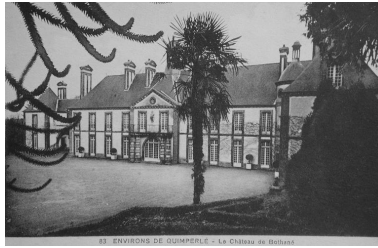
Vue générale IVR53_20052904382NUCB