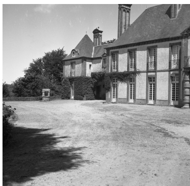
Elévation antérieure, pavillon latérale et galerie sur porte cochère, état en 1974.