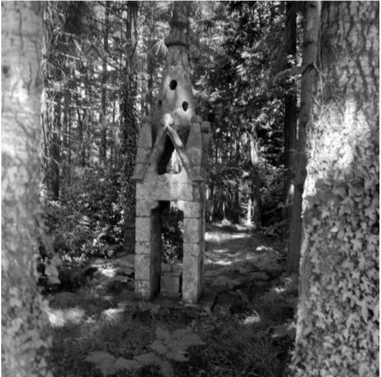
Chapelle, vue générale du clocher isolé.