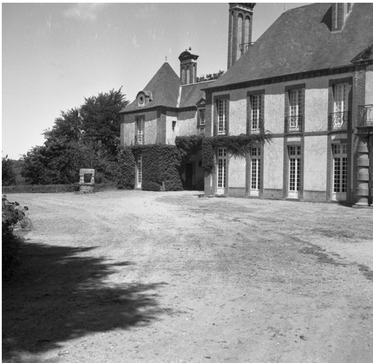
Elévation antérieure, pavillon latérale et galerie sur porte cochère, état en 1974.