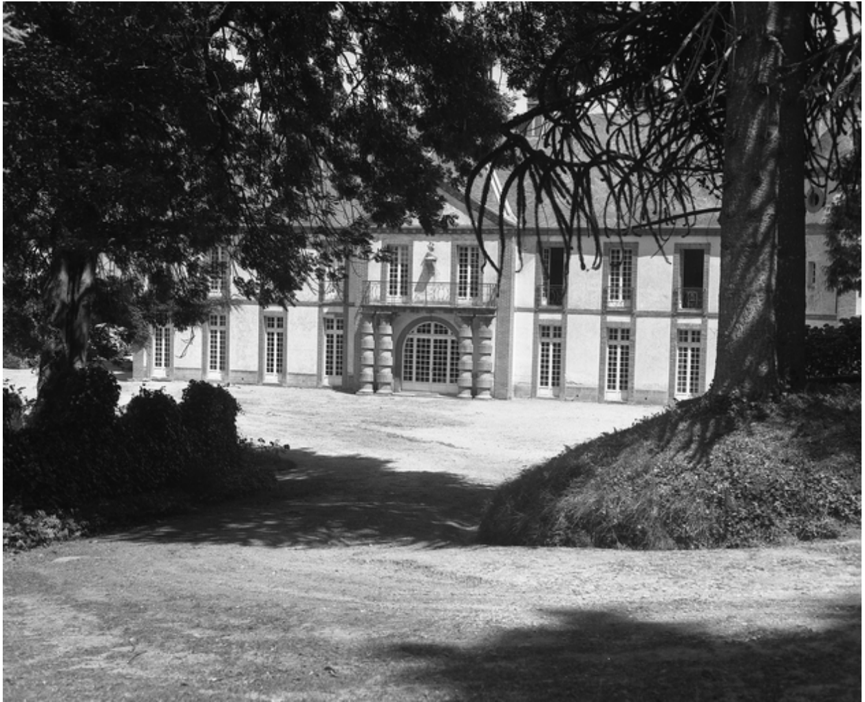
Elévation antérieure, état en 1974.