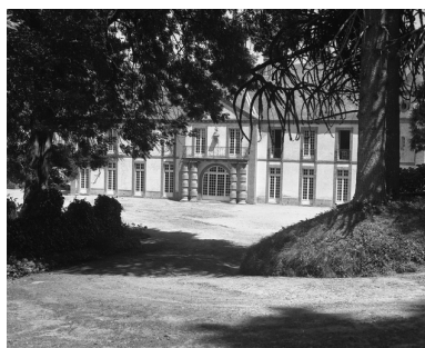
Elévation antérieure, état en 1974.