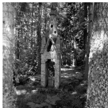
Chapelle, vue générale du clocher isolé.