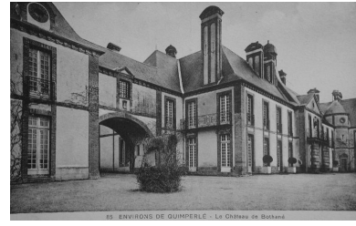
Vue partielle IVR53_20052904381NUCB