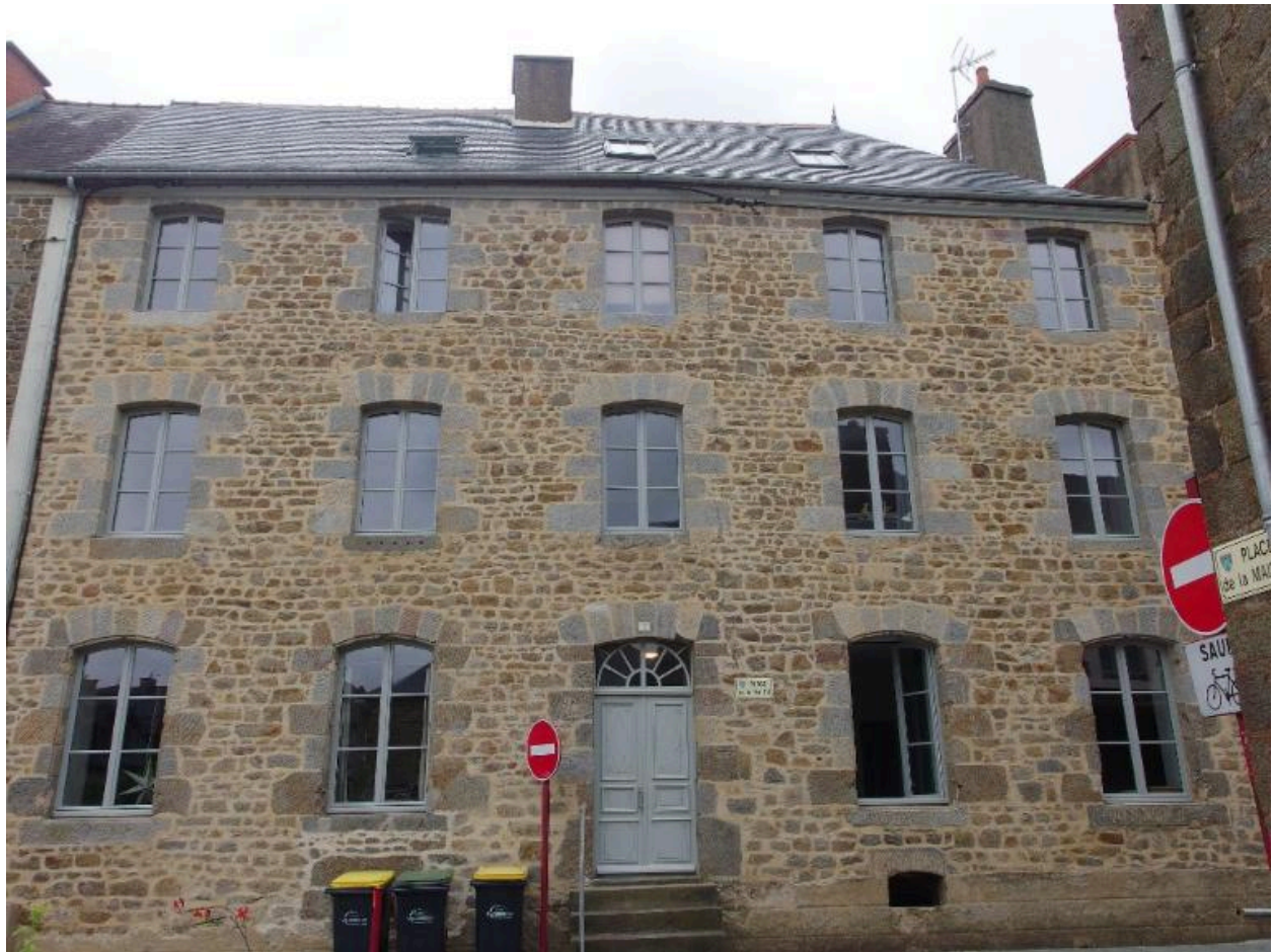
Vue de la façade ouest