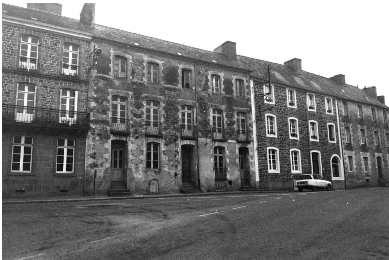
Vue nord-ouest en 1975