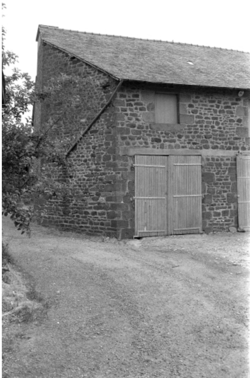
Pressoir et tissanderie de l'ancien couvent