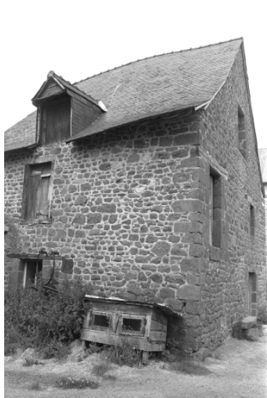
Ancien cellier du couvent IVR53_19753501071Z