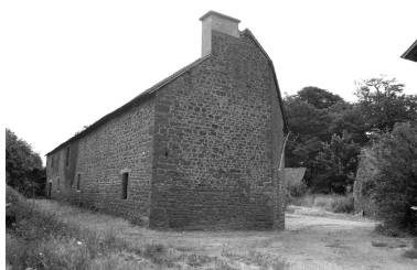
Cellier de l'ancien couvent en 1975 IVR53_19753501072Z