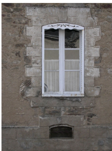
Fenêtre du rez-de-chaussée et soupirail de la cave IVR53_20053518288NUCA