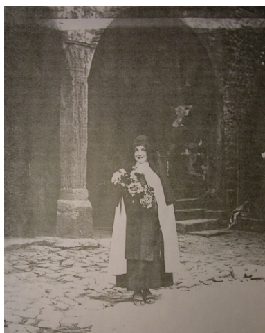
En arrière plan, le cloître du Couvent