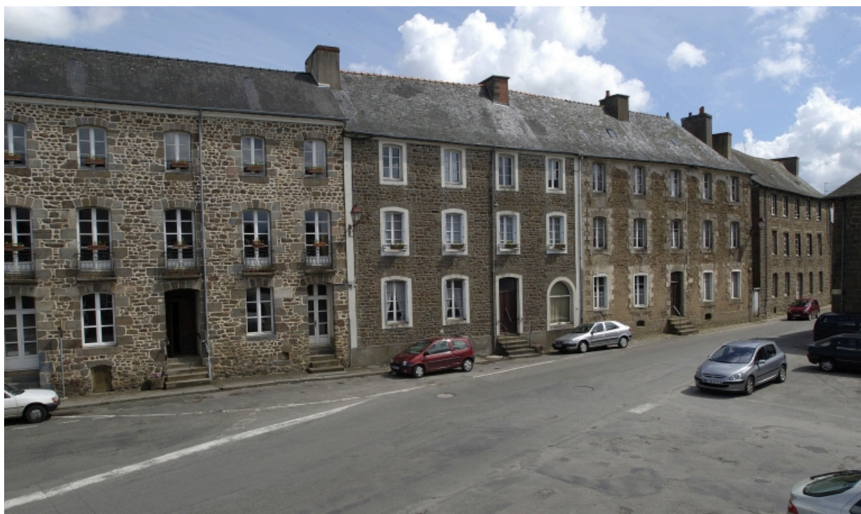
Vue générale nord-ouest