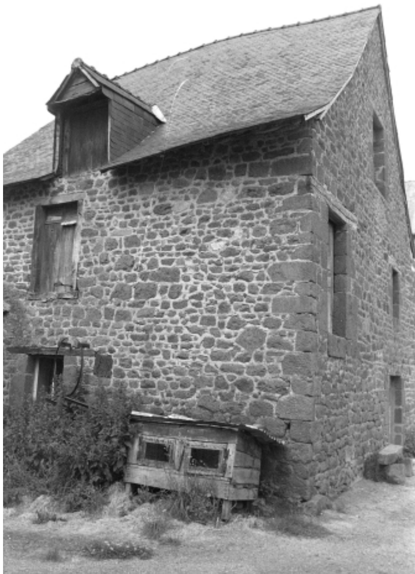
Ancien cellier du couvent