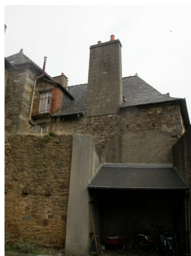
Vue arrière IVR53_20053518429NUCA