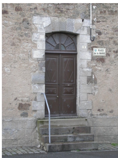
Détail de la porte