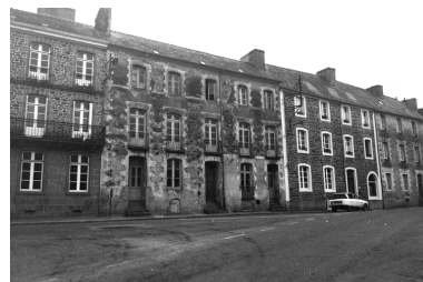
Vue nord-ouest en 1975 IVR53_19753501083Z