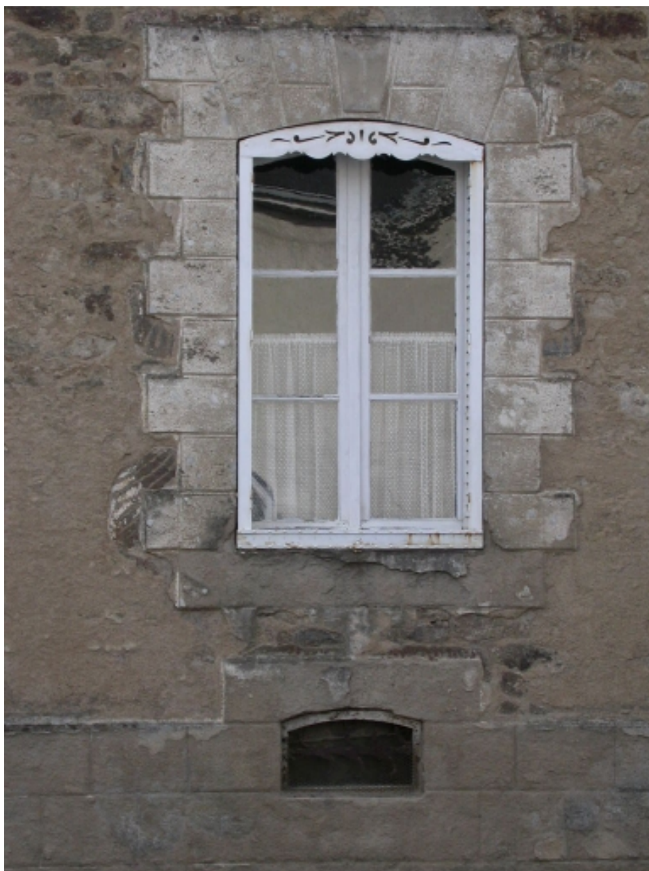
Fenêtre du rez-de-chaussée et soupirail de la cave