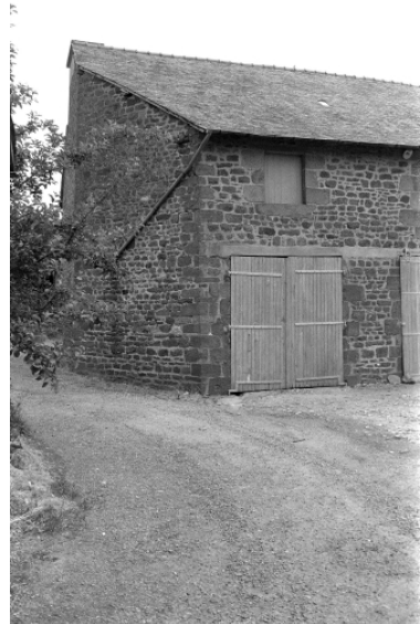
Pressoir et tissanderie de l'ancien couvent IVR53_19753501073Z