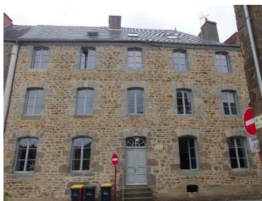
Vue de la façade ouest IVR53_20243532353NUCA