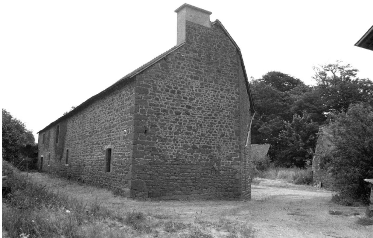
Cellier de l'ancien couvent en 1975