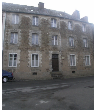
Vue ouest IVR53_20053518286NUCA