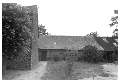
Buanderie IVR53_19753501074Z