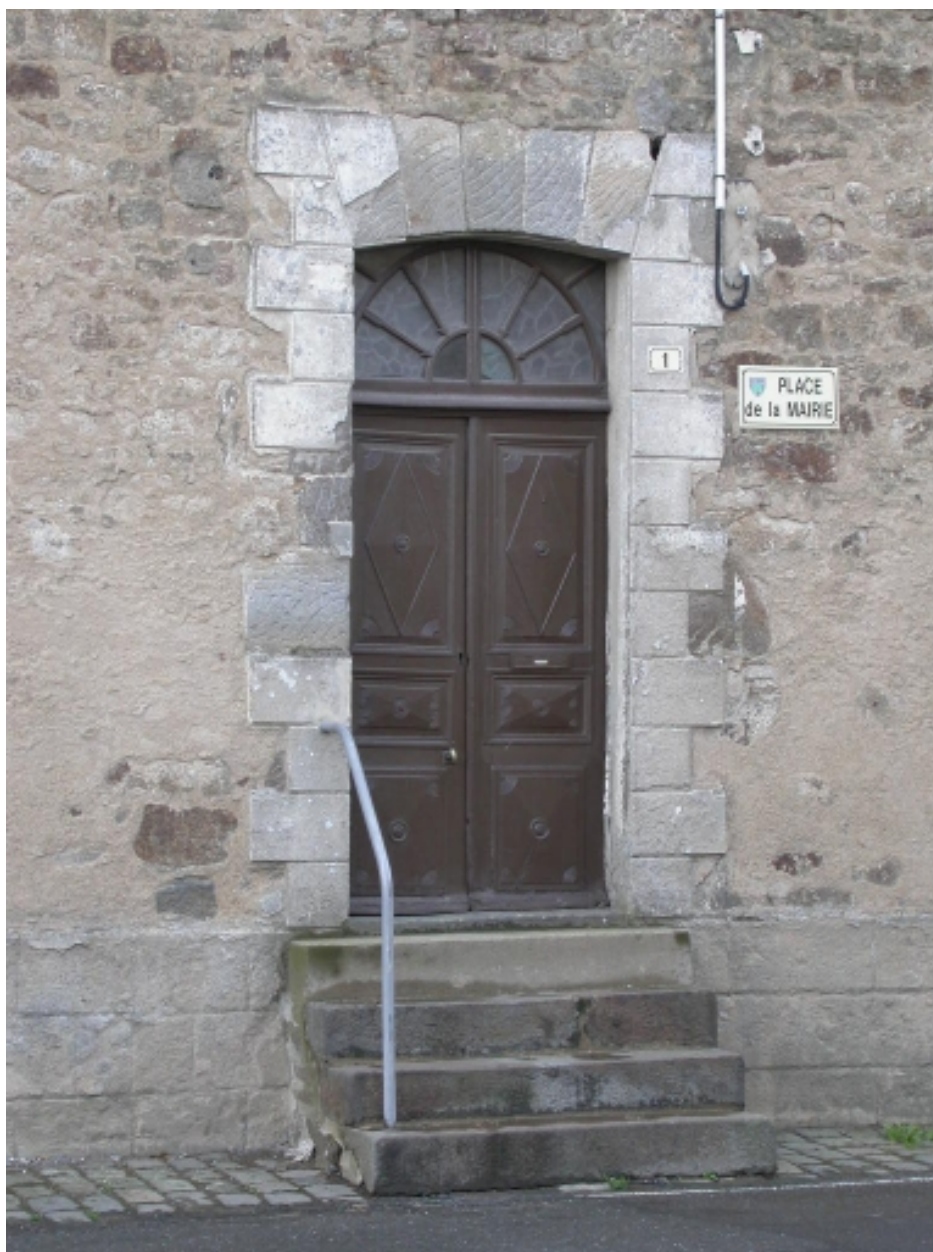
Détail de la porte