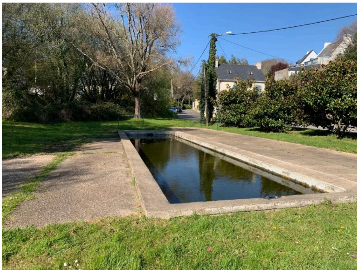
Lavoir Saint-Jacques, au croisement de la rue du Moulin de la Suette et de la rue des Chênes