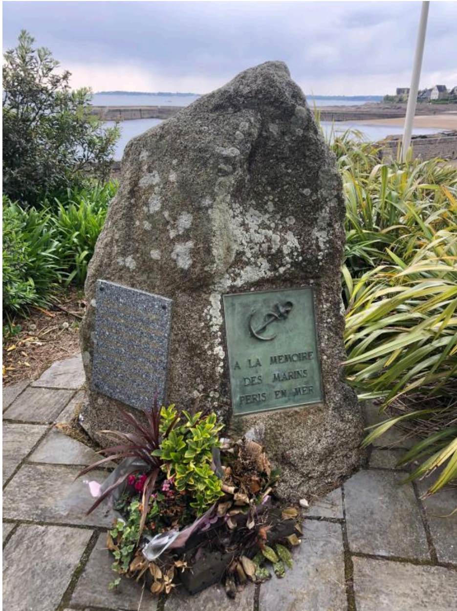
Stèle à la mémoire des marins péris en mer, jardin de la Chapelle Notre-Dame-de-Bon-Secours, 5 quai de La Croix