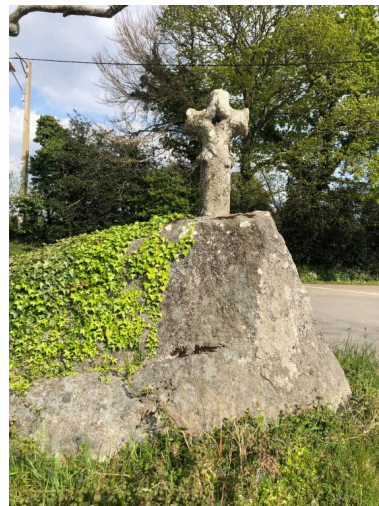
Croix de Kerrichard, rue de Kerviniou IVR53_20232905715NUCA