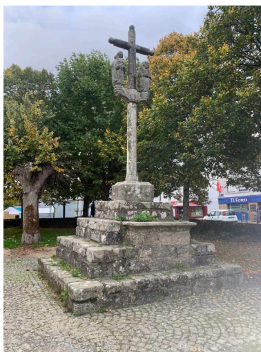
Croix monumentale sur le parvis de l'église Notre- Dame-De-Lorette, Lanriec IVR53_20232905717NUCA