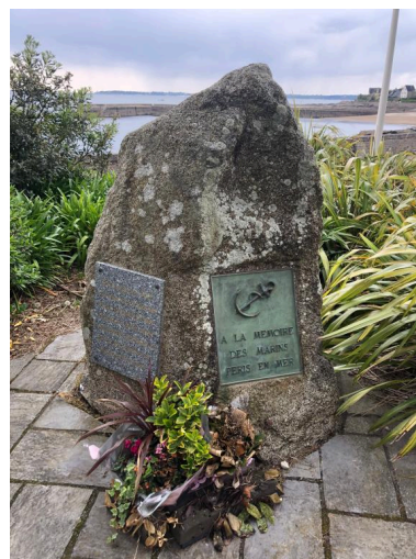
Stèle à la mémoire des marins péris en mer, jardin de la Chapelle Notre-Dame-de-Bon- Secours, 5 quai de La Croix IVR53_20232905706NUCA