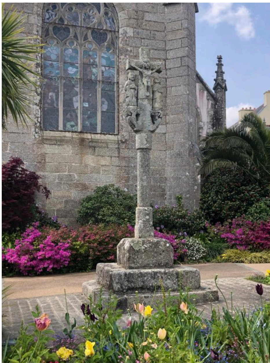
Calvaire, place de l'Eglise, Beuzec