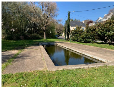
Lavoir Saint-Jacques, au croisement de la rue du Moulin de la Suette et de la rue des Chênes IVR53_20232905714NUCA