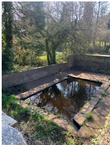
Lavoir Pont Pellan, au croisement du chemin de Kerampennou et de la rue de Stang Kuzet