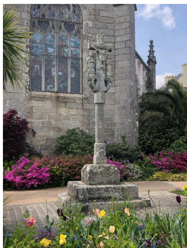
Calvaire, place de l'Église, Beuzec