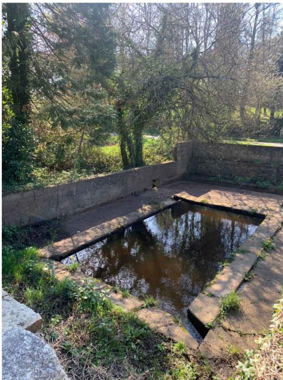
Lavoir Pont Pellan, au croisement du chemin de Kerampennou et de la rue de Stang Kuzet