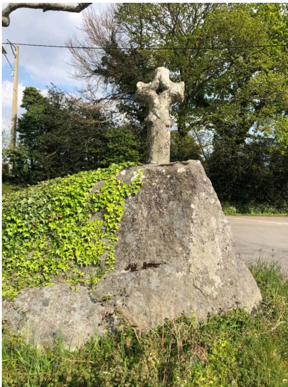
Croix de Kerrichard, rue de Kerviniou