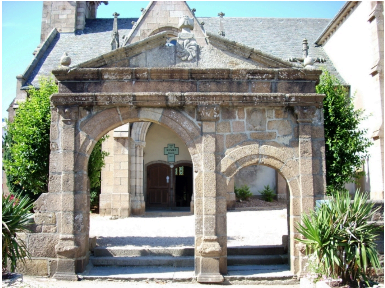
Carantec, église paroissiale Saint-Carantec : porte monumentale de l'enclos, détail