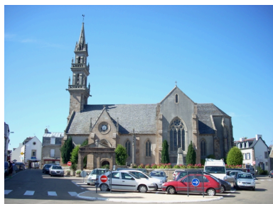
Carantec, église paroissiale Saint-Carantec : élévation sud IVR53_20082906587NUCA