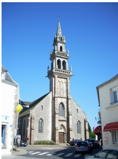
Carantec, église paroissiale Saint- Carantec : vue générale ouest IVR53_20082906588NUCA