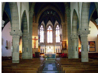
Carantec, église paroissiale Saint-Carantec : vue axiale est