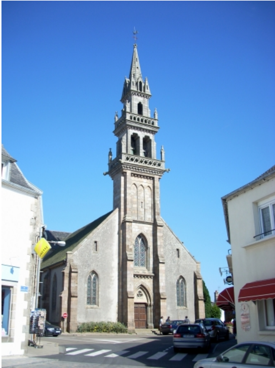
Carantec, église paroissiale Saint-Carantec : vue générale ouest