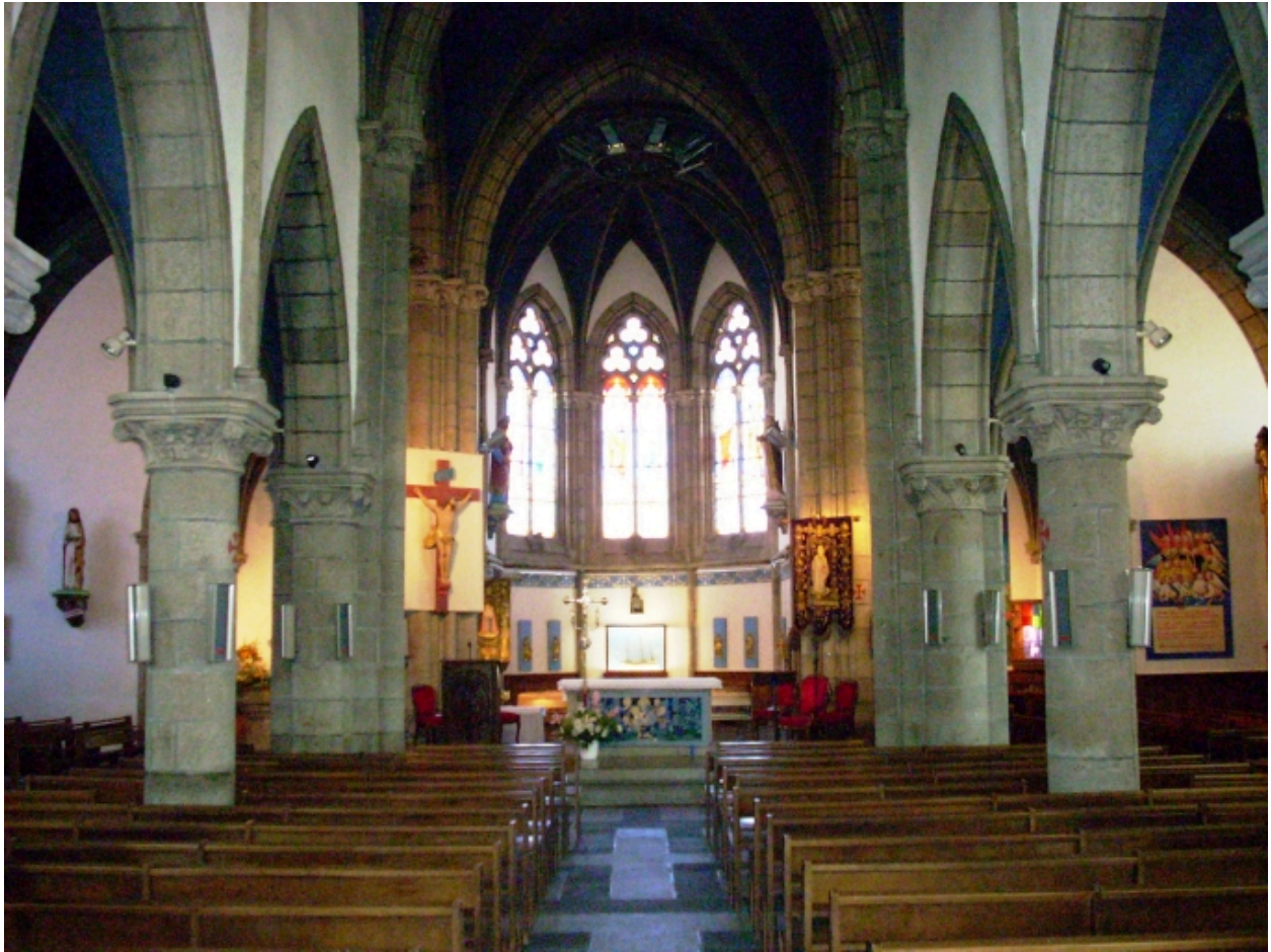
Carantec, église paroissiale Saint-Carantec : vue axiale est