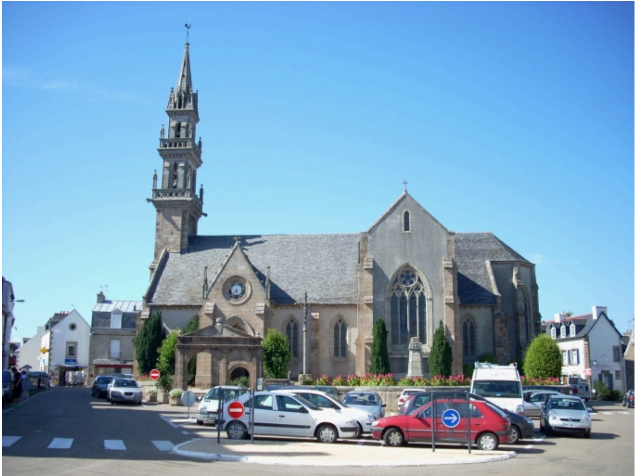
Carantec, église paroissiale Saint-Carantec : élévation sud