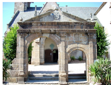
Carantec, église paroissiale Saint-Carantec : porte monumentale de l'enclos, détail IVR53_20082906589NUCA