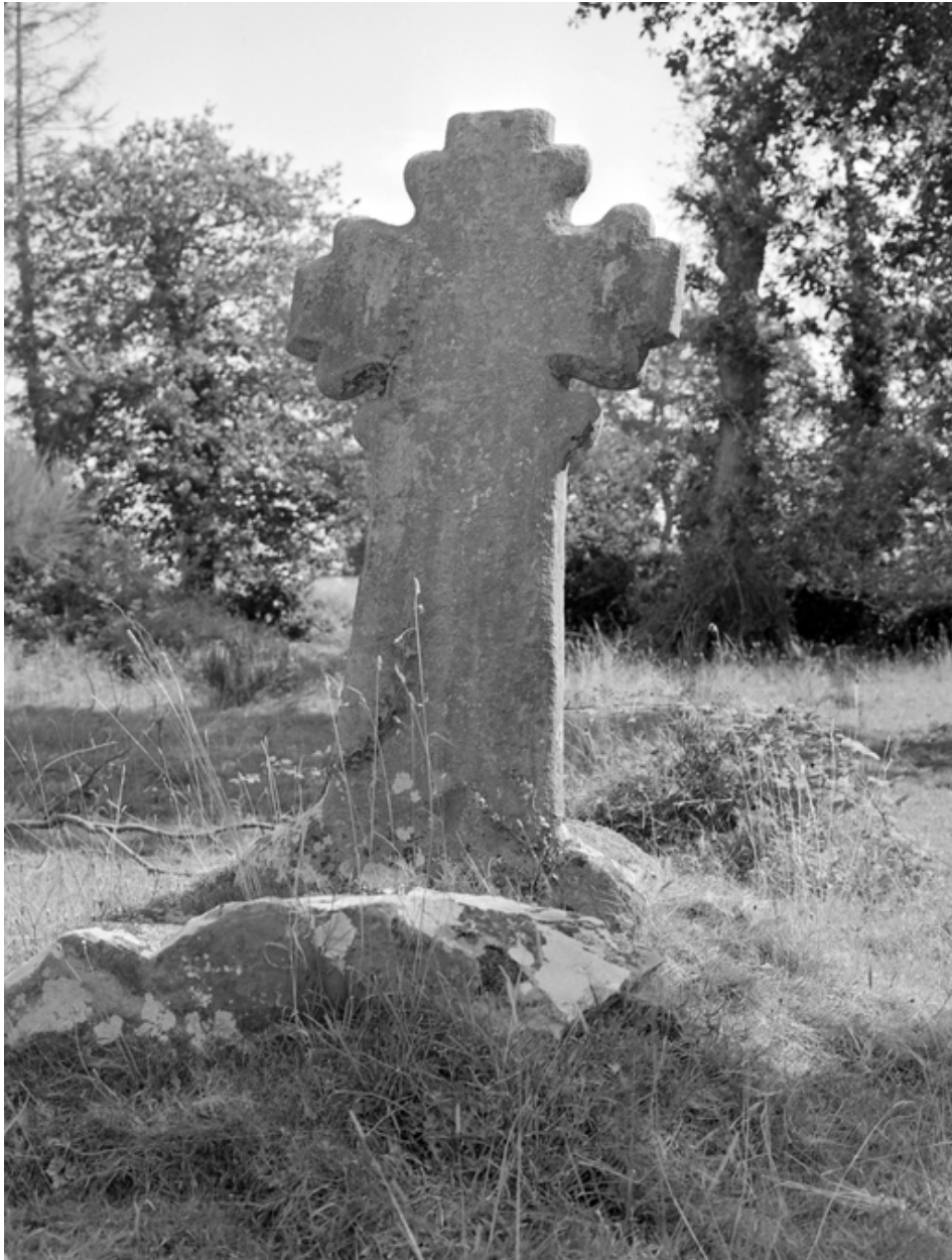
Croix de chemin.