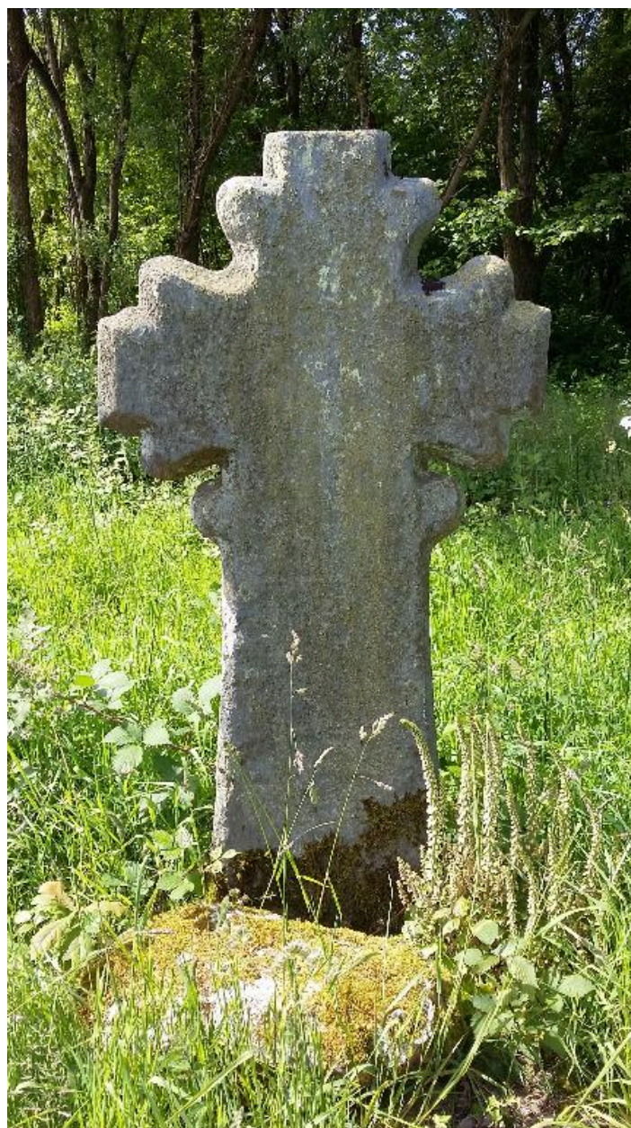
Vue d'ensemble (état en 2016)