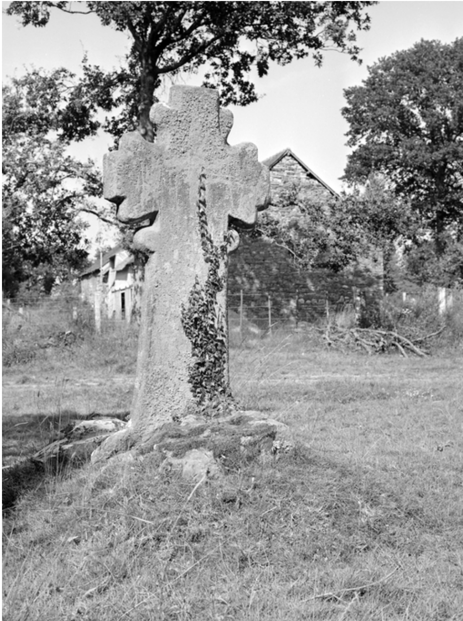
Croix de chemin.