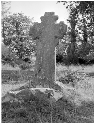
Croix de chemin. IVR53_19775600565X