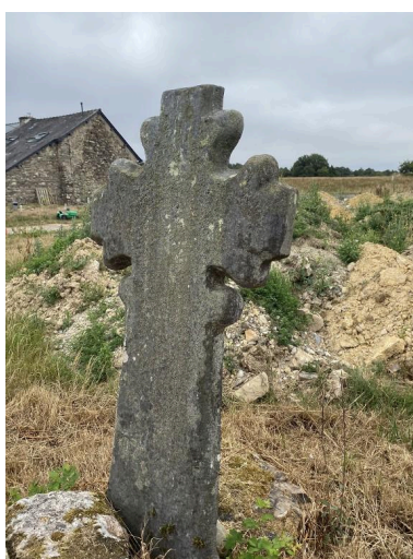
Vue nord-ouest IVR53_20255610971NUCA