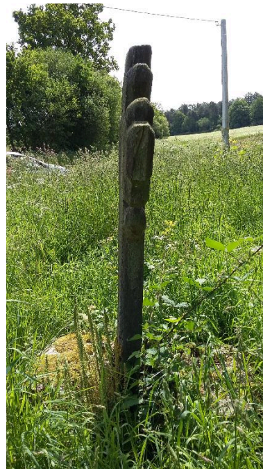
Face ouest IVR53_20165605430NUCA