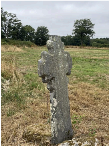
Vue nord-est IVR53_20255610970NUCA