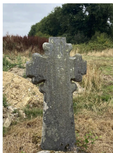
Vue nord IVR53_20255610969NUCA