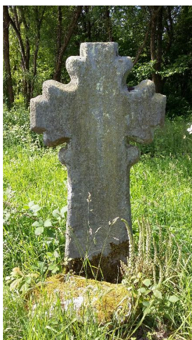
Vue d'ensemble (état en 2016) IVR53_20165605431NUCA