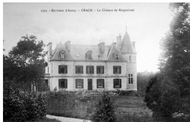
Façade principale IVR53_20035604268NUCB