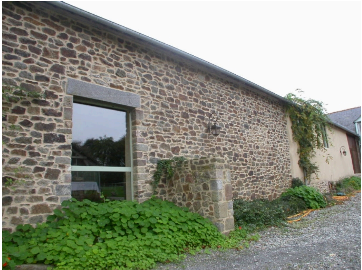
Les étables et écuries