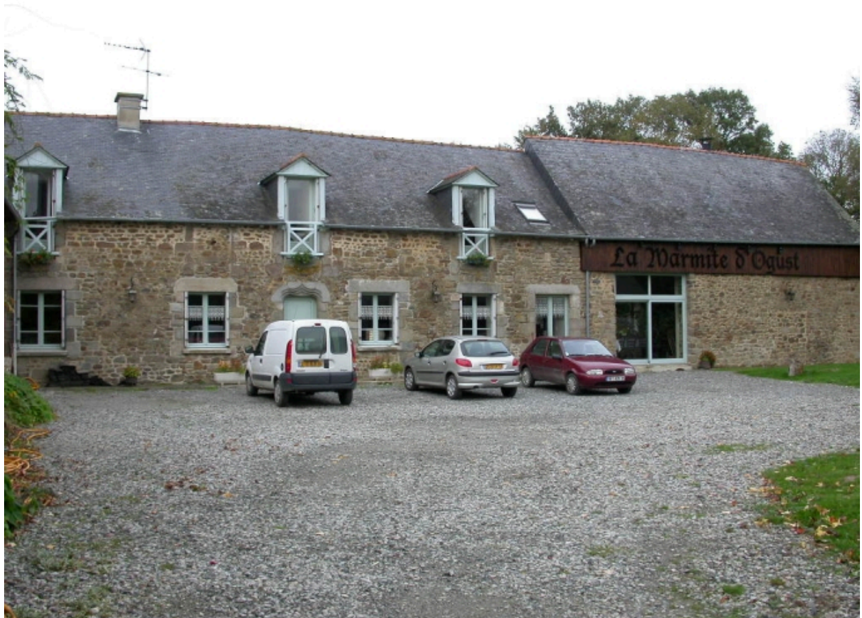
Vue générale sud