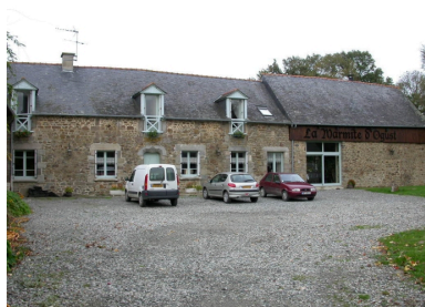
Vue générale sud IVR53_20053519179NUCA