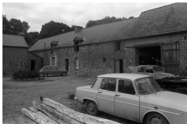
Vue d'ensemble en 1975