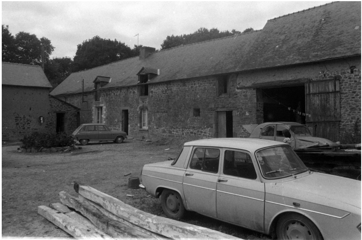
Vue d'ensemble en 1975