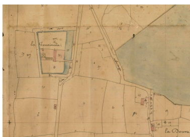
Le bâtiment sur le cadastre de 1835