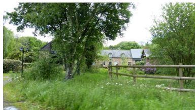
Vue d'ensemble sud IVR53_20243531392NUCA