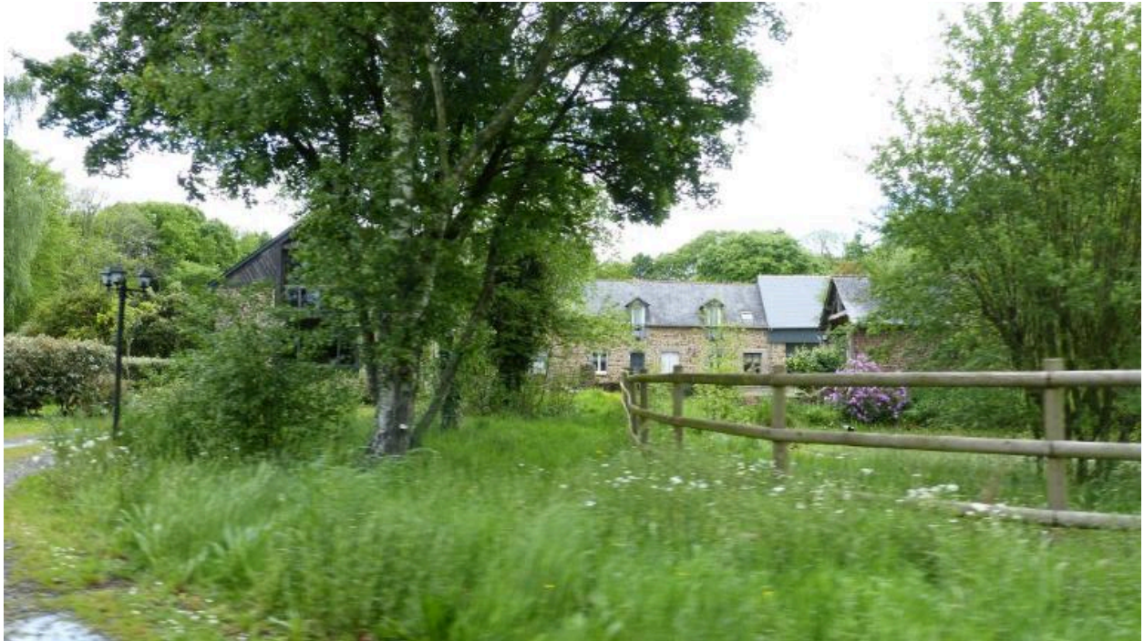
Vue d'ensemble sud