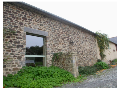
Les étables et écuries IVR53_20053519182NUCA