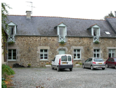
Le logis IVR53_20053519180NUCA