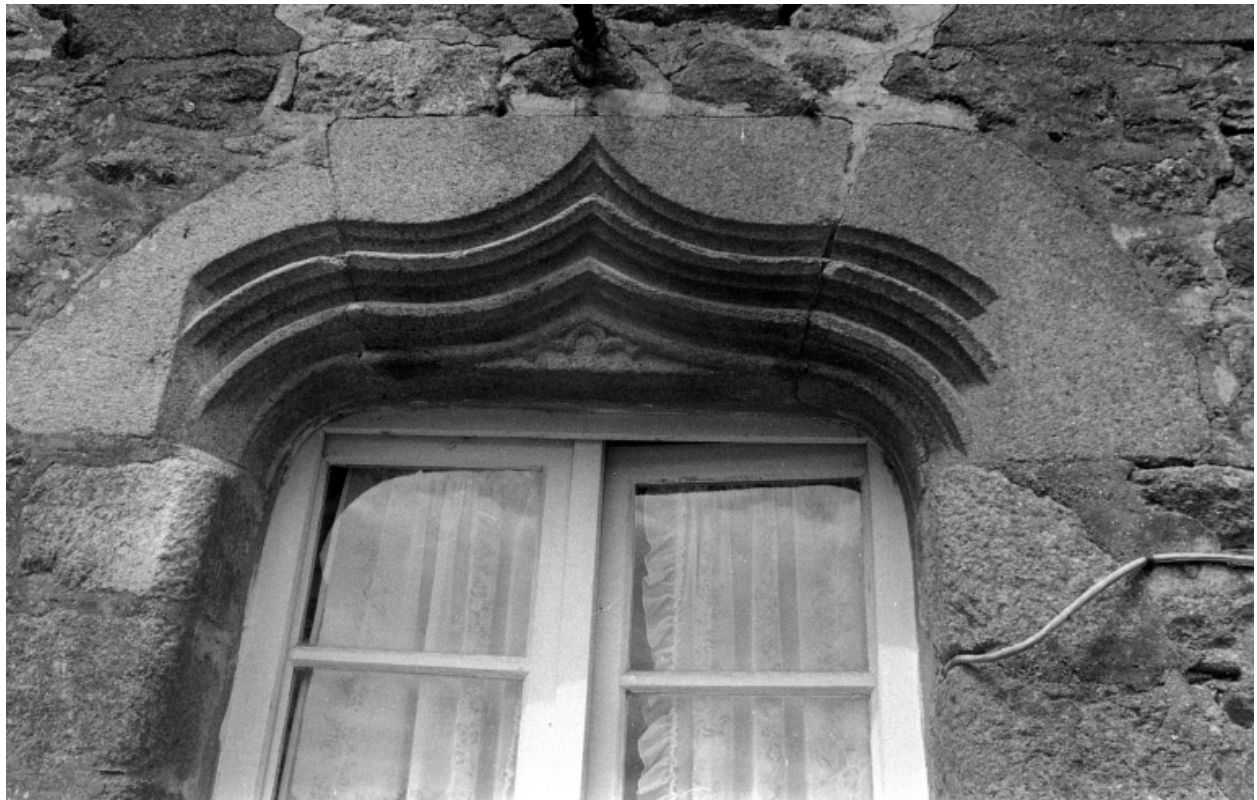
Détail de la fenêtre à accolade