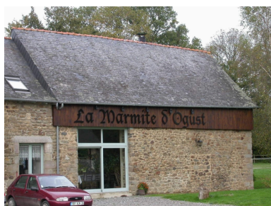
La grange