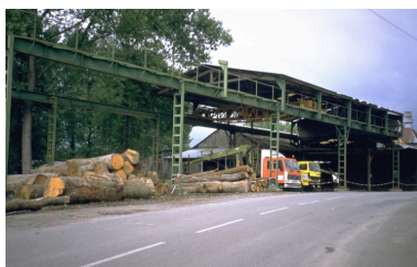
Vue générale nord-est : atelier et pont roulant. IVR53_19993502742ZA