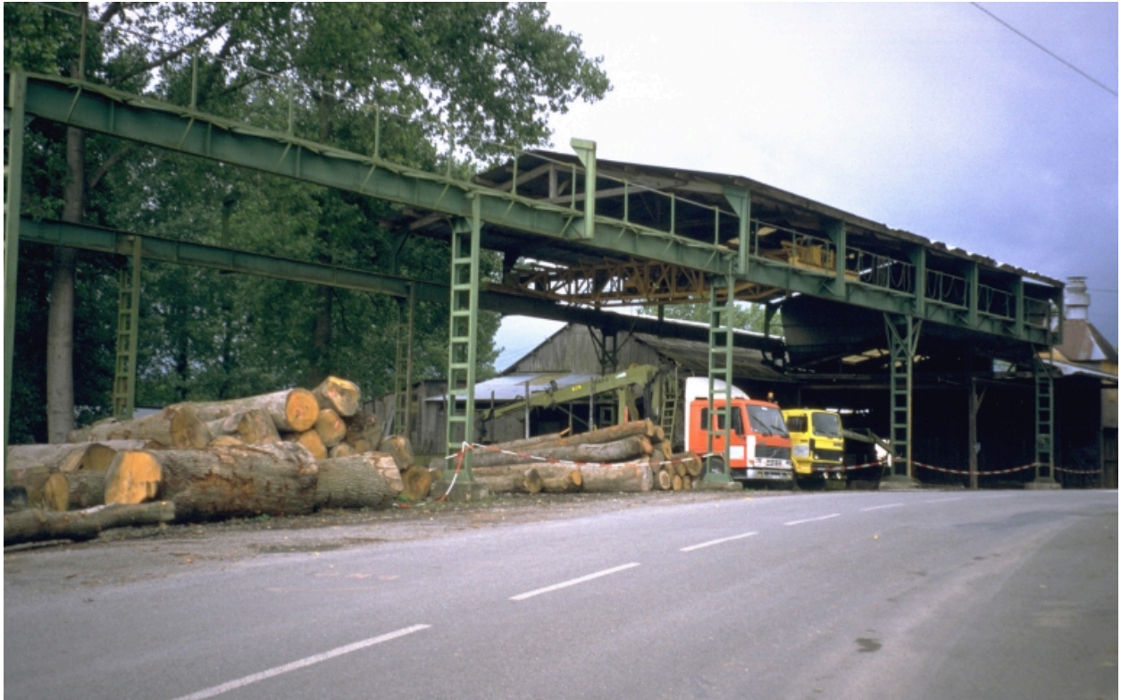
Vue générale nord-est : atelier et pont roulant.