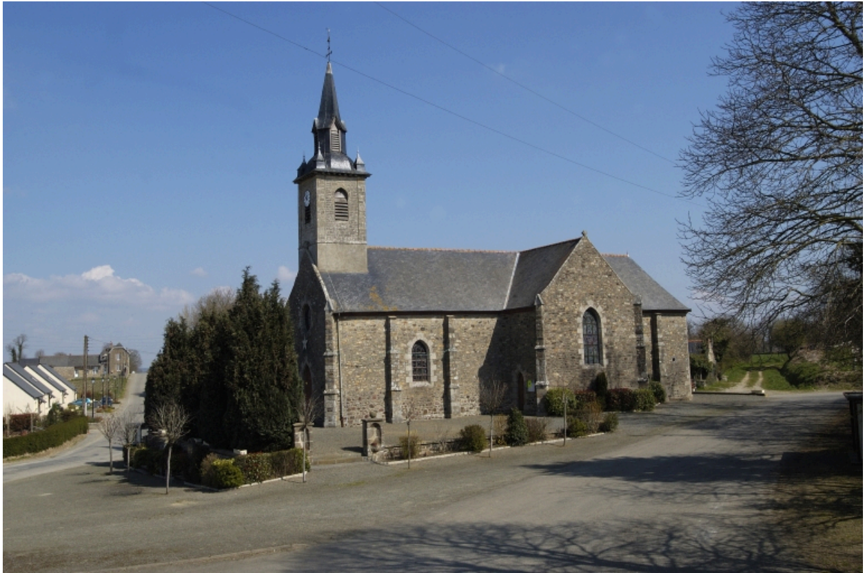
Vue générale, façade Sud