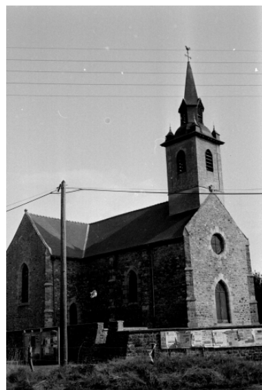
Etat en 1970 IVR53_19703501843NUC