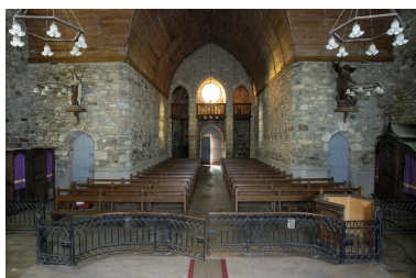
Vue intérieure prise du chœur vers la nef IVR53_20063500103NUCA