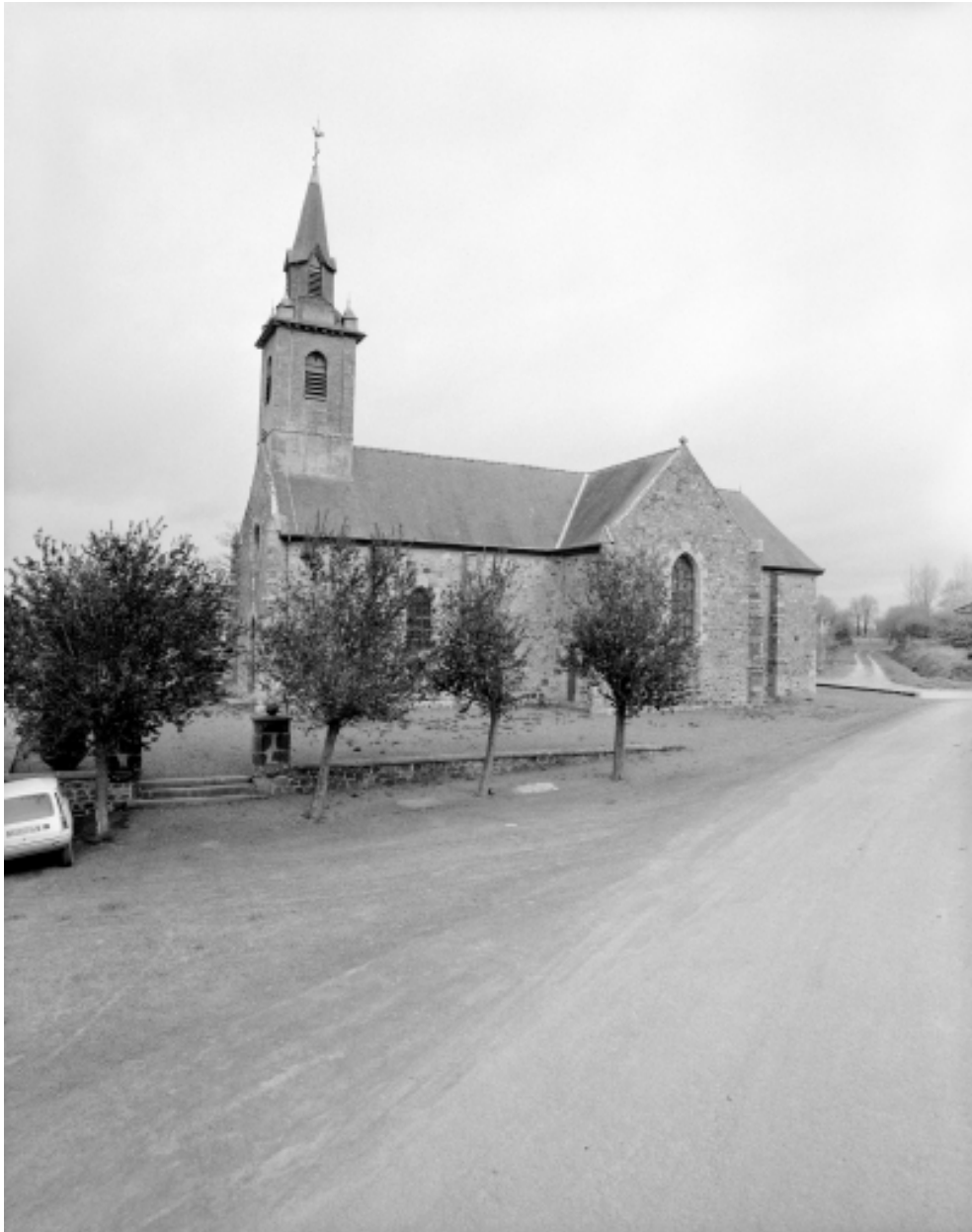
Etat en 1994, élévation Sud : vue générale