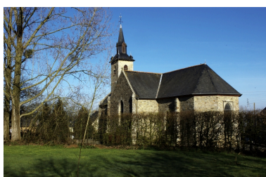
Vue Sud-Est IVR53_20063500600NUCA