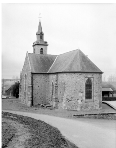
Etat en 1994, élévation Est : vue générale IVR53_19943500723X