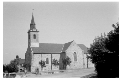
Etat en 1970 IVR53_19703501842NUC