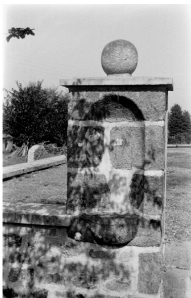
Etat en 1970, enclos avec niche et bénitier IVR53_19703501845NUC