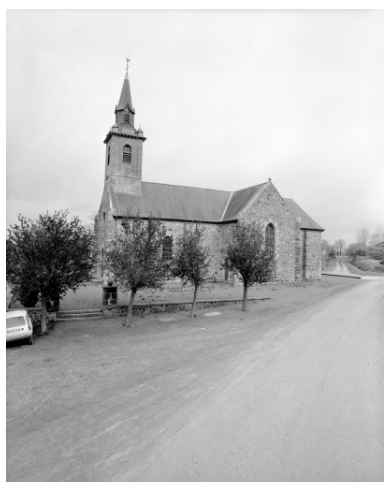
Etat en 1994, élévation Sud : vue générale