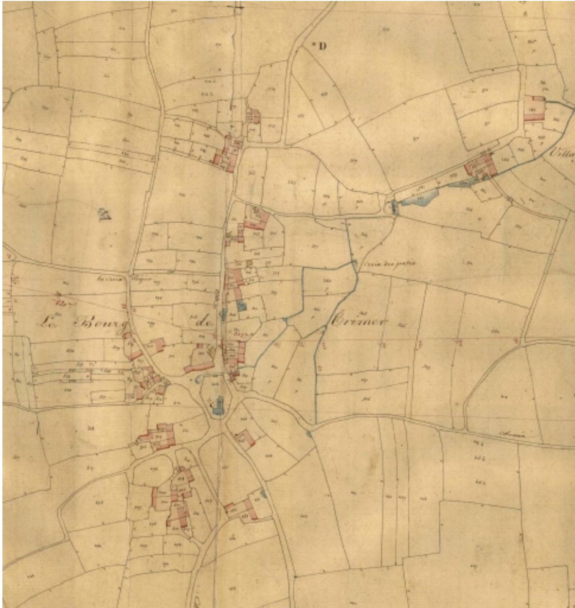
Extrait du cadastre de 1834, le bourg