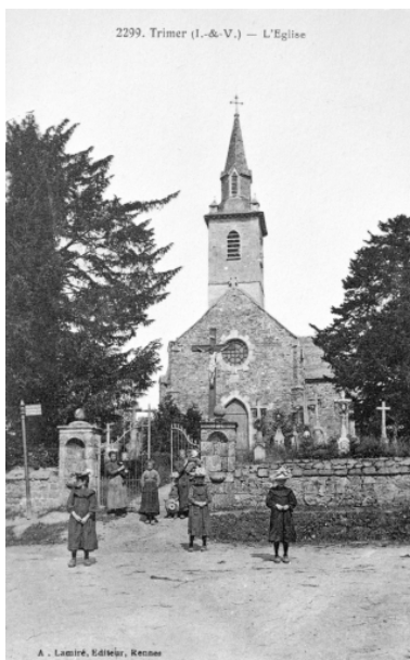
Elévation Ouest : vue générale (Carte postale ancienne, AD35 : 6Fi), IVR53_19933500936XB