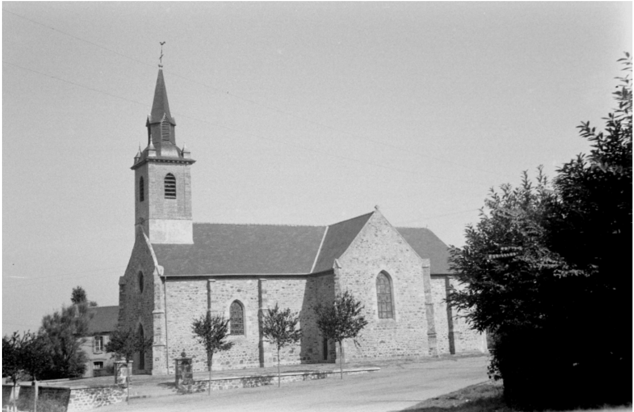
Etat en 1970