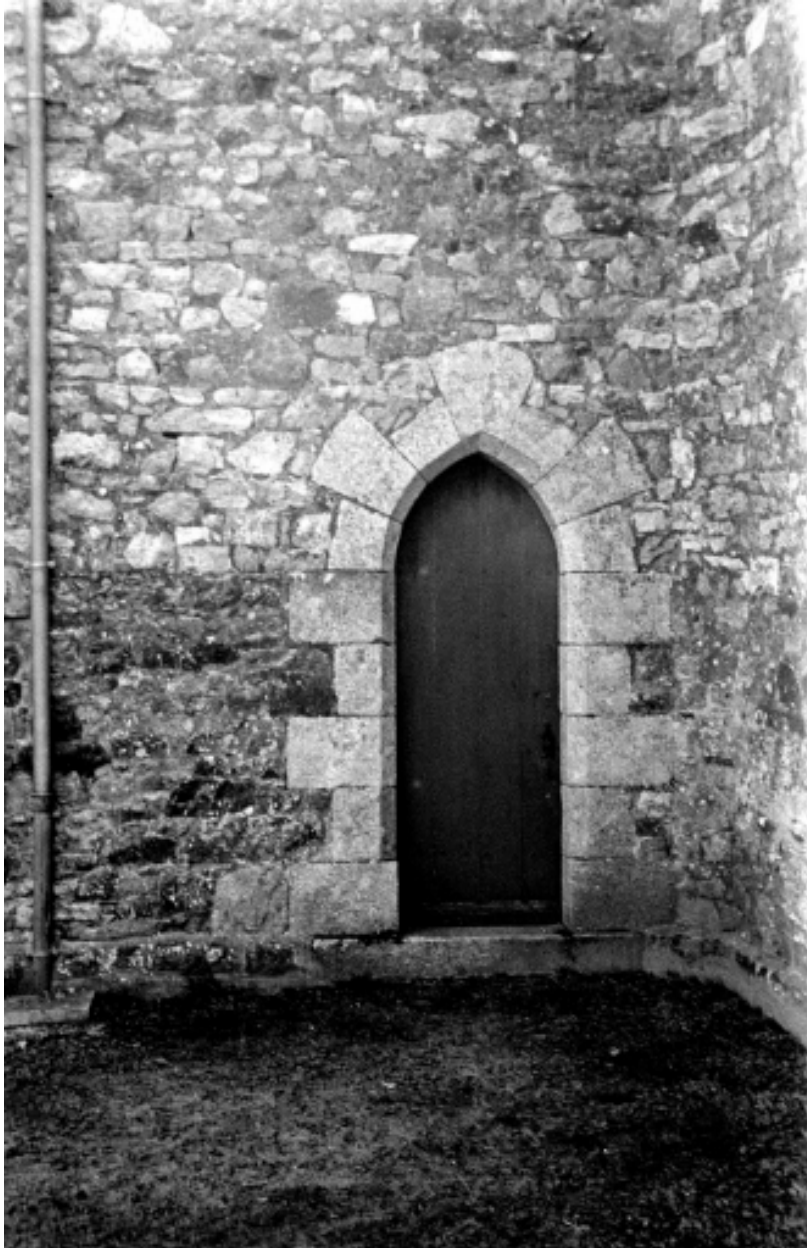
Etat en 1970, entrée latérale