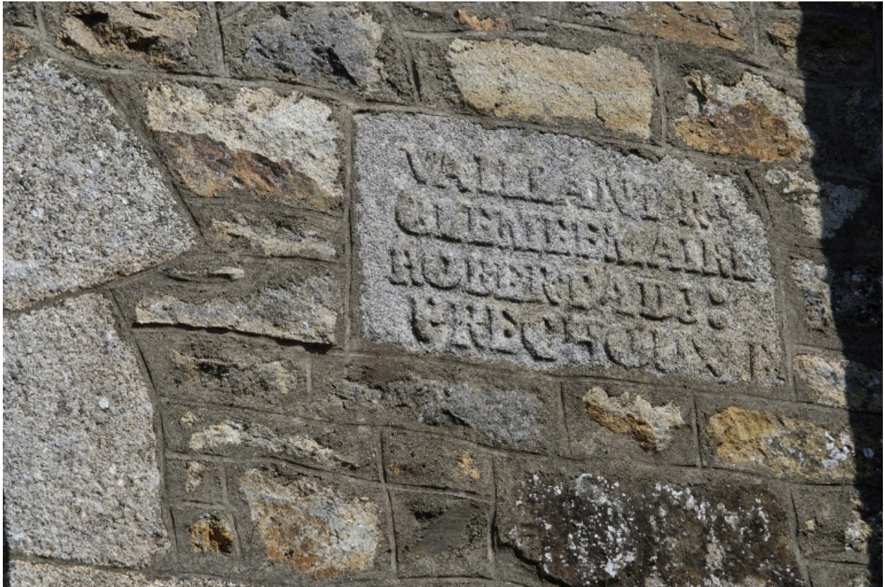
Façade Sud, détail, inscription