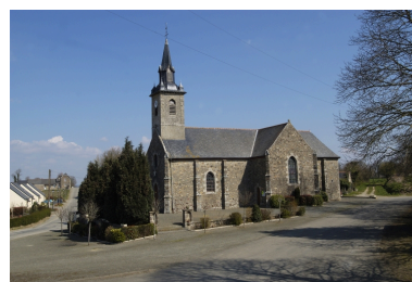
Vue générale, façade Sud IVR53_20063500541NUCA