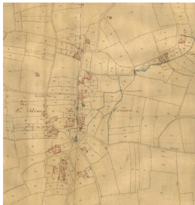
Extrait du cadastre de 1834, le bourg