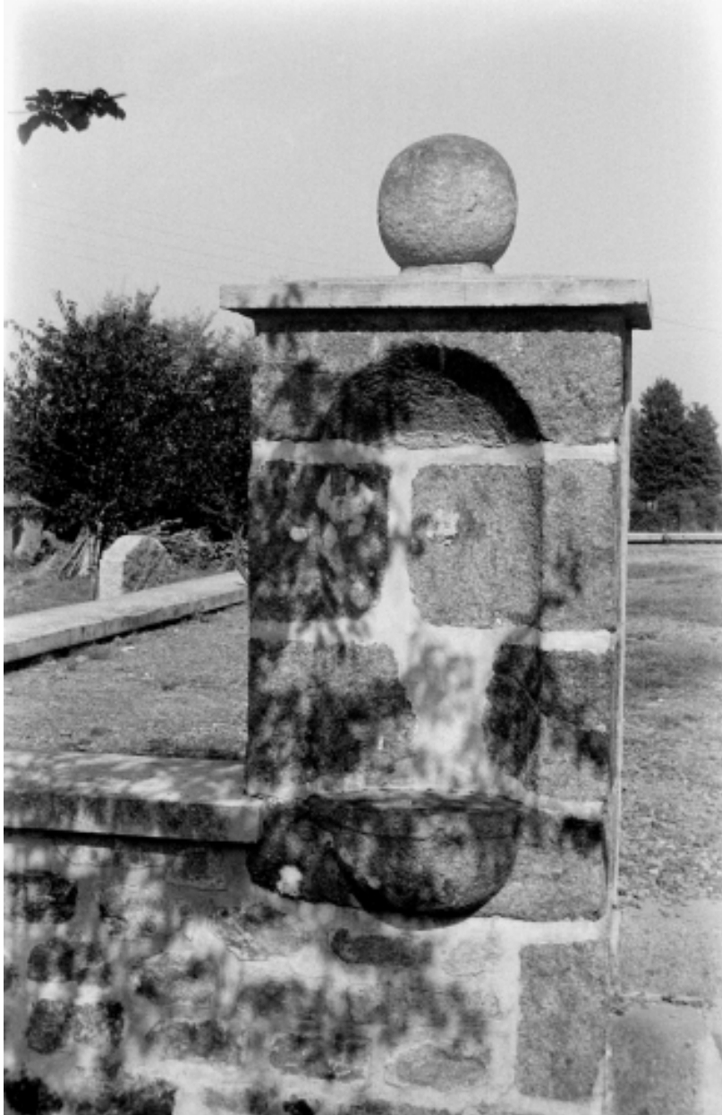
Etat en 1970, enclos avec niche et bénitier