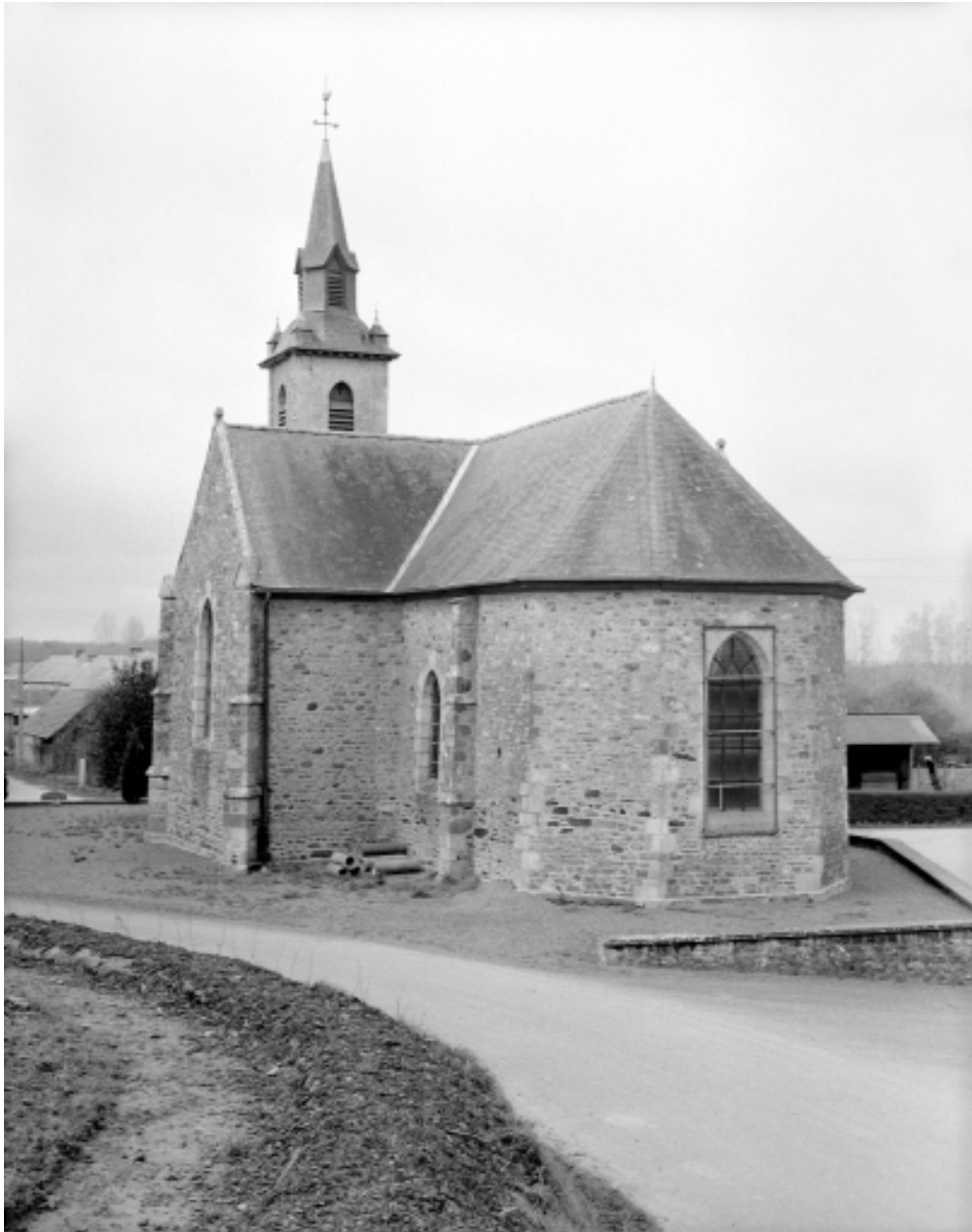
Etat en 1994, élévation Est : vue générale