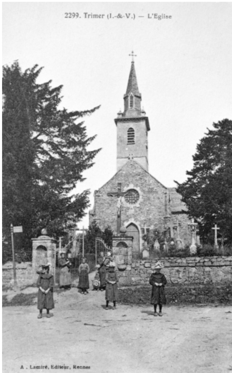
Elévation Ouest : vue générale (Carte postale ancienne, AD35 : 6Fi)