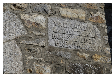
Façade Sud, détail, inscription