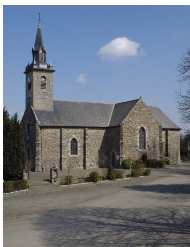
Façade Sud