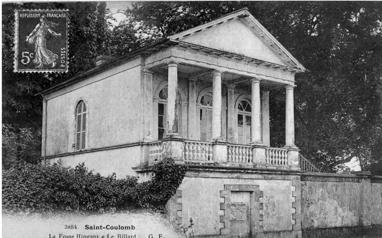
Le 'tempietto' au début du 20e siècle