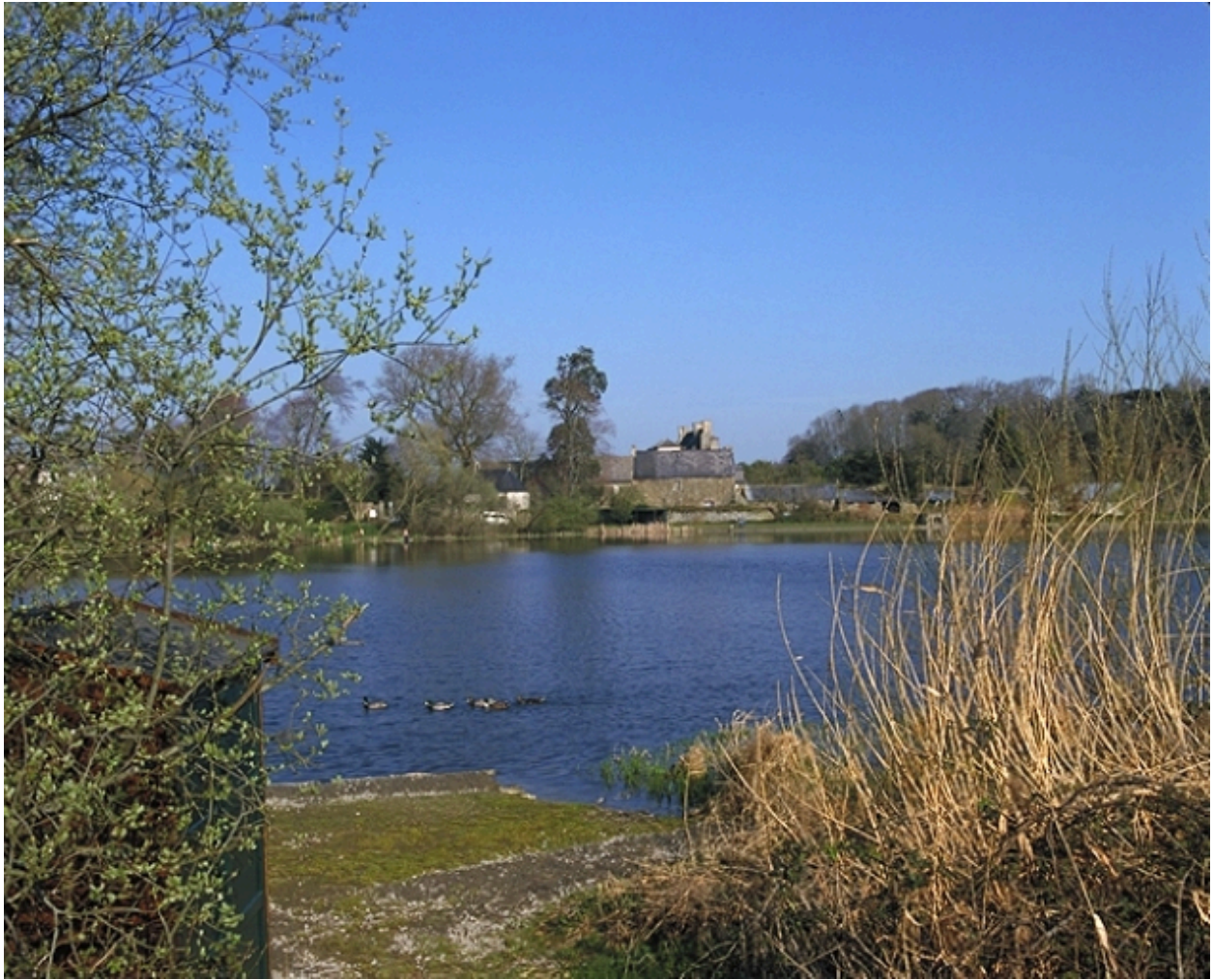
La malouinière aux abords de l'étang de Sainte-Suzanne