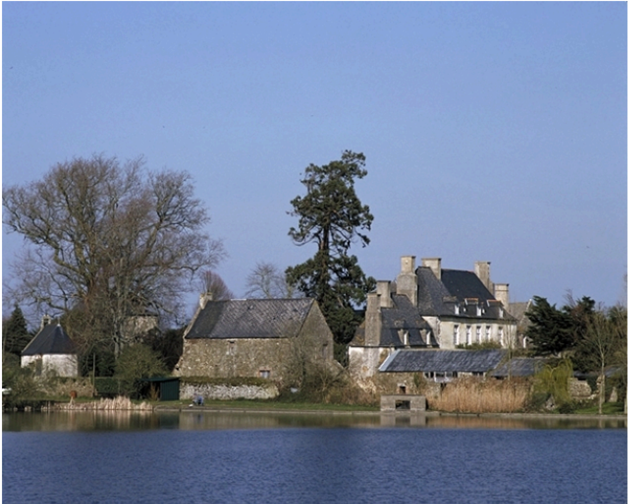
Vue de situation sud-ouest