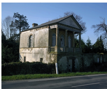
Le tempietto : vue générale nord-est IVR53_20003500795XA