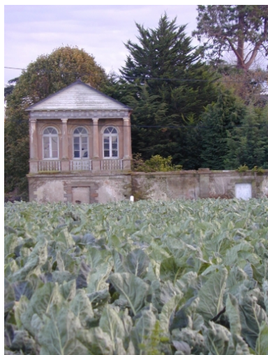
Le tempietto : vue générale nord