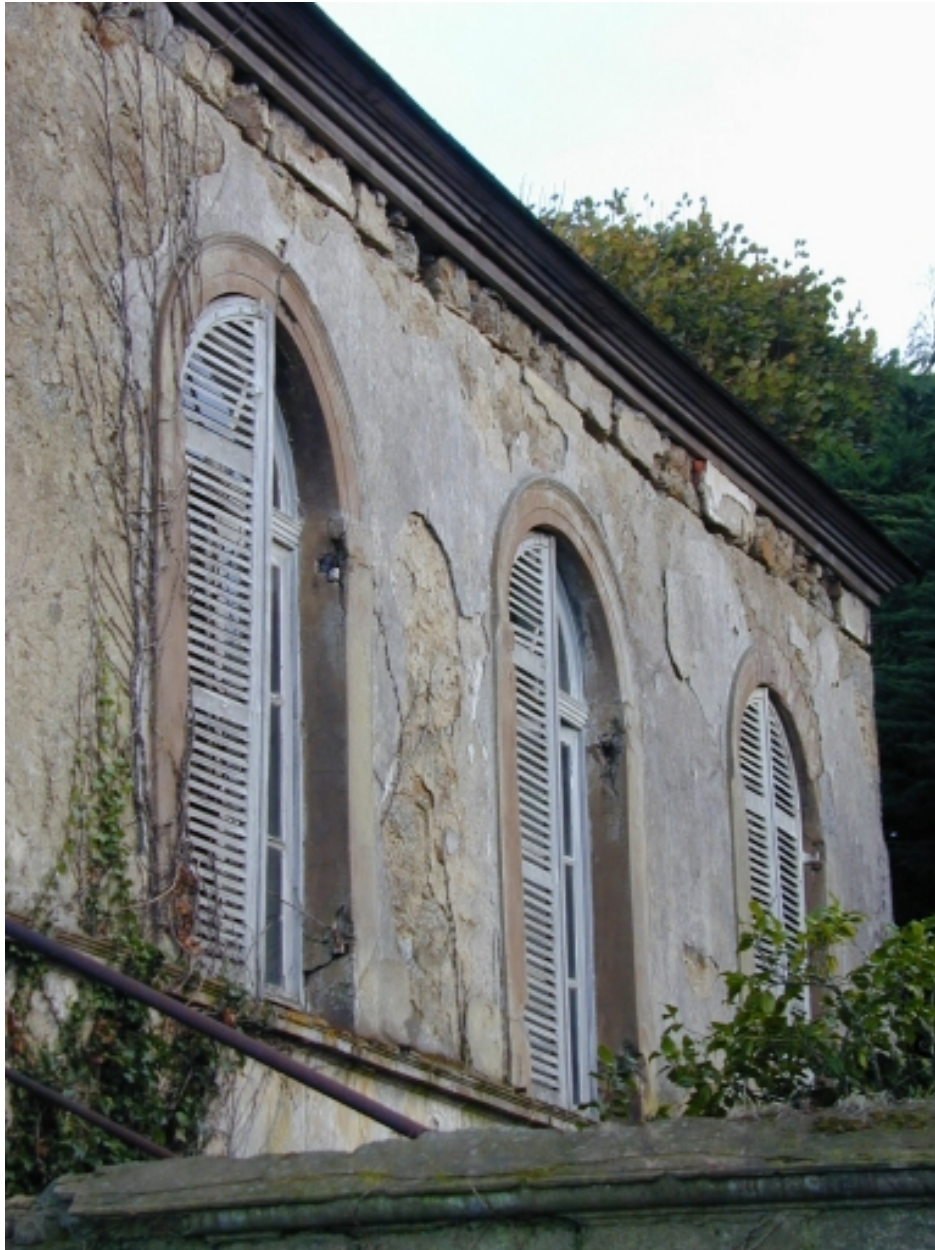
Le tempietto : détail, mur ouest