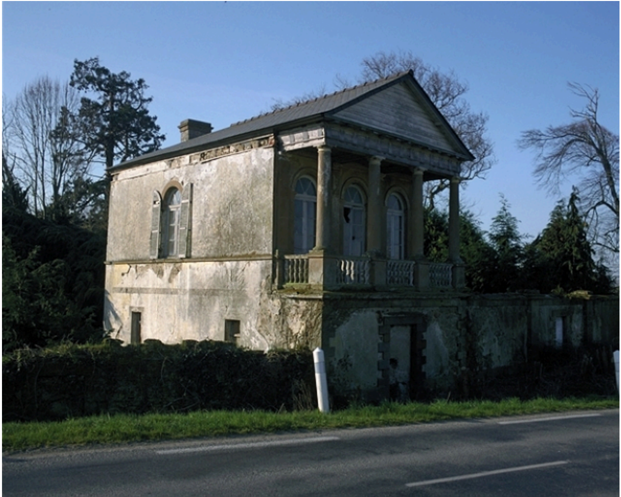
Le tempietto : vue générale nord-est