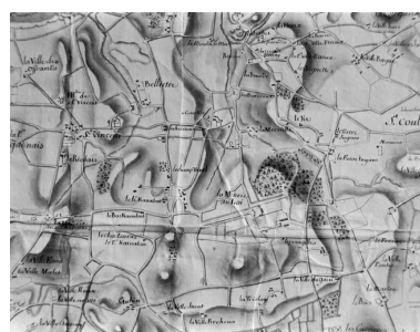
'La Fosse Hingant' sur une carte dressée vers 1780 IVR53_19843500168X