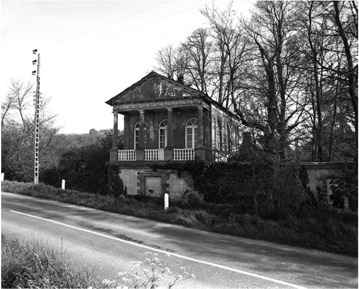
Le tempietto : vue générale nord-ouest