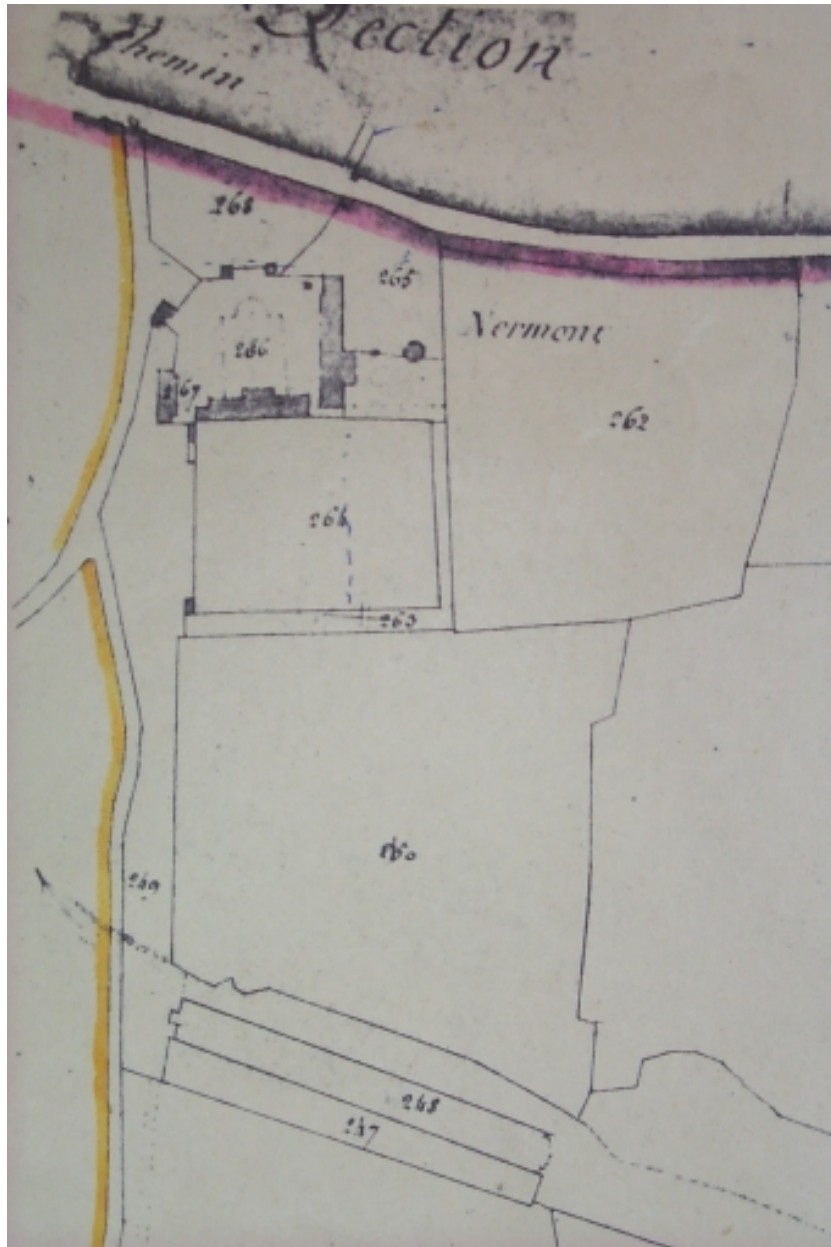
La Fosse Hingant appelée Nermont sur le cadastre de 1828