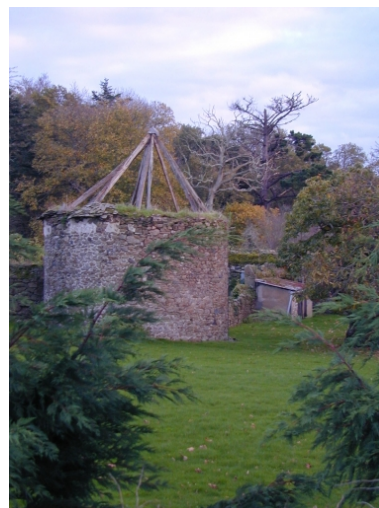
Le pigeonnier : vue générale nord