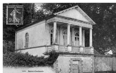
Le 'tempietto' au début du 20e siècle