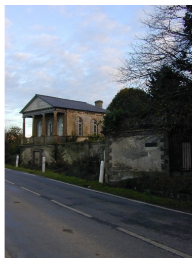
Le tempietto : vue générale nord-ouest