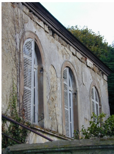
Le tempietto : détail, mur ouest IVR53_19993507176NUCA