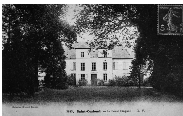
La Fosse Hingant au début du 20e siècle, IVR53_19883500592X