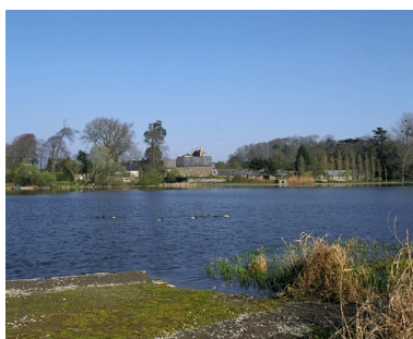
La malouinière aux abords de l'étang de Sainte-Suzanne