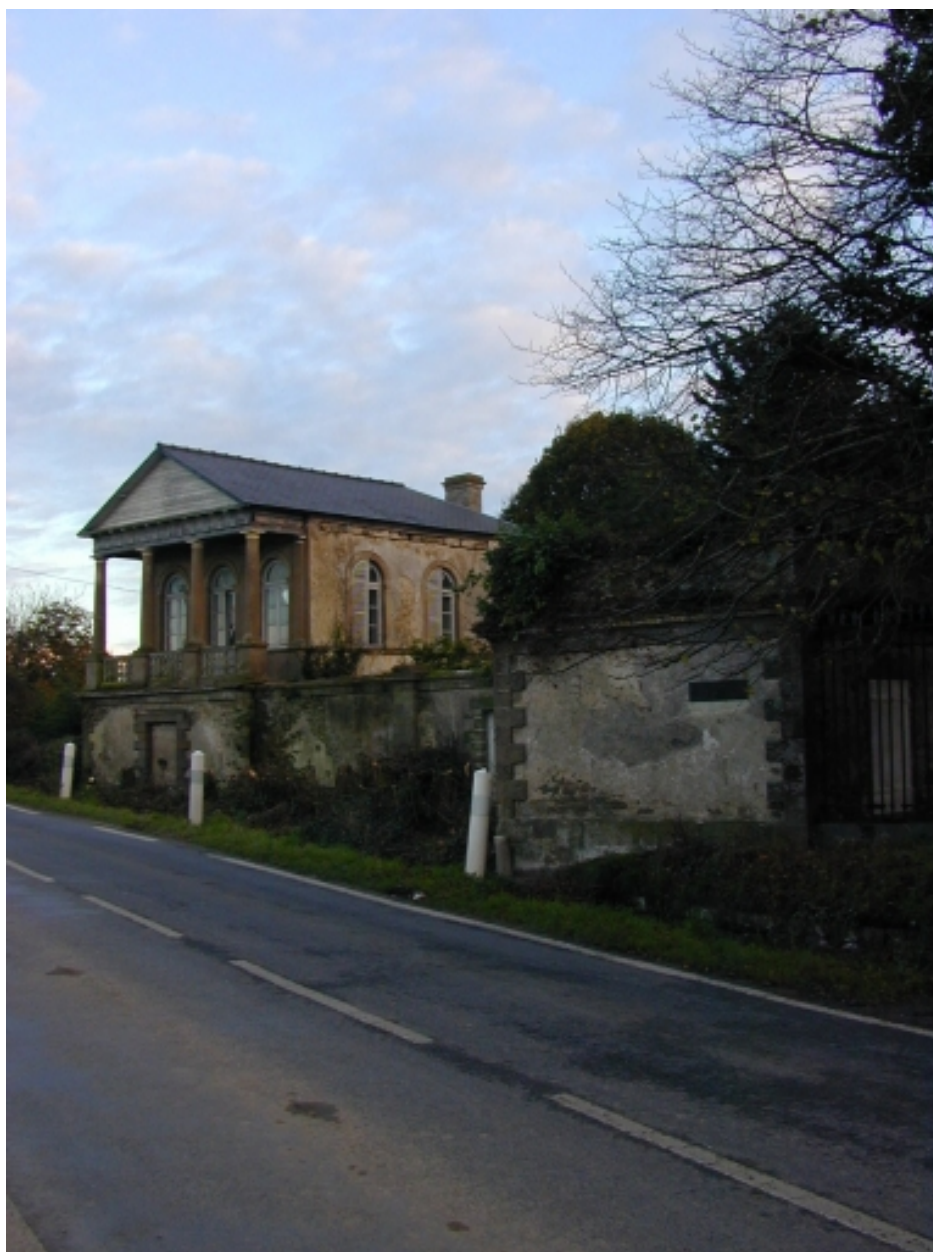
Le tempietto : vue générale nord-ouest