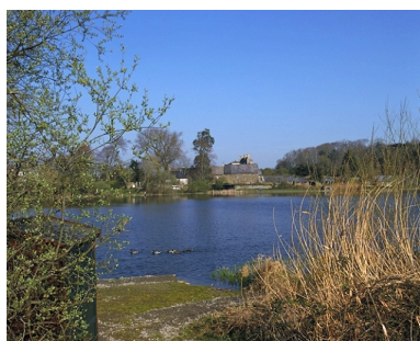
La malouinière aux abords de l'étang de Sainte-Suzanne