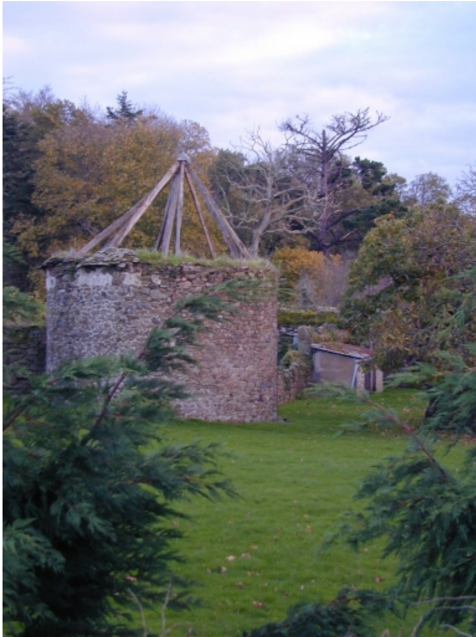
Le pigeonnier : vue générale nord