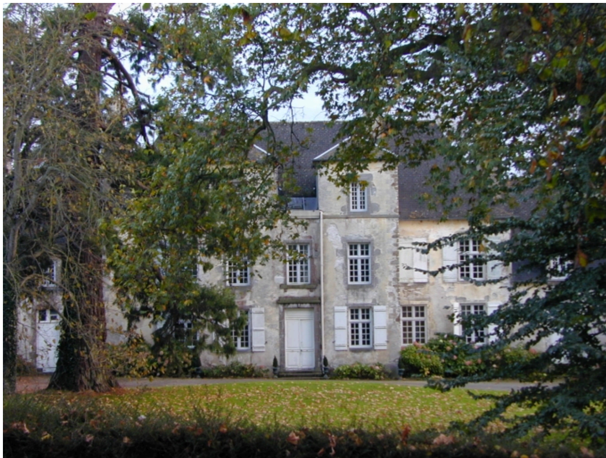
Vue partielle nord