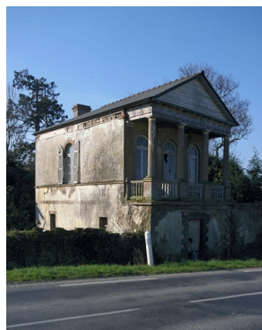
Le tempietto : vue générale nord-est IVR53_20003500796XA