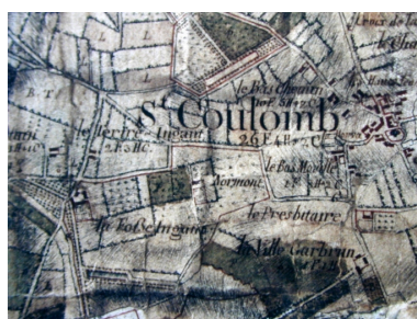
'La Fosse Hingant' sur le Relevé des Côtes de France de 1775 IVR53_19993507110NUC