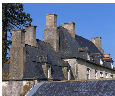
Les souches de cheminée : vue générale ouest IVR53_20003500797XA