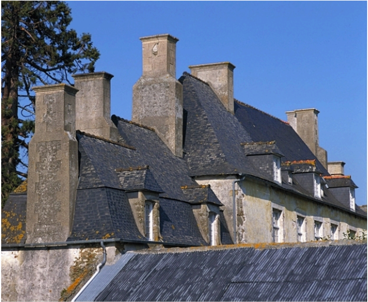
Les souches de cheminée : vue générale ouest