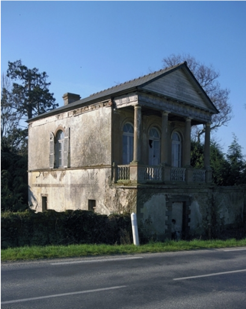
Le tempietto : vue générale nord-est