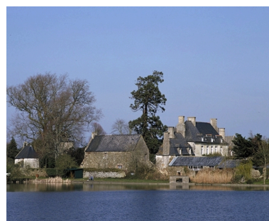
Vue de situation sud-ouest IVR53_20003500800XA