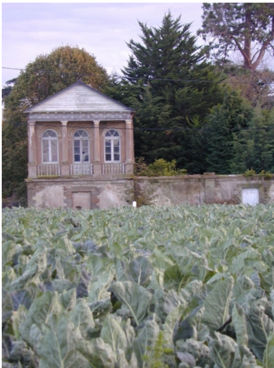
Le tempietto : vue générale nord