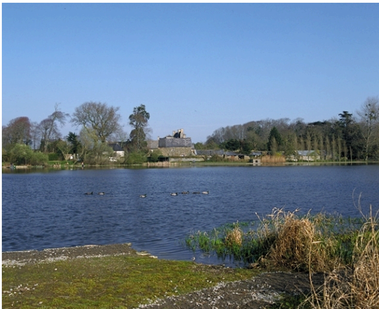
La malouinière aux abords de l'étang de Sainte-Suzanne