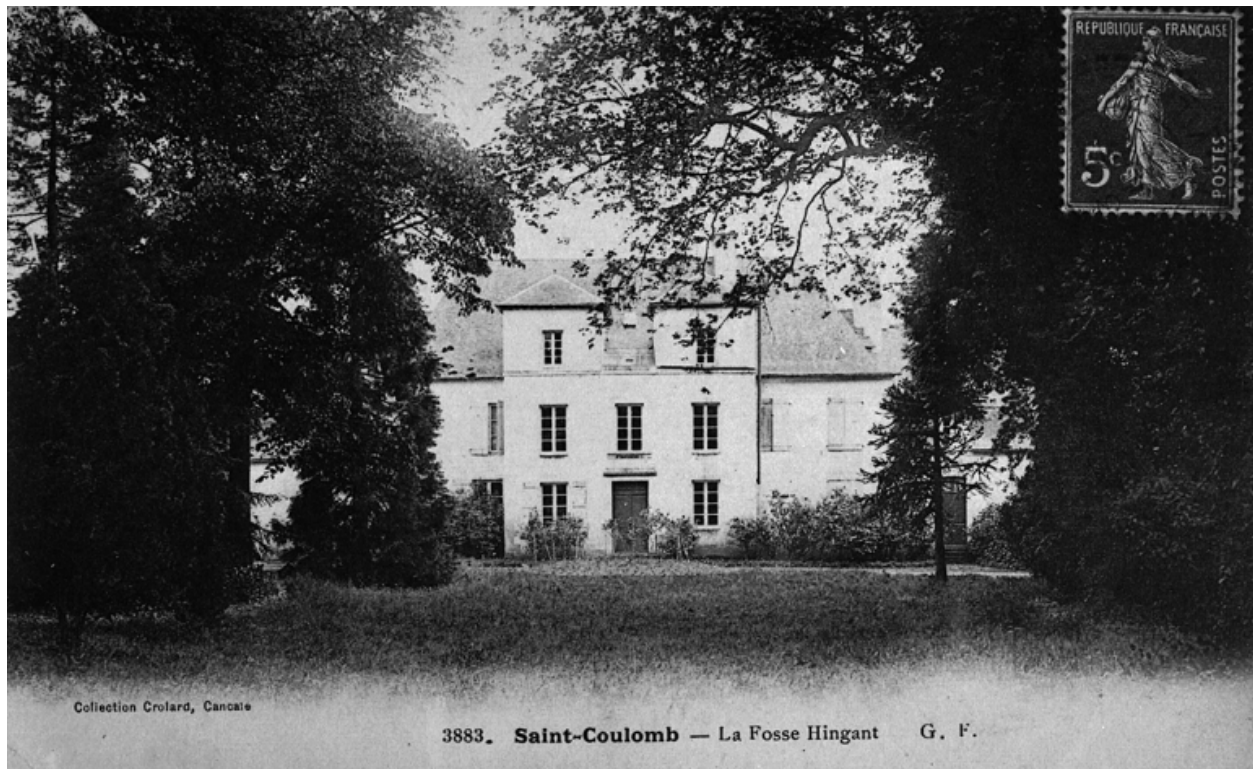
La Fosse Hingant au début du 20e siècle