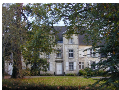
Vue partielle nord IVR53_19993507177NUCA