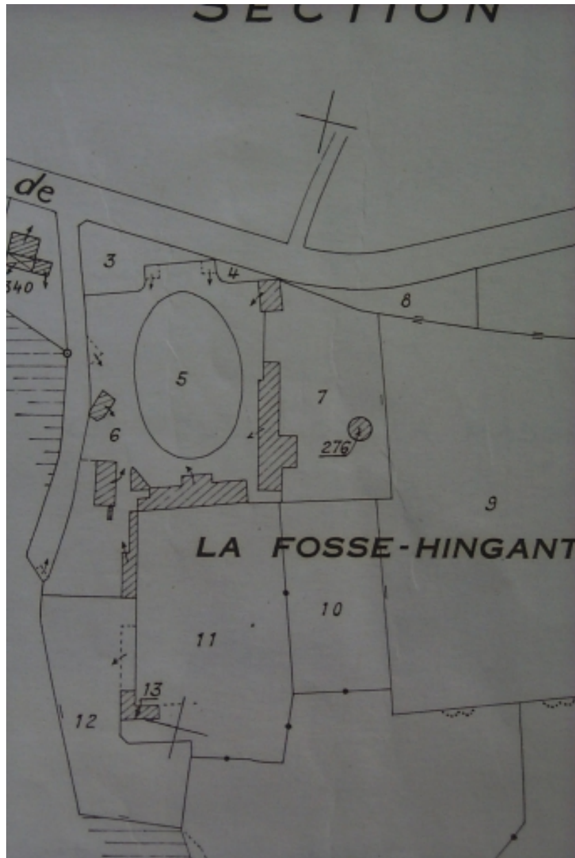
Situation sur le cadastre