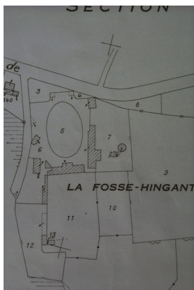
Situation sur le cadastre IVR53_19993507135NUC