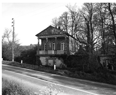
Le tempietto : vue générale nord-ouest