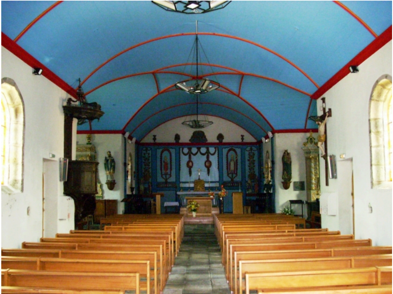
Le Drennec, église paroissiale Saint-Drien : vue axiale est