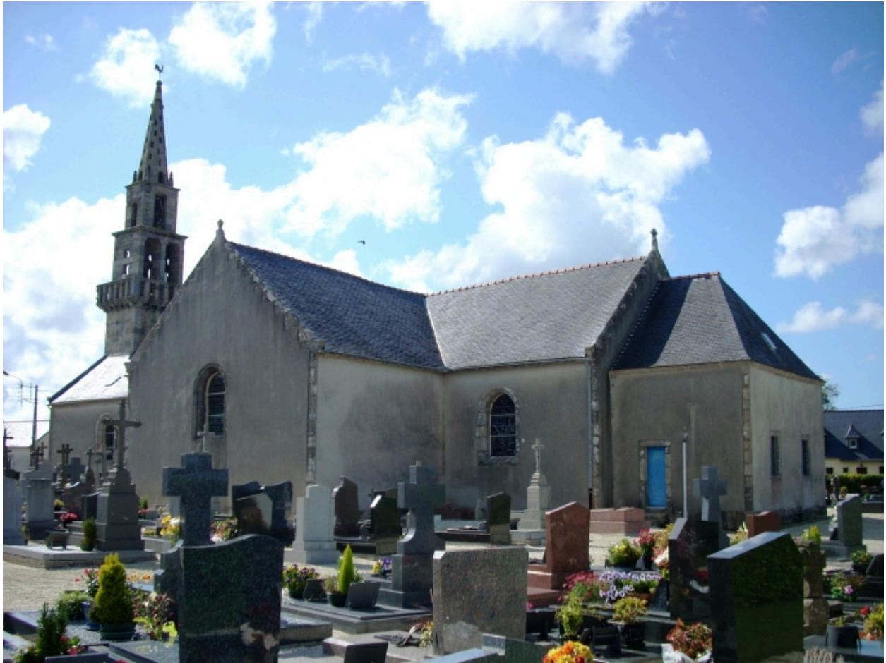
Le Drenec, église paroissiale Saint-Drien : vue générale sud-est