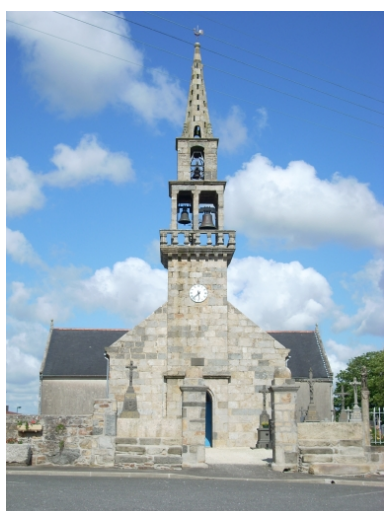
Le Drennec, église paroissiale Saint-Drien : élévation ouest IVR53_20082905997NUCA