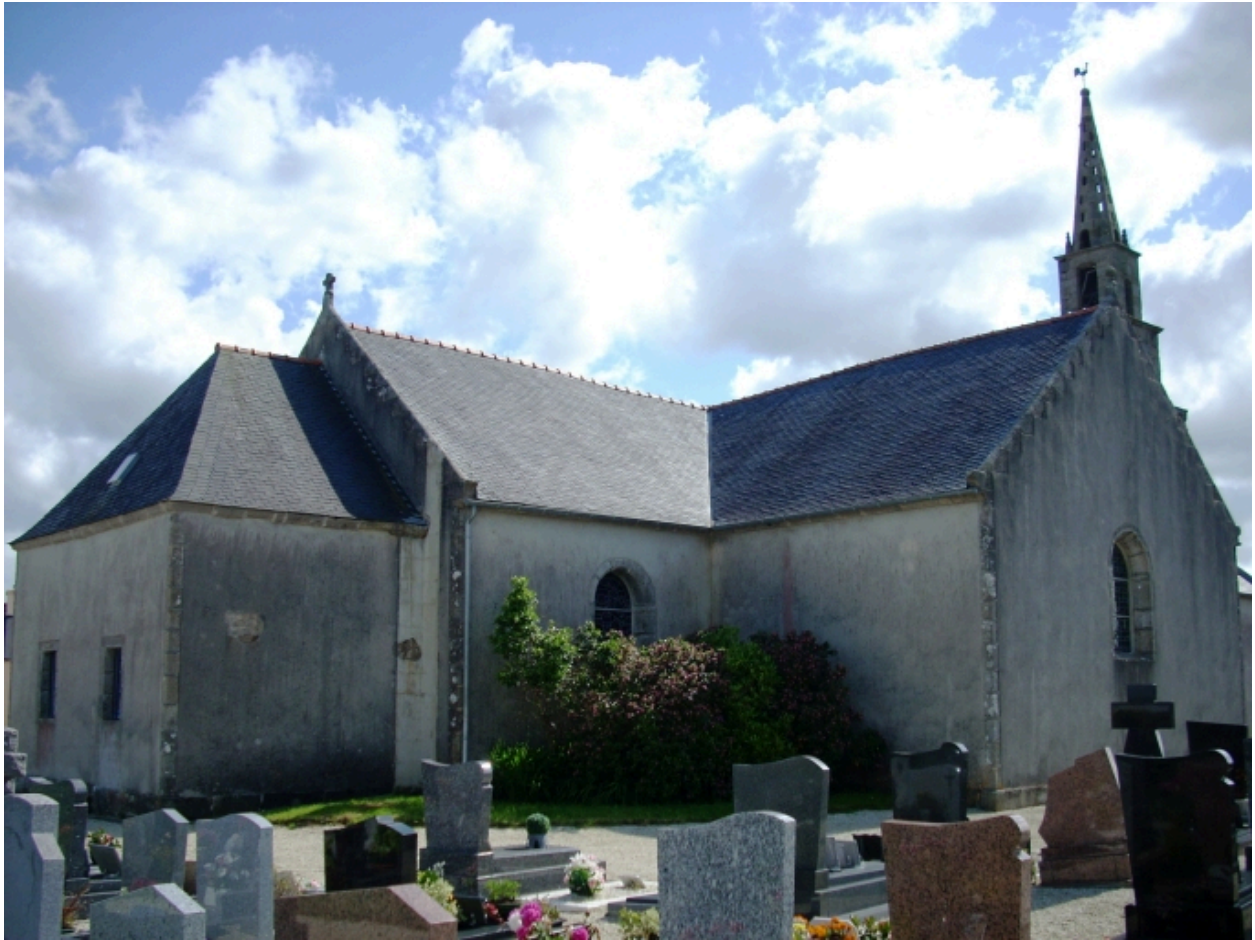
Le Drenec, église paroissiale Saint-Drien : vue générale nord-est