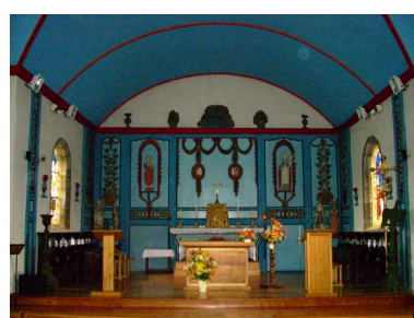
Le Drennec, église paroissiale Saint-Drien : vue du choeur depuis la croisée du transept