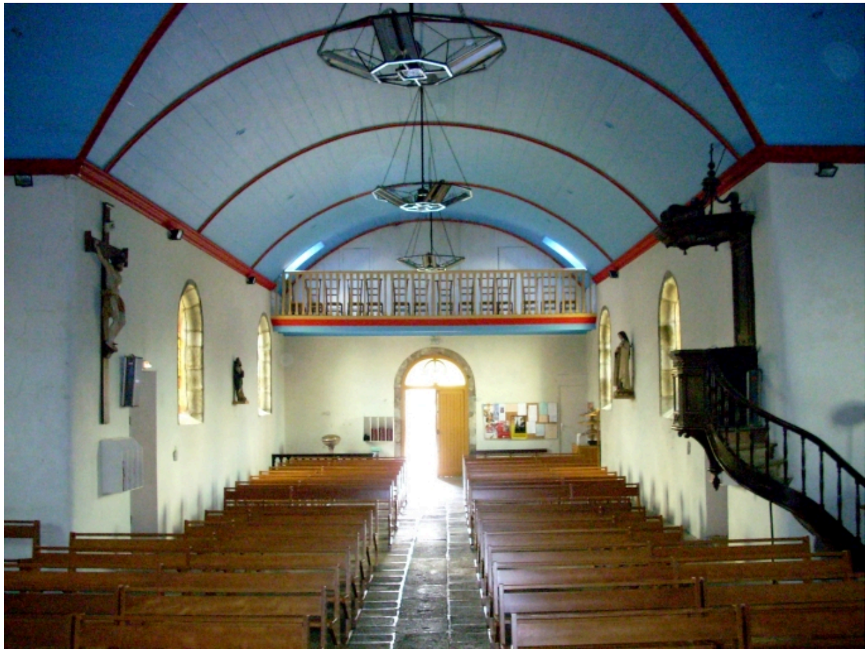
Le Drenec, église paroissiale Saint-Drien : vue axiale ouest