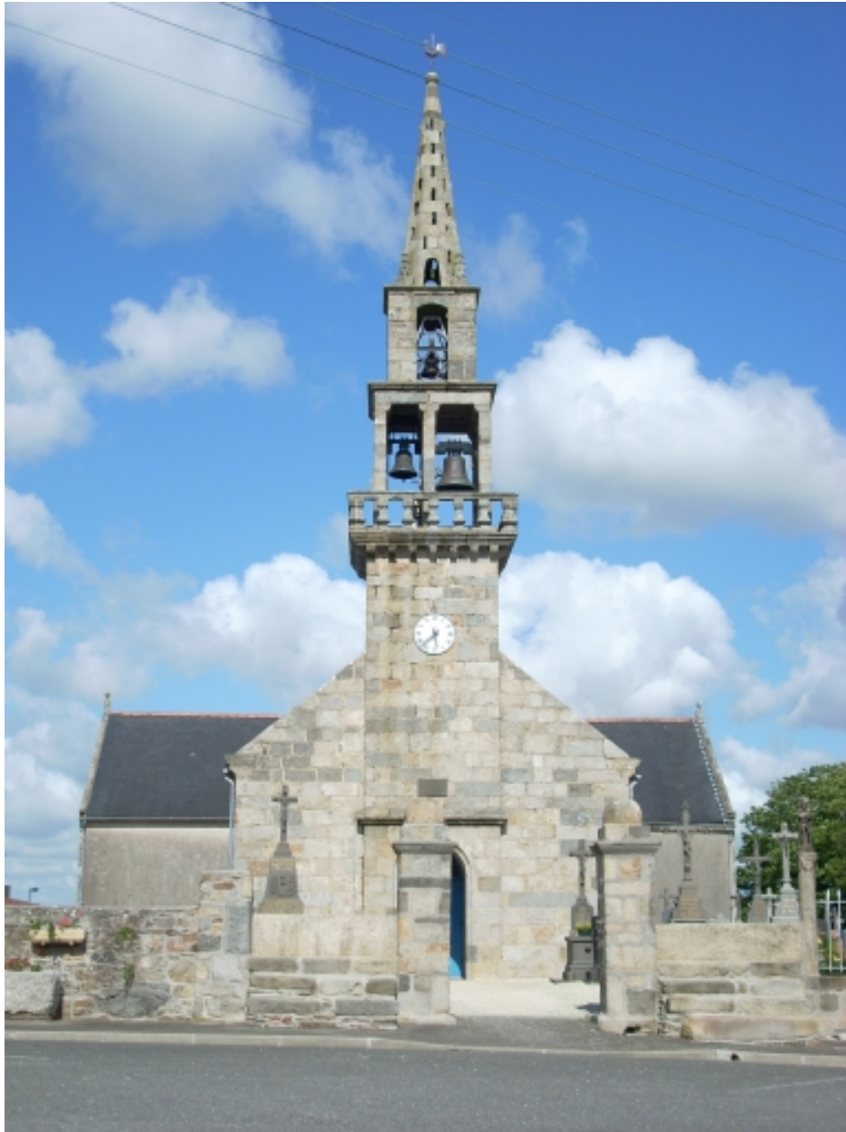
Le Drennec, église paroissiale Saint-Drien : élévation ouest