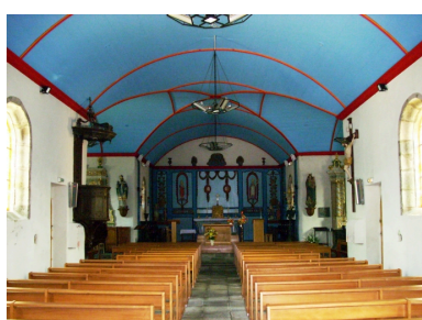
Le Drennec, église paroissiale Saint-Drien : vue axiale est