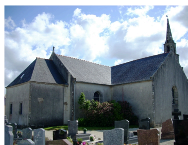
Le Drennec, église paroissiale Saint-Drien : vue générale nord-est IVR53_20082905999NUCA