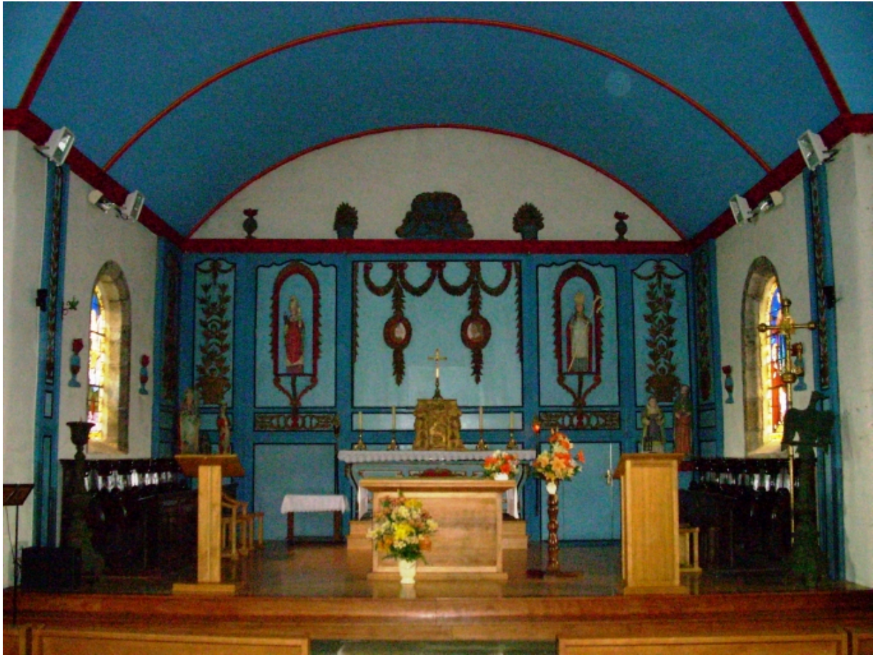
Le Drenec, église paroissiale Saint-Drien : vue du choeur depuis la croisée du transept