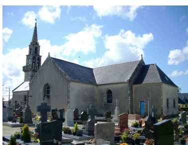
Le Drennec, église paroissiale Saint-Drien : vue générale sud-est IVR53_20082905998NUCA