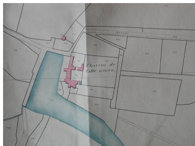
Le château de Villeneuve sur le cadastre de 1824 (A. D. Morbihan, 3 P 205/17)