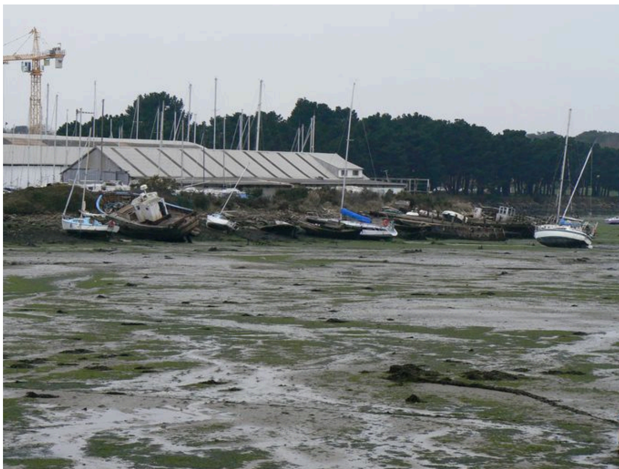
Cimetière de bateaux de Kernevel