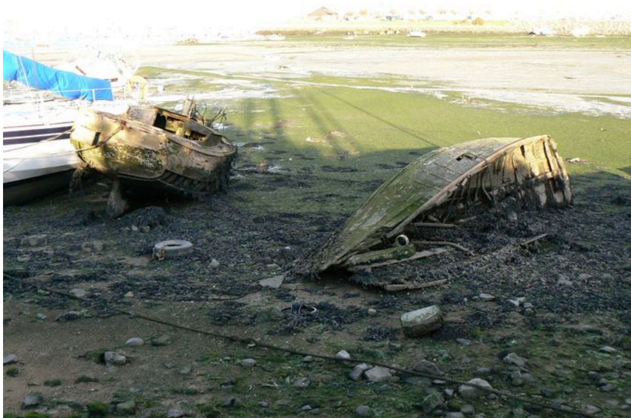
Epave du cimetière de bateaux de Kernevel