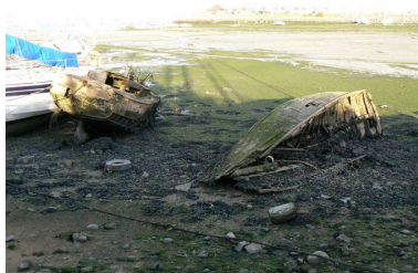
Epave du cimetière de bateaux de Kernevel IVR53_20085606052NUCA