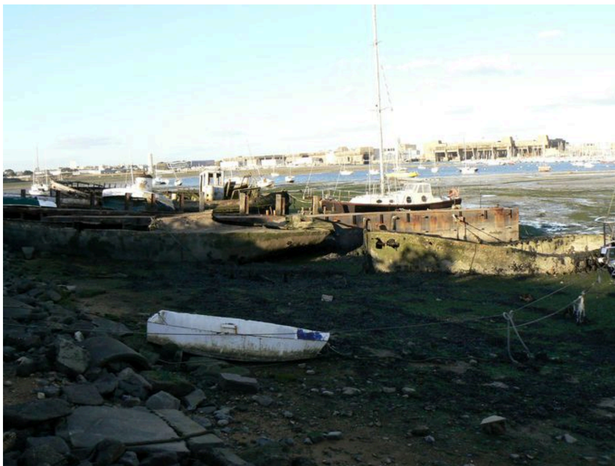
Cimetière de bateaux de Kernevel