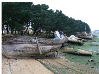
Vue générale du cimetière de bateaux de Kernevel