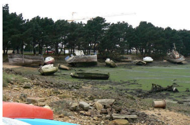
Cimetière de bateaux de Kernevel