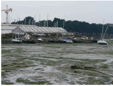
Cimetière de bateaux de Kernevel