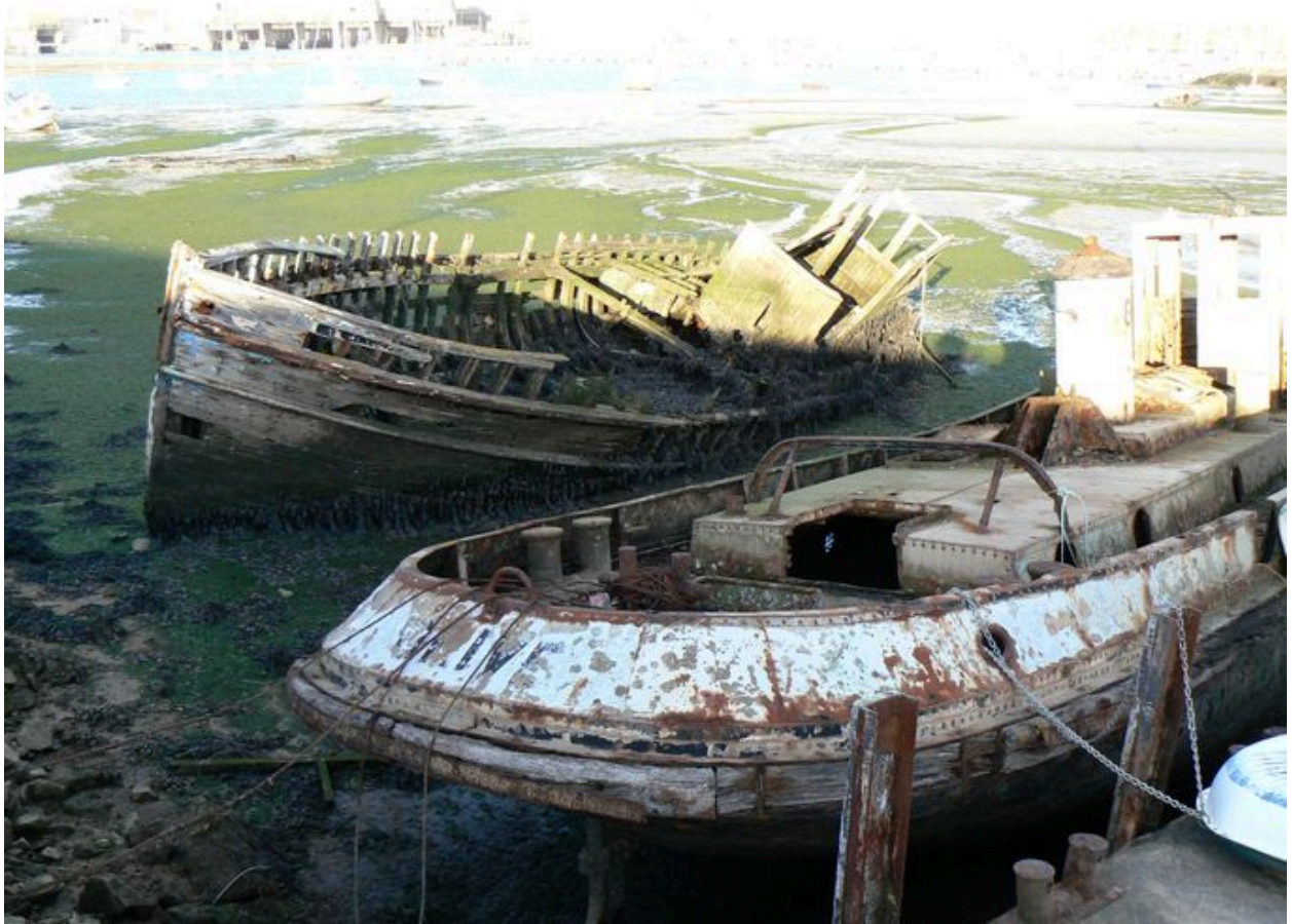
La 'Grive' au premier plan ; le 'Beyreuth' à l'arrière-plan (d'après Stéphane Barbedienne)