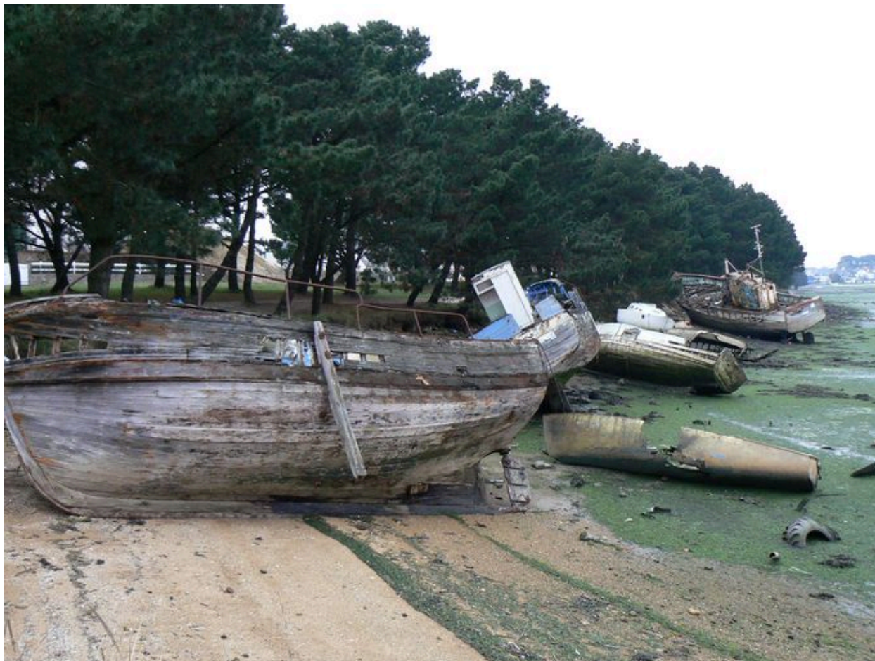
Vue générale du cimetière de bateaux de Kernevel