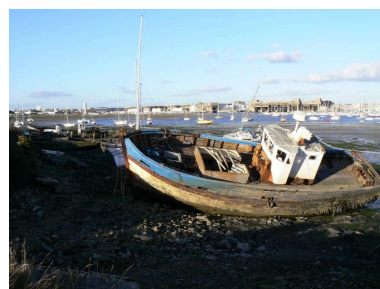
Cimetière de bateaux de Kernevel