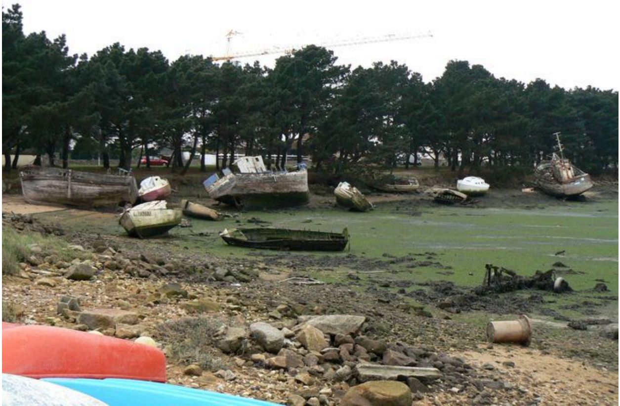
Cimetière de bateaux de Kernevel