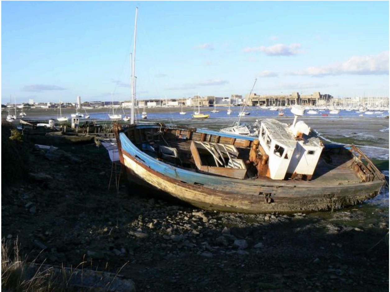
Cimetière de bateaux de Kernevel