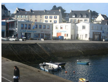
Quai Téphany IVR53_20082908289NUCA