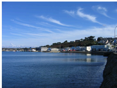
Vue générale de la zone portuaire Téphany IVR53_20062908331NUCA