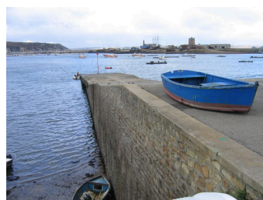
Cale du quai Téphany IVR53_20062908385NUCA