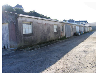
Ateliers en arrière du quai Téphany IVR53_20062908336NUCA