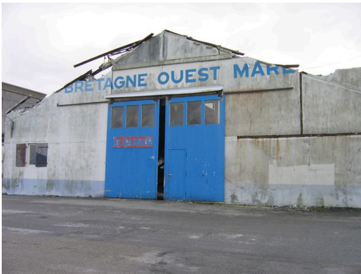
Bâtiment d'Ouest Marée en cours de démolition (décembre 2005)