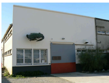
Viviers Henry en arrière de la zone portuaire Téphany IVR53_20062908487NUCA