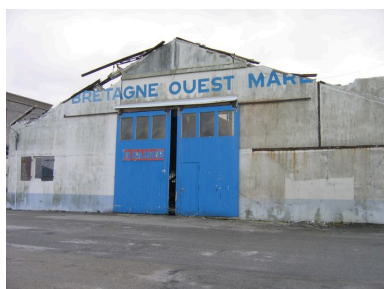
Bâtiment d'Ouest Marée en cours de démolition (décembre 2005) IVR53_20062908486NUCA