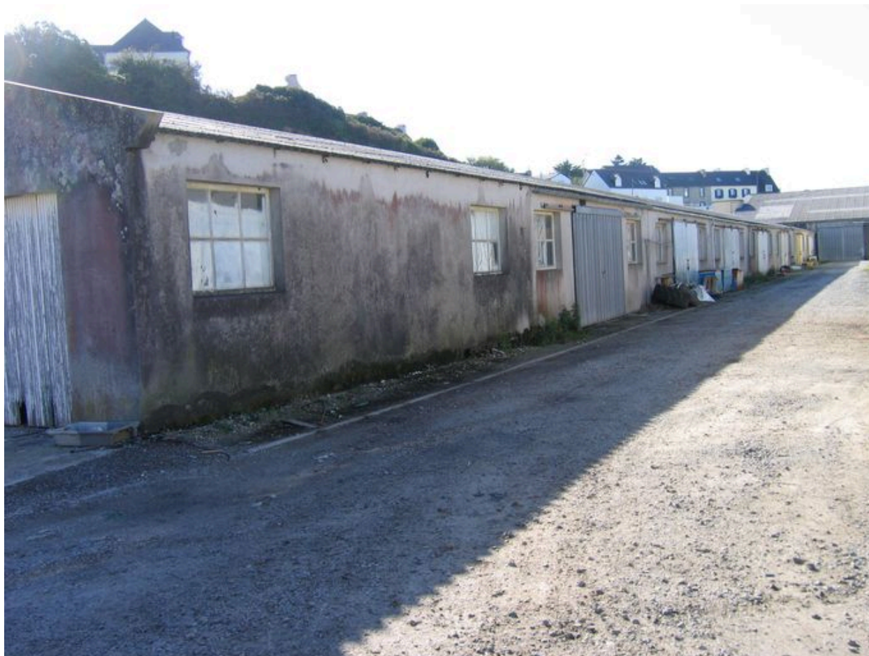
Ateliers en arrière du quai Téphany