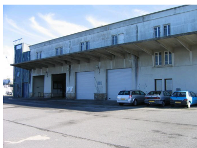
Criée sur le quai Téphany IVR53_20062908335NUCA