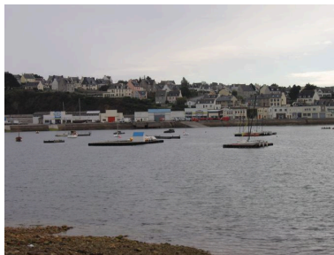
Vue générale de la zone portuaire Téphany IVR53_20062908396NUCA