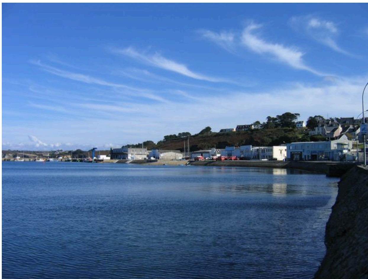
Vue générale de la zone portuaire Téphany