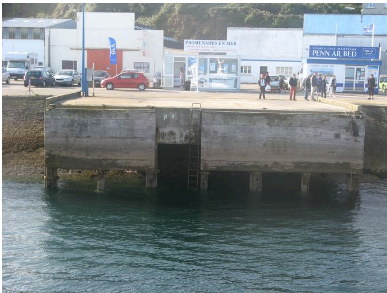
Appontement du quai Téphany