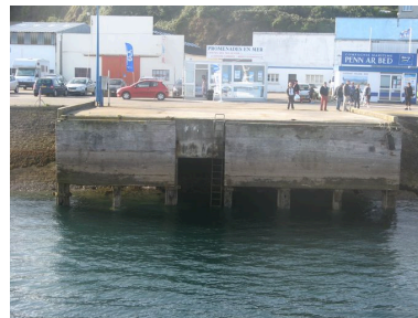
Appontement du quai Téphany IVR53_20082908288NUCA