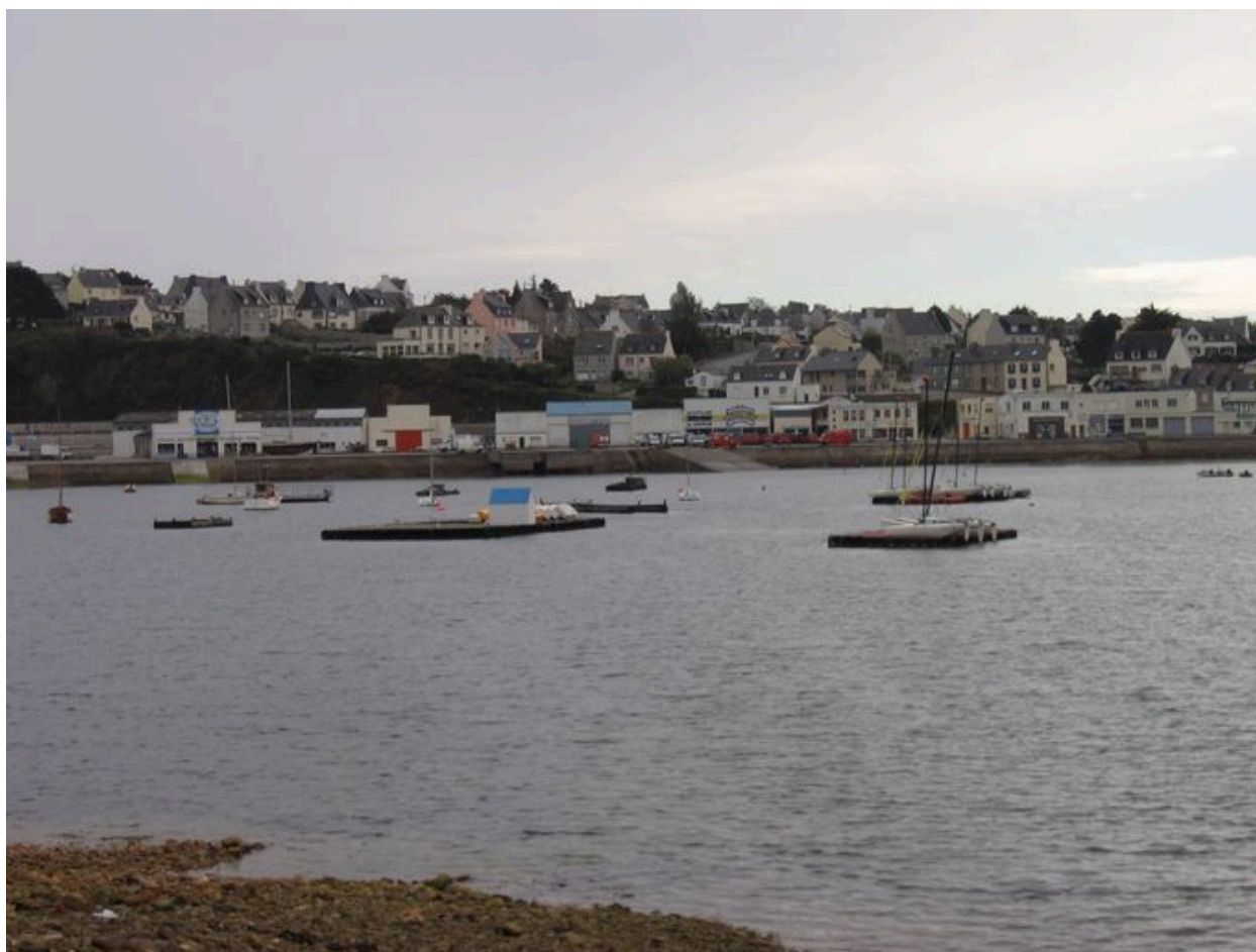
Vue générale de la zone portuaire Téphany