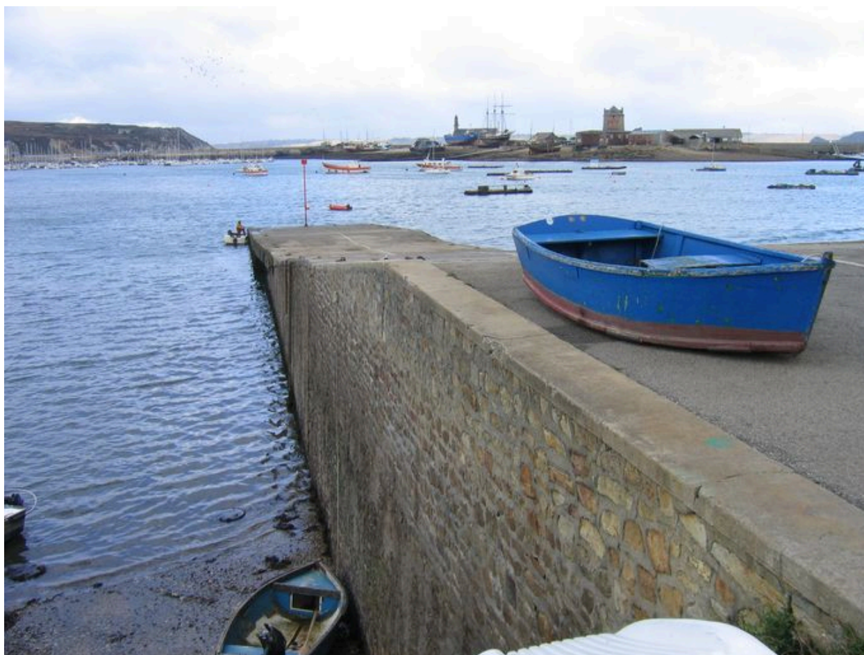
Cale du quai Téphany