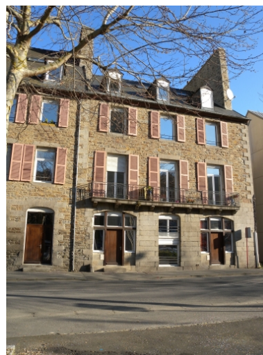
Vue générale IVR53_20082213459NUCA