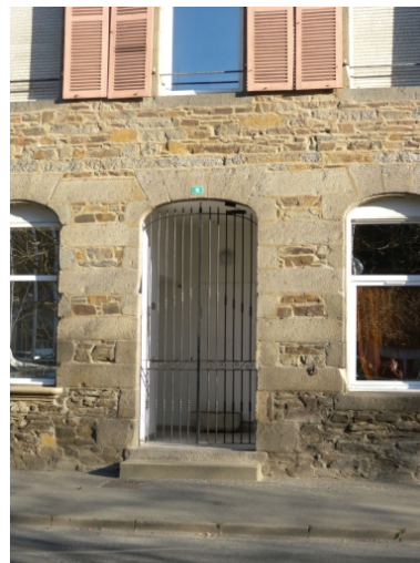
Vue de l'une des portes d'entrée de l'immeuble, avec son arc de décharge : la façade en moellons de schiste et les encadrements en pierre de granite