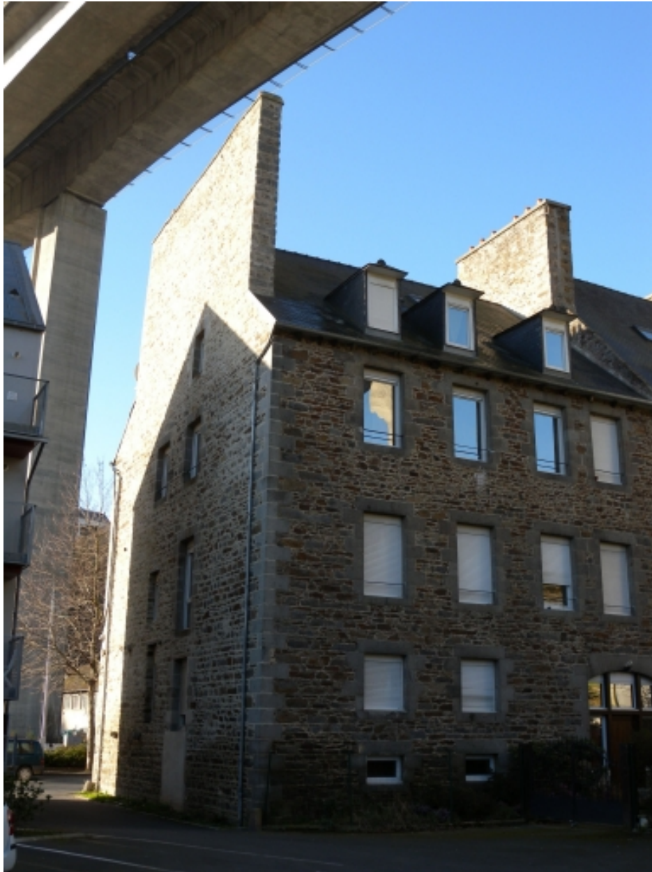
Vue de la façade postérieure du bâtiment : remarquer l'ancien espace dédié à un usage commercial