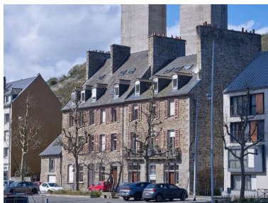
Alignement d'anciennes maisons d'armateurs IVR53_20262200259NUCA