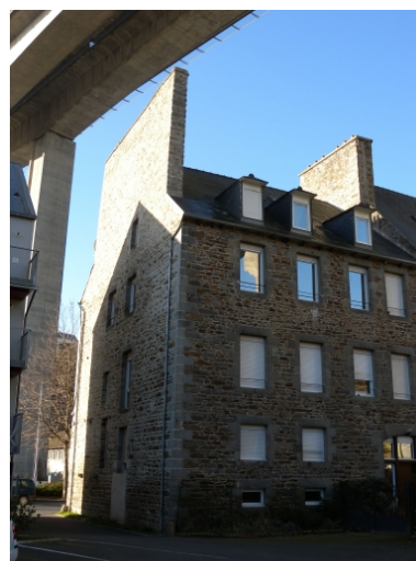
Vue de la façade postérieure du bâtiment : remarquer l'ancien espace dédié à un usage commercial IVR53_20082213462NUCA