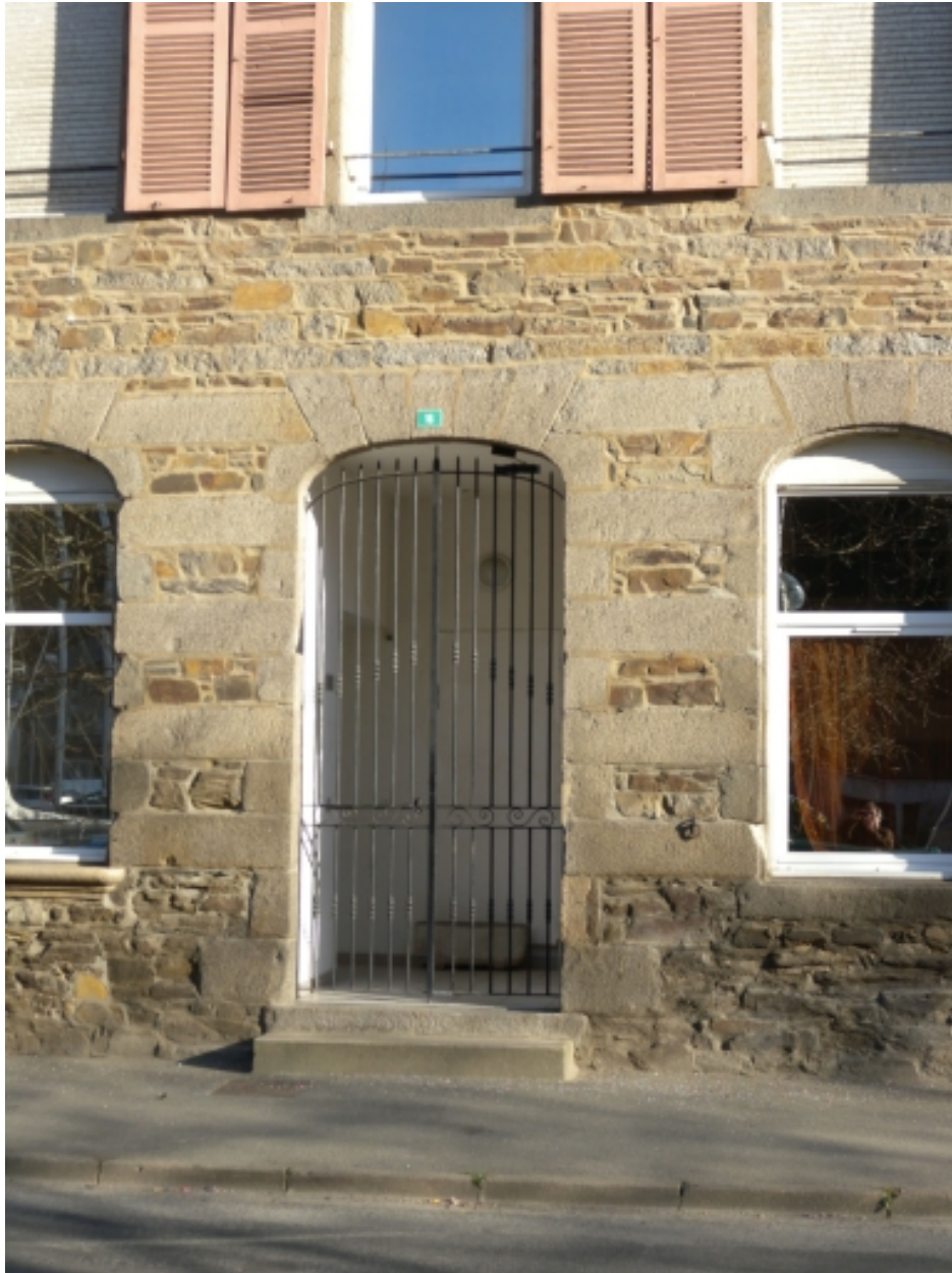
Vue de l'une des portes d'entrée de l'immeuble, avec son arc de décharge : la façade en moellons de schiste et les encadrements en pierre de granite