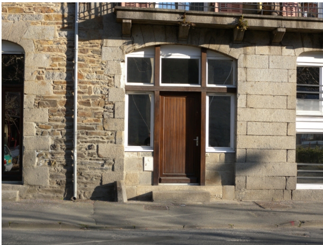
Vue de l'ancienne porte cochère, aujourd'hui transformée en porte-fenêtre