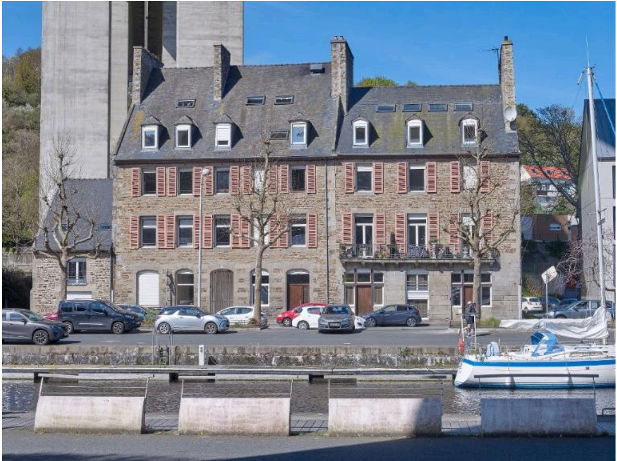
Alignement d'anciennes maisons d'armateurs