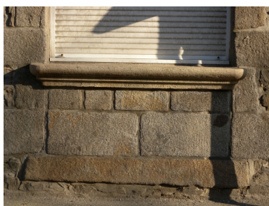
vue de détail du soubassement d'une ouverture avec encorbellement