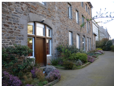
Vue de la façade postérieure : remarquer la porte cochère et les ouvertures secondaires