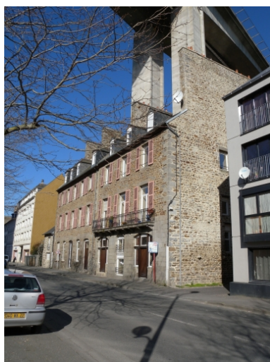
Alignement d'anciennes maisons d'armateurs IVR53_20082213465NUCA