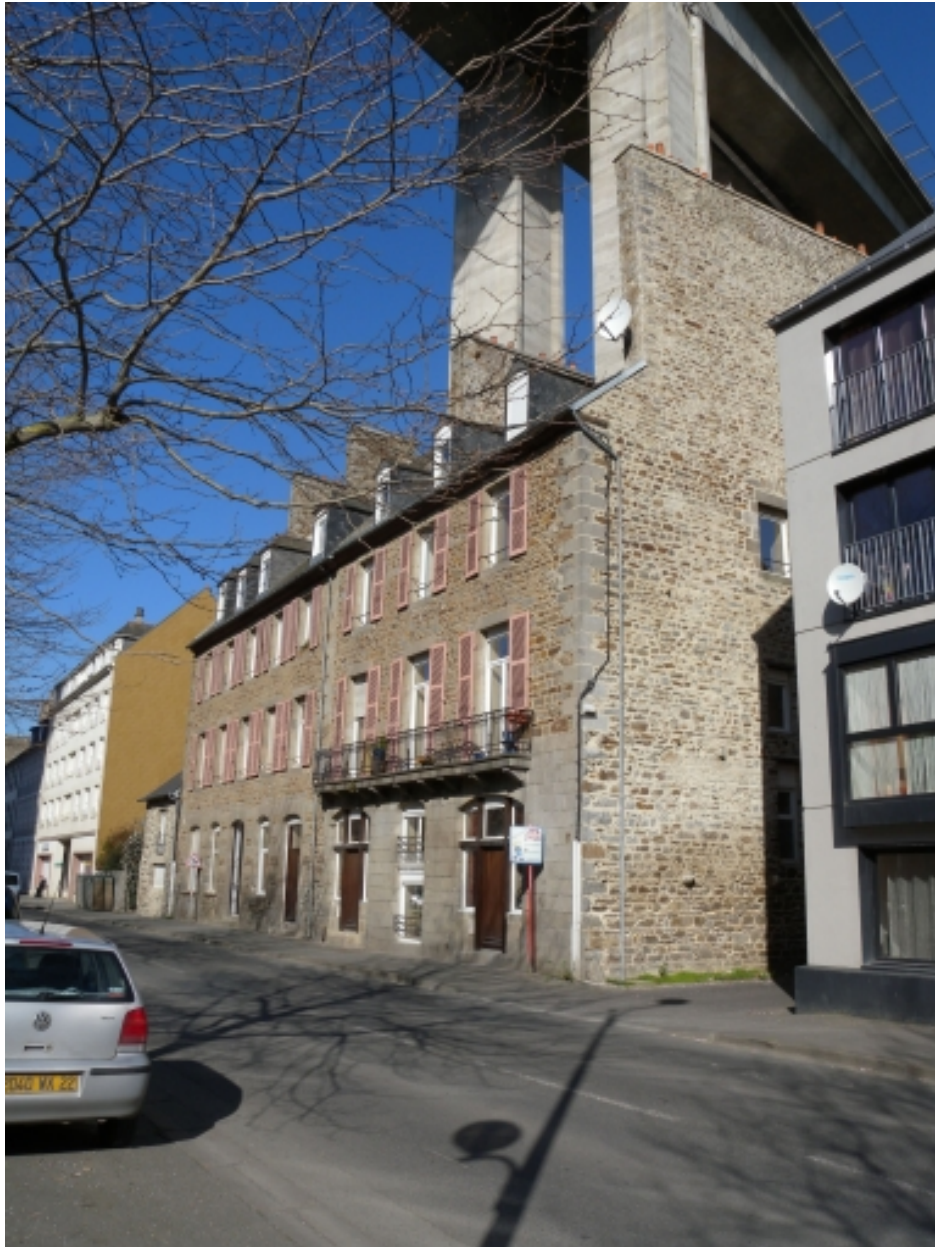
Alignement d'anciennes maisons d'armateurs