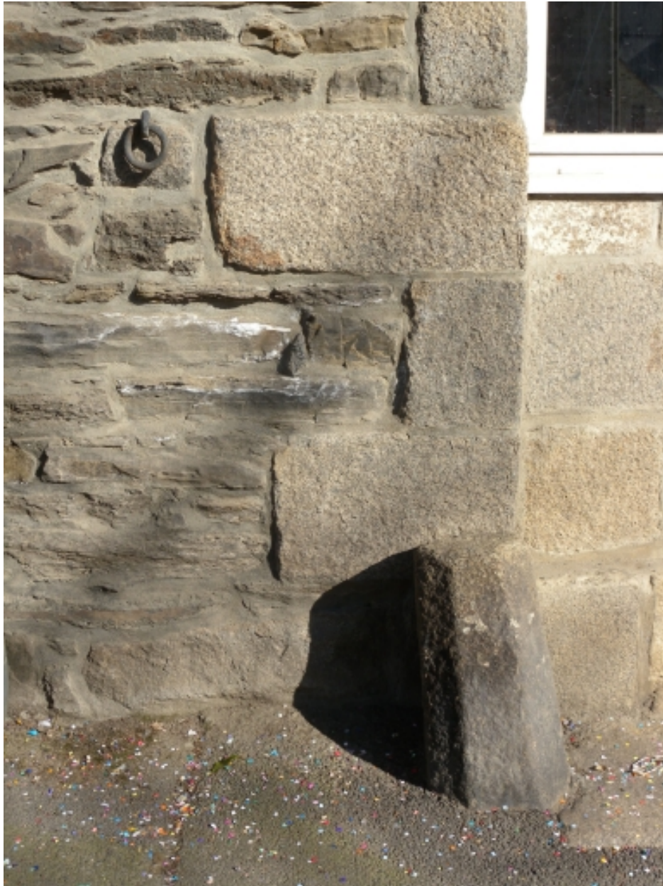
Vue de détail de l'angle antérieur droit, avec la borne de la porte cochère, les chaînes d'angle en pierre de taille et l'anneau pour attacher les chevaux