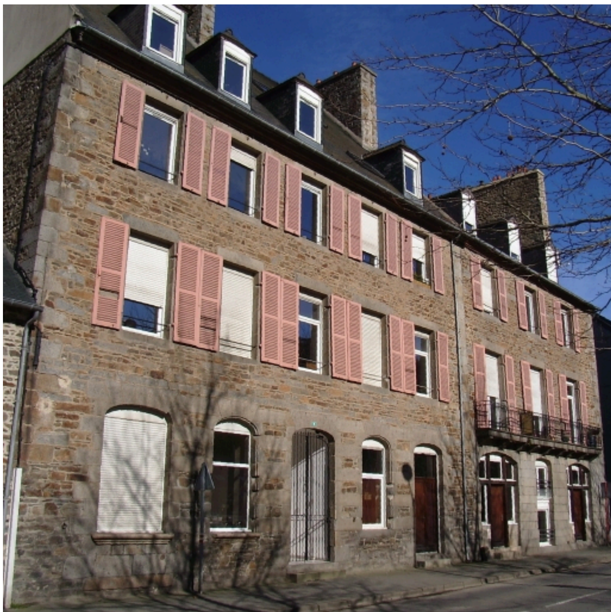
Alignement d'anciennes maisons d'armateurs