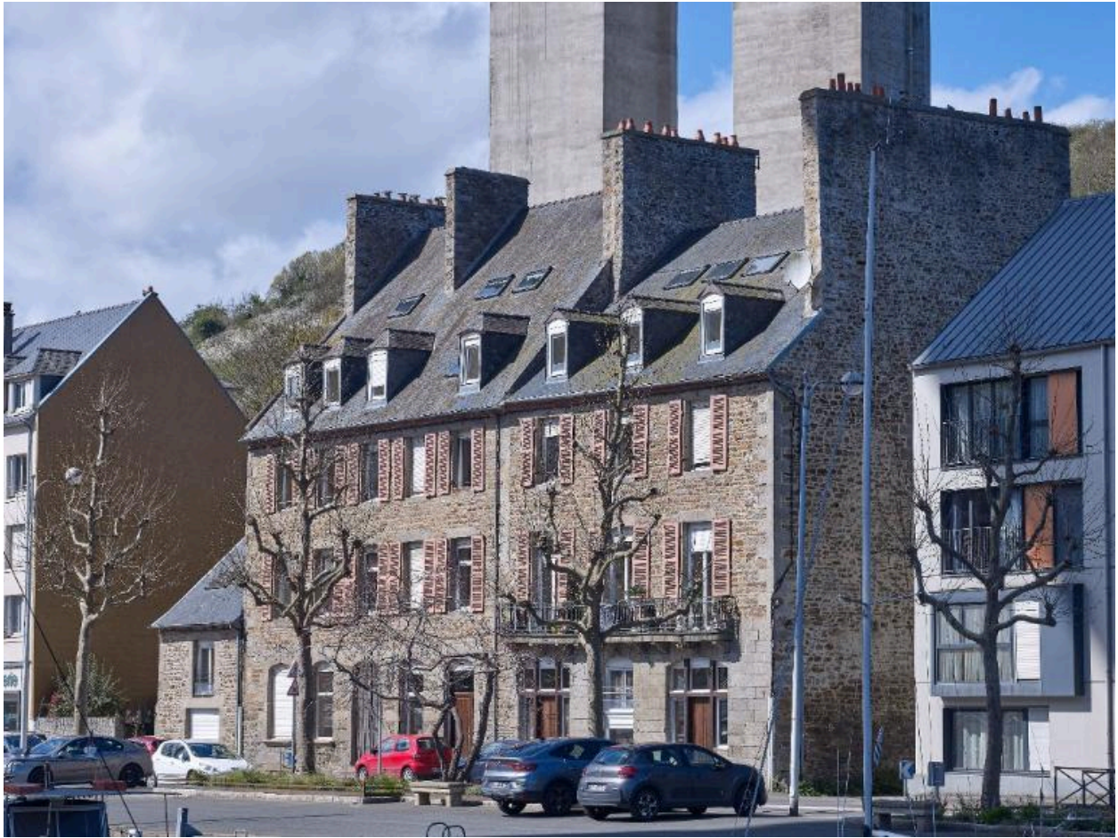
Alignement d'anciennes maisons d'armateurs