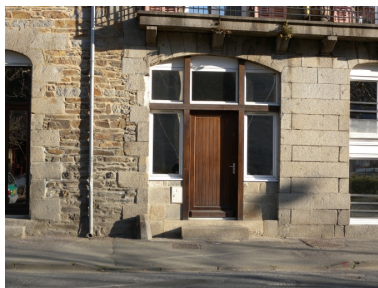
Vue de l'ancienne porte cochère, aujourd'hui transformée en porte-fenêtre IVR53_20082213460NUCA