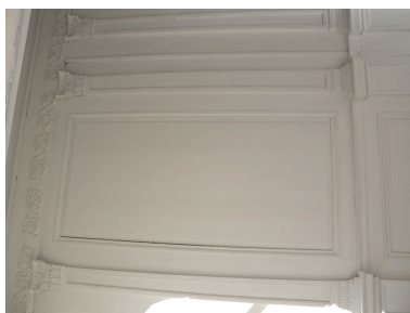
Vue des anciennes boiseries à l'intérieur du bâtiment