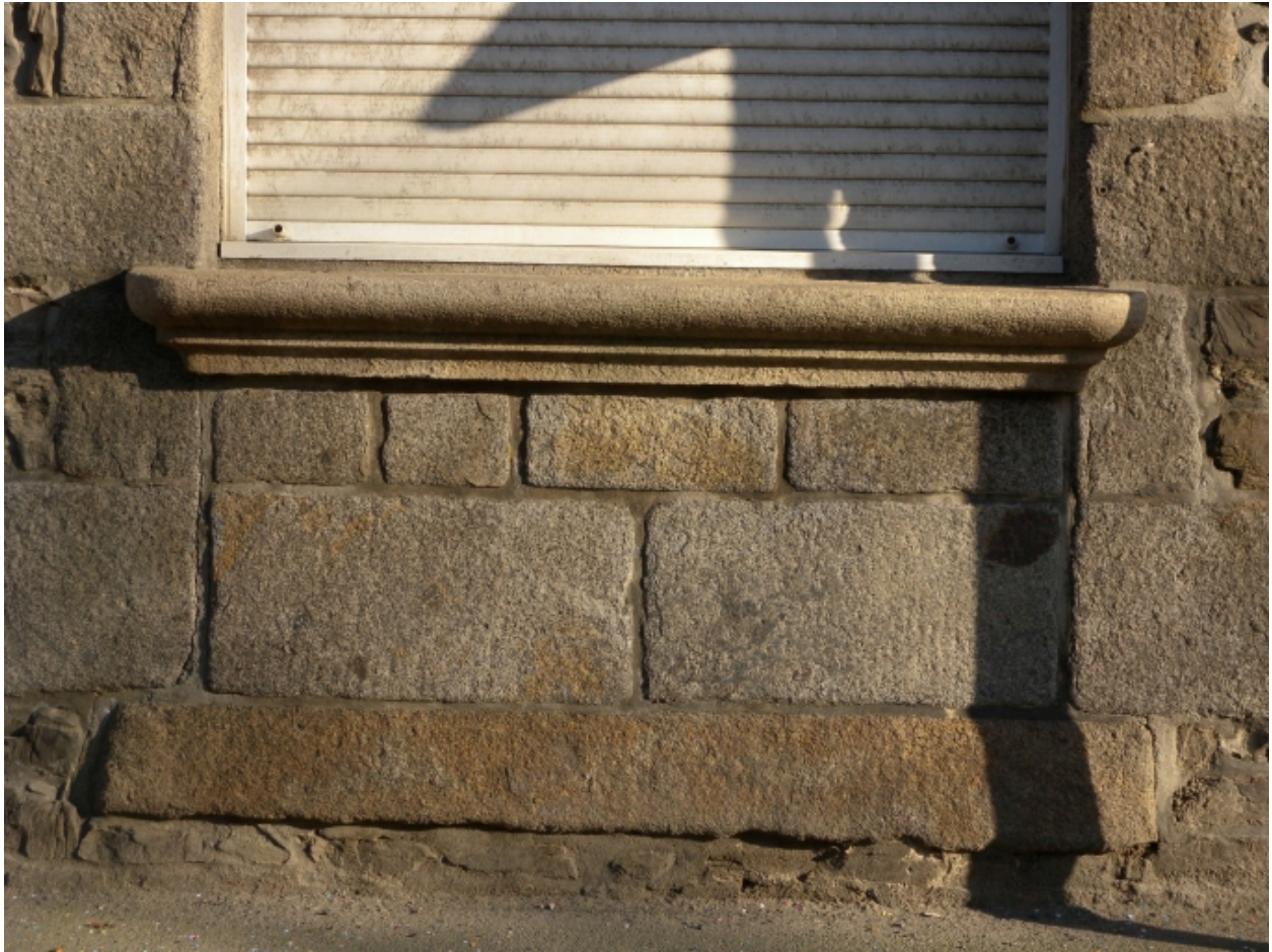
vue de détail du soubassement d'une ouverture avec encorbellement