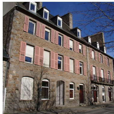
Alignement d'anciennes maisons d'armateurs