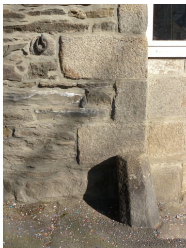
Vue de détail de l'ange antérieur droit, avec la borne de la porte cochère, les chaînes d'angle en pierre de taille et l'anneau pour attacher les chevaux