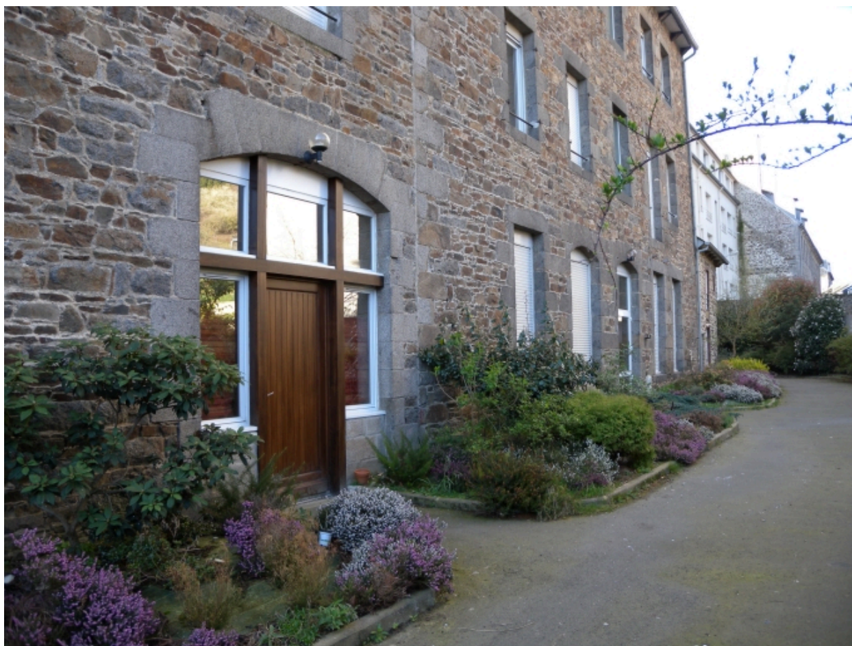
Vue de la façade postérieure : remarquer la porte cochère et les ouvertures secondaires