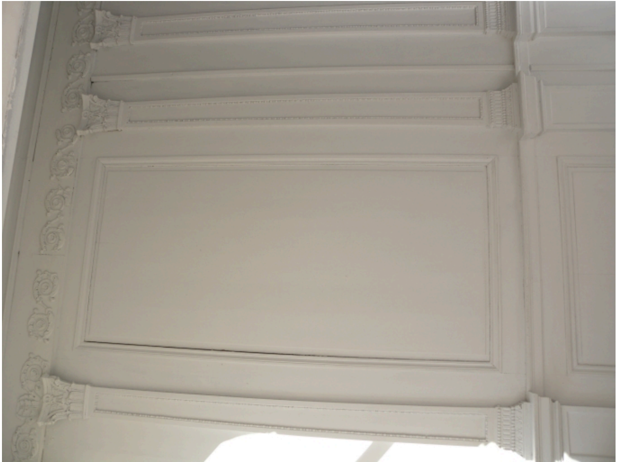
Vue des anciennes boiseries à l'intérieur du bâtiment