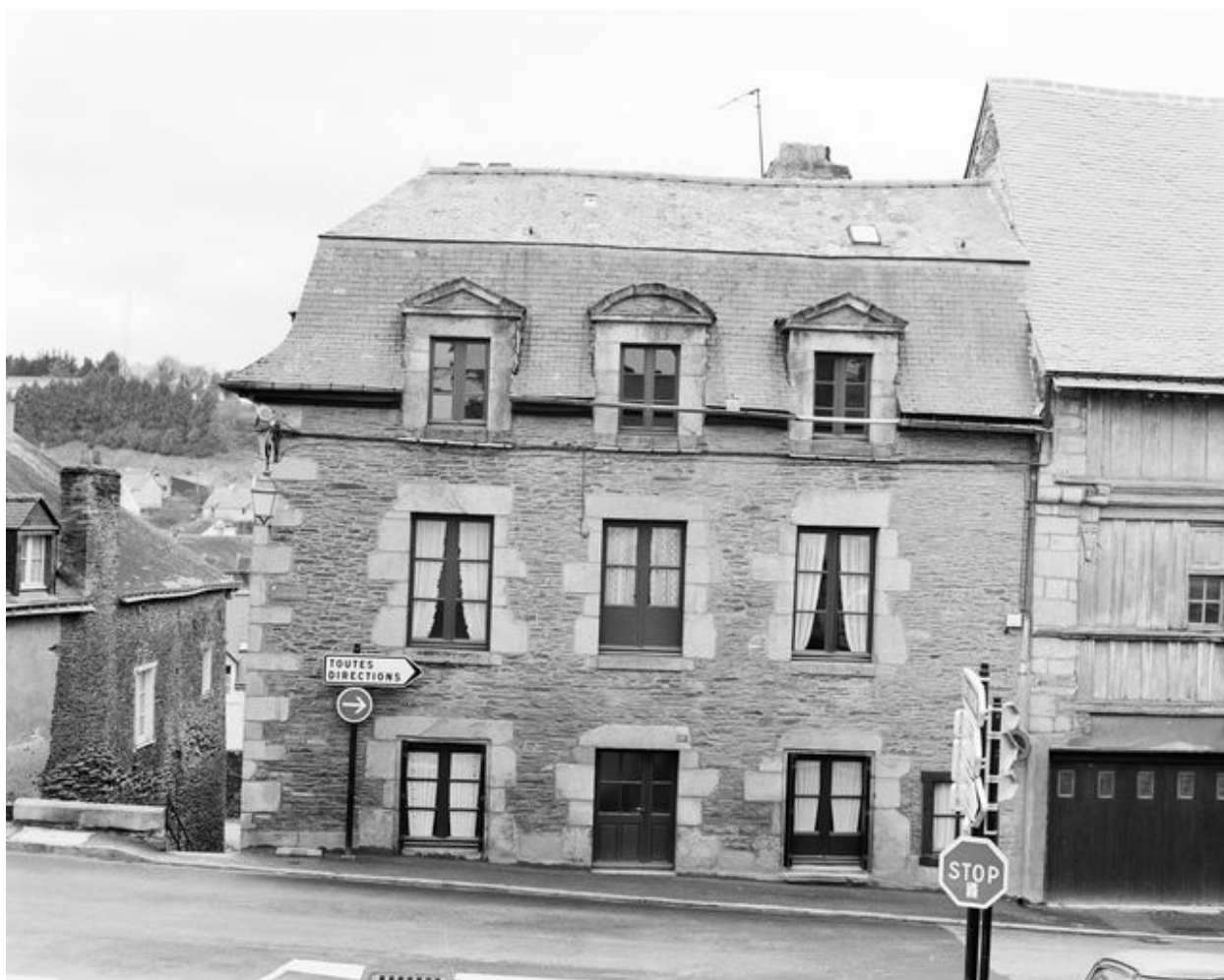
Maison : élévation nord (état en 1994)