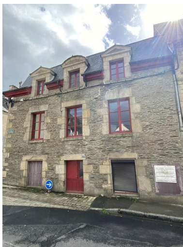
Vue nord-ouest