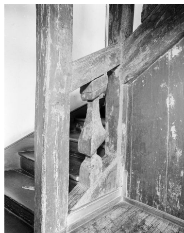
Maison, départ de l'escalier : un balustre (état en 1994) IVR53_19945600506X