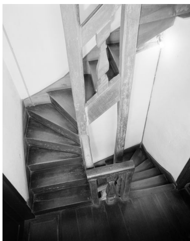
Maison : l'escalier entre le premier et le deuxième niveaux (état en 1994)