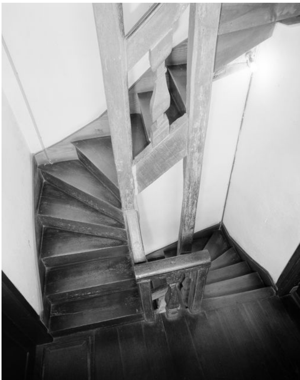
Maison : l'escalier entre le premier et le deuxième niveaux (état en 1994)