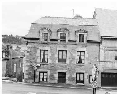
Maison : élévation nord (état en 1994) IVR53_19945600504X