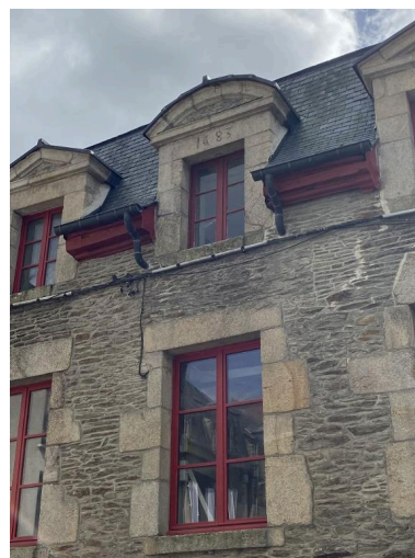
Linteau daté, détail, vue nord-ouest