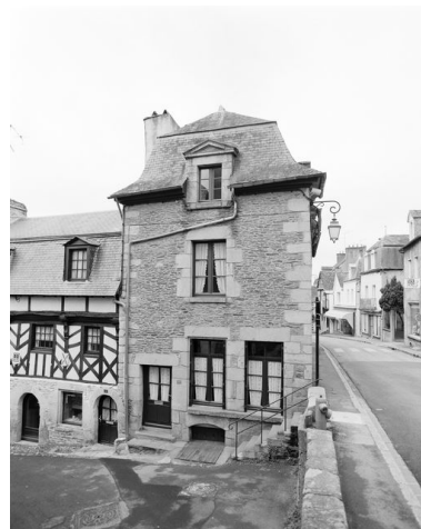
Maison : élévation est (état en 1994)