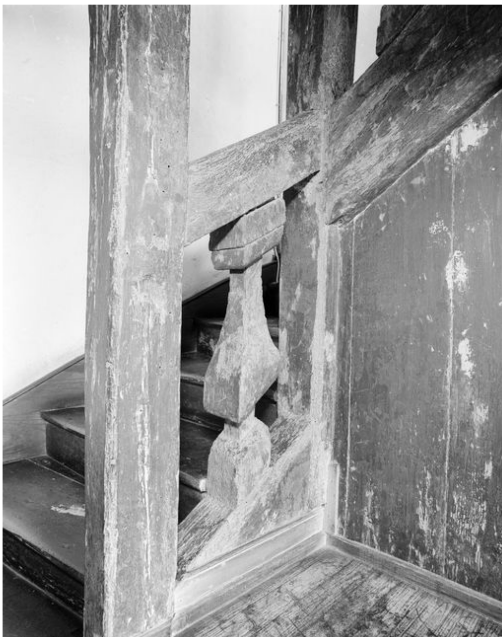
Maison, départ de l'escalier : un balustre (état en 1994)