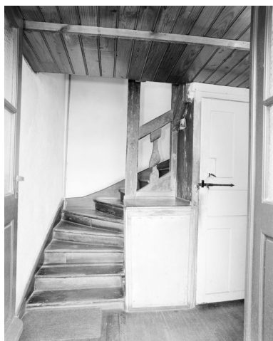
Maison, rez-de-chaussée : départ de l'escalier (état en 1994)