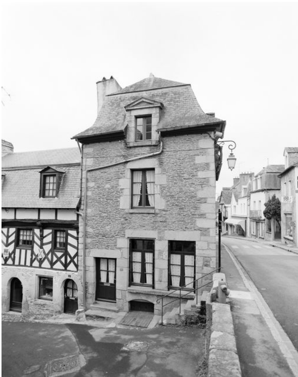
Maison : élévation est (état en 1994)