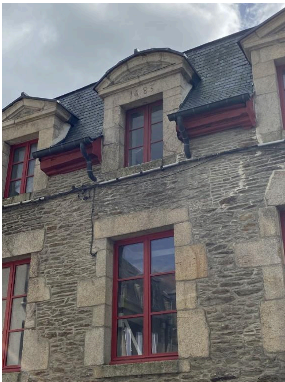
Linteau daté, détail, vue nord-ouest