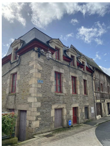
Vue nord-est