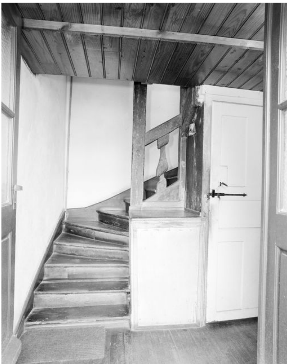
Maison, rez-de-chaussée : départ de l'escalier (état en 1994)