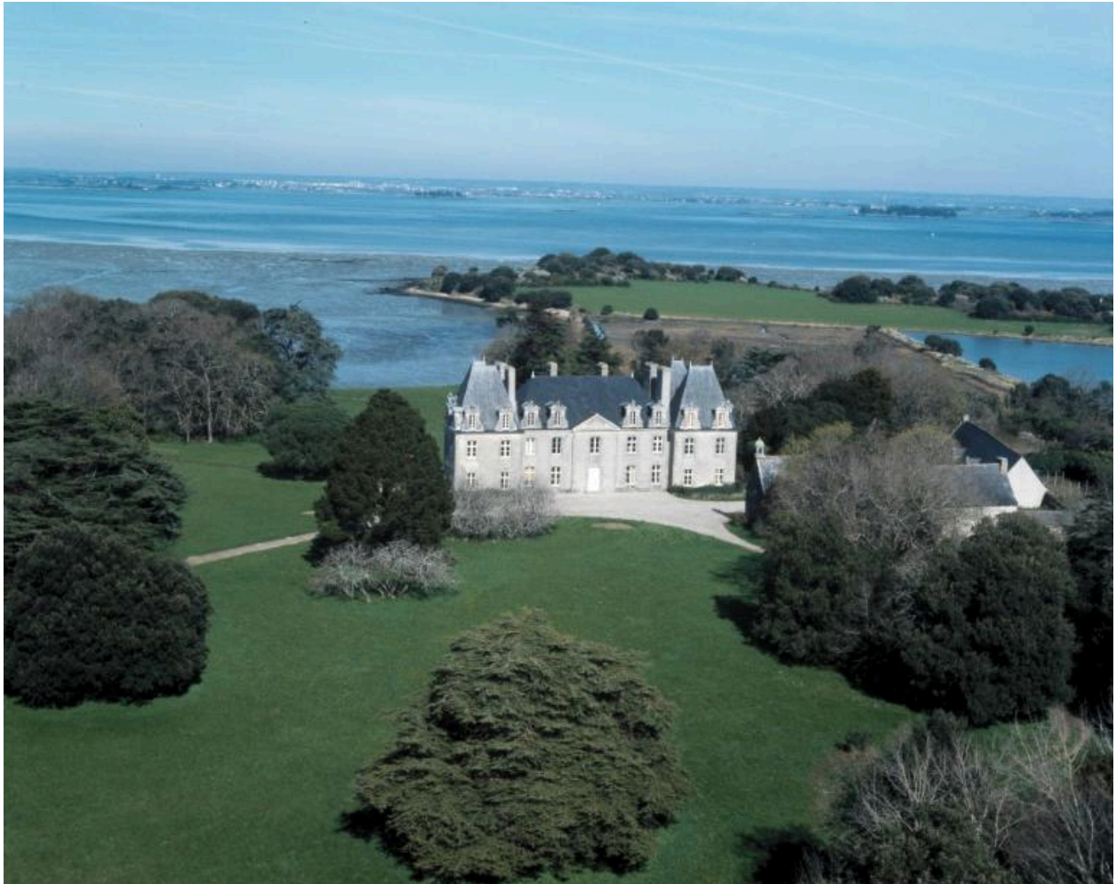
Vue aérienne sud.