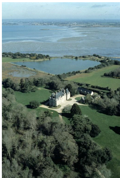
Vue aérienne sud-ouest IVR53_19945600383ZA