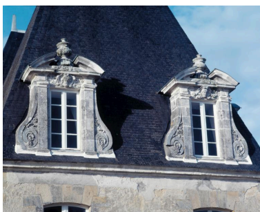
Château, pavillon sud-est. Elévation sud, lucarnes.