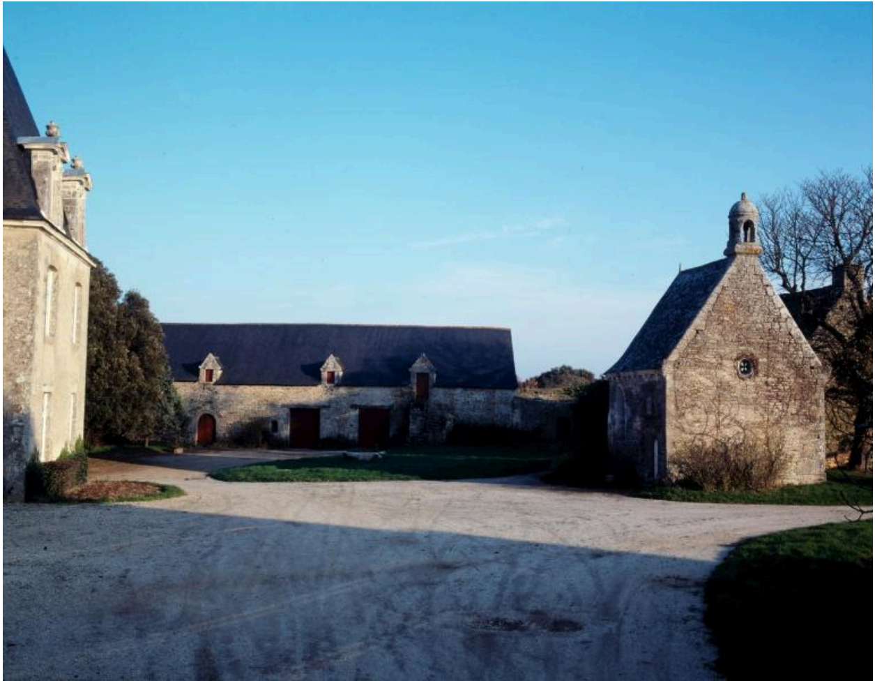
Château, communs et chapelle. Vue prise de l'ouest.