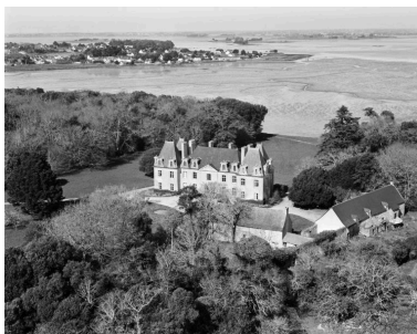
Vue aérienne sud-est. IVR53_19945600413X