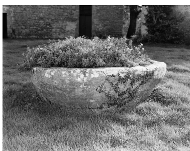
Château, cuve destinée à fouler le raisin.