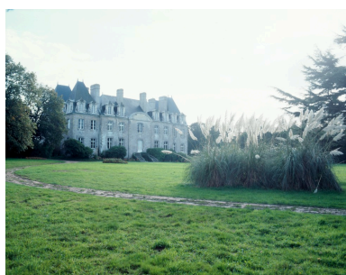
Château, vue générale nord. IVR53_19935602390X