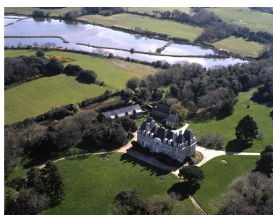
Château, vue aérienne nord-ouest. IVR53_19945600417XA