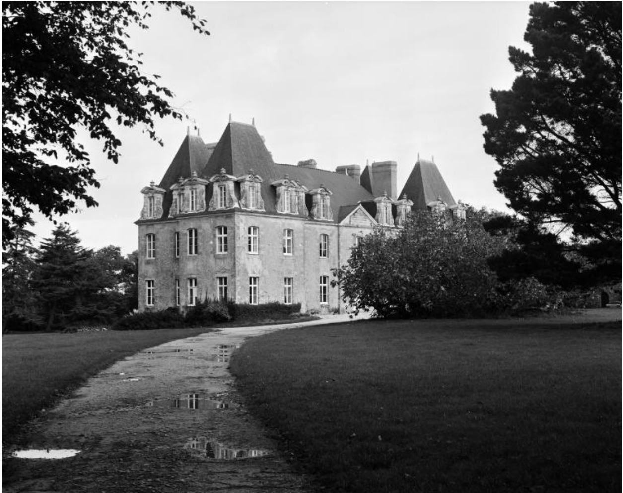
Château, vue générale sud-ouest.