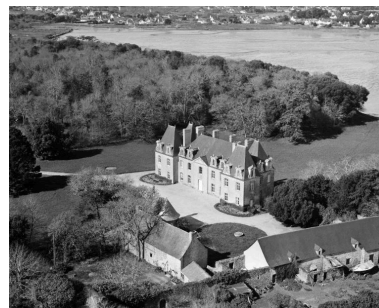
Vue aérienne sud-est.