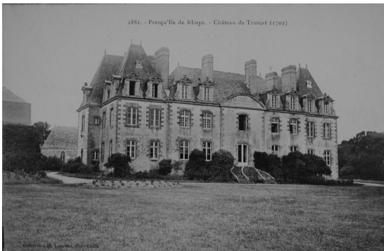
Vue de la façade principale