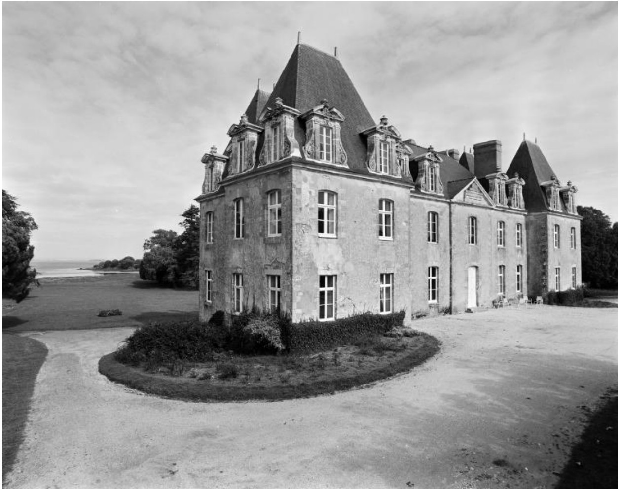
Château, vue générale sud-ouest.