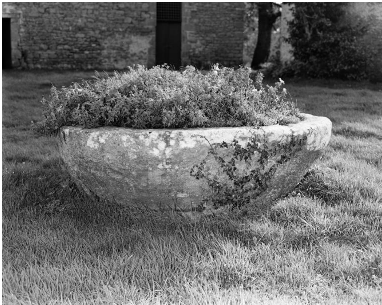
Château, cuve destinée à fouler le raisin.