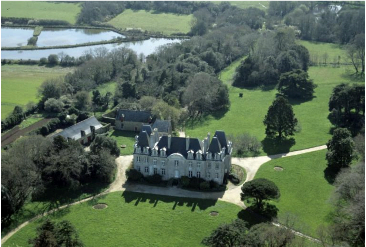
Vue aérienne nord