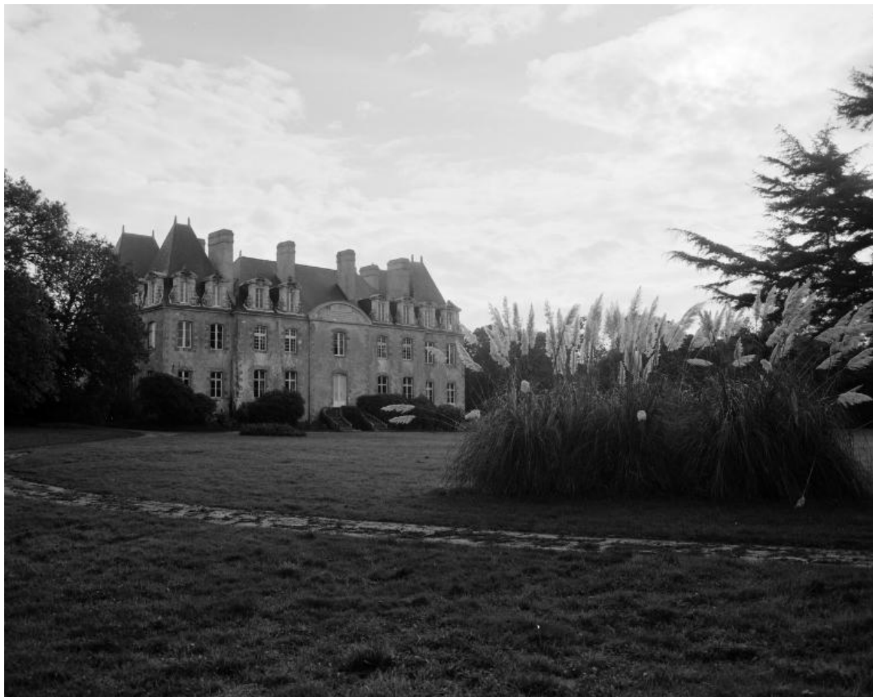
Château, vue générale nord.