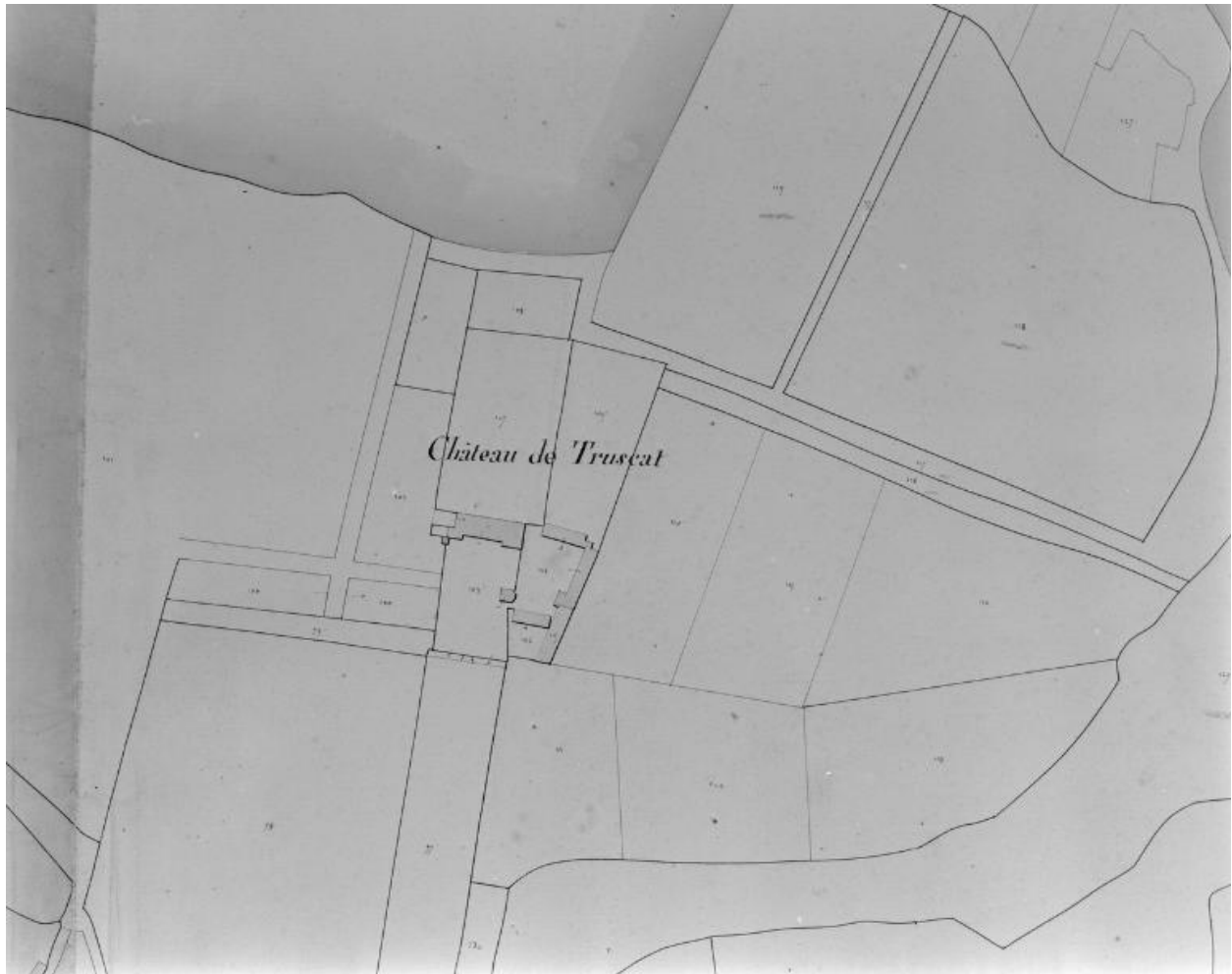
Château, extrait cadastral 1828, section AI.