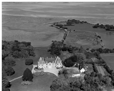
Vue aérienne sud. IVR53_19945600414X