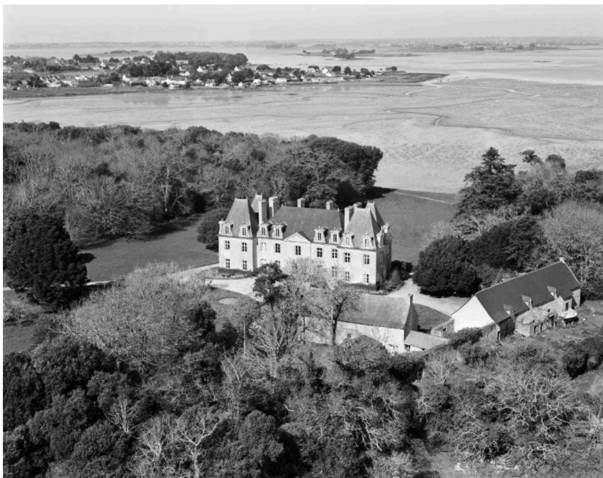
Vue aérienne sud-est.