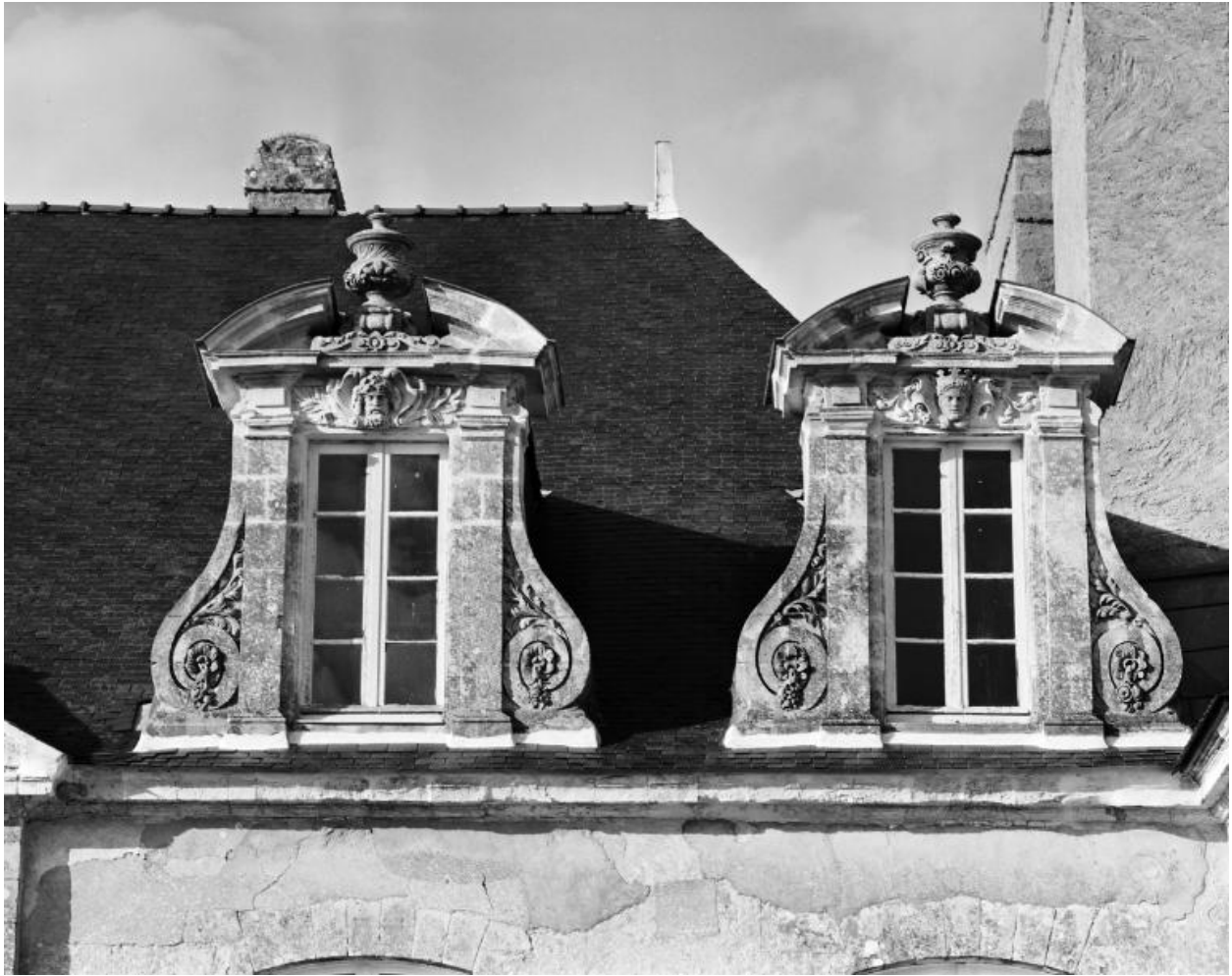
Château, corps principal. Elévation sud, lucarnes.