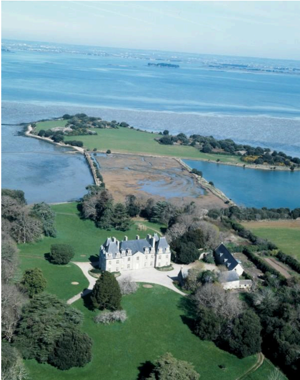
Vue aérienne sud.