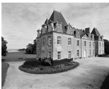
Château, vue générale sud-ouest. IVR53_19935602316X