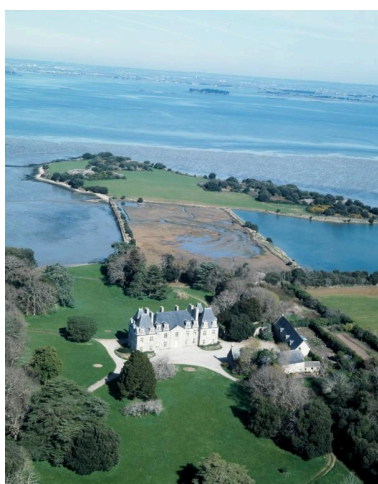
Vue aérienne sud. IVR53_19945600416XA