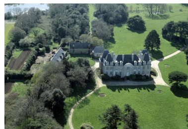
Vue aérienne nord IVR53_19945600428ZA