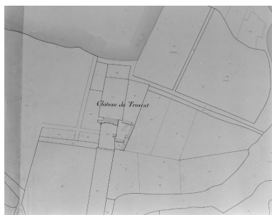
Château, extrait cadastral 1828, section AI., IVR53_19935600225X