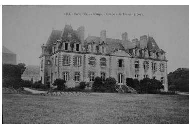
Vue de la façade principale