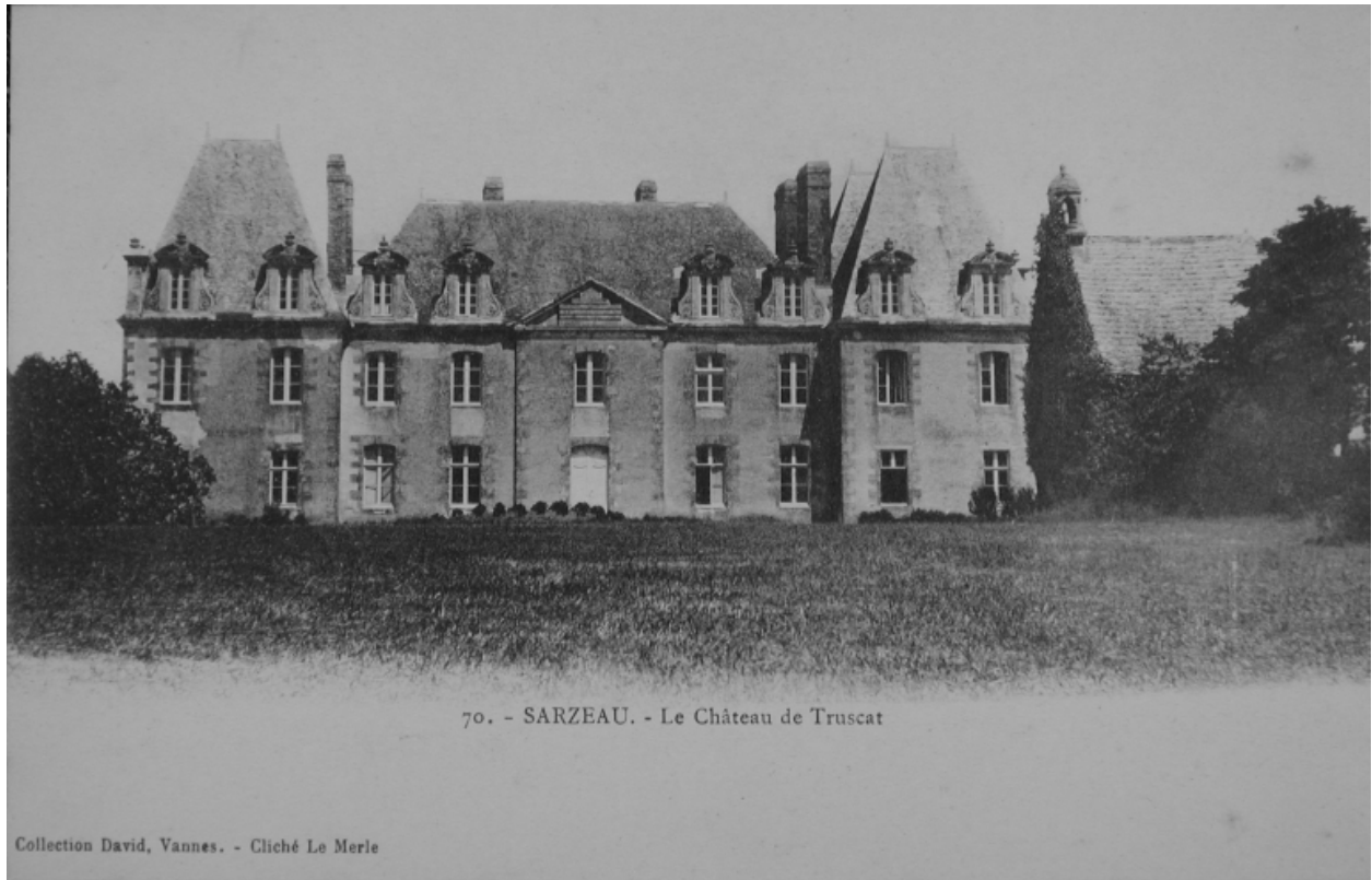
Vue de la façade postérieure