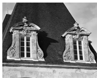
Château, pavillon sud- est. Elévation sud, lucarnes.