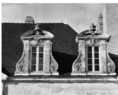
Château, corps principal. Elévation sud, lucarnes. IVR53_19935602339X