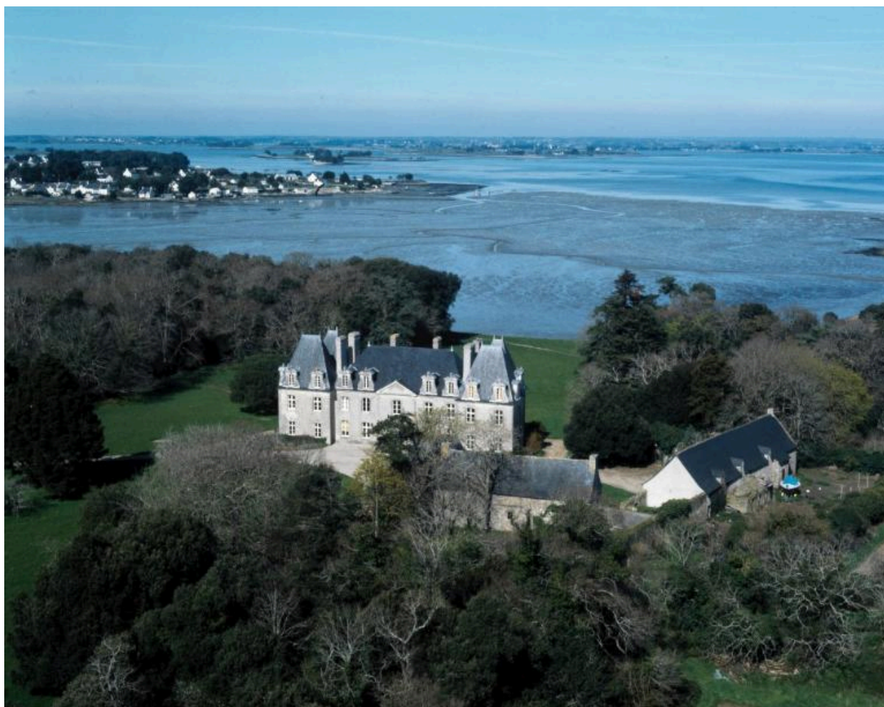
Vue aérienne sud-est.