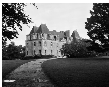
Château, vue générale sud-ouest. IVR53_19935602315X