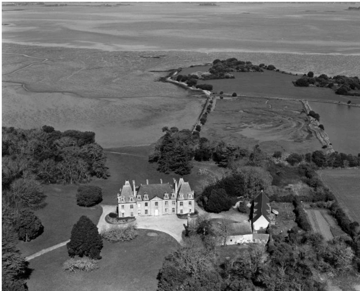
Vue aérienne sud.