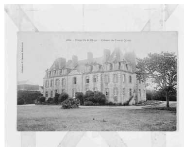
Château, vue générale, château de Truscat (1702). (reproduction carte postale ancienne, vol. 4 Morbihan). IVR53_19935600203X