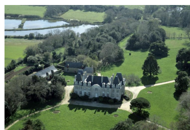
Vue aérienne nord IVR53_19945600423ZA