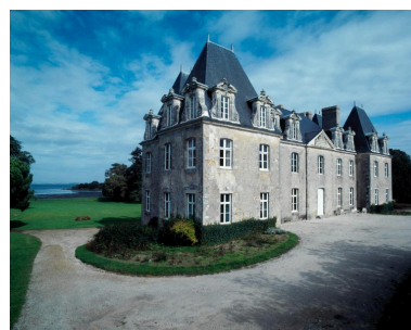
Château, vue générale sud-ouest. IVR53_19935602388XA