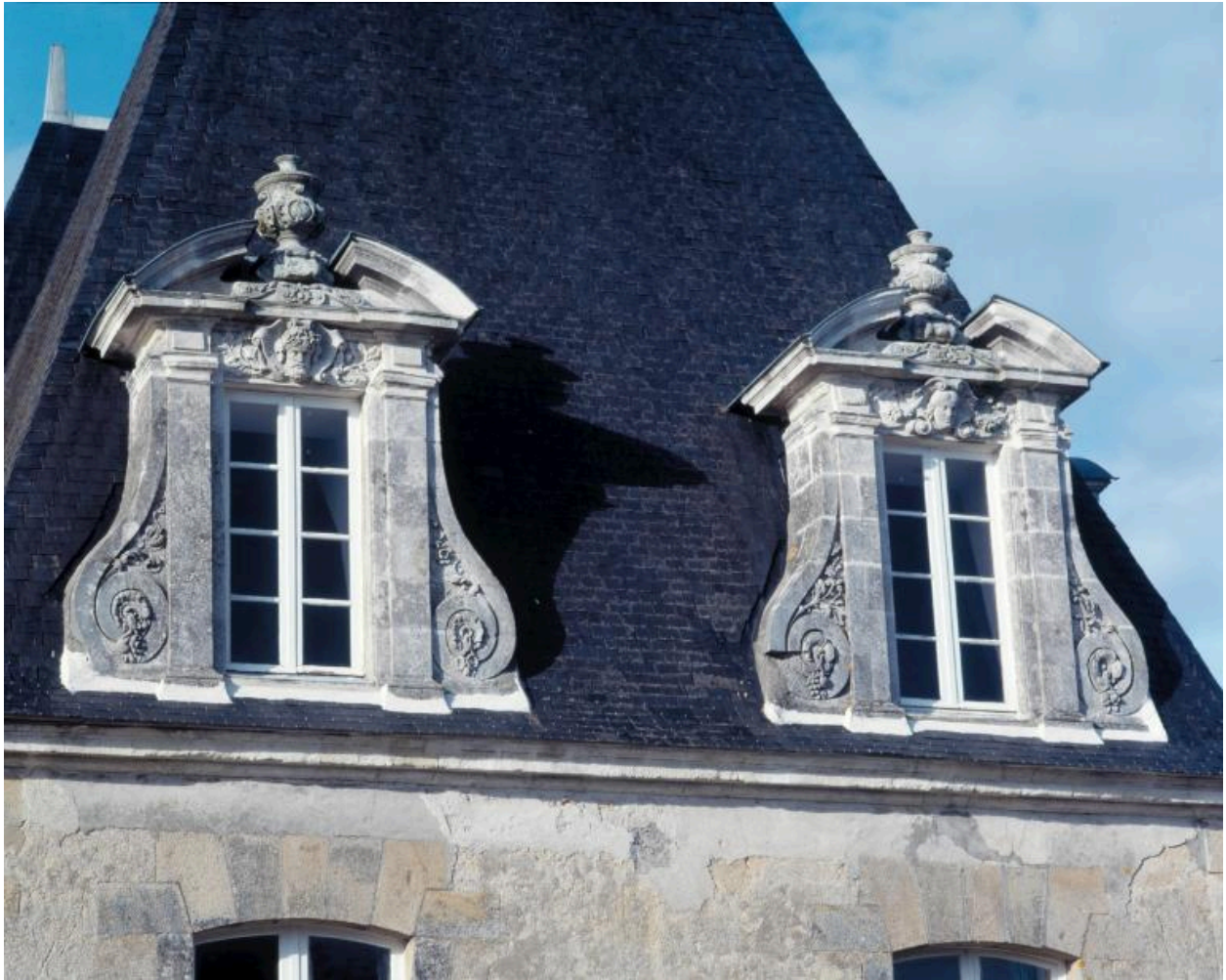
Château, pavillon sud-est. Elévation sud, lucarnes.