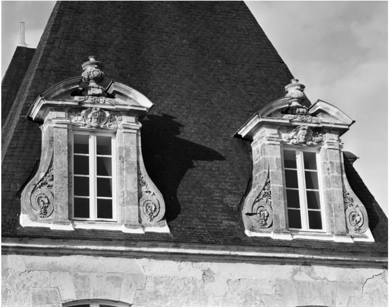
Château, pavillon sud-est. Elévation sud, lucarnes.