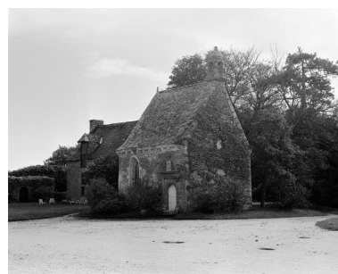
Château, chapelle. Vue nord-ouest. IVR53_19935602317X