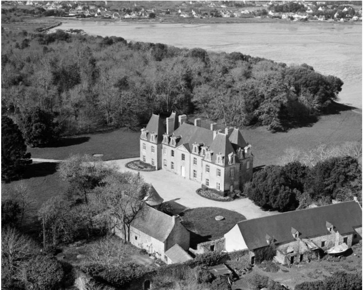
Vue aérienne sud-est.