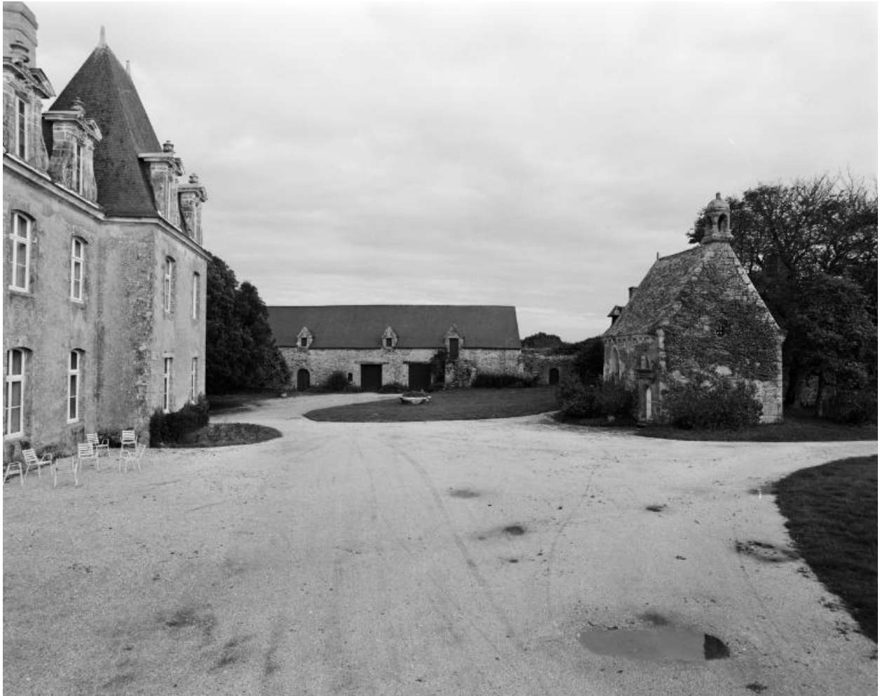
Château, communs et chapelle. Vue prise de l'ouest.