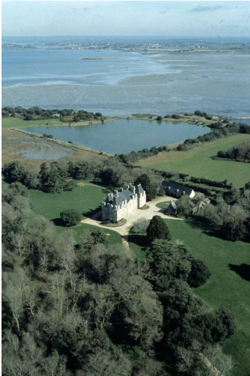
Vue aérienne sud-ouest