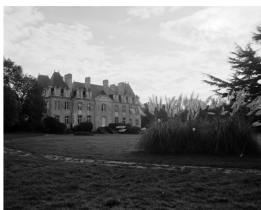
Château, vue générale nord. IVR53_19935602336X