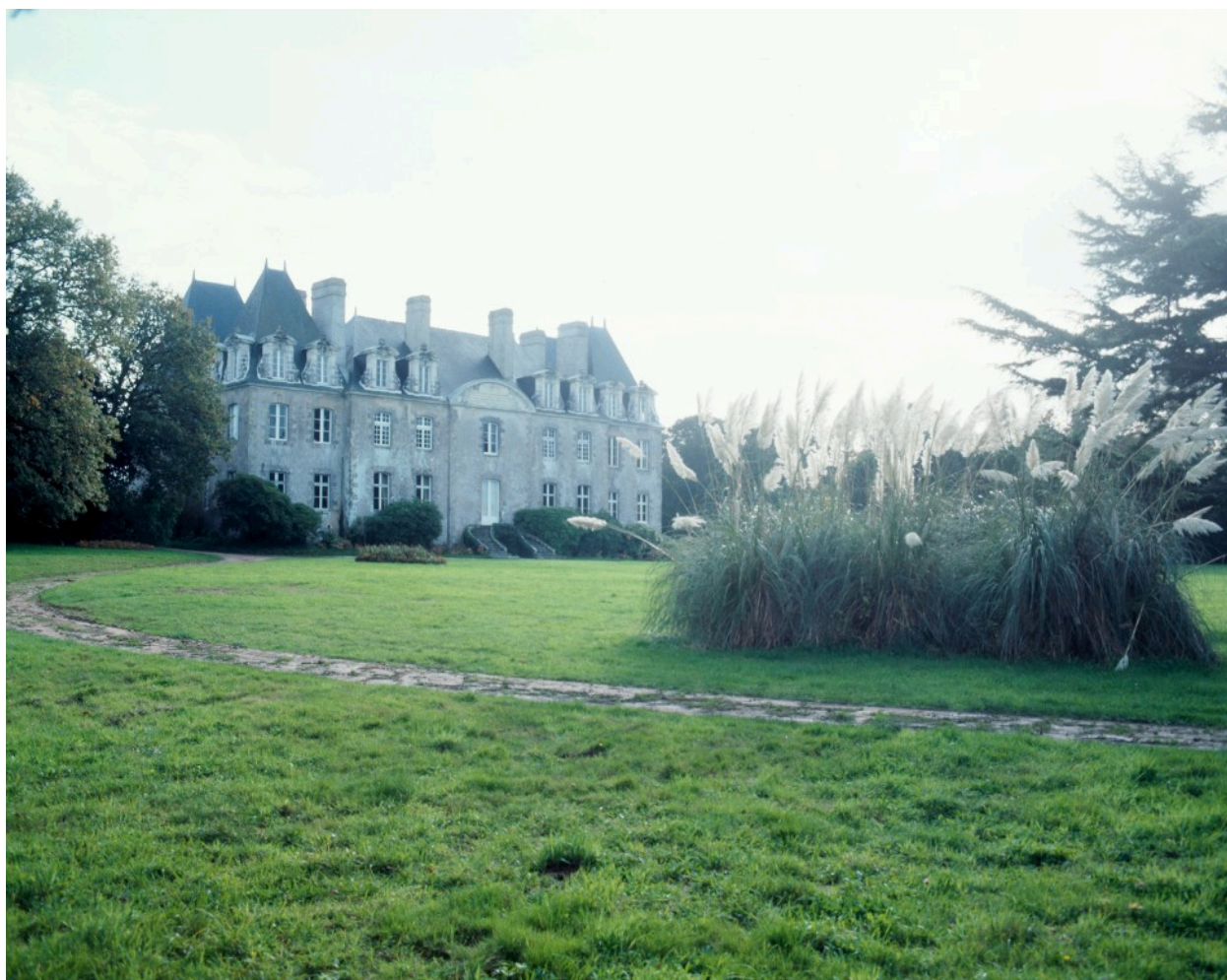
Château, vue générale nord.