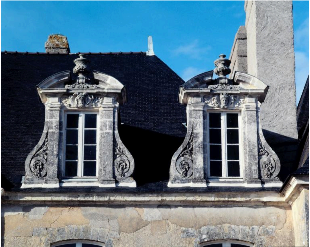
Château, corps principal. Elévation sud, lucarnes.