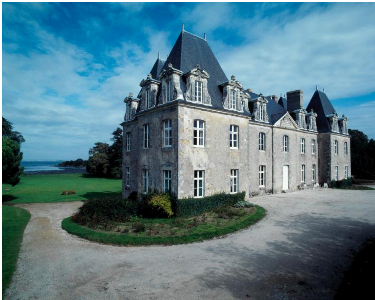
Château, vue générale sud-ouest.