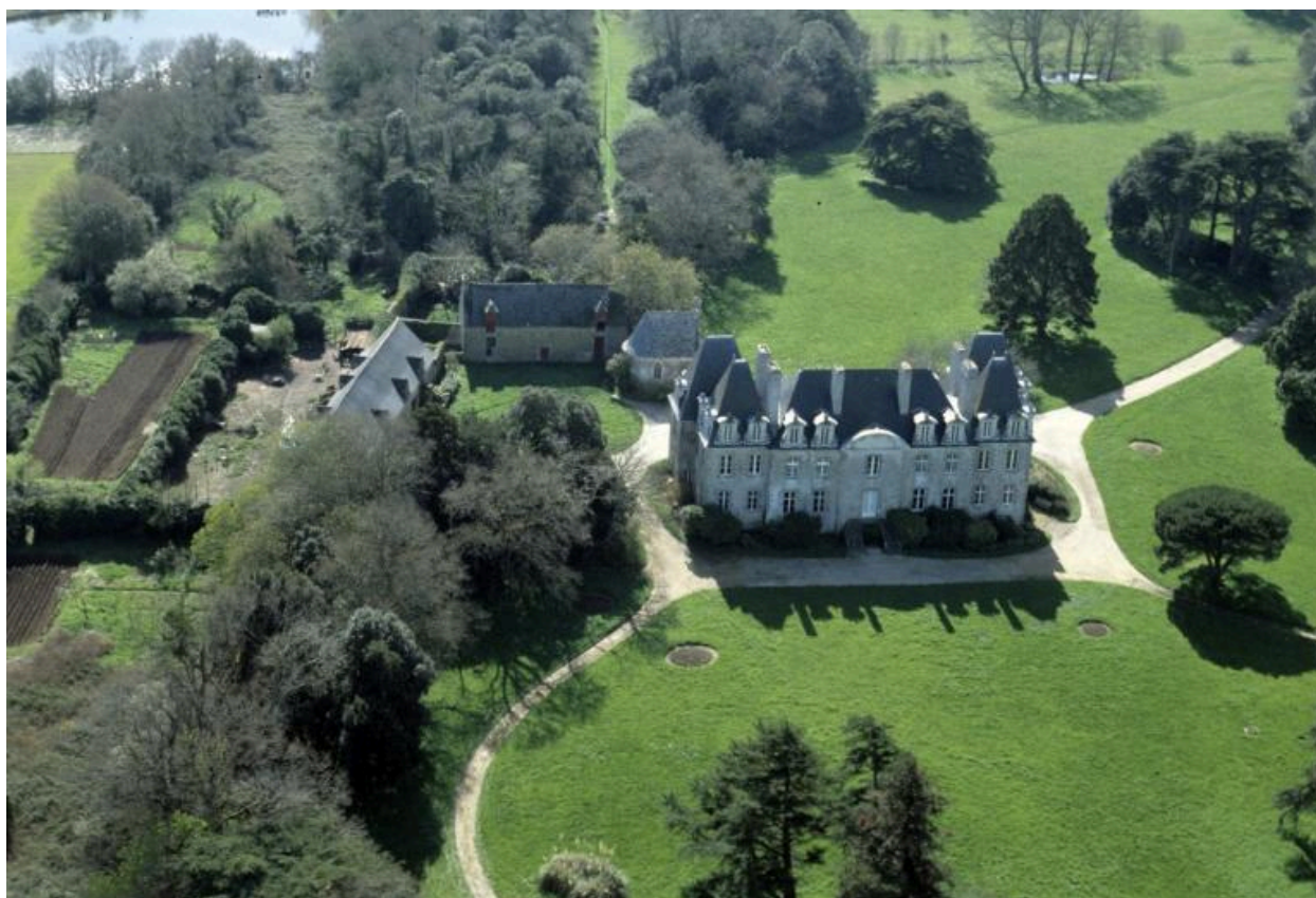
Vue aérienne nord