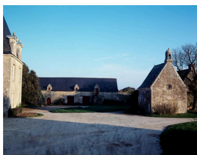
Château, communs et chapelle. Vue prise de l'ouest. IVR53_19935602509XA