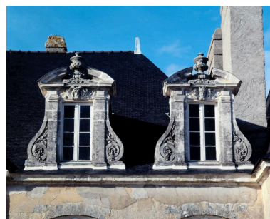
Château, corps principal. Elévation sud, lucarnes. IVR53_19935602403XA