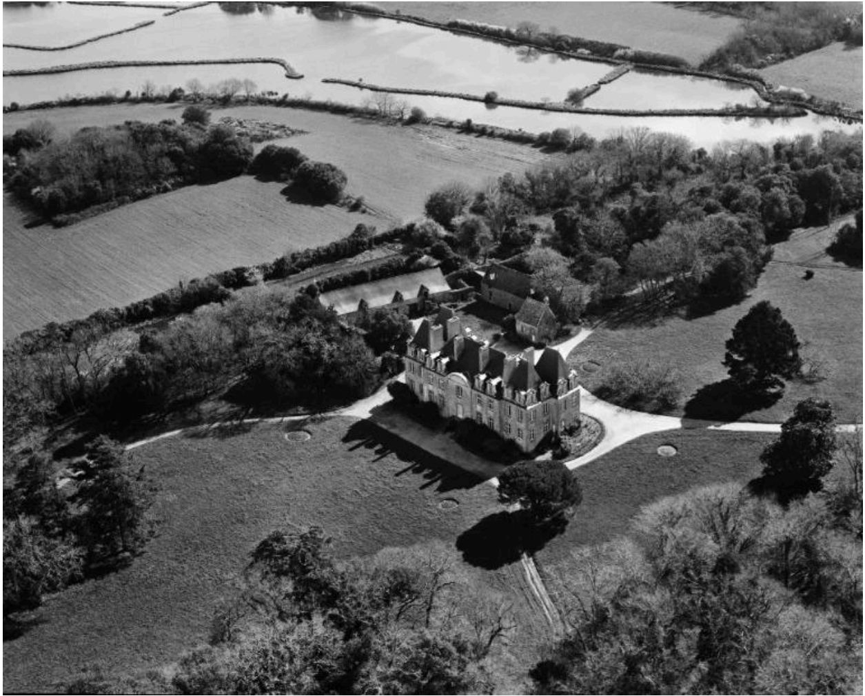
Vue aérienne nord-ouest.