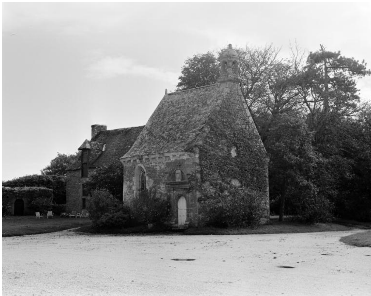
Château, chapelle. Vue nord-ouest.