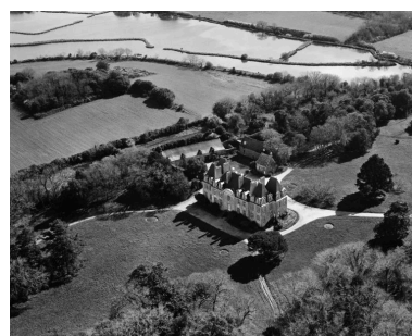
Vue aérienne nord-ouest.