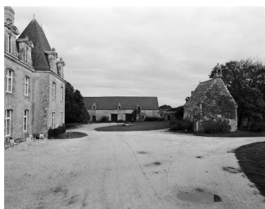
Château, communs et chapelle. Vue prise de l'ouest. IVR53_19935602328X