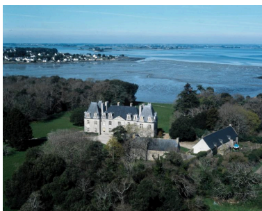
Vue aérienne sud-est. IVR53_19945600410XA