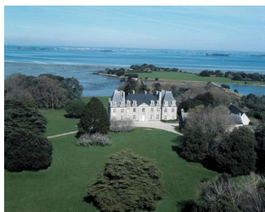
Vue aérienne sud. IVR53_19945600411XA