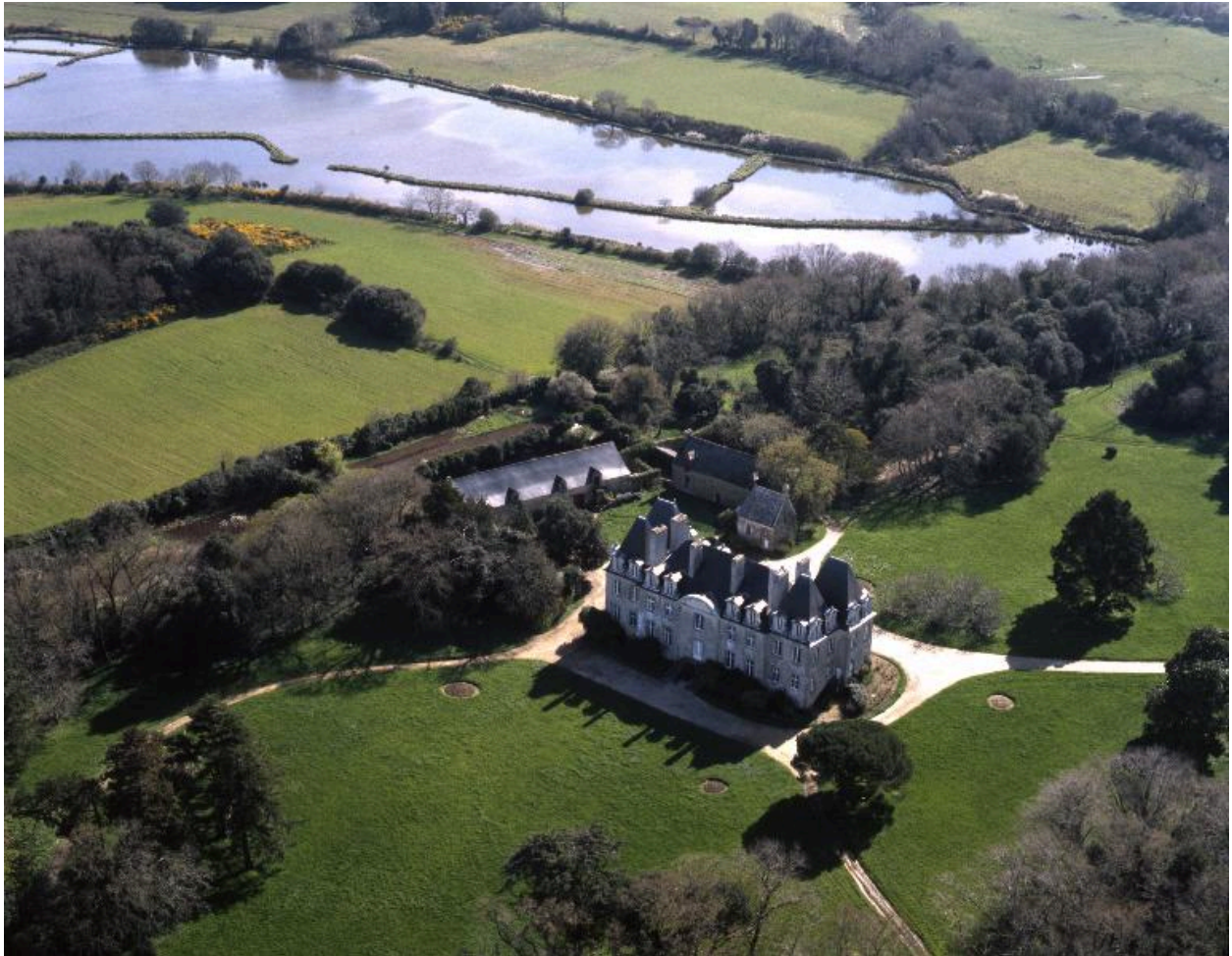
Château, vue aérienne nord-ouest.