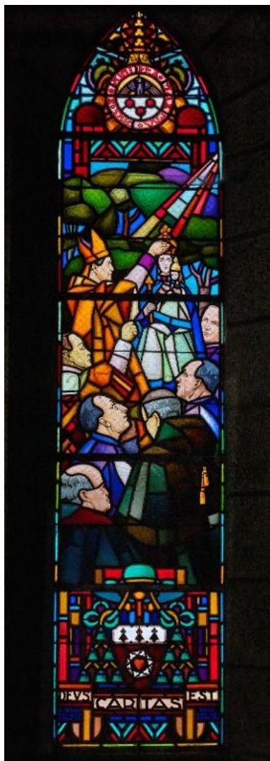
Mur nord du porche