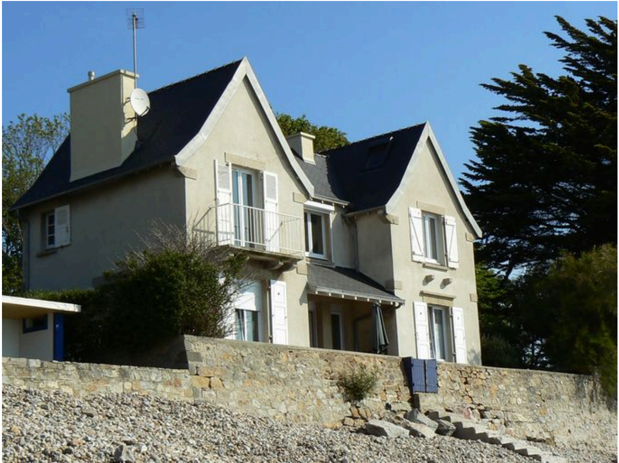
Vue générale de la villa Ker Bili, côté plage