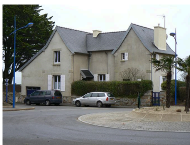
Vue arrière de la villa Ker Bili, côté terre