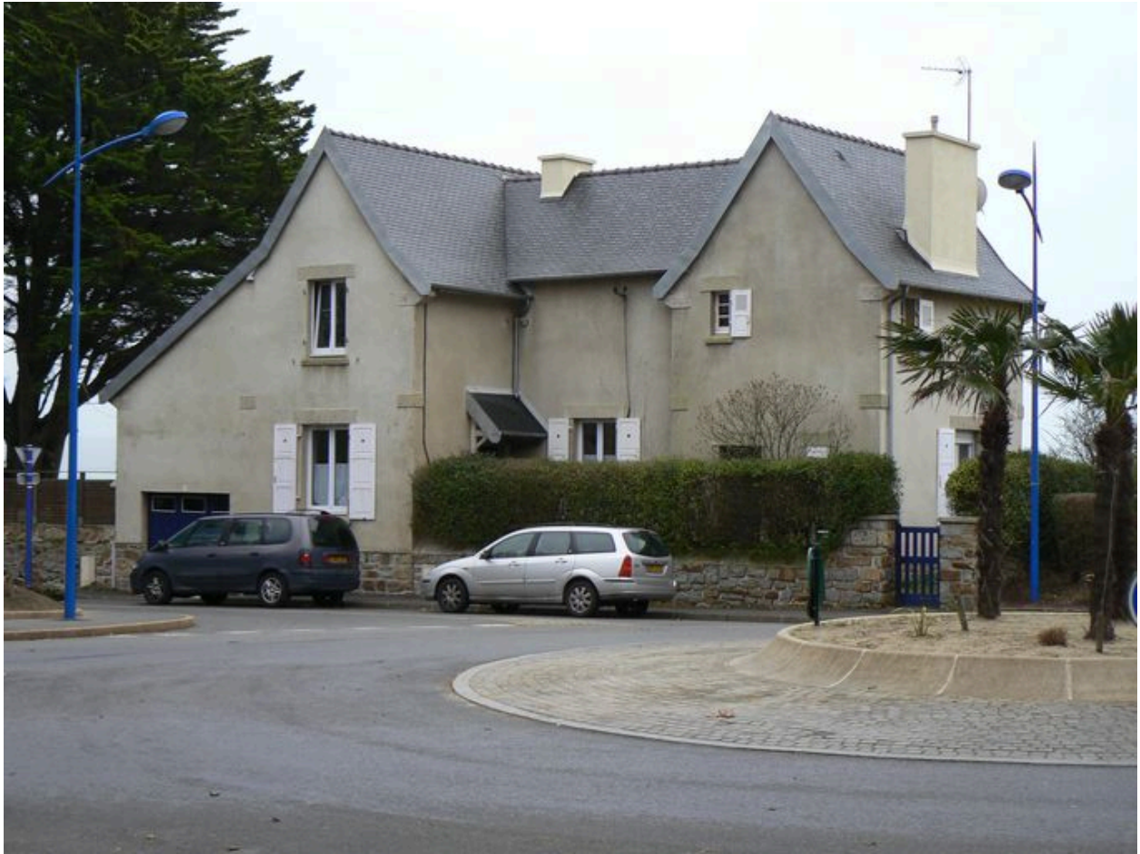
Vue arrière de la villa Ker Bili, côté terre