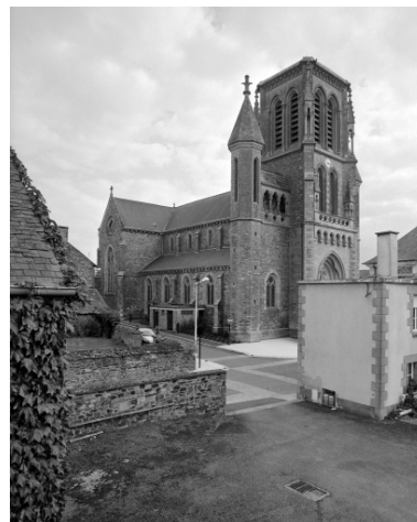
Elévation Nord-Ouest : vue générale IVR53_19943501951X