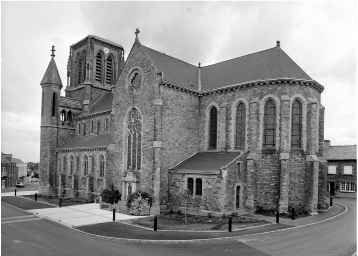
Elévation Sud-Est : vue générale