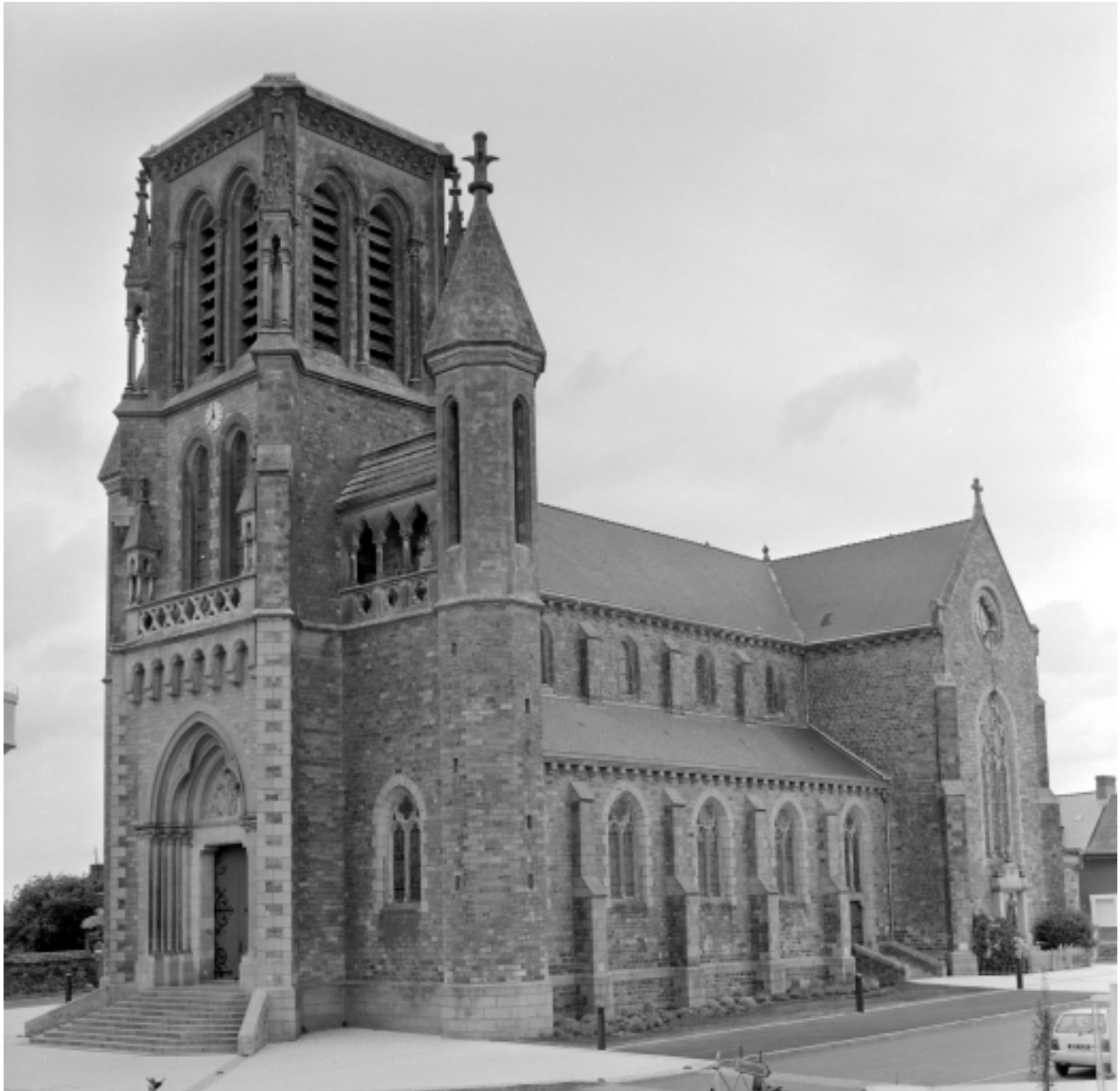
Elévation Sud-Ouest : vue générale