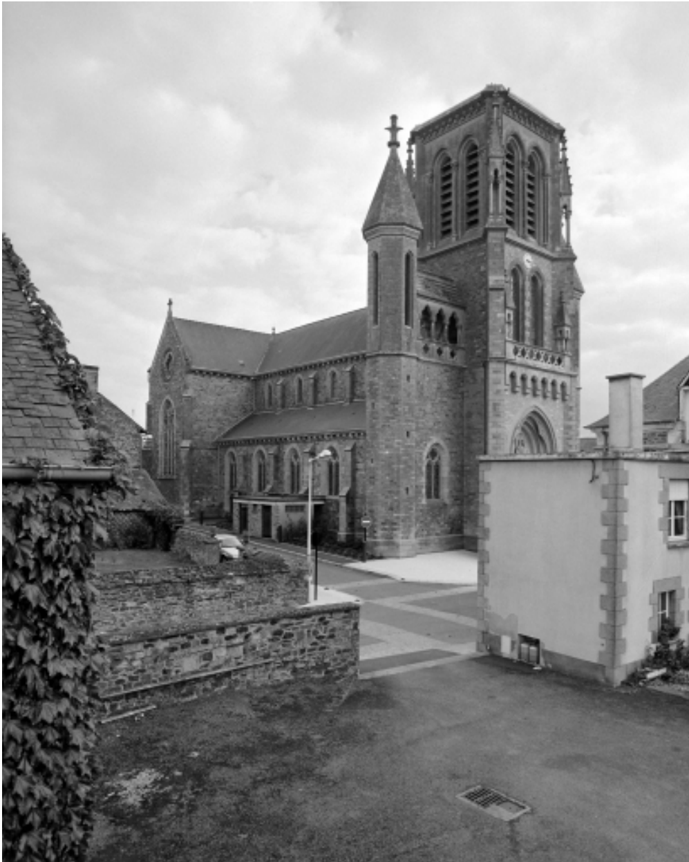
Elévation Nord-Ouest : vue générale