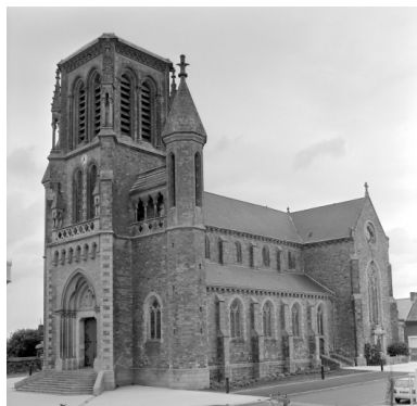
Elévation Sud-Ouest : vue générale IVR53_19943501333X