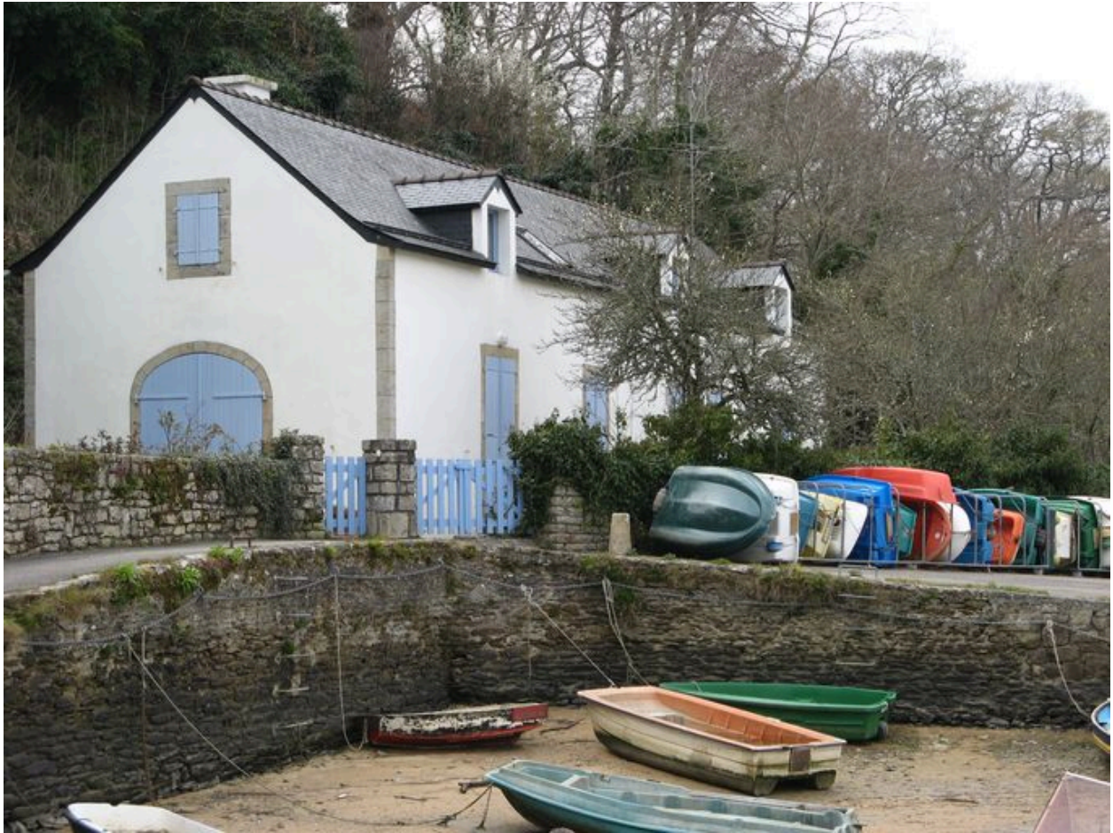
Ancienne remise Polignac et quai Polignac