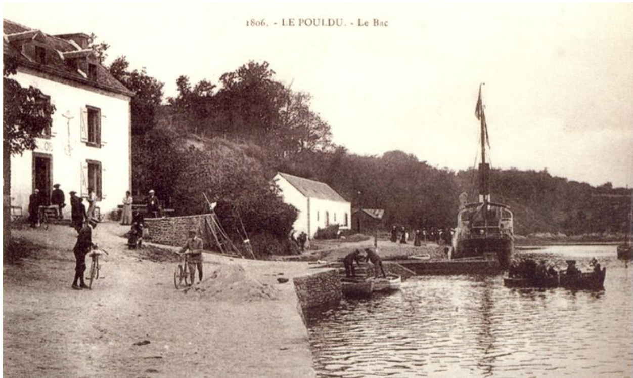
Le port du Pouldu au début du 20e siècle, avec remise Polignac en arrière-plan