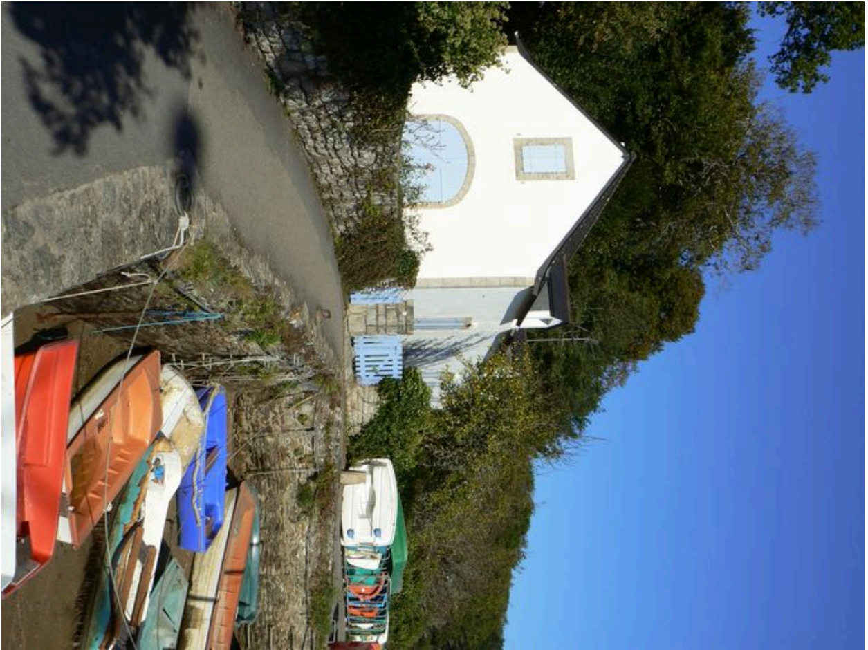
Port du Pouldu et ancien magasin Polignac