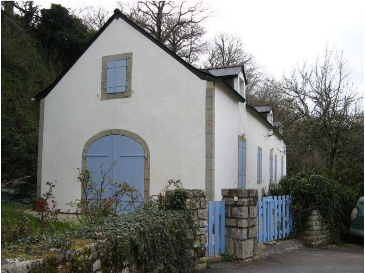
Vue générale de l'ancien magasin Polignac