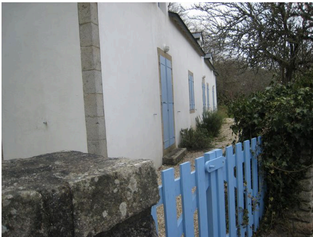
Façade est de l'ancienne remise Polignac