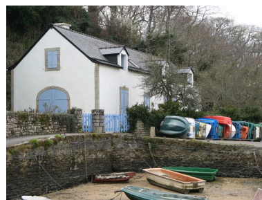
Ancienne remise Polignac et quai Polignac