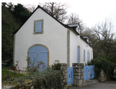
Vue générale de l'ancien magasin Polignac IVR53_20072909095NUCA