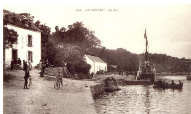
Le port du Pouldu au début du 20e siècle, avec remise Polignac en arrière-plan