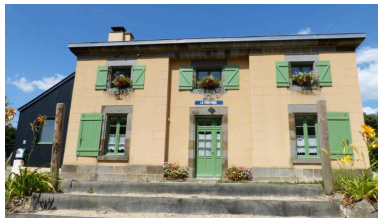
Vue sud IVR53_20243531607NUCA