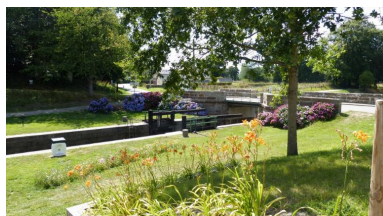
Vue de l'écluse et du pont