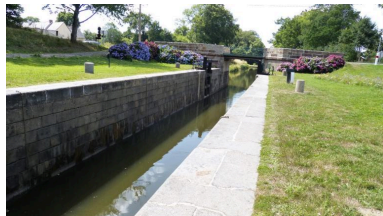
Vue vers l'ouest IVR53_20243531606NUCA