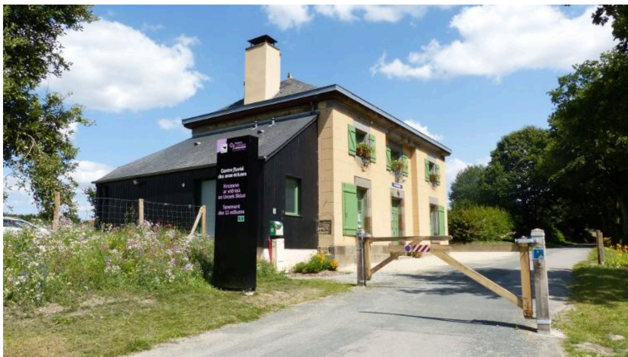
Vue sud ouest