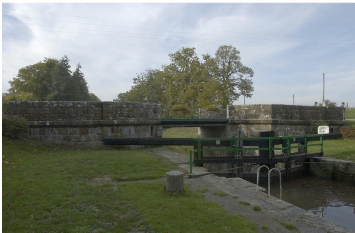
Vue générale de l'écluse et du pont