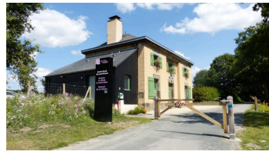
Vue sud ouest IVR53_20243531609NUCA