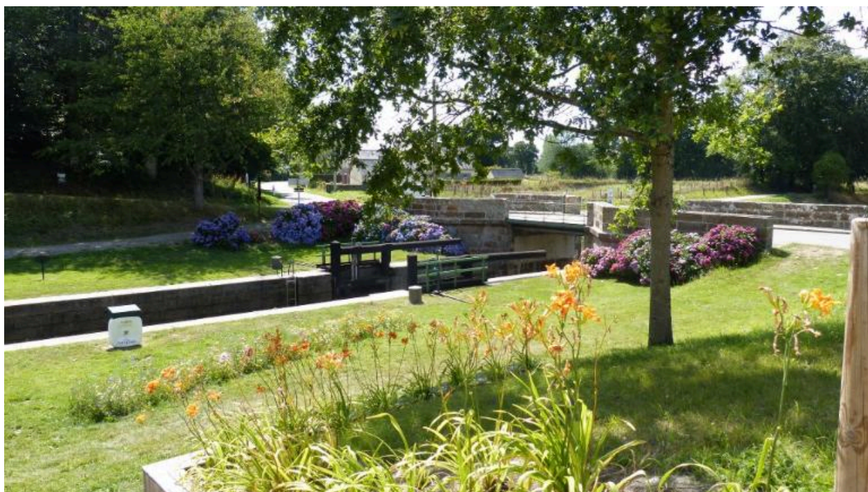
Vue de l'écluse et du pont