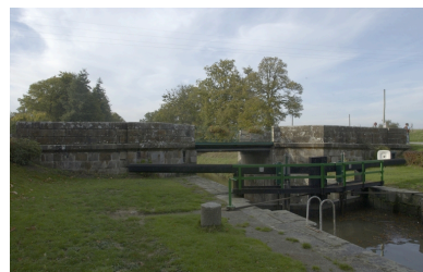
Vue générale de l'écluse et du pont IVR53_20053502972NUCA