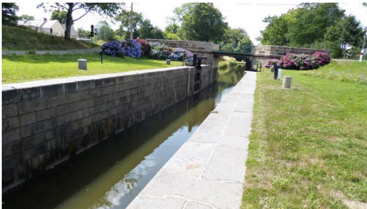
Vue vers l'ouest