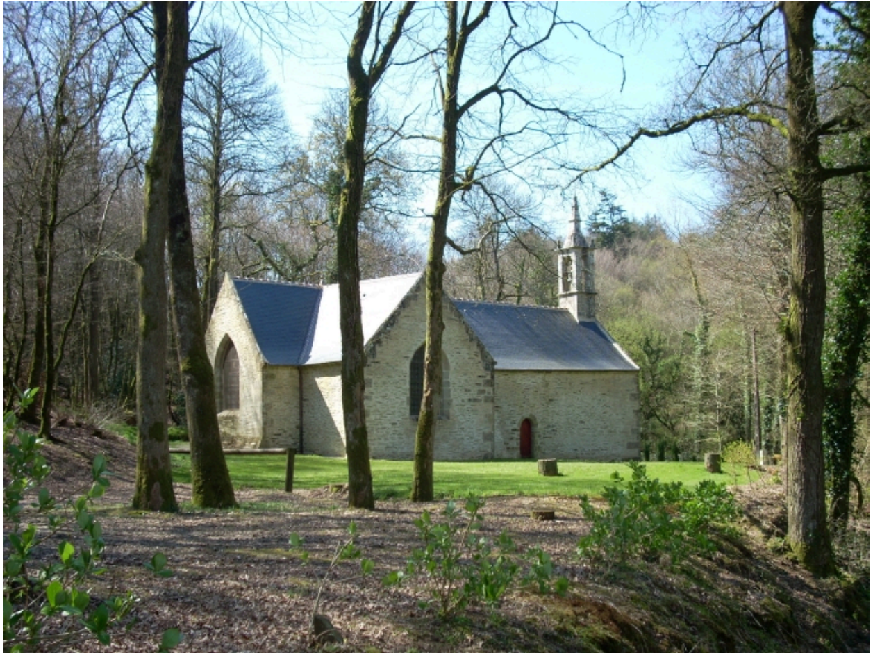
Saint-Thois, chapelle Saint-Laurent : vue générale nord-est