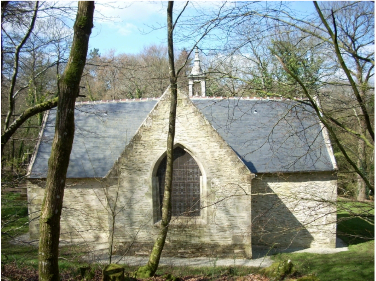
Saint-Thois, chapelle Saint-Laurent : élévation est