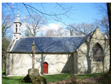
Saint-Thois, chapelle Saint-Laurent : élévation sud