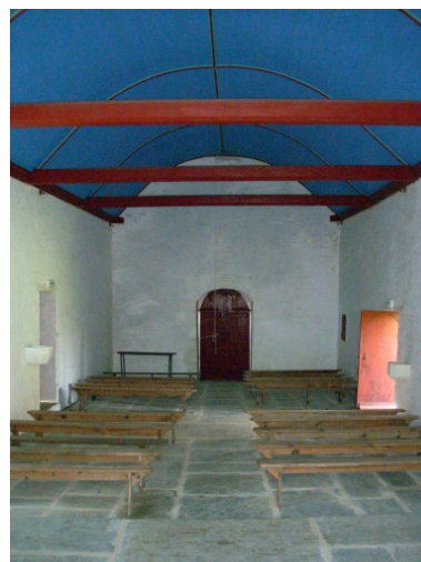
Saint-Thois, chapelle Saint-Laurent : vue axiale ouest IVR53_20082905618NUCA