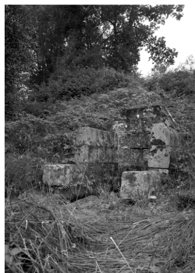
Saint-Thois, chapelle Saint-Laurent : fontaine de dévotion, vue générale, état en 1966 IVR53_19662900144V