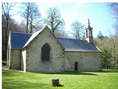
Saint-Thois, chapelle Saint-Laurent : vue générale nord-est IVR53_20082905612NUCA