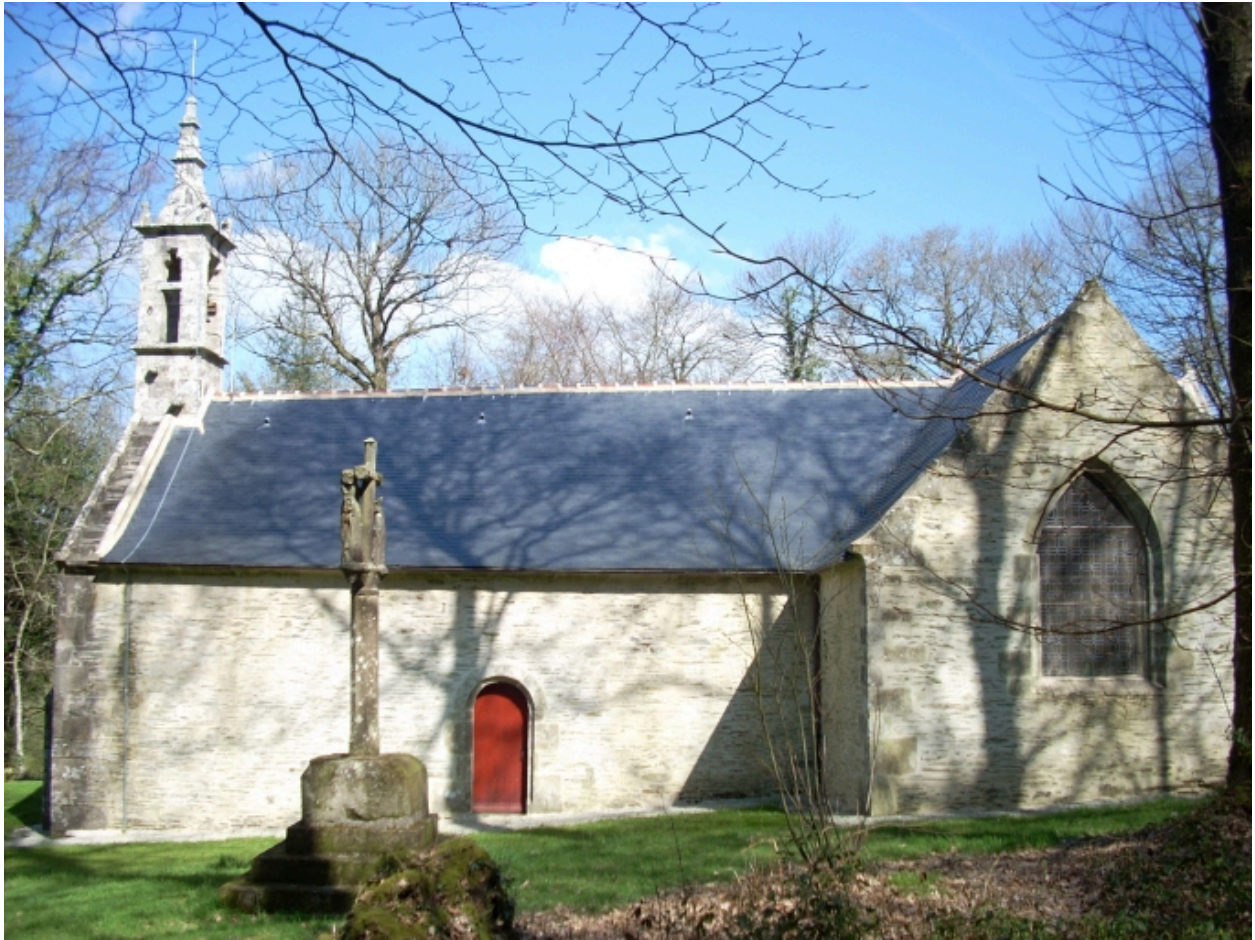
Saint-Thois, chapelle Saint-Laurent : élévation sud