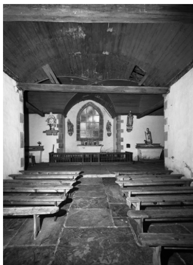
Saint-Thois, chapelle Saint-Laurent : vue générale intérieure vers l'est, état en 1966