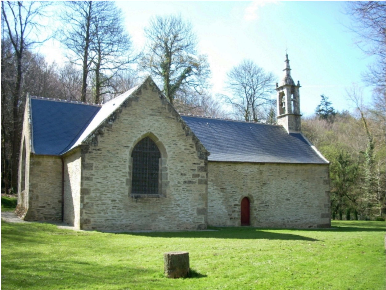
Saint-Thois, chapelle Saint-Laurent : vue générale nord-est