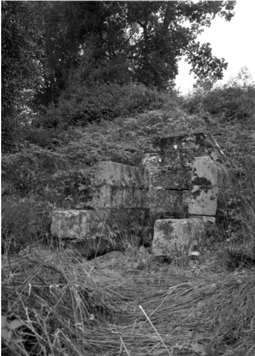
Saint-Thois, chapelle Saint-Laurent : fontaine de dévotion, vue générale, état en 1966