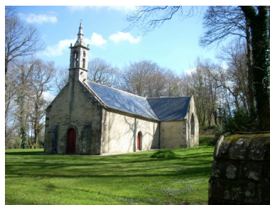
Saint-Thois, chapelle Saint-Laurent : vue générale sud-ouest