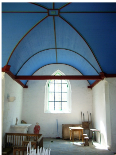
Saint-Thois, chapelle Saint-Laurent : bras sud du transept