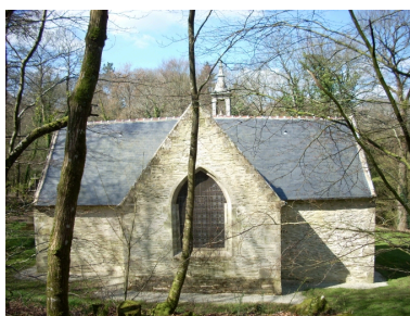
Saint-Thois, chapelle Saint-Laurent : élévation est