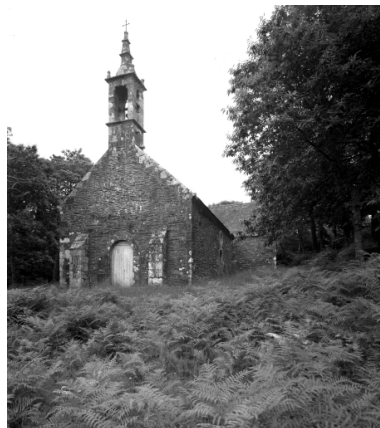
Saint-Thois, chapelle Saint-Laurent : vue générale sud-ouest, état en 1966 IVR53_19662900142V