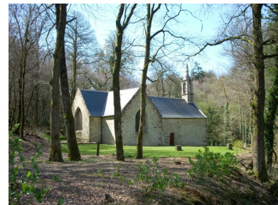
Saint-Thois, chapelle Saint-Laurent : vue générale nord-est