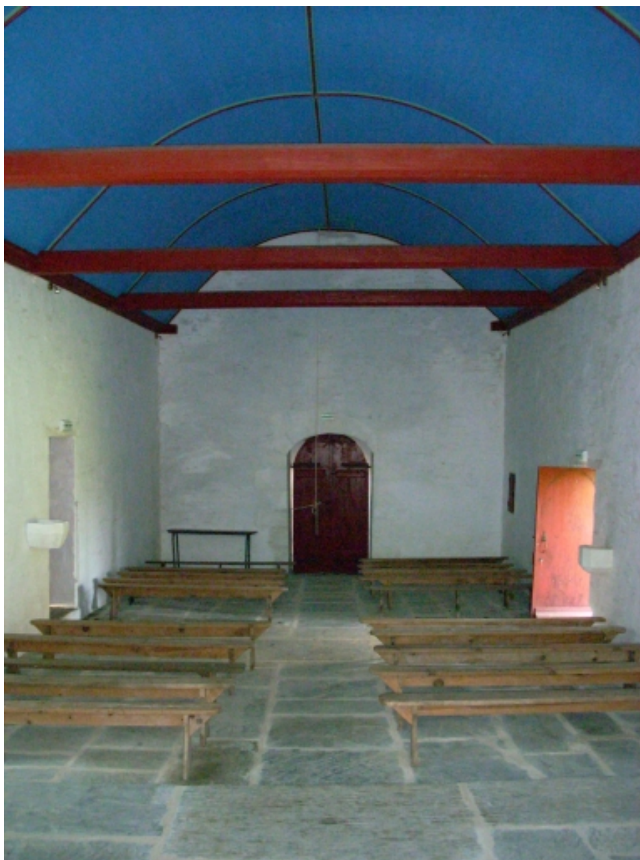
Saint-Thois, chapelle Saint-Laurent : vue axiale ouest