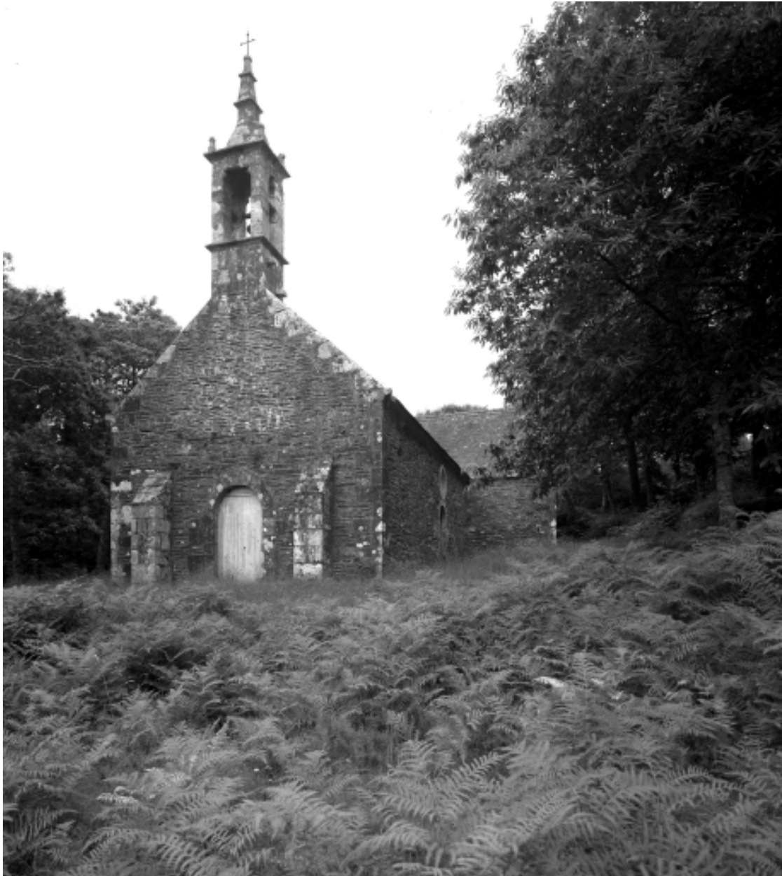
Saint-Thois, chapelle Saint-Laurent : vue générale sud-ouest, état en 1966