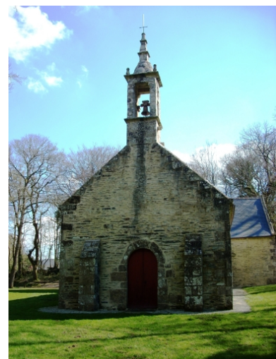
Saint-Thois, chapelle Saint-Laurent : élévation ouest IVR53_20082905614NUCA