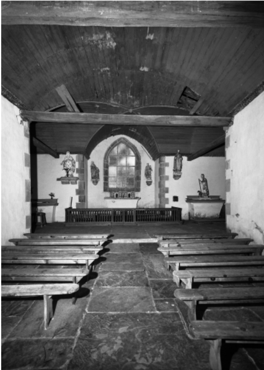
Saint-Thois, chapelle Saint-Laurent : vue générale intérieure vers l'est, état en 1966