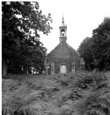
Saint-Thois, chapelle Saint-Laurent : vue générale ouest, état en 1966 IVR53_19662900141V