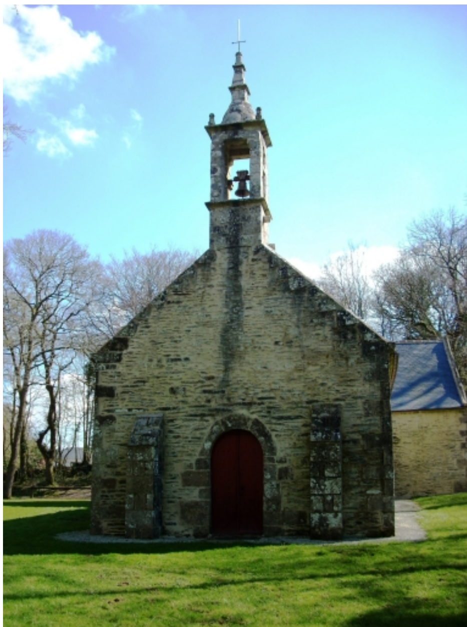
Saint-Thois, chapelle Saint-Laurent : élévation ouest