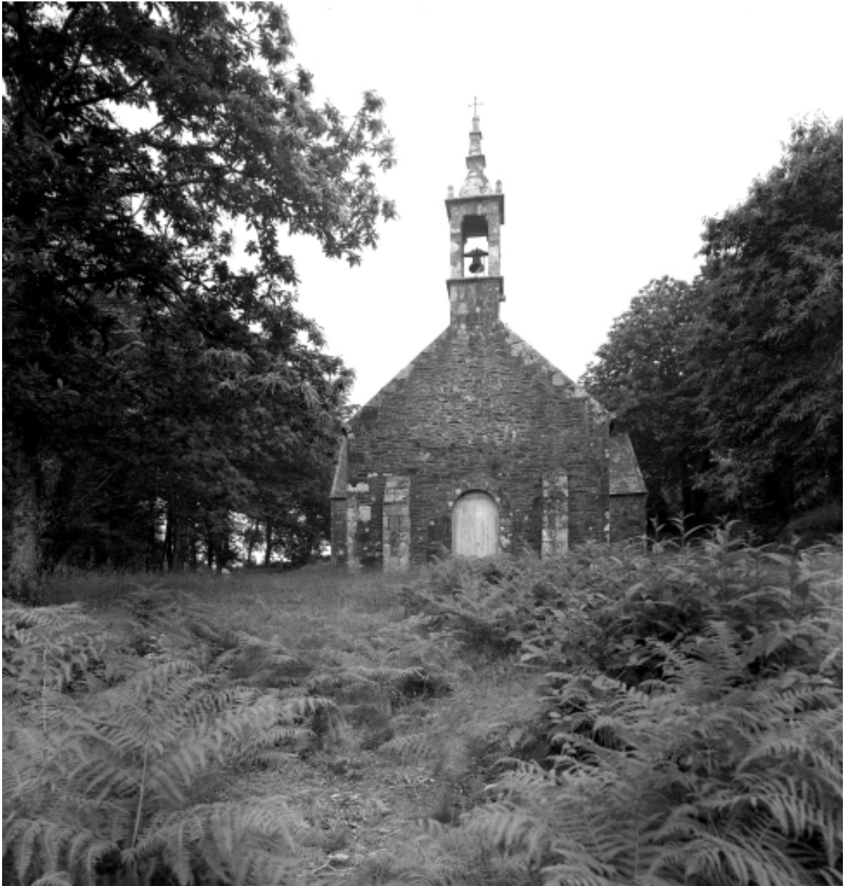
Saint-Thois, chapelle Saint-Laurent : vue générale ouest, état en 1966