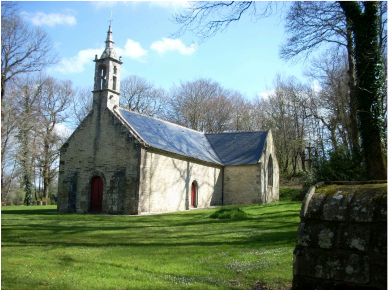
Saint-Thois, chapelle Saint-Laurent : vue générale sud-ouest