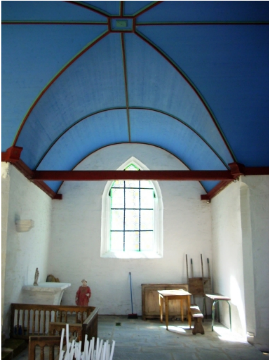
Saint-Thois, chapelle Saint-Laurent : bras sud du transept