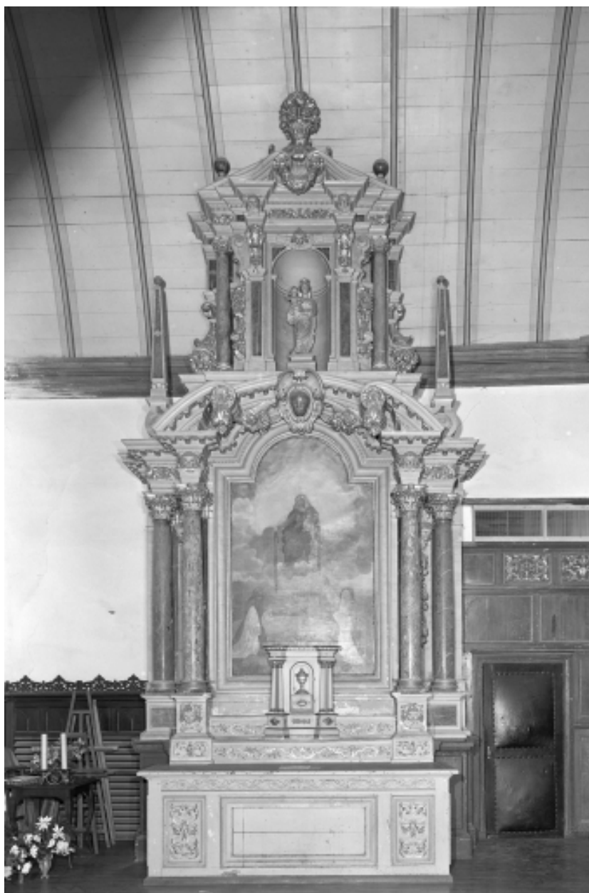
Retable latéral, vue générale.