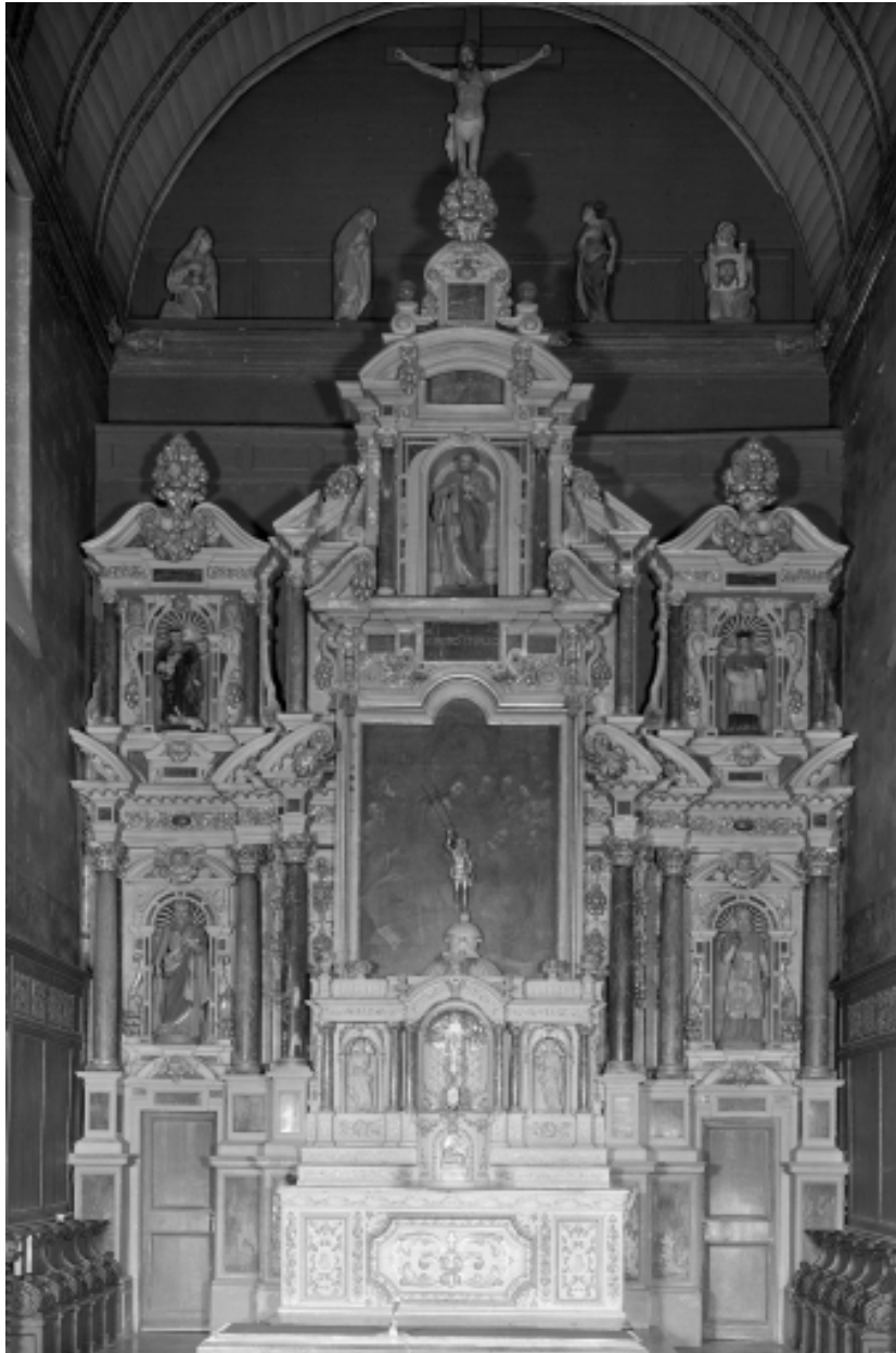
Maître-autel, vue générale.