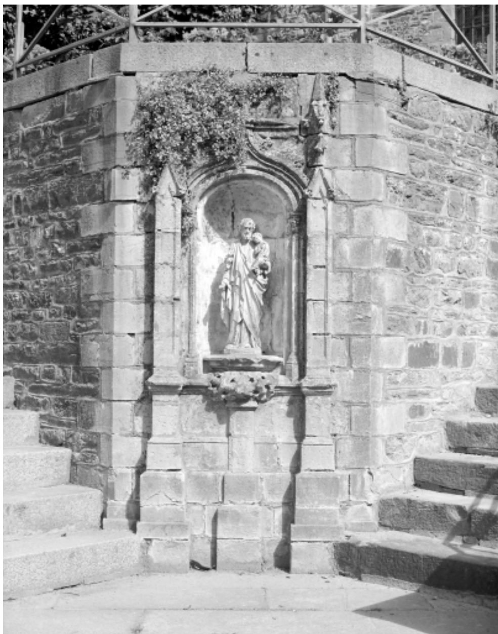
Mur d'enceinte, niche, statue de Saint Joseph : vue générale