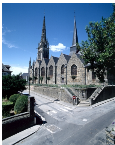
Elévation Nord-Est : vue générale IVR53_19953500324XA