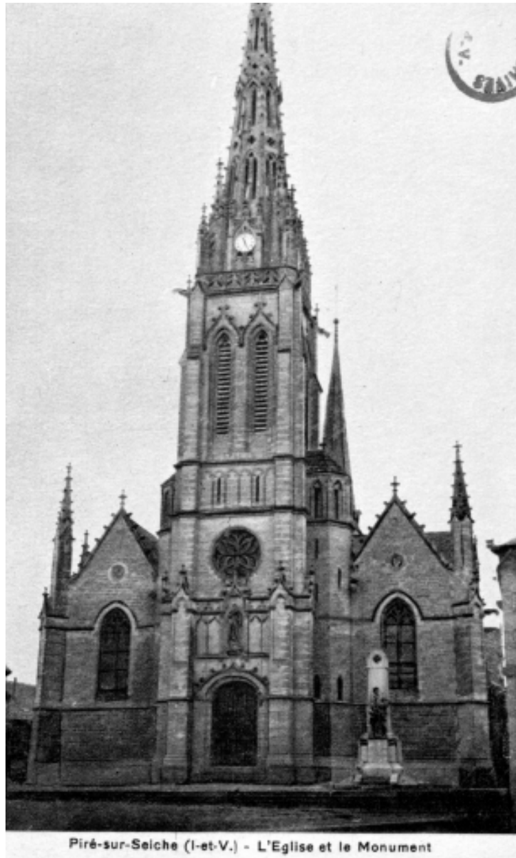
Carte postale ancienne - Elévation Ouest : vue générale.