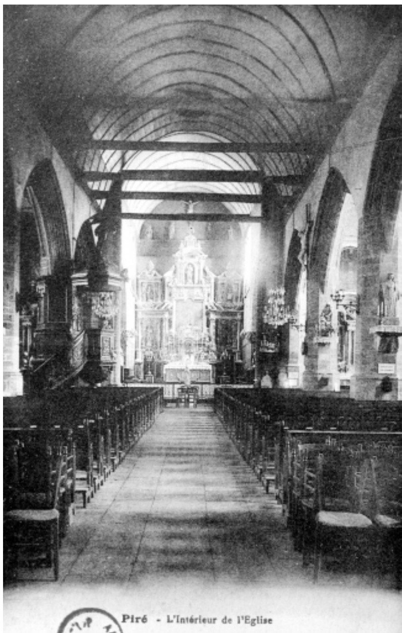
Piré - L'Intérieur de l'Eglise

Carte postale ancienne - Intérieur : vue générale vers le chœur.