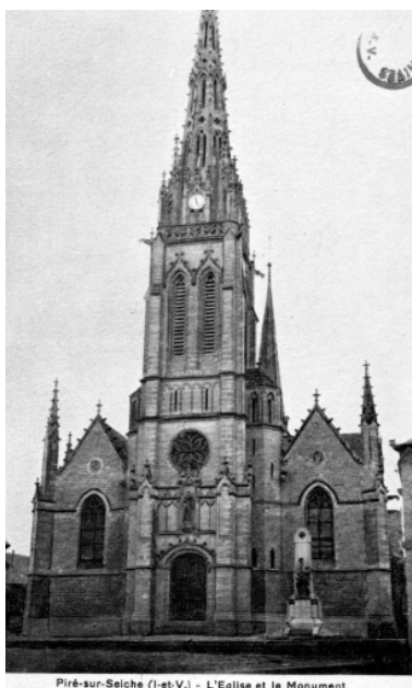
Carte postale ancienne - Elévation Ouest : vue générale. IVR53_19933500825X