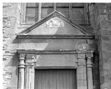
Elévation Sud, porte : détail du tympan