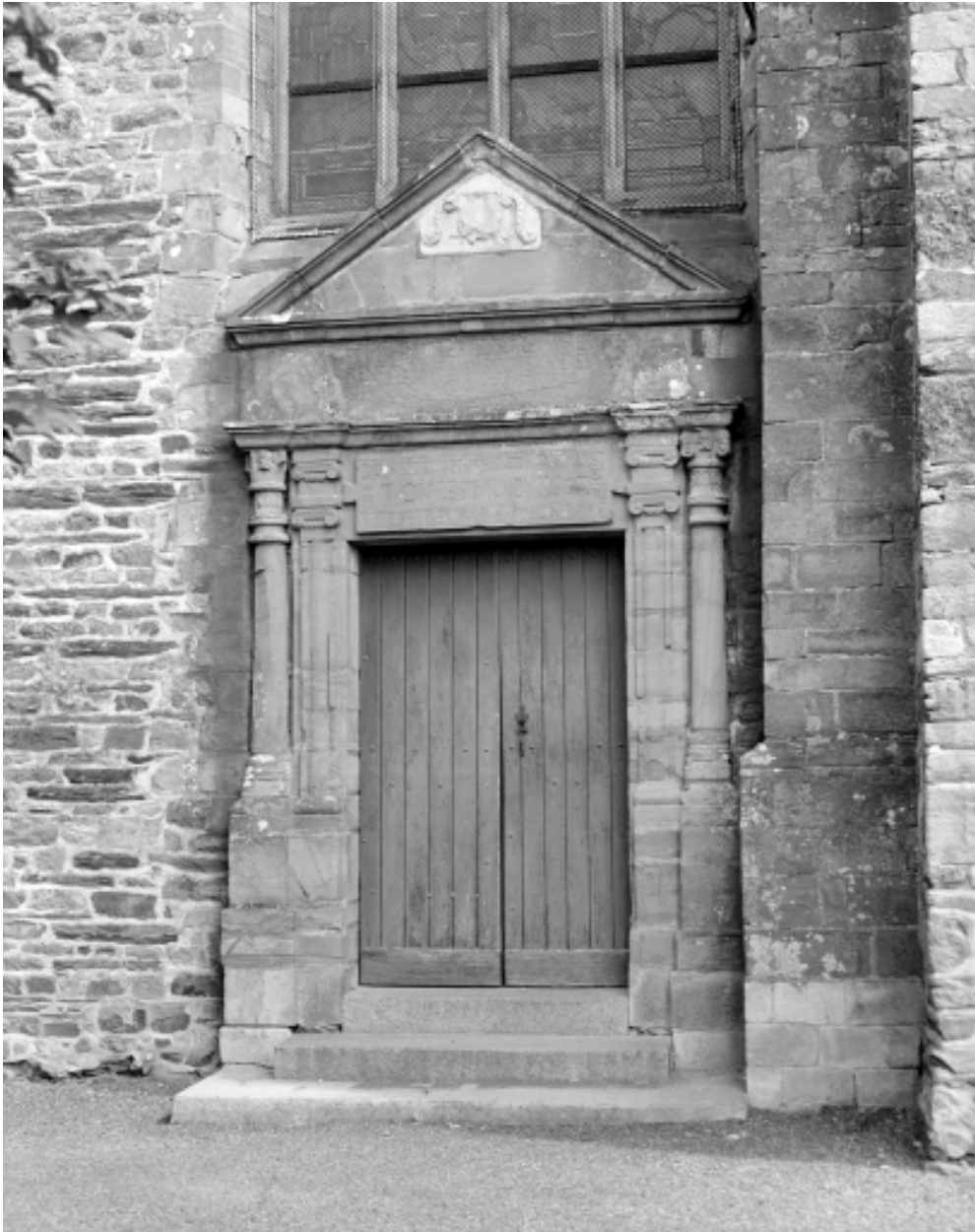
Elévation Sud, porte : vue générale