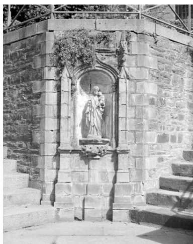
Mur d'enceinte, niche, statue de Saint Joseph : vue générale