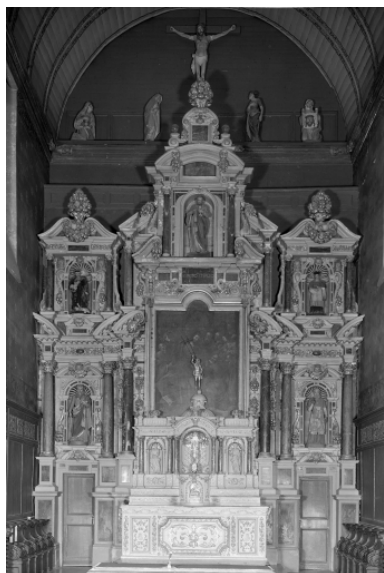
Maître-autel, vue générale. IVR53_19873500123V