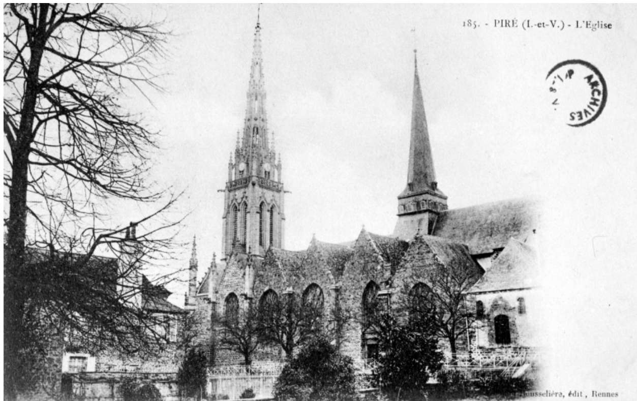
Carte postale ancienne - Elévation Sud : vue générale.