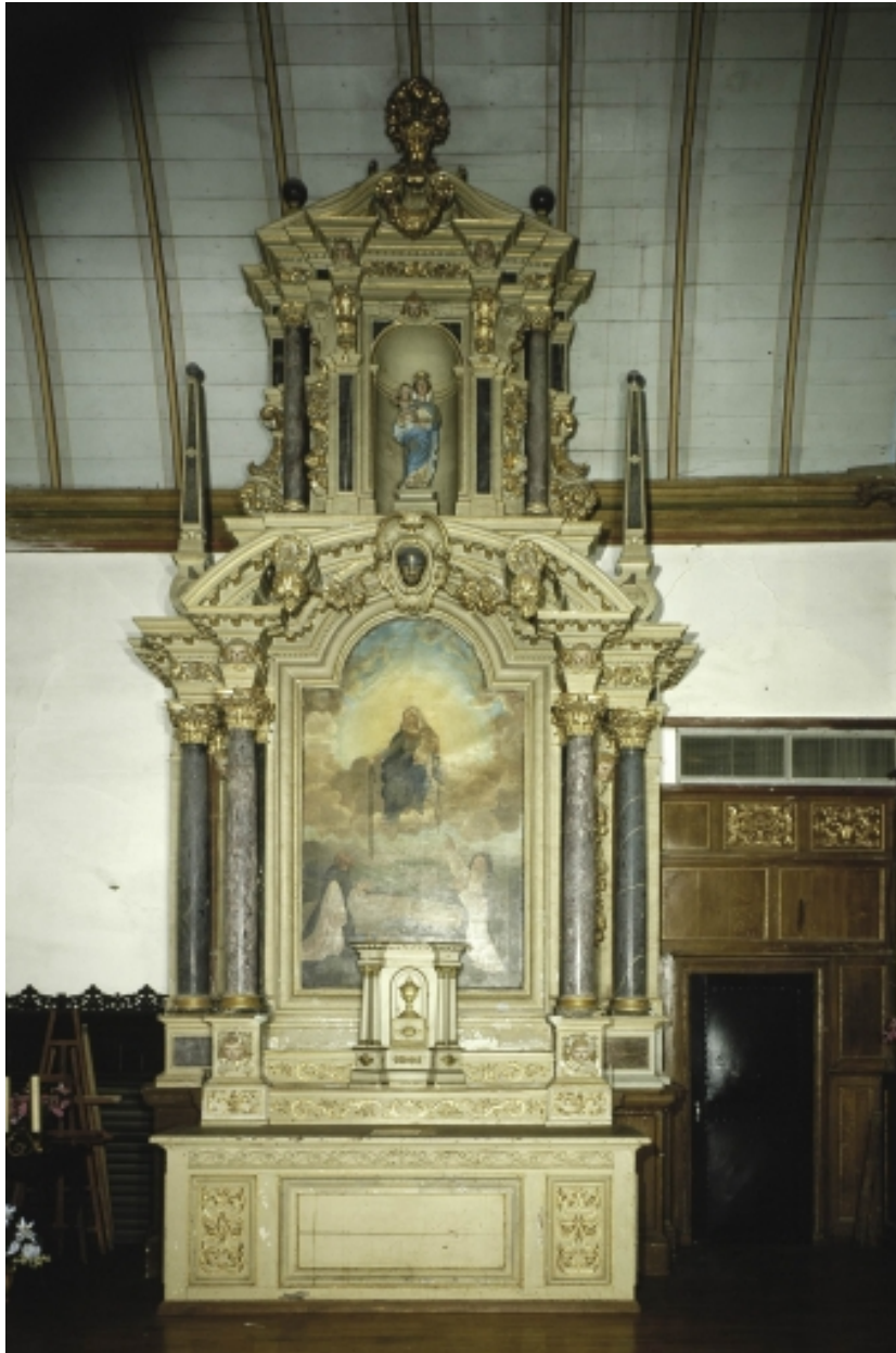
Retable latéral, vue générale.