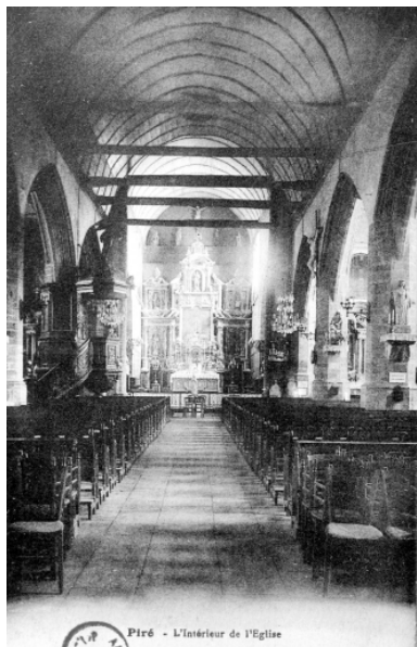
Carte postale ancienne - Intérieur : vue générale vers le chœur. IVR53_19933500827X