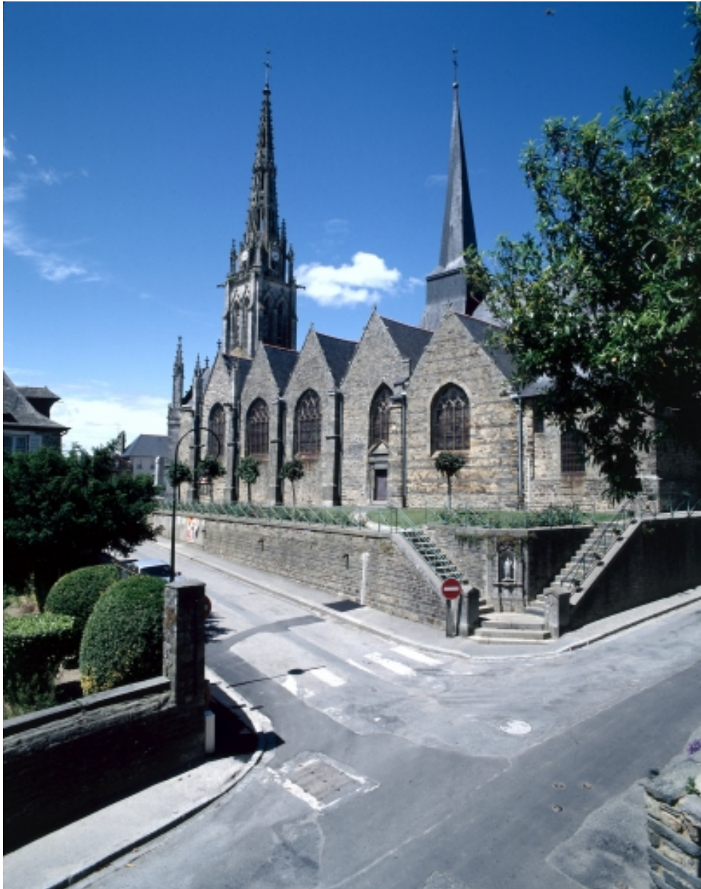
Elévation Nord-Est : vue générale