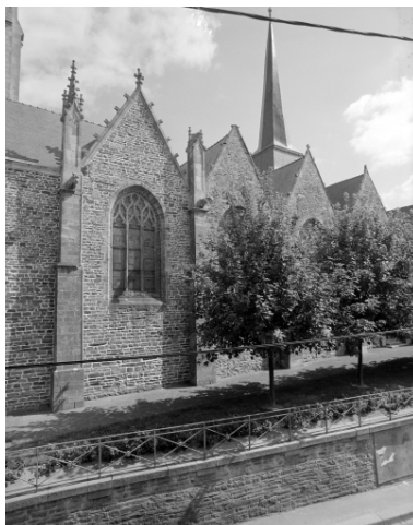
Elévation Nord : vue générale IVR53_19943501340X