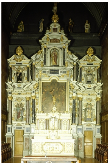
Maître-autel, vue générale. IVR53_19873500125VA