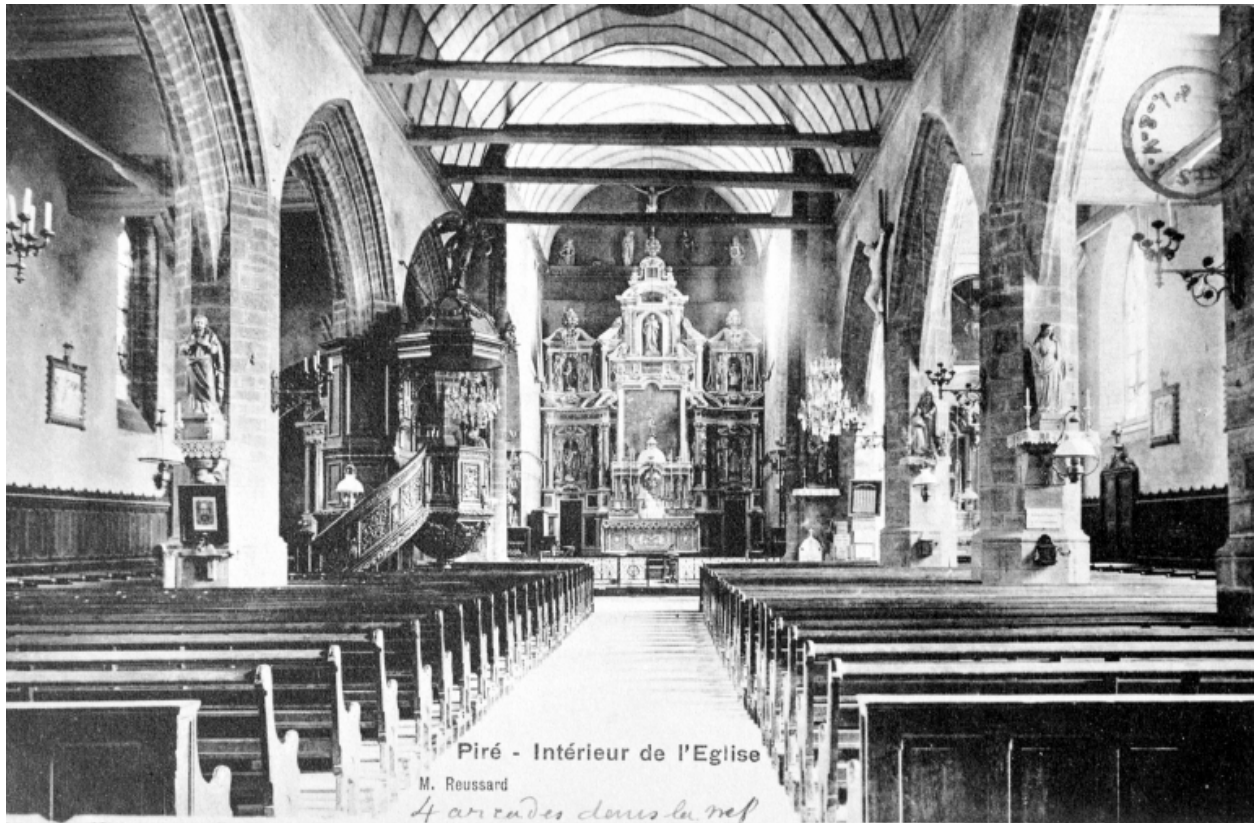
Carte postale ancienne - Intérieur : vue générale vers le chœur.