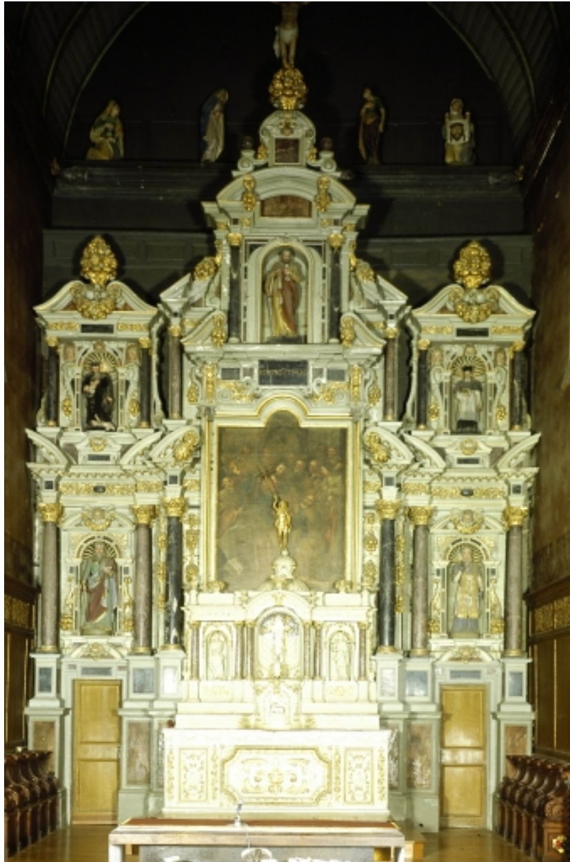
Maître-autel, vue générale.