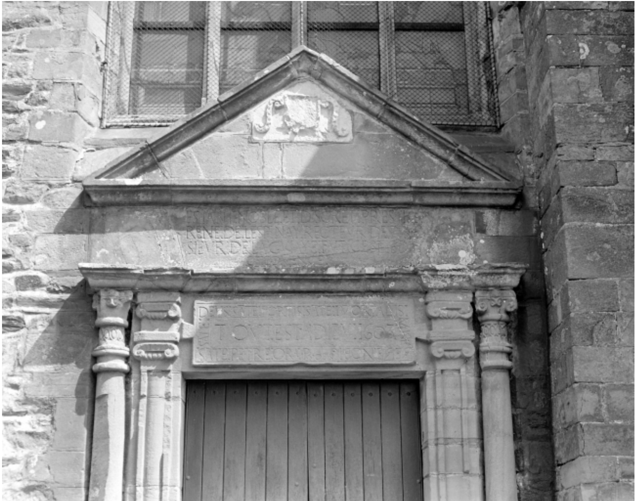
Elévation Sud, porte : détail du tympan