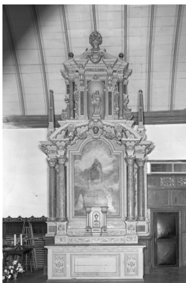
Retable latéral, vue générale.