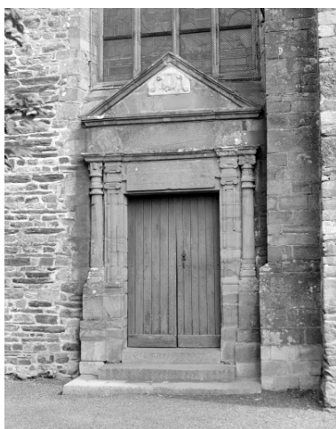
Elévation Sud, porte : vue générale IVR53_19943501341X