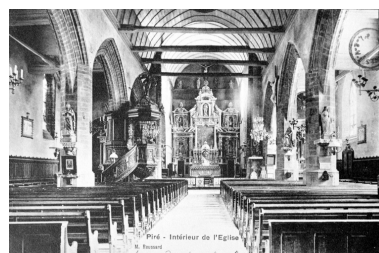
Carte postale ancienne - Intérieur : vue générale vers le choeur. IVR53_19933500826X