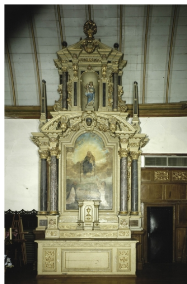
Retable latéral, vue générale.