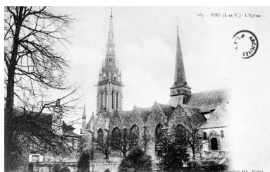
Carte postale ancienne - Elévation Sud : vue générale. IVR53_19933500824X