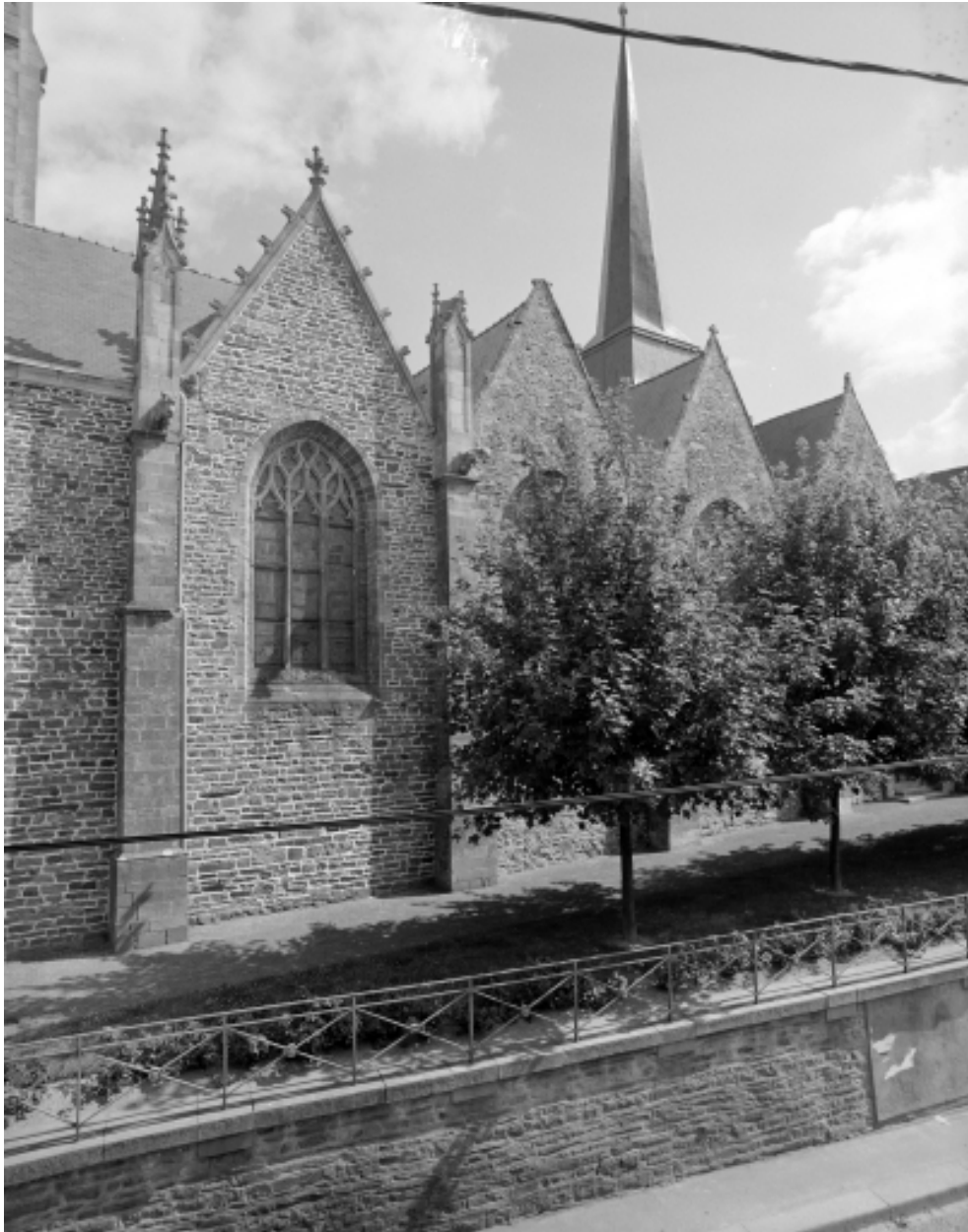
Elévation Nord : vue générale