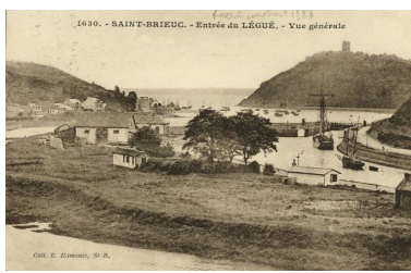
Carte postale. Entrée du Légué.