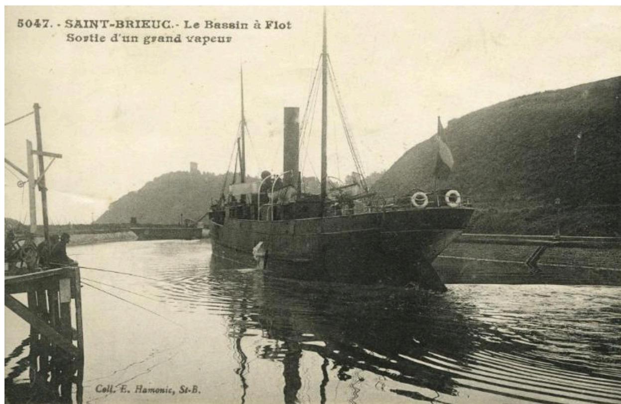
Carte postale. Le bassin à flot, sortie d'un grand vapeur. Ed. Hamonic