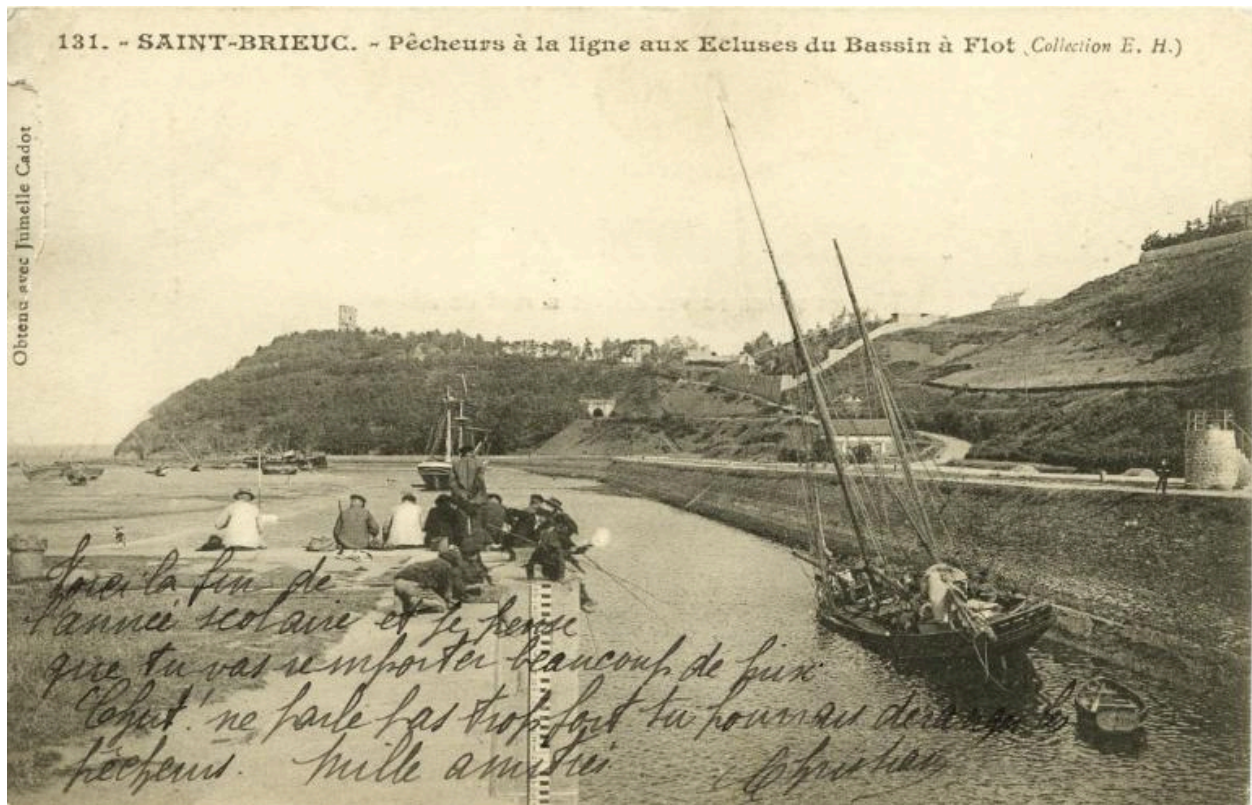
Carte postale. Pêcheurs à la ligne aux écluses. Ed. E.H.