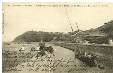
Carte postale. Pêcheurs à la ligne aux écluses. IVR53_20252210706NUCA