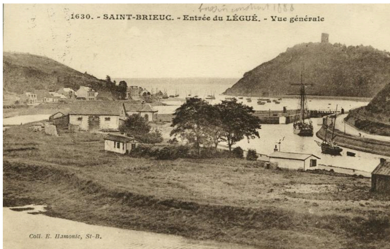
Carte postale. Entrée du Légué. Ed. Hamonic.