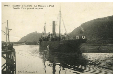
Carte postale. Le bassin à flot, sortie d'un grand vapeur.