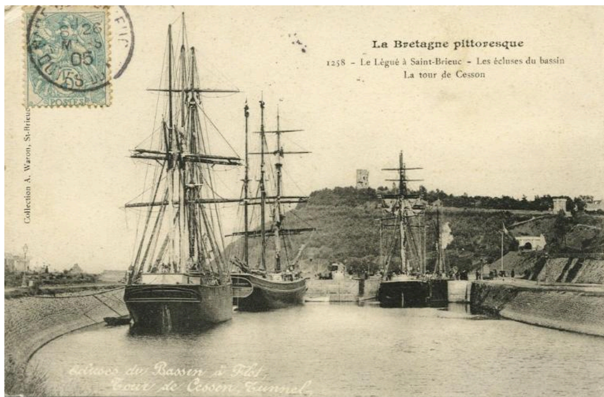
Carte postale. Les écluses du bassin. Ed. Waron