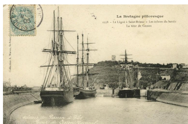
Carte postale. Les écluses du bassin.