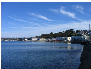
Vue générale du quai Téphany IVR53_20062908331NUCA