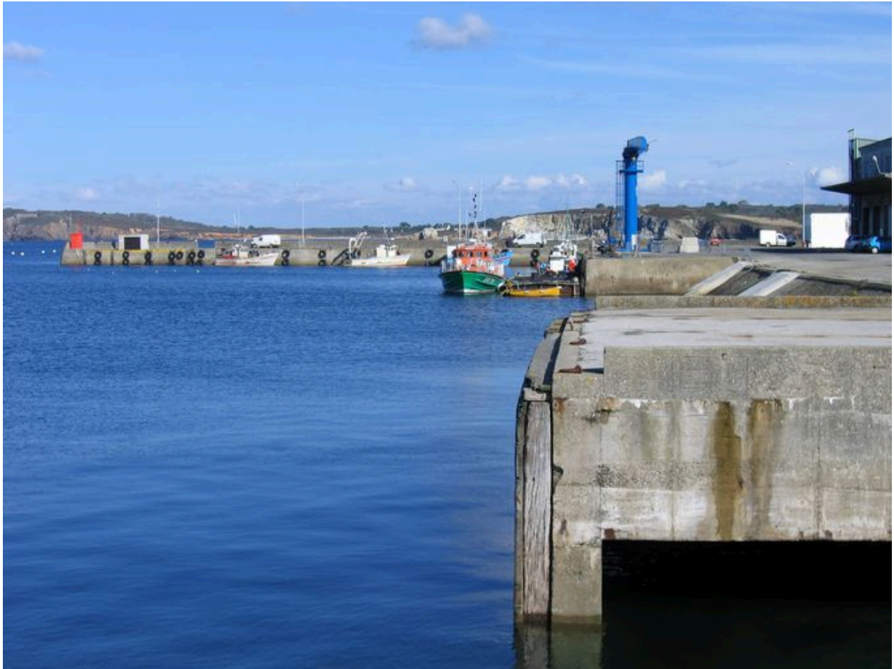
Appontement du quai Téphany