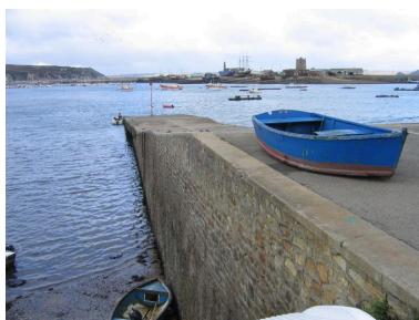
Cale du quai Téphany IVR53_20062908385NUCA