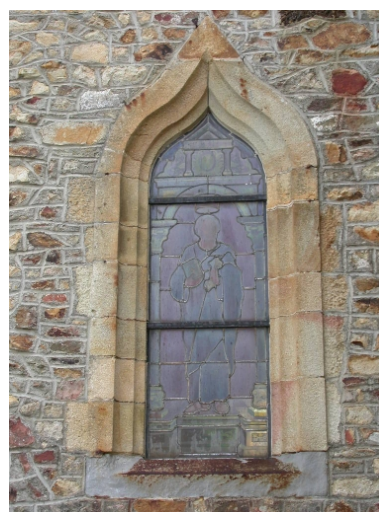
Fenêtre à accolade IVR53_20043511652NUCA