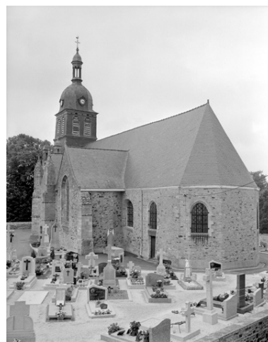
Elevation sud-est