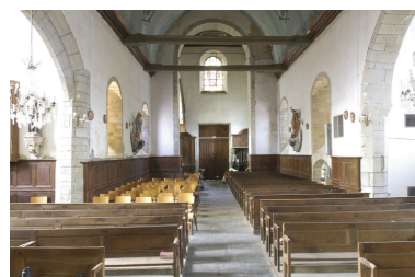
Vue intérieure prise du chœur vers la nef IVR53_20043502379NUCA