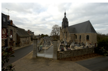
Vue générale de l'église