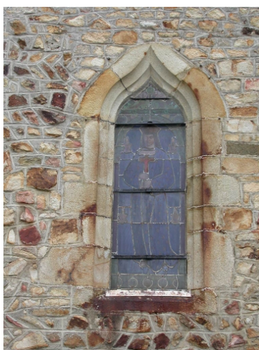
Fenêtre à accolade