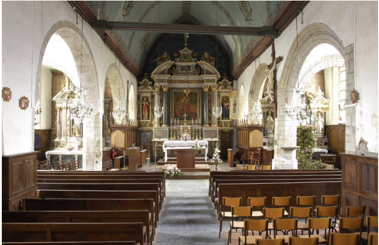
Vue intérieure, prise de la nef vers le chœur