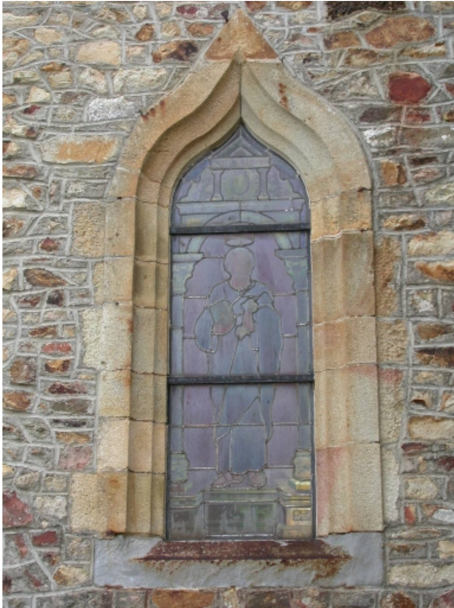
Fenêtre à accolade