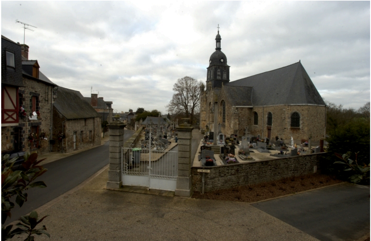
Vue générale de l'église