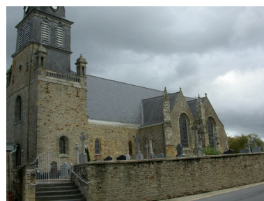
Vue sud-ouest IVR53_20043511649NUCA