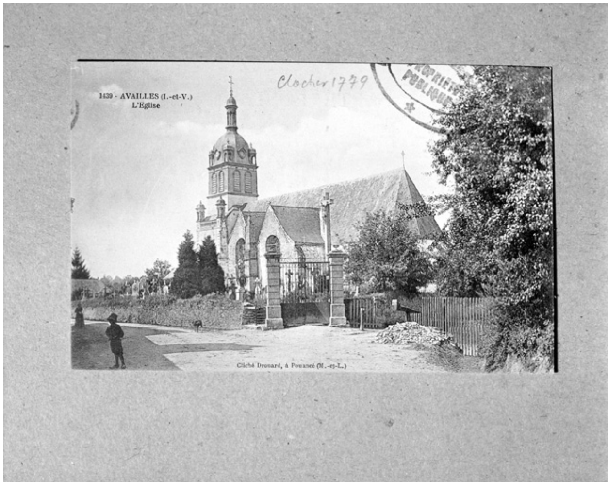
L'église (carte postale ancienne)