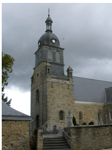
Le clocher IVR53_20043511650NUCA