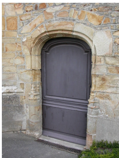
Porte de la façade sud-ouest