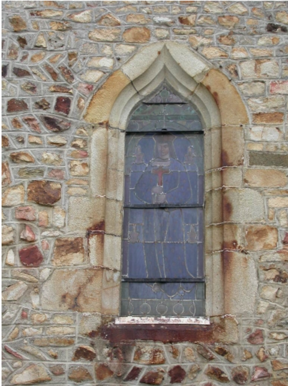
Fenêtre à accolade