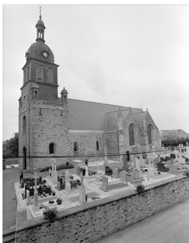
Vue générale : élévation sud-ouest