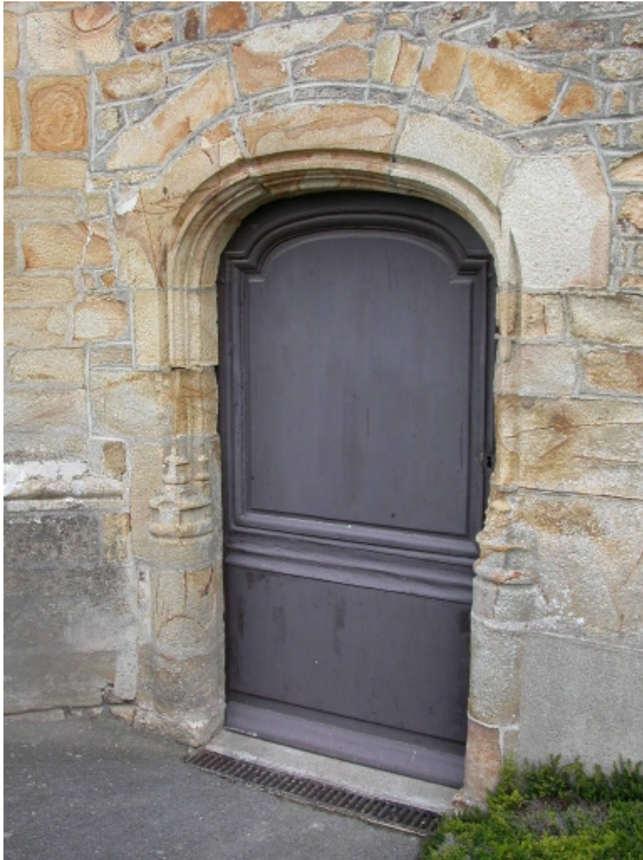
Porte de la façade sud-ouest