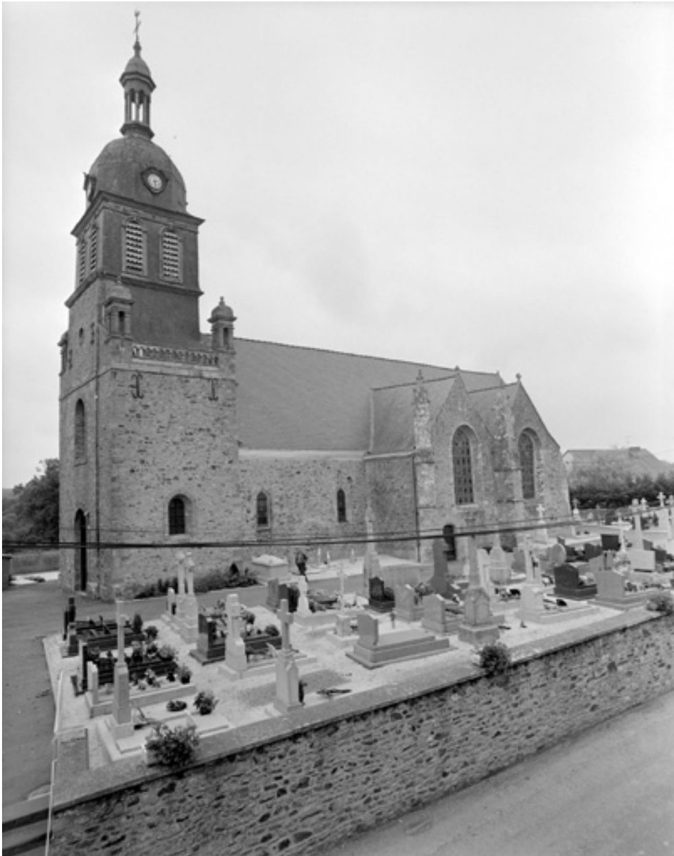
Vue générale : élévation sud-ouest