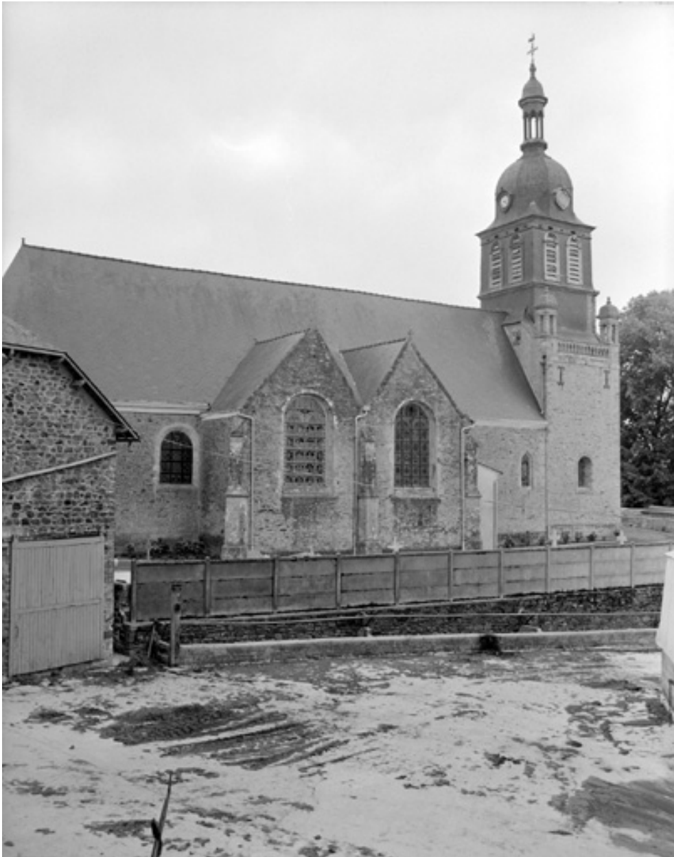
Elévation nord, partie ouest