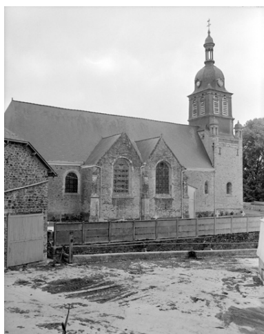
Elévation nord, partie ouest IVR53_19943501507X