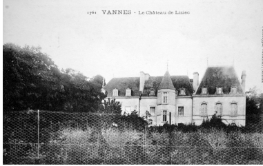
Vue générale IVR53_20045606246NUCB