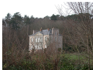
Vue générale IVR53_20042207809NUCA