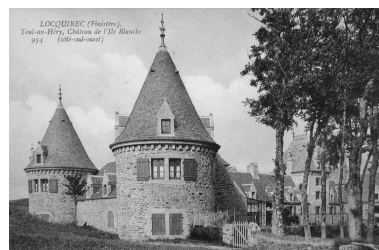
Vue des bâtiments sud-ouest IVR53_20042905497NUCB