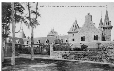
Vue sur la cour IVR53_20042905498NUCB