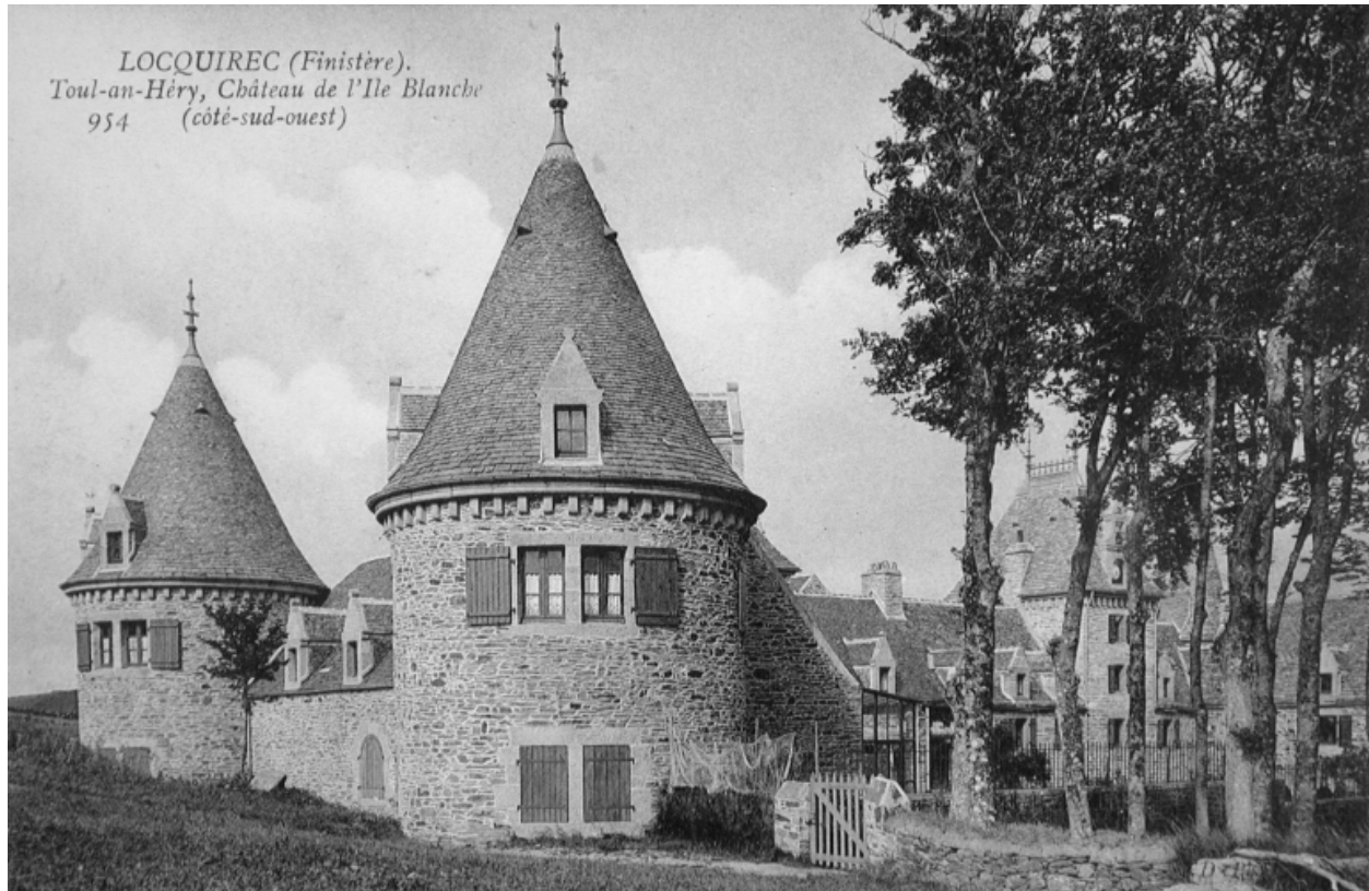
Vue des bâtiments sud-ouest