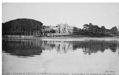
Vue de situation IVR53_20042905499NUCB