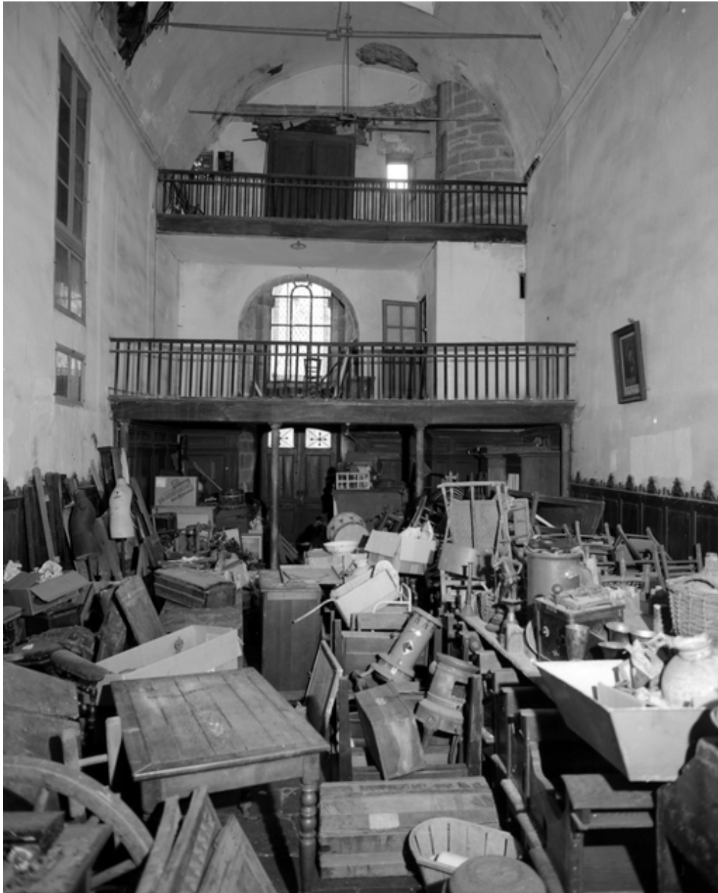
PONTIVY, chapelle Saint-Yvy.