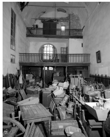
PONTIVY, chapelle Saint-Yvy.