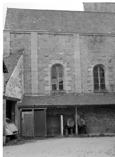
Vue générale prise de la cour. IVR53_19745600460X