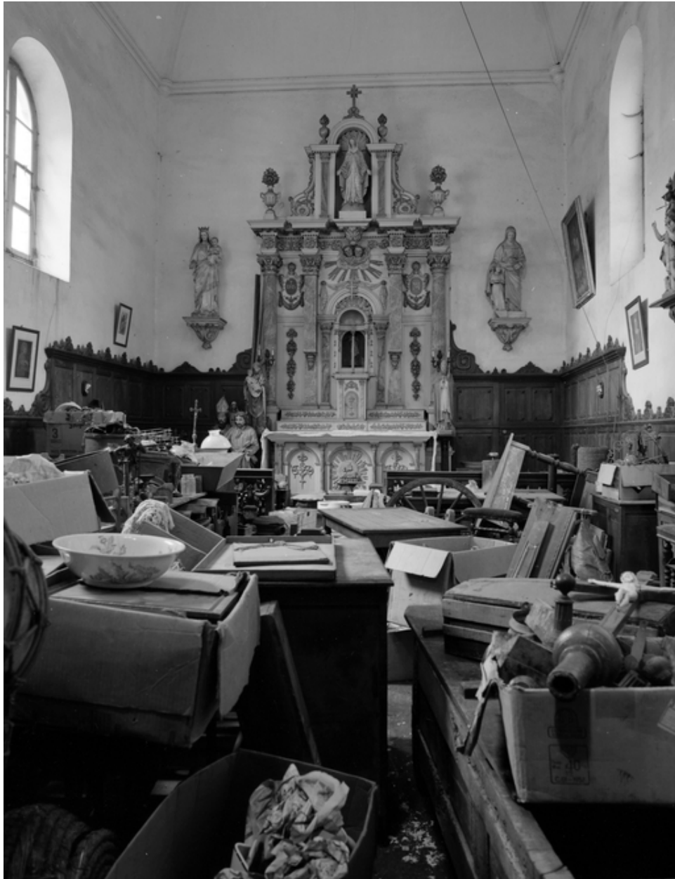
Vue intérieure de l'ouest à l'est.