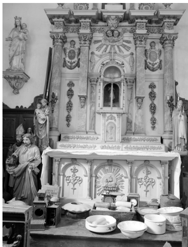
Autel, vue générale.