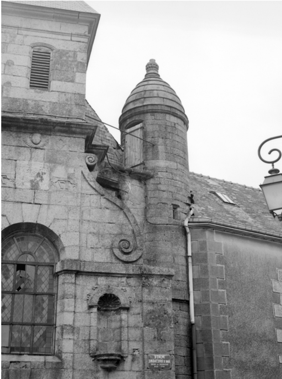
Vue du dôme de la tourelle d'escalier à l'ouest de la façade principale sud.