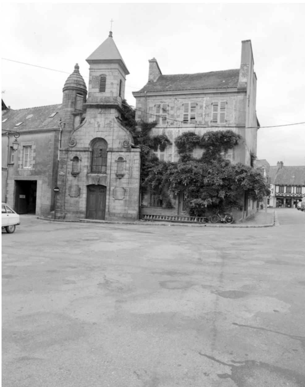
Vue générale de la façade principale sud.