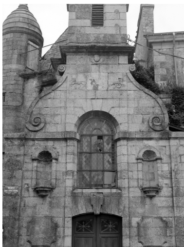
Vue rapprochée, date 1770, niches et fenêtre.