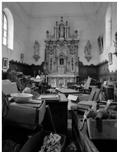
Vue intérieure de l'ouest à l'est. IVR53_19745600461X