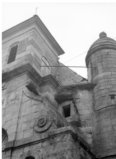
Détail de la tour d'escalier et du clocher. IVR53_19745600459X