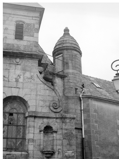
Vue du dôme de la tourelle d'escalier à l'ouest de la façade principale sud. IVR53_19745600456X