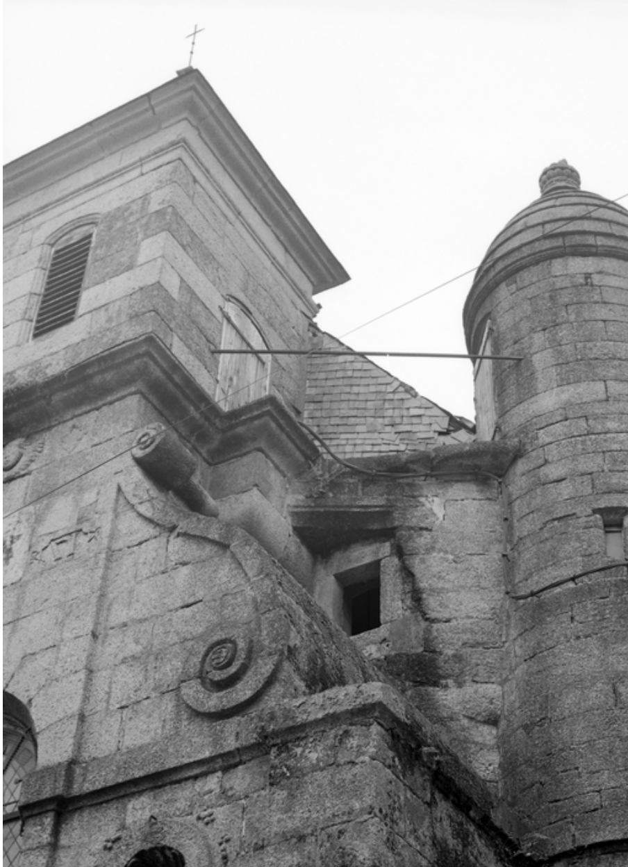
Détail de la tour d'escalier et du clocher.