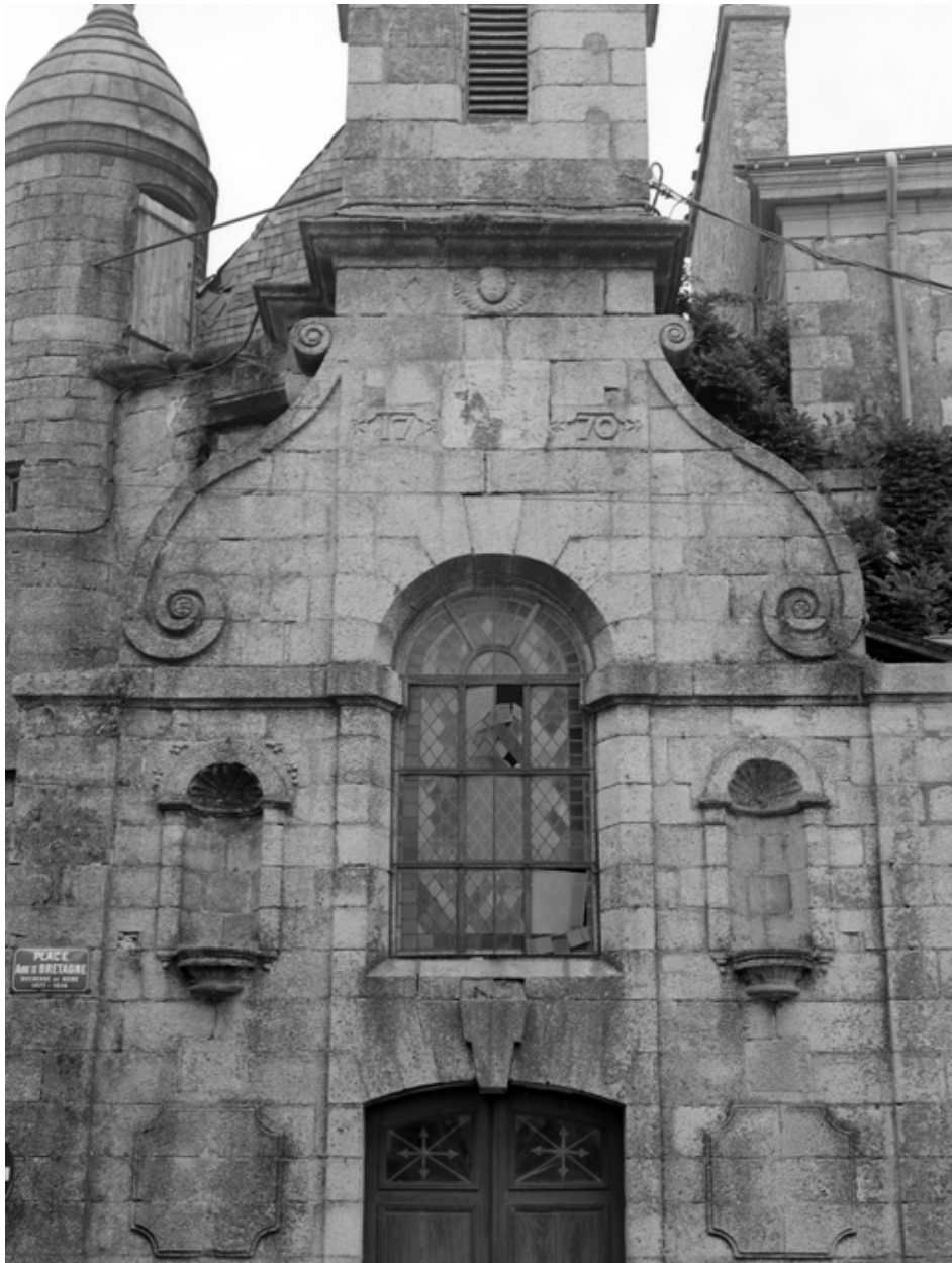
Vue rapprochée, date 1770, niches et fenêtre.