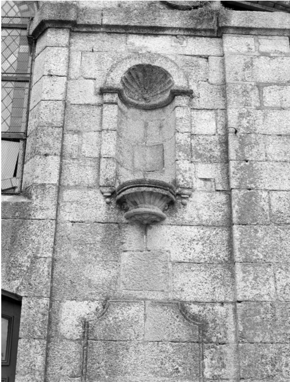
Vue de détail d'un cul-de-lampe d'une niche latérale de la façade principale sud.