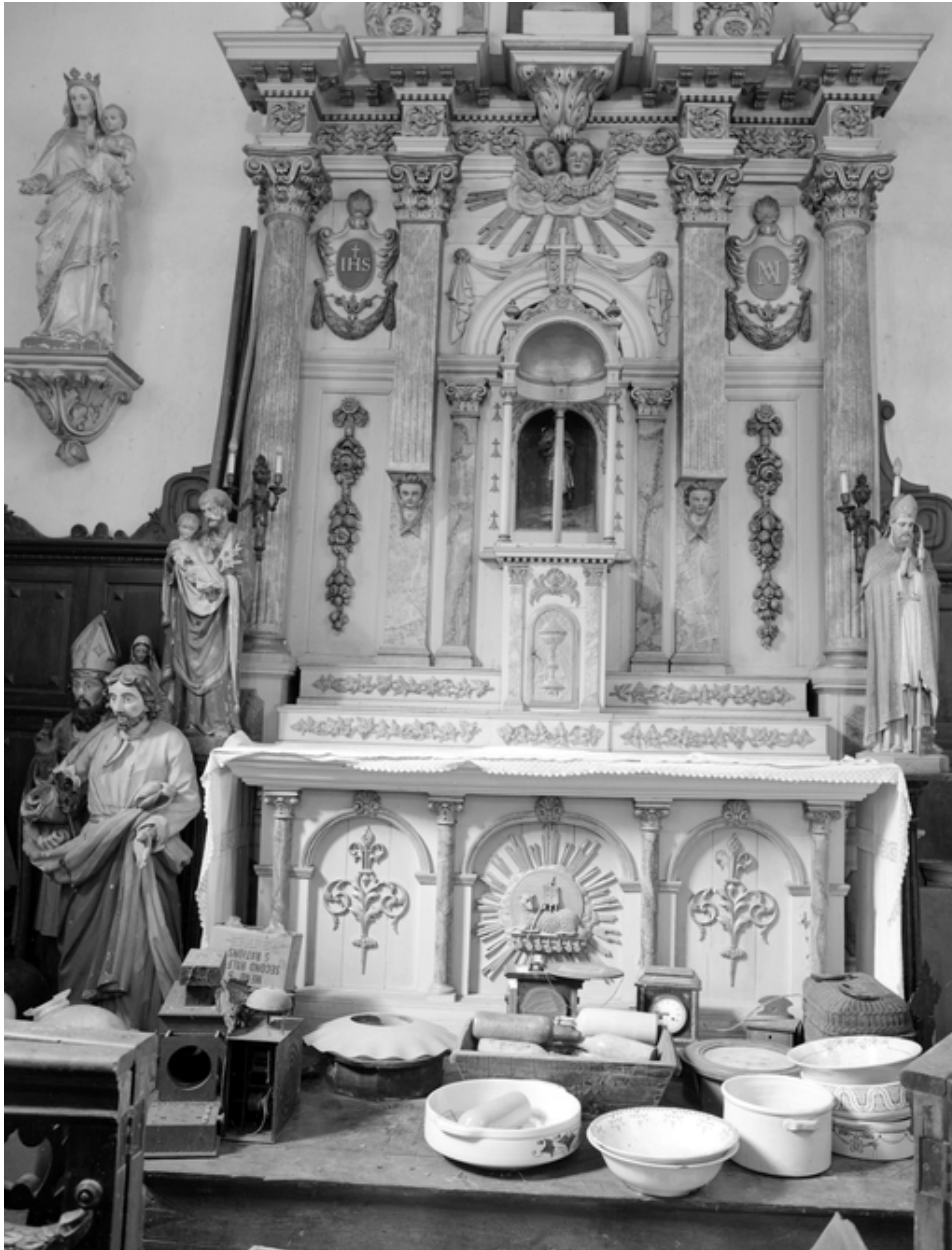
Autel, vue générale.