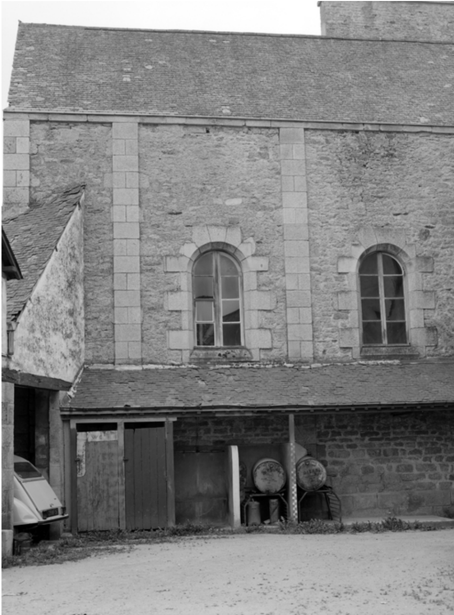
Vue générale prise de la cour.