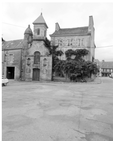
Vue générale de la façade principale sud. IVR53_19745600455X