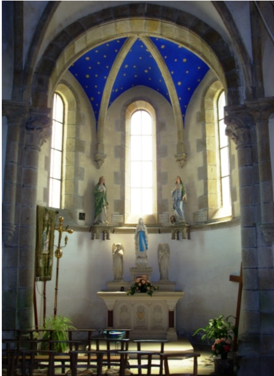
Le Relecq-Kerhuon, église Notre-Dame : vue axiale de la chapelle rayonnante est