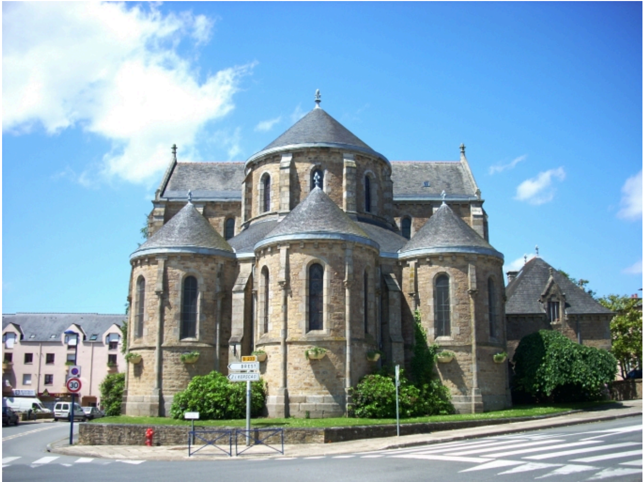
Le Relecq-Kerhuon, église Notre-Dame : élévation est