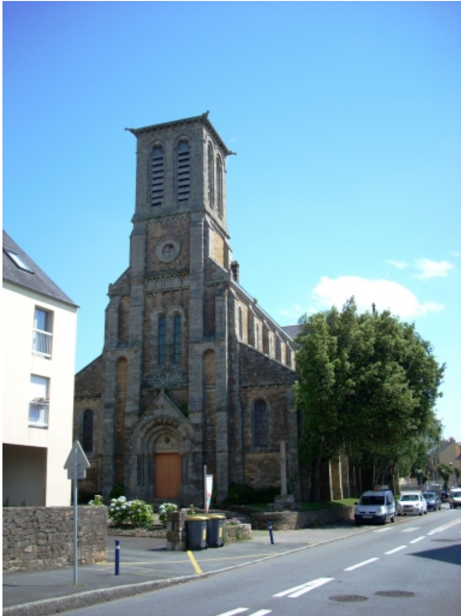
Le Relecq-Kerhuon, église Notre-Dame : vue générale ouest