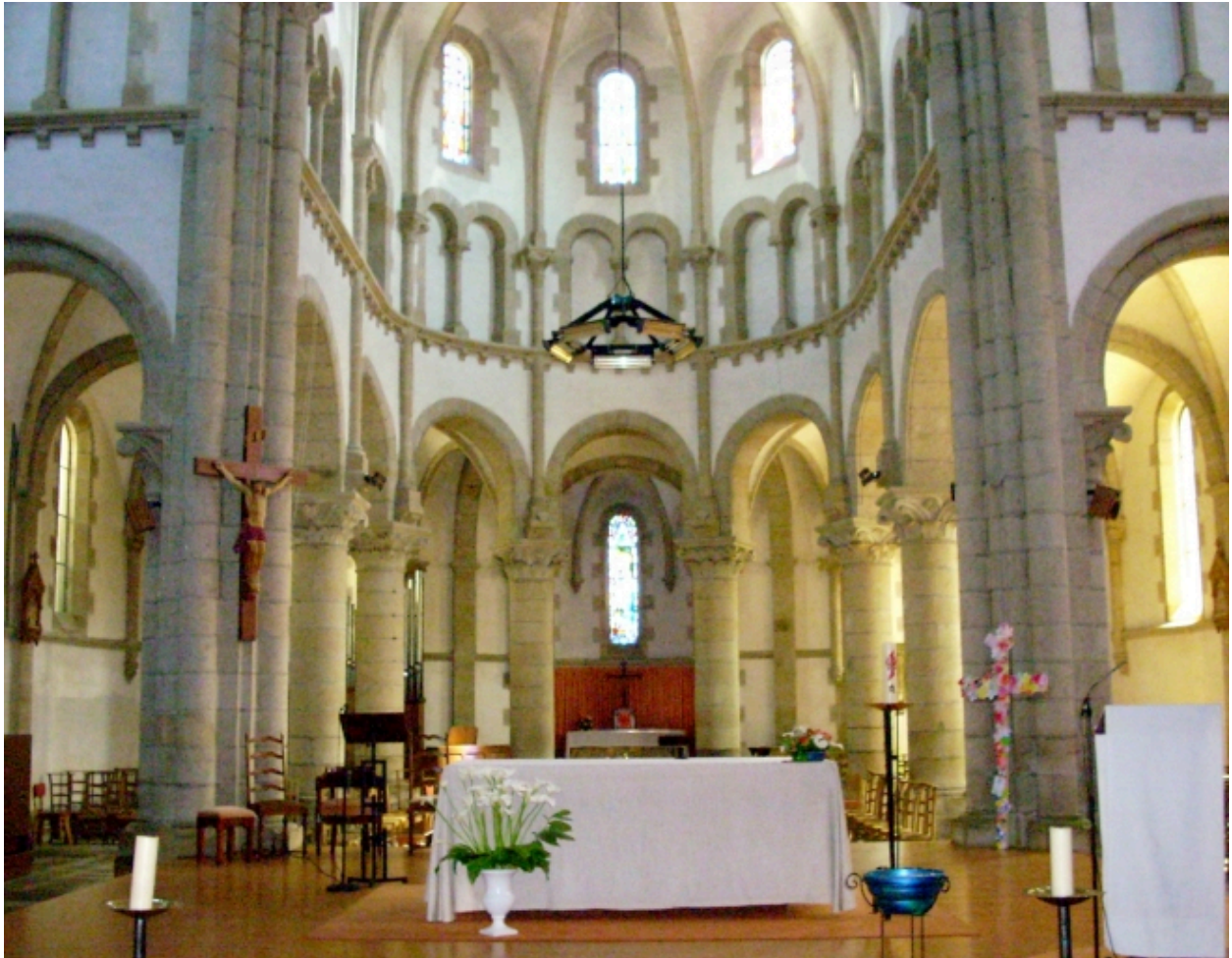
Le Relecq-Kerhuon, église Notre-Dame : chœur vue de la croisée du transept