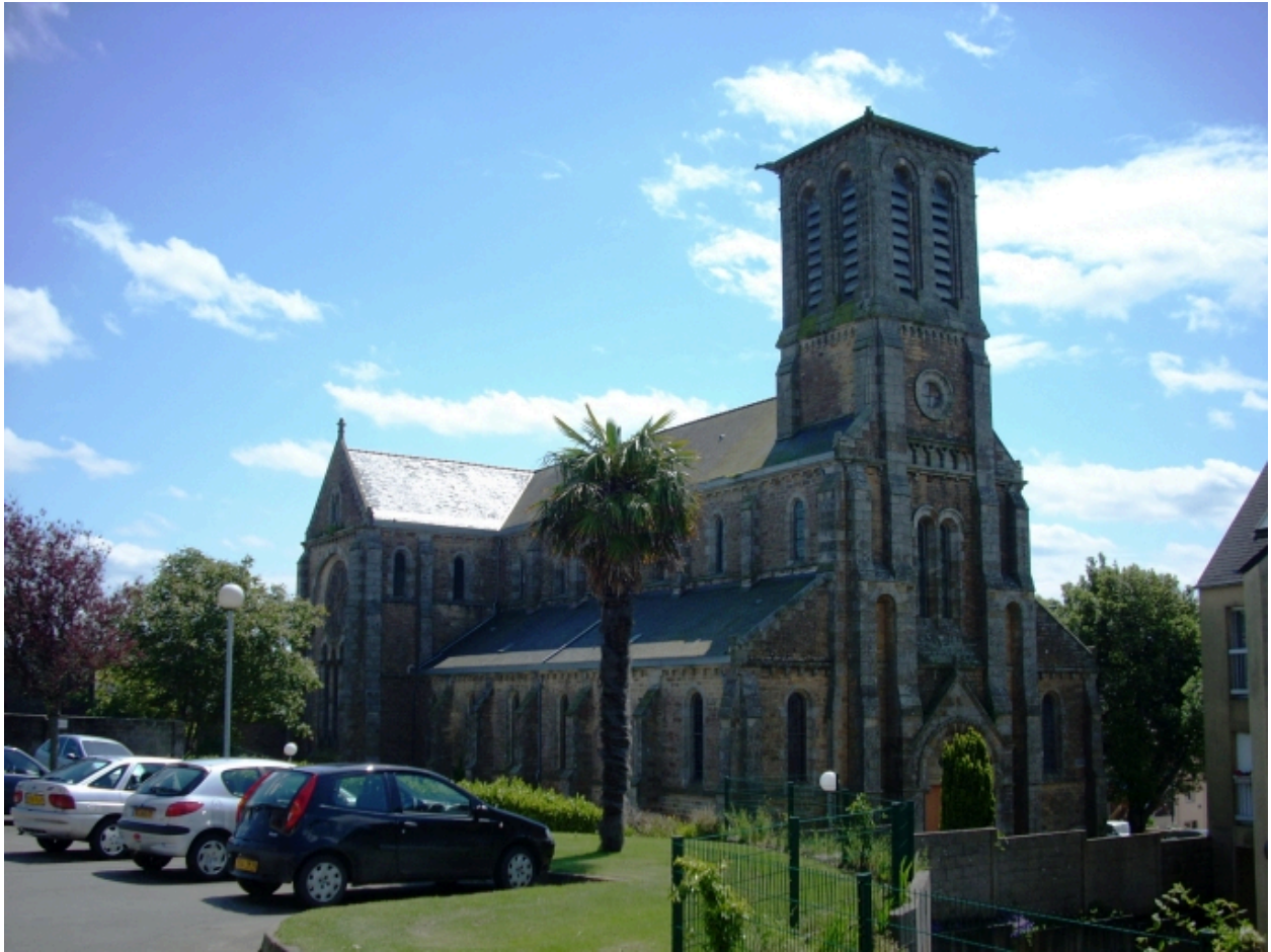
Le Relecq-Kerhuon, église Notre-Dame : vue générale nord-ouest