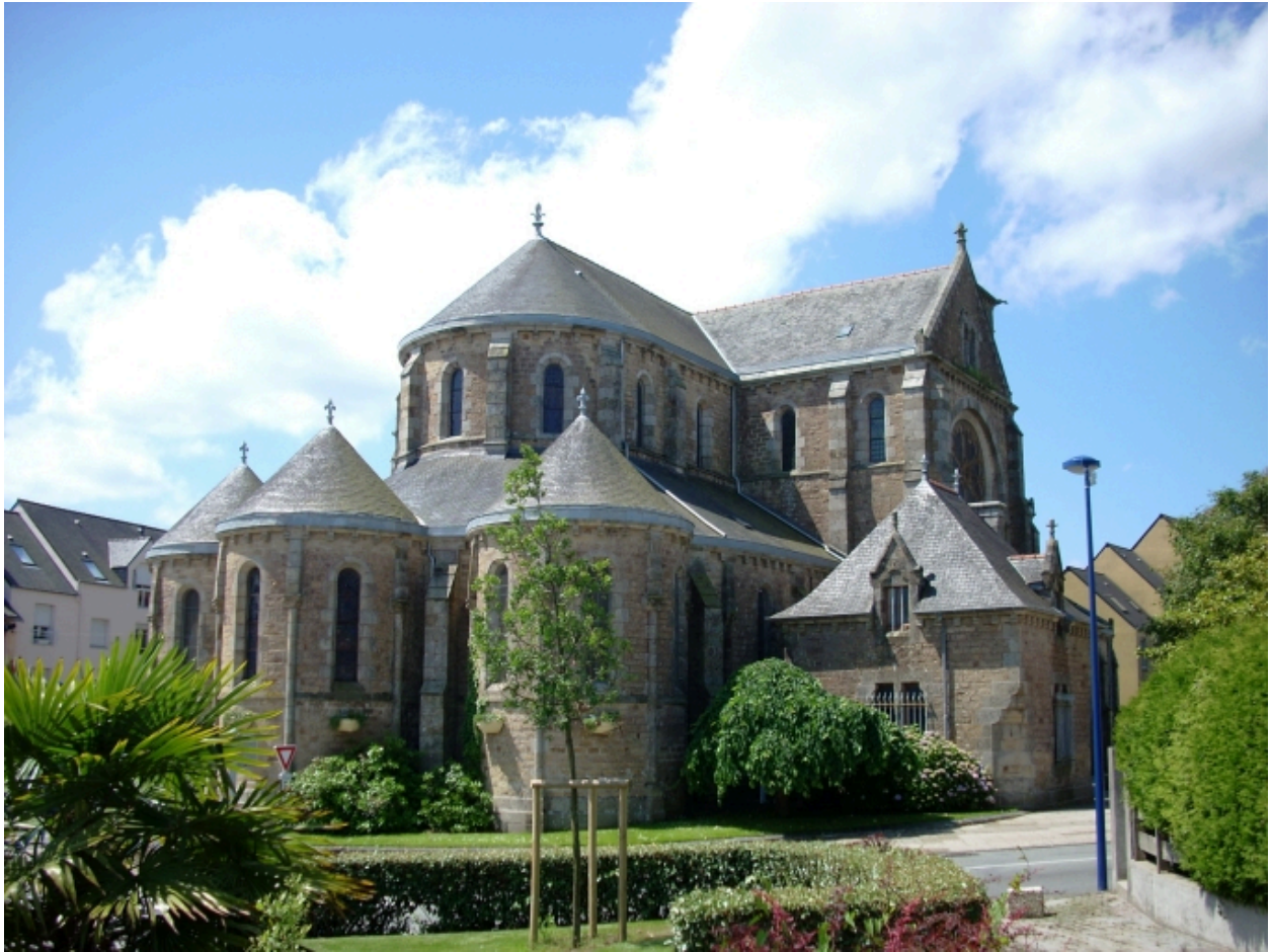
Le Relecq-Kerhuon, église Notre-Dame : vue générale nord-est