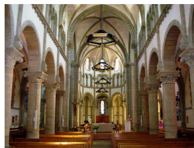
Le Relecq-Kerhuon, église Notre-Dame : vue axiale est IVR53_20082905975NUCA