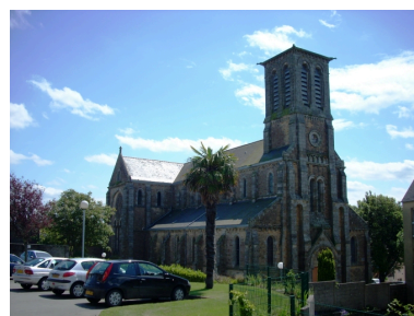
Le Relecq-Kerhuon, église Notre- Dame : vue générale nord-ouest IVR53_20082905972NUCA