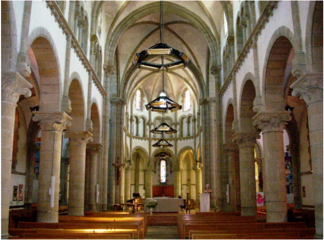
Le Relecq-Kerhuon, église Notre-Dame : vue axiale est