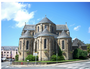
Le Relecq-Kerhuon, église Notre-Dame : élévation est IVR53_20082905974NUCA