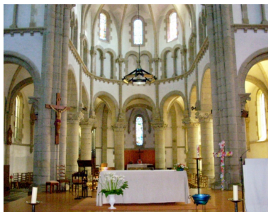
Le Relecq-Kerhuon, église Notre-Dame : chœur vue de la croisée du transept IVR53_20082905977NUCA