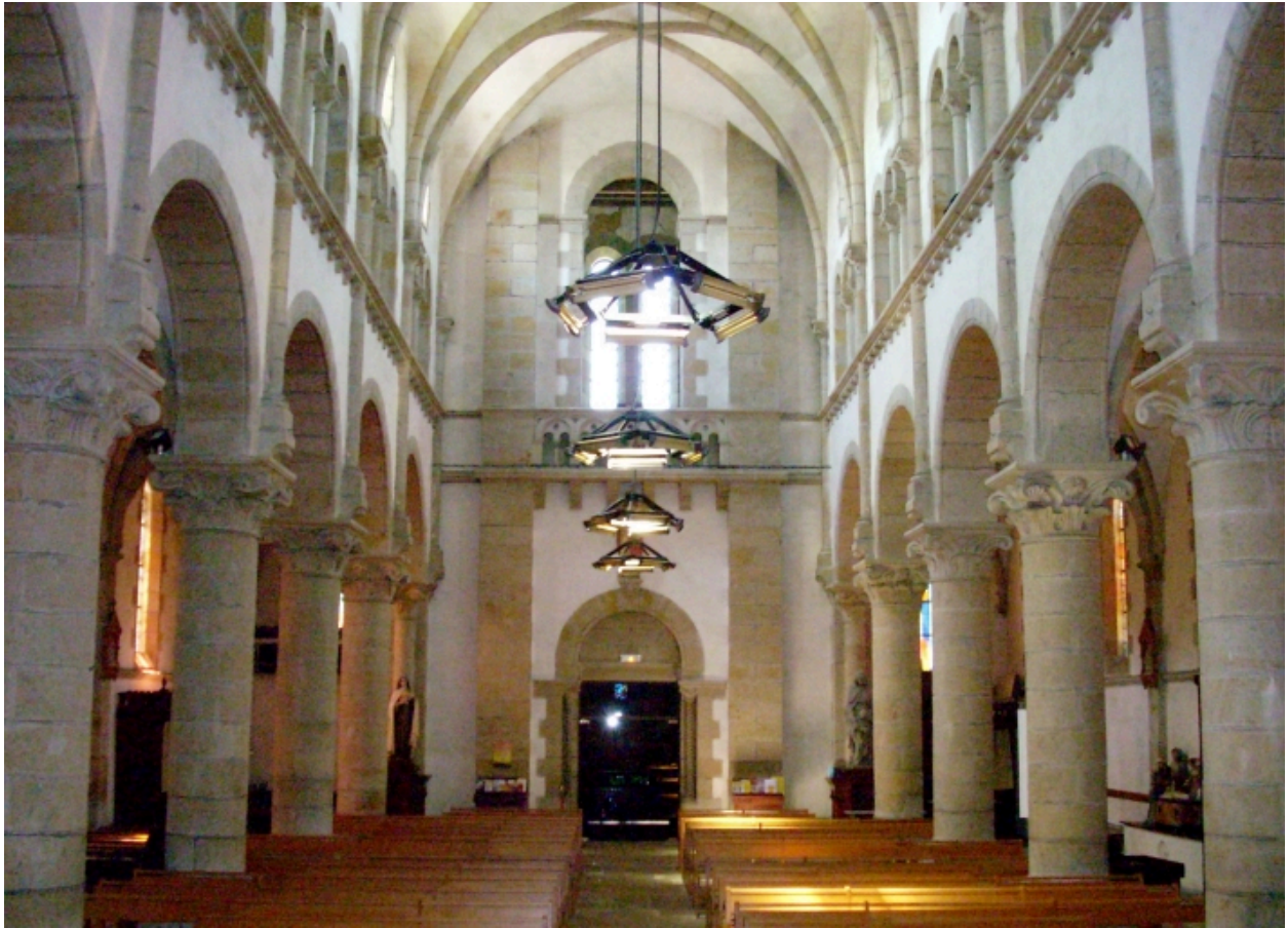
Le Relecq-Kerhuon, église Notre-Dame : vue axiale ouest