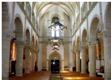
Le Relecq-Kerhuon, église Notre-Dame : vue axiale ouest IVR53_20082905976NUCA