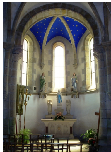
Le Relecq-Kerhuon, église Notre-Dame : vue axiale de la chapelle rayonnante est