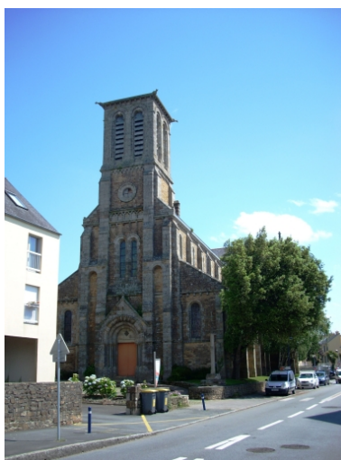
Le Relecq-Kerhuon, église Notre-Dame : vue générale ouest IVR53_20082905971NUCA