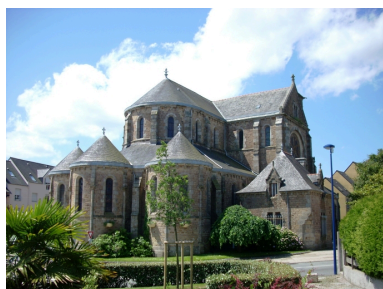
Le Relecq-Kerhuon, église Notre- Dame : vue générale nord-est IVR53_20082905973NUCA