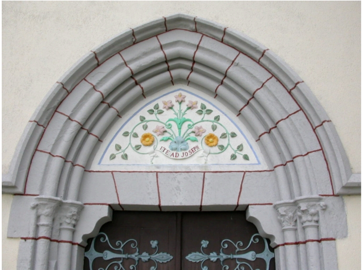
Décor du haut de la porte