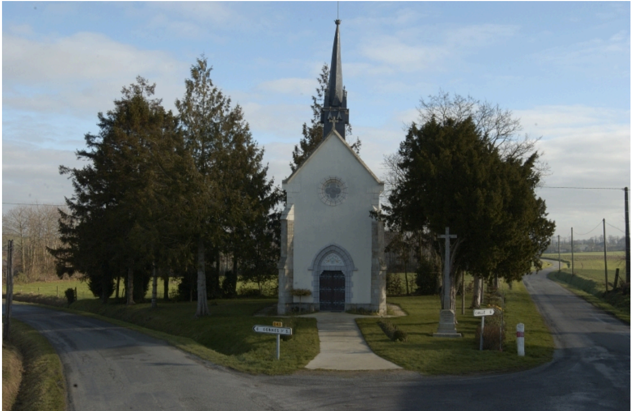
L'entrée de la chapelle