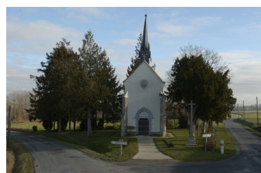
L'entrée de la chapelle