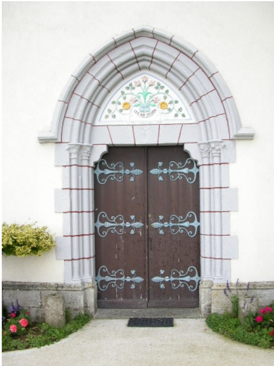
La porte d'entrée