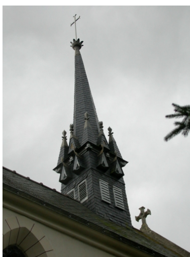
Le clocher