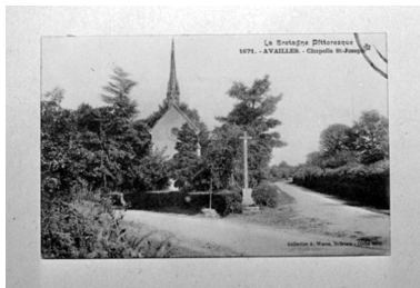
Chapelle Saint-Joseph : élévation nord-ouest IVR53_19933500190XB