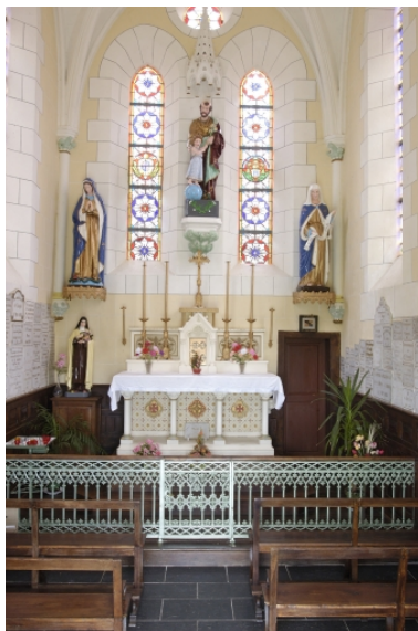
Vue intérieure IVR53_20043502539NUCA