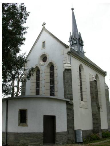
Vue est de la chapelle IVR53_20043511654NUCA