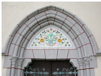
Décor du haut de la porte