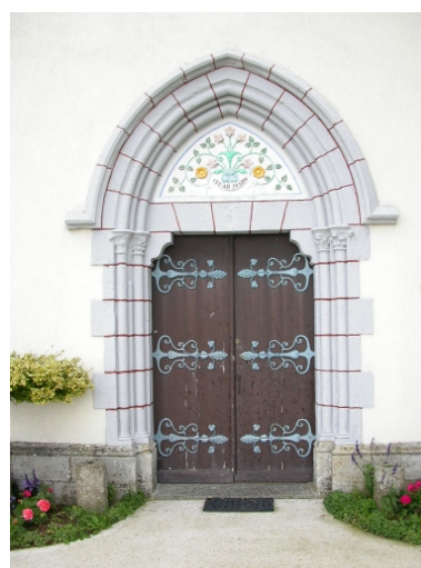
La porte d'entrée IVR53_20043511656NUCA