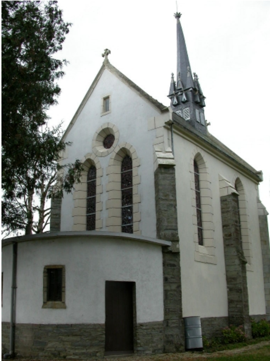
Vue est de la chapelle