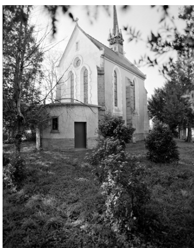
Elévation est IVR53_19923500961X