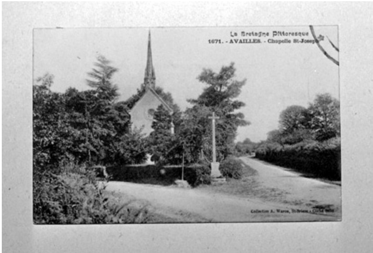
Chapelle Saint-Joseph : élévation nord-ouest