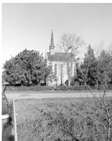
Elévation sud IVR53_19923500960X