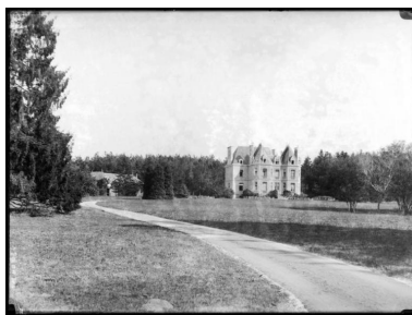
Château : vue de situation depuis le sud (état entre 1900-1920) IVR53_20155606065NUCB