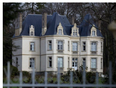
Château : élévation sud-est (état en 2012)