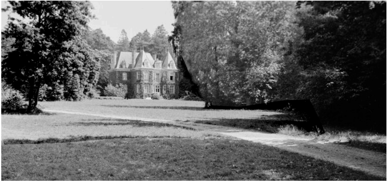
Château : vue de situation depuis le sud (état en 1969)