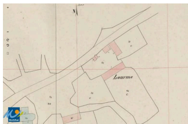
Lourme sur le cadastre de 1840 (A. D. du Morbihan, série 3 P 180/17)