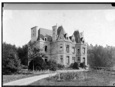
Château : élévation sud-est (état entre 1900-1920) IVR53_20155606066NUCB