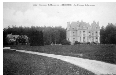
Environs de Malestroit. - MISSIRIAC. - Le Château de Lourmes. Carte postale, 1er quart 20e siècle IVR53_20035604275NUCB