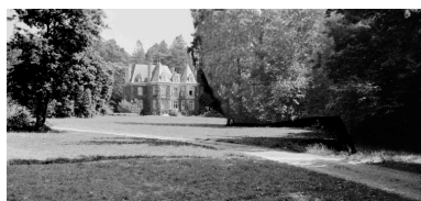
Château : vue de situation depuis le sud (état en 1969) IVR53_19895600111Z