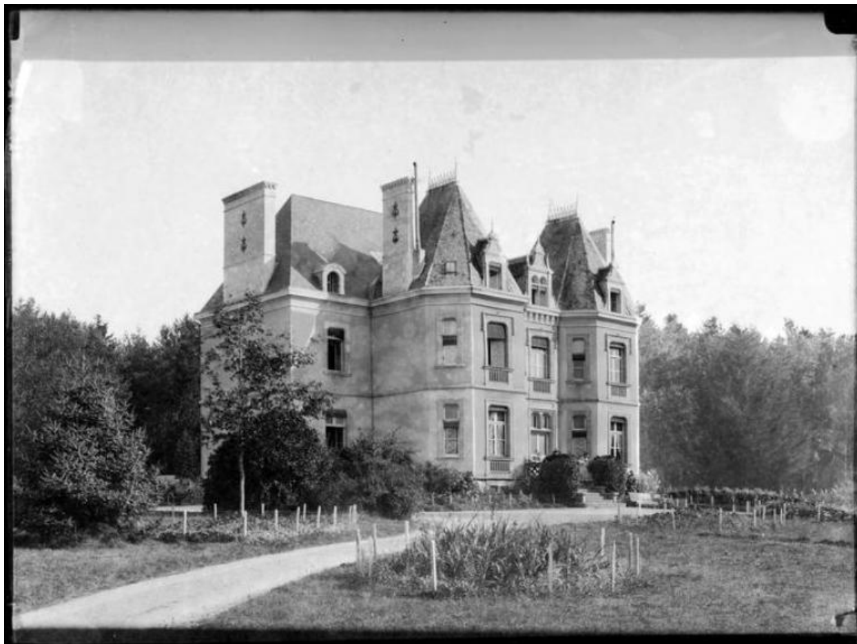
Château : élévation sud-est (état entre 1900-1920)