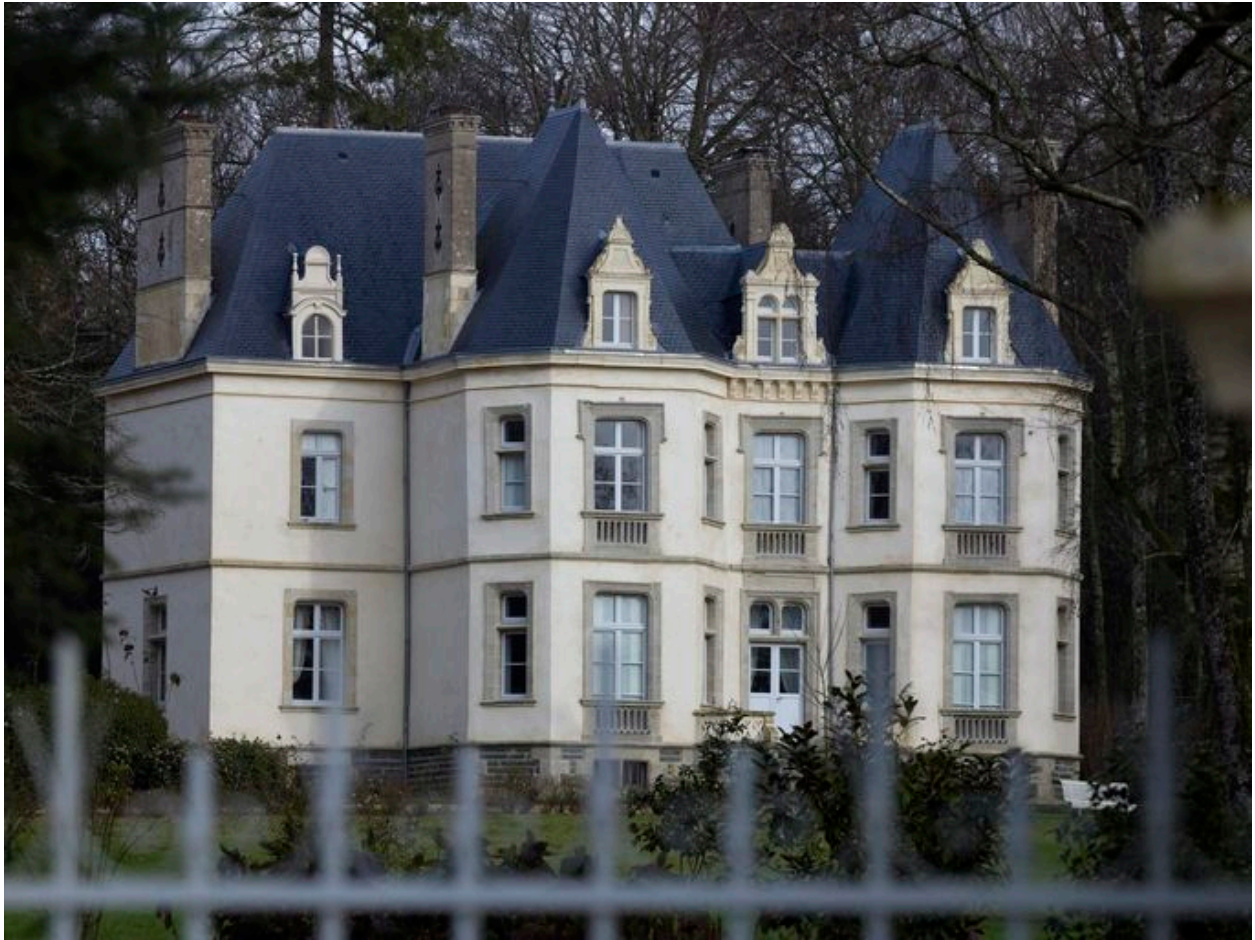
Château : élévation sud-est (état en 2012)