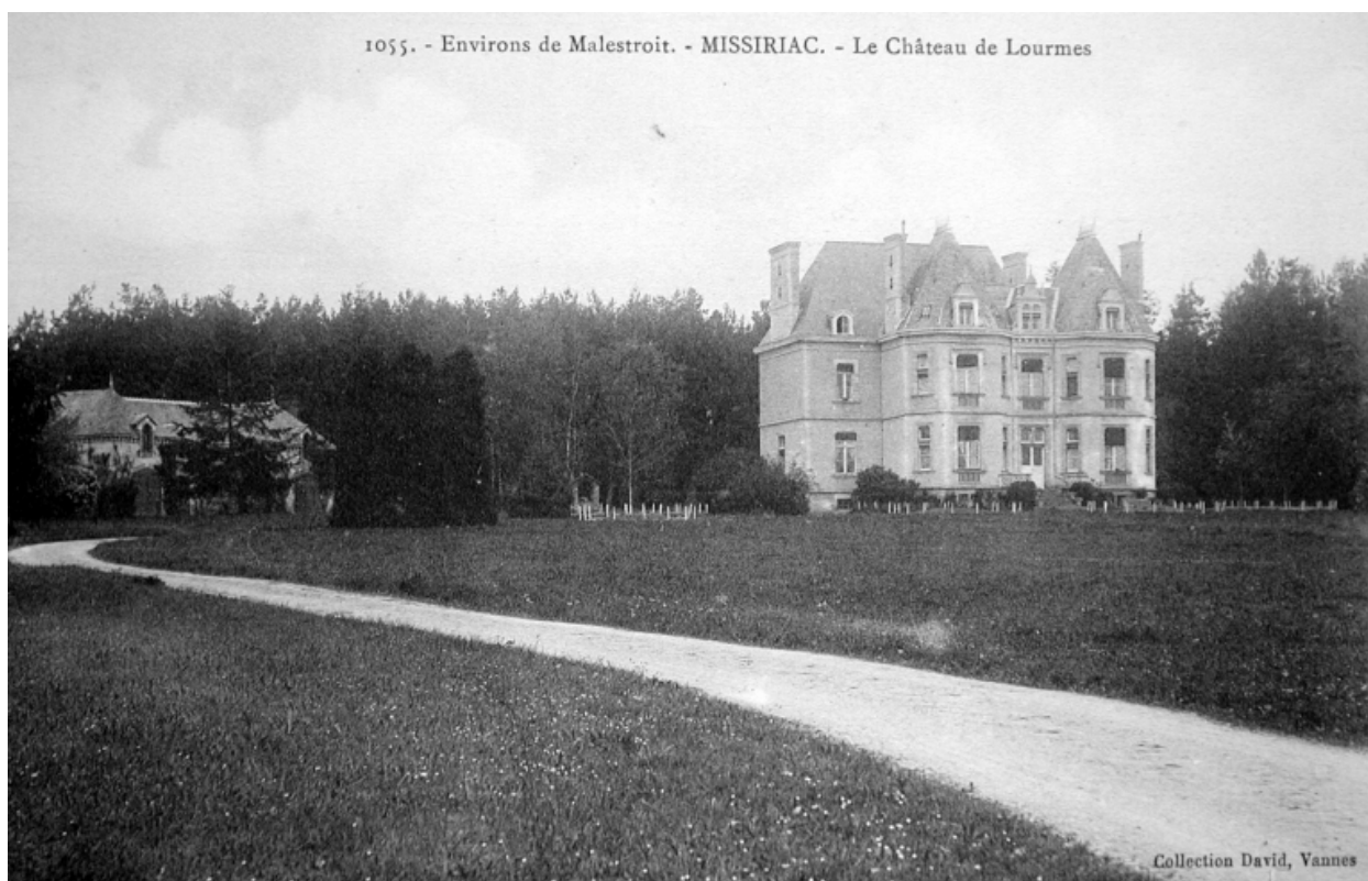
Environs de Malestroit. - MISSIRIAC. - Le Château de Lourmes. Carte postale, 1er quart 20e siècle (A. D. Ille-&-Vilaine, 6 Fi Missiriac)