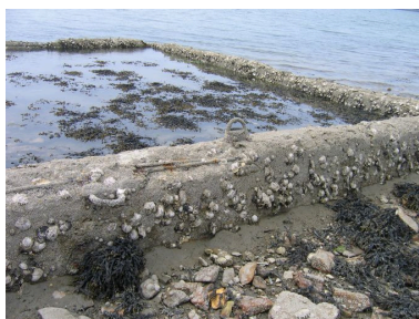
Bassin de décantation à huîtres IVR53_20062908505NUCA