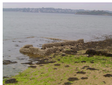
Bassin de décantation à huîtres IVR53_20062908524NUCA