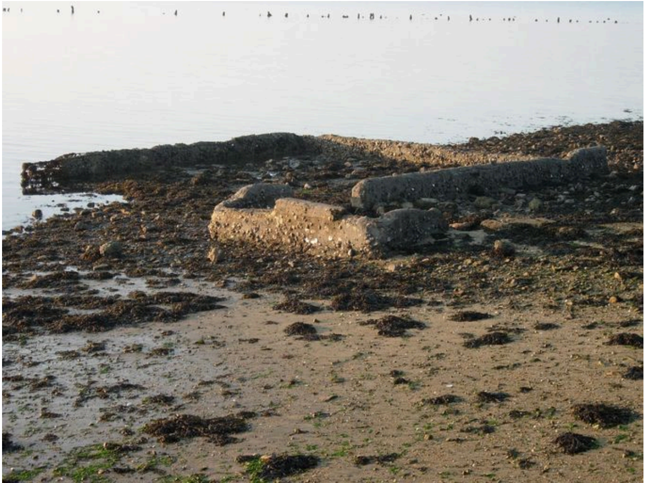
Vue générale du bassin de décantation à huîtres