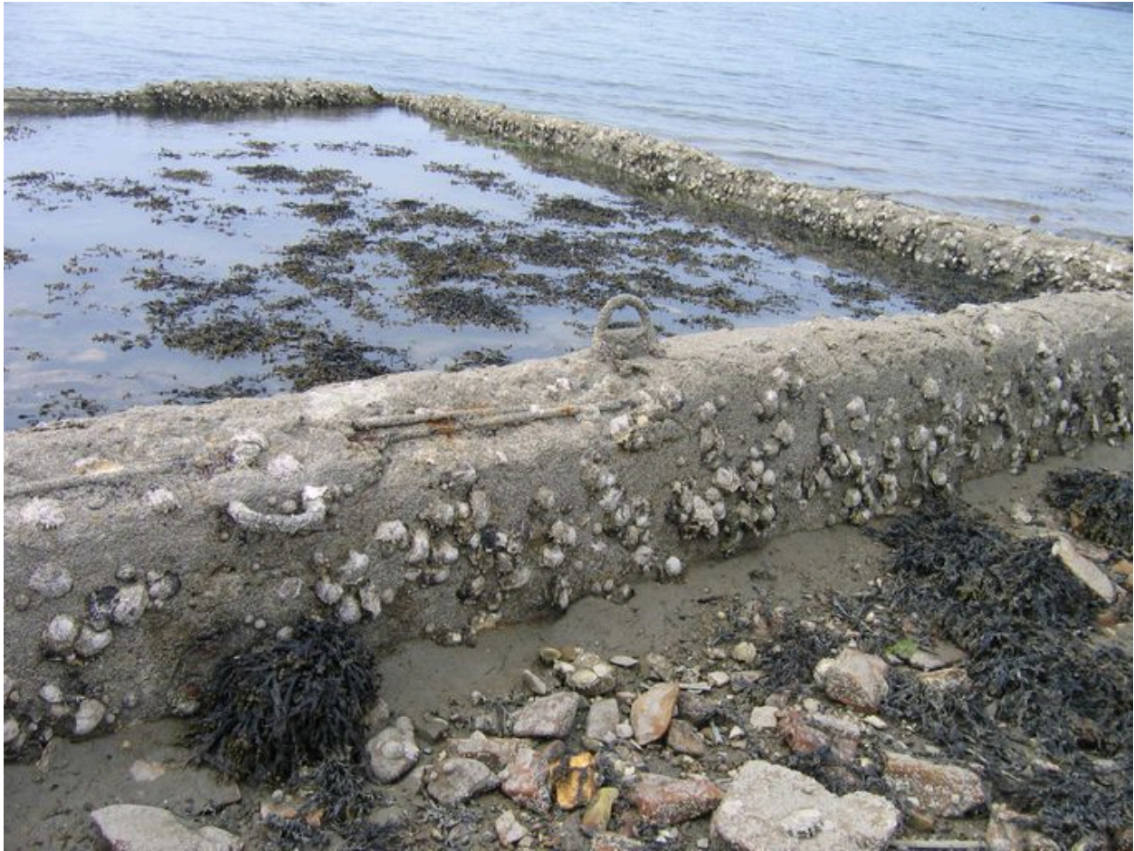
Bassin de décantation à huîtres