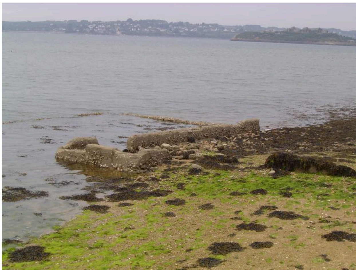
Bassin de décantation à huîtres