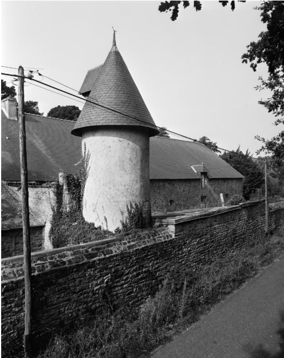
Ferme et colombier, vue nord.