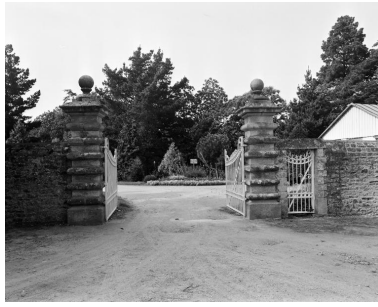
Portail d'entrée, vue générale nord.