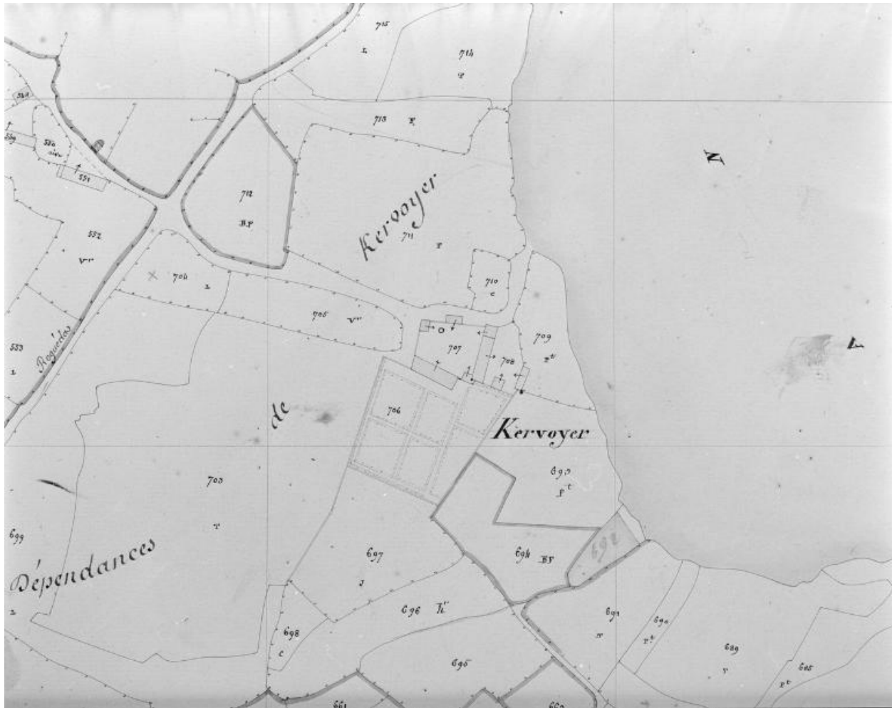
Plan cadastral 1852, section D2.