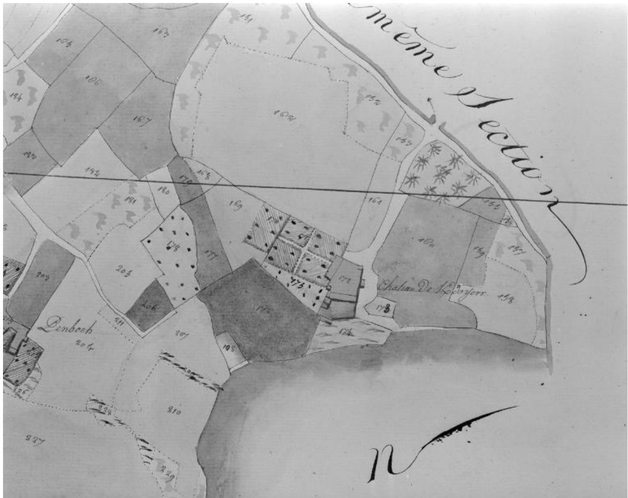
Plan cadastral 1809, section D1.