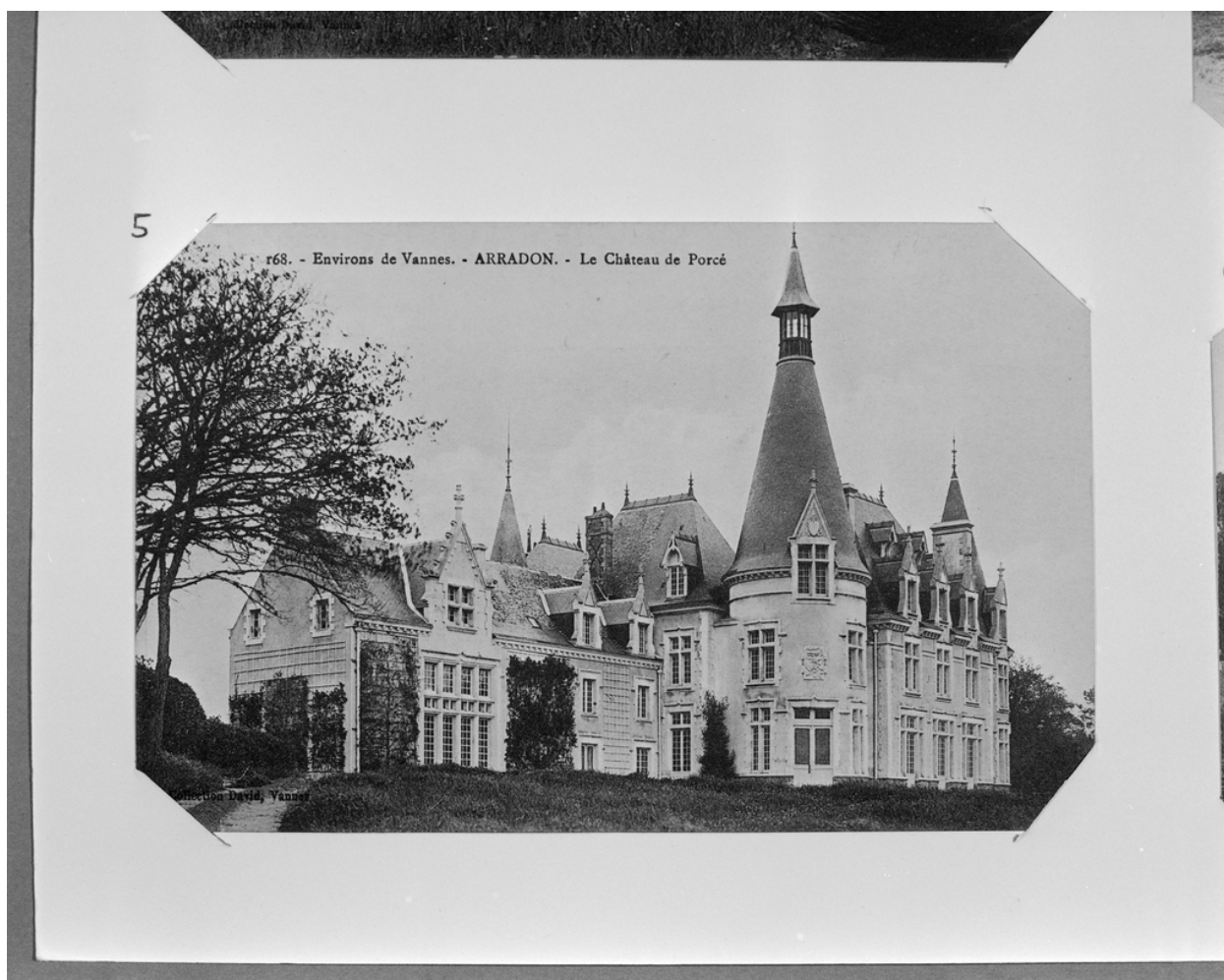
Vue sud-ouest, carte postale ancienne, coll. David, Vannes.