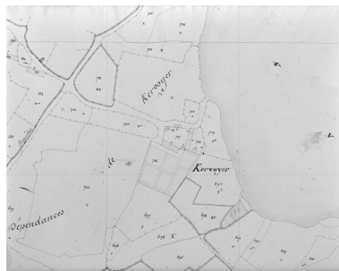
Plan cadastral 1852, section D2.