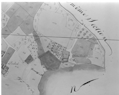
Plan cadastral 1809, section D1. IVR53_19935600100X