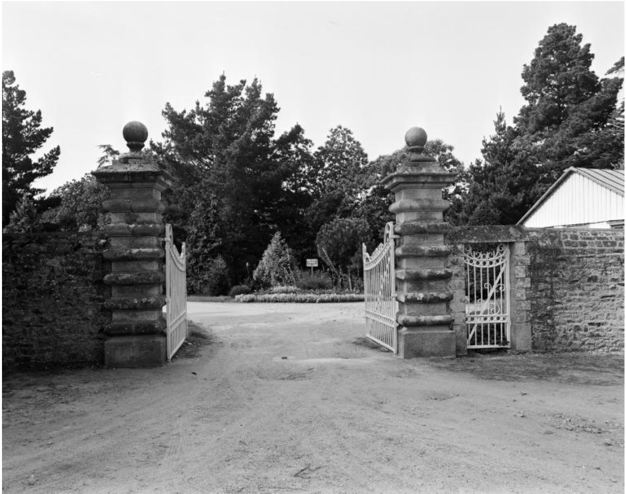
Portail d'entrée, vue générale nord.