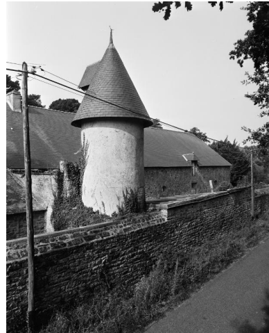
Ferme et colombier, vue nord. IVR53_19915600804X