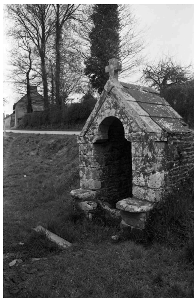
Vue générale, état 1973