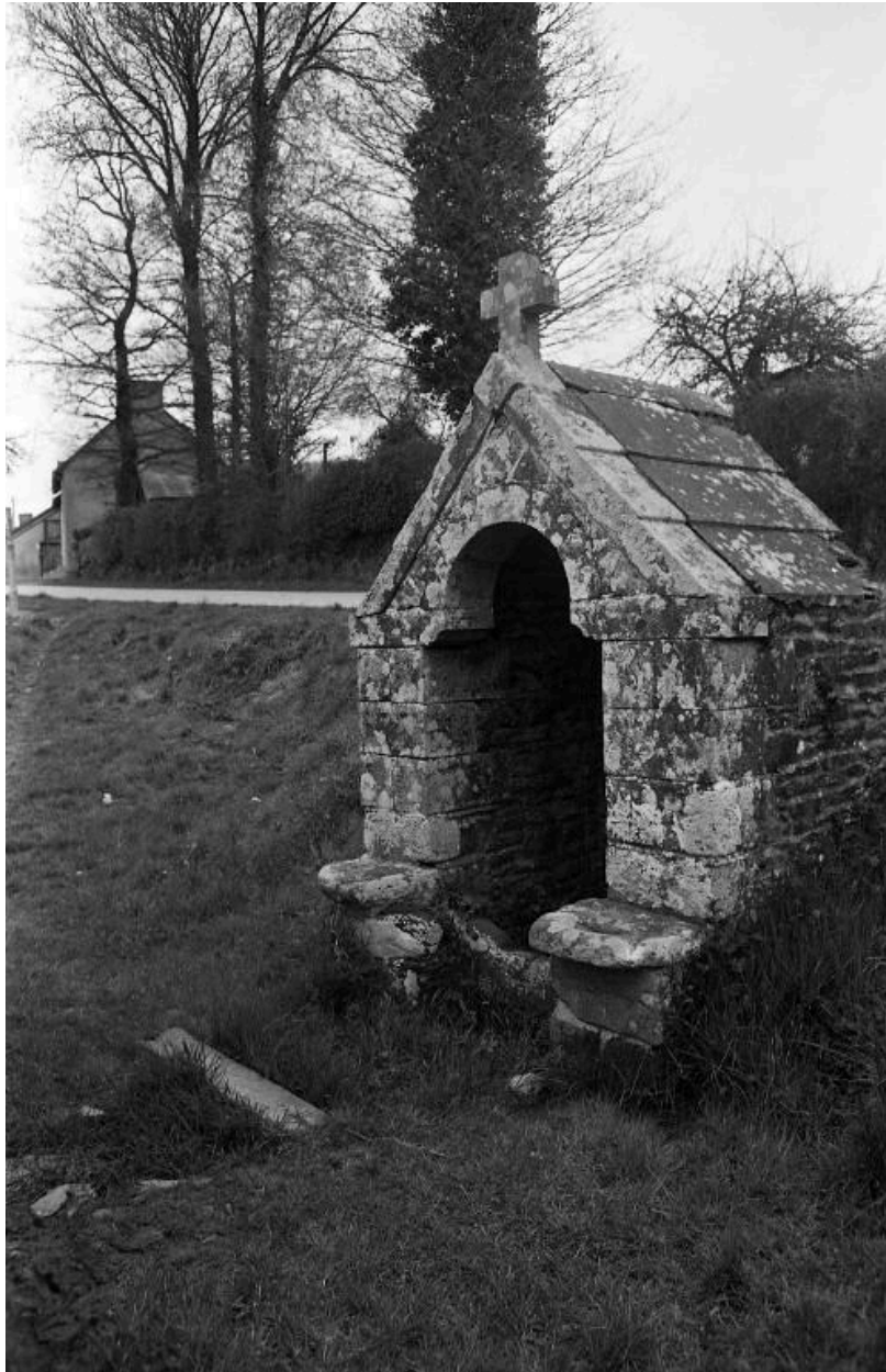
Vue générale, état 1973