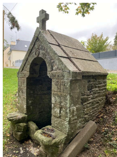
Vue générale sud IVR53_20265610444NUCA