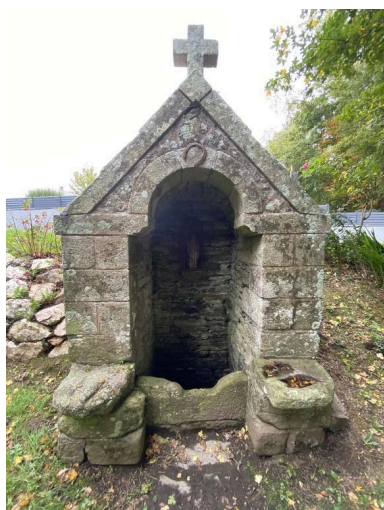
Vue générale ouest IVR53_20265610442NUCA