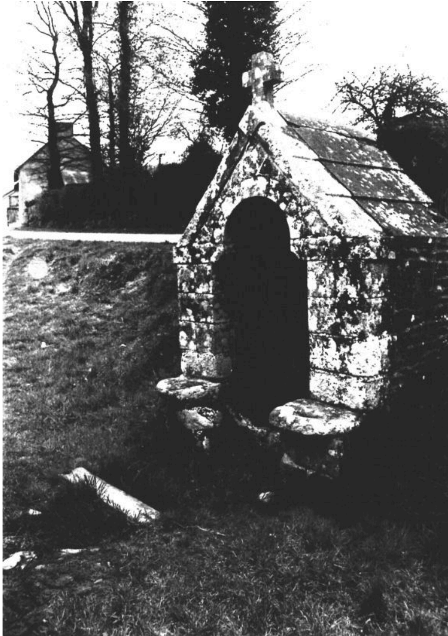
Vue de 3/4