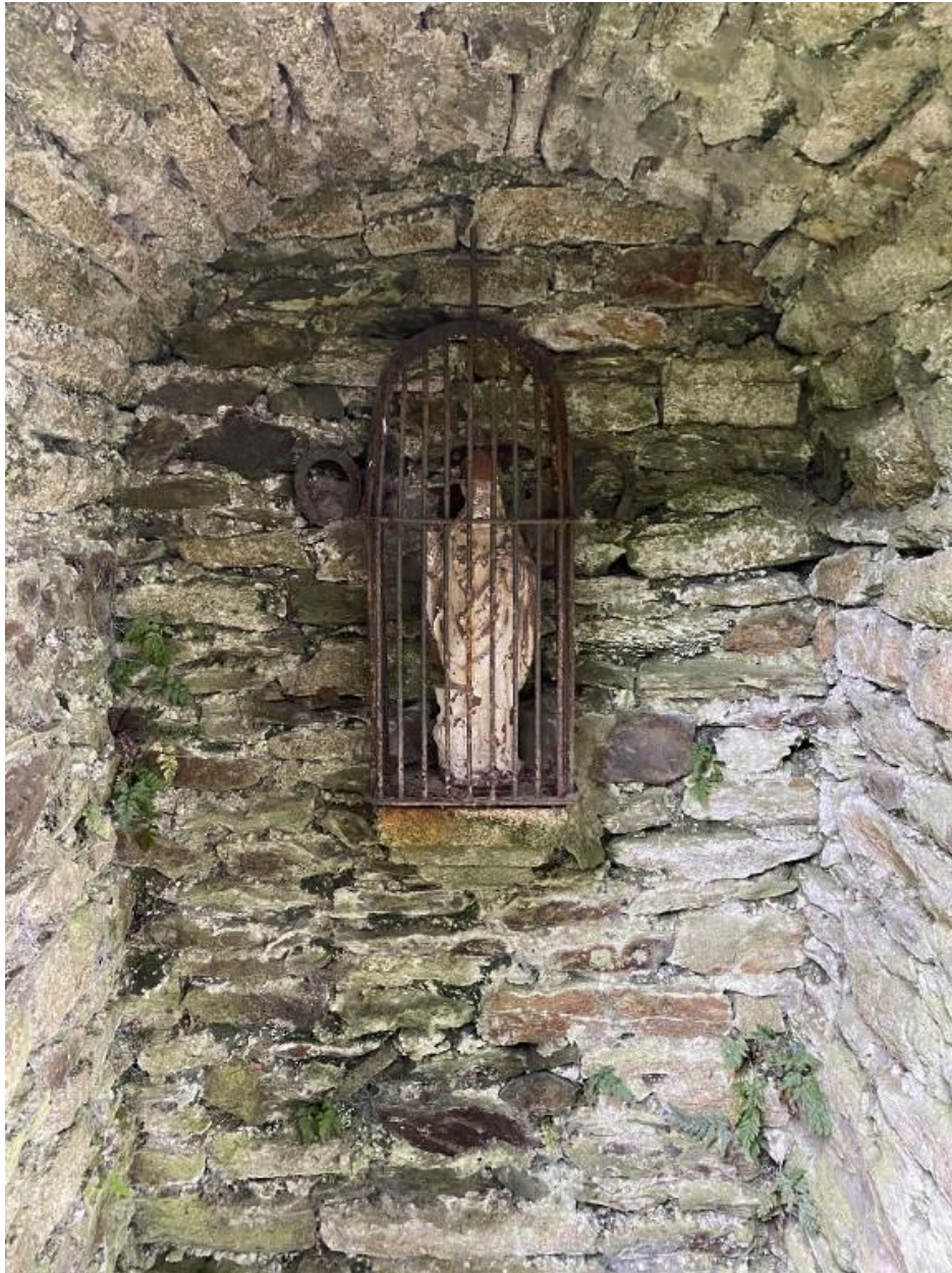
Statuette de saint Eloi, détail