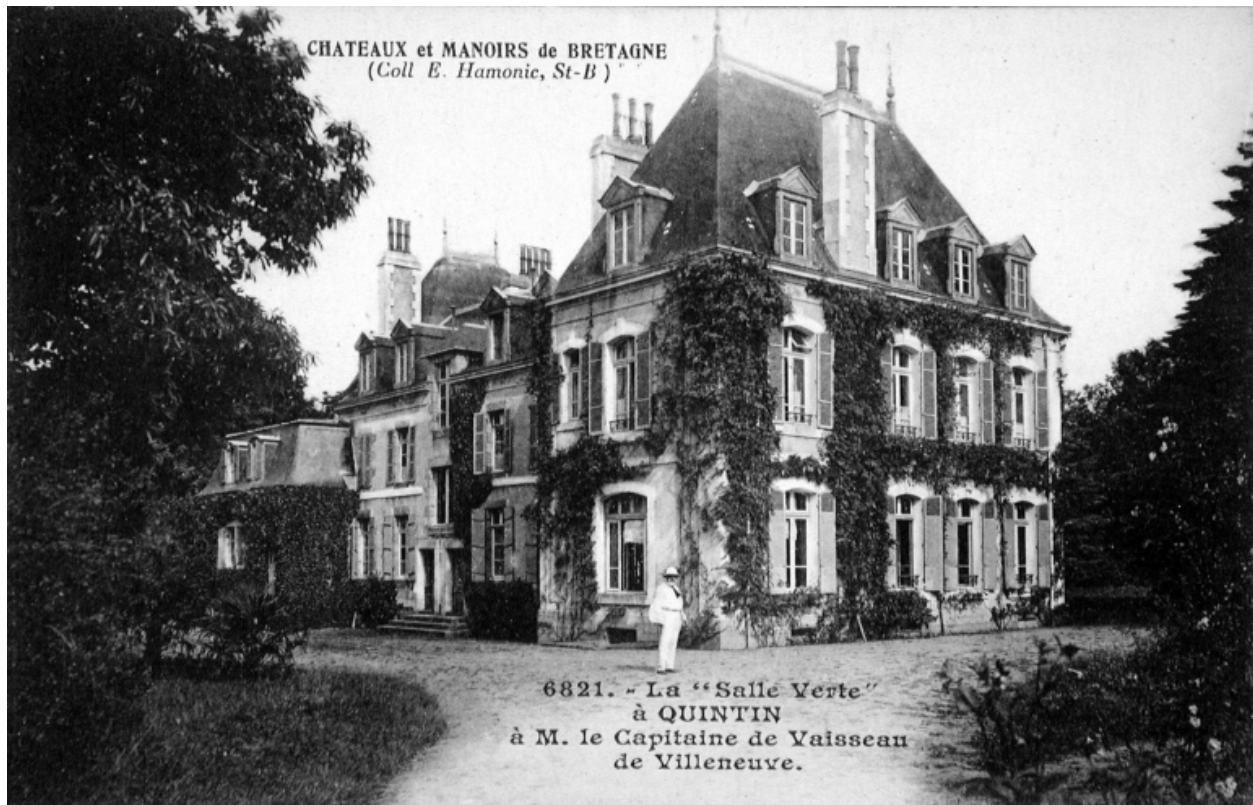
Vue générale de trois-quart