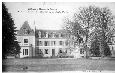
Vue générale axiale IVR53_20042209064NUCB