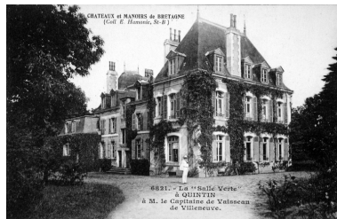
Vue générale de trois-quart