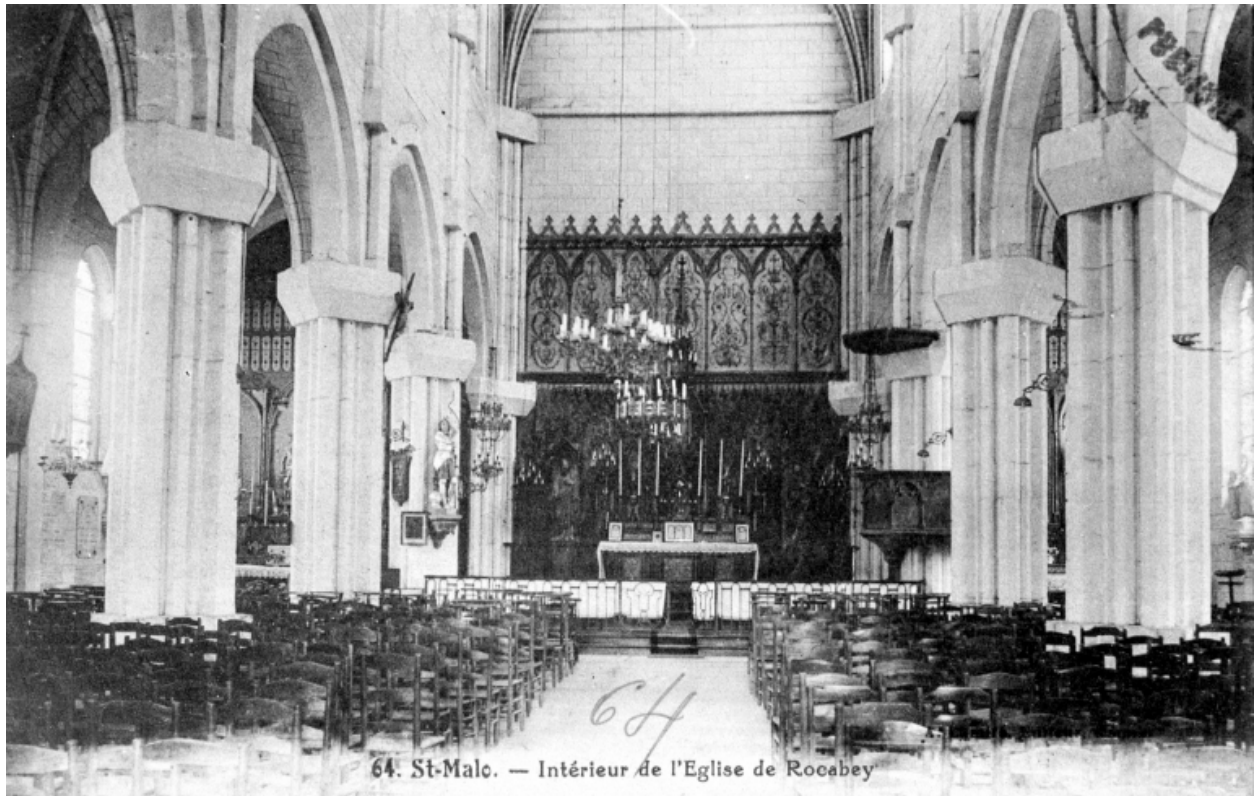
64. St-Malo. — Intérieur de l'Eglise de Rocabey

Intérieur : vue générale vers le choeur (Carte postale ancienne, AD35 : 6Fi)