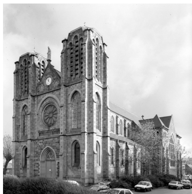
Elévation Sud-Ouest : vue générale IVR53_19943502430V