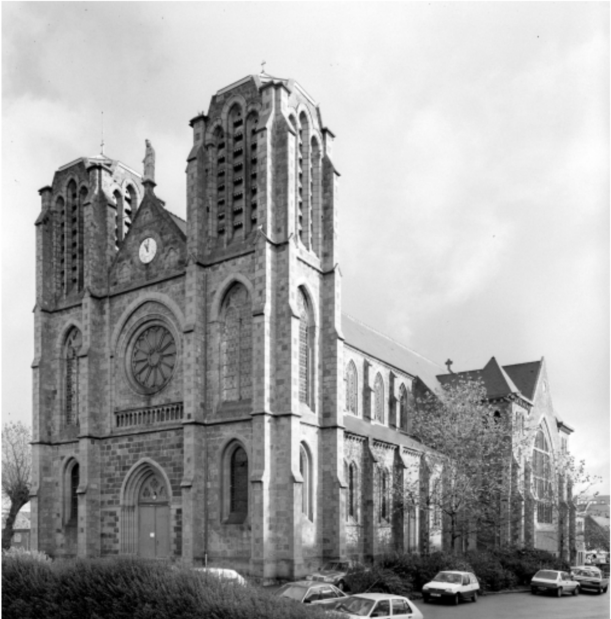
Elévation Sud-Ouest : vue générale