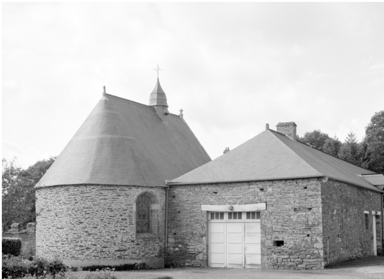
Chapelle : vue générale prise du nord-est