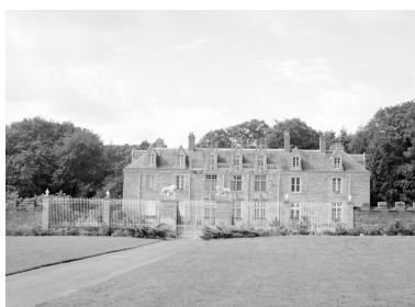
Élévation est : vue générale