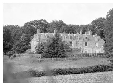
Vue de situation prise du sud-est IVR53_19835602399X