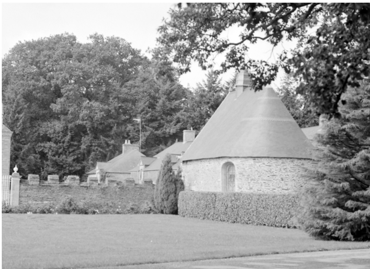
Chapelle : vue générale prise du sud-est