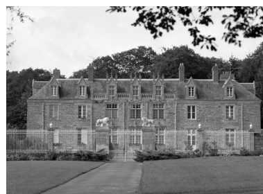
Élévation est : vue générale IVR53_19835602401X