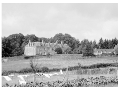
Vue de situation prise du sud-est