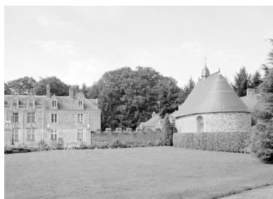
Chapelle : vue de situation IVR53_19835602408X