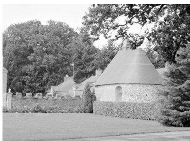
Chapelle : vue générale prise du sud-est IVR53_19835602407X