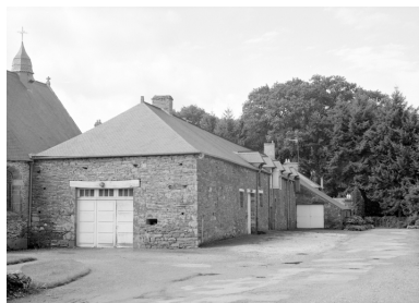
Communs, élévation nord : vue générale prise du nord-est IVR53_19835602406X