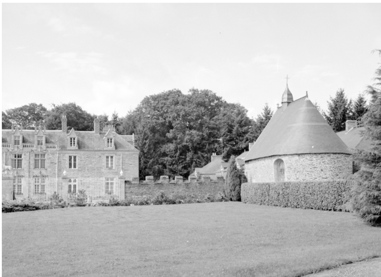
Chapelle : vue de situation