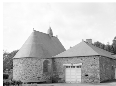
Chapelle : vue générale prise du nord-est IVR53_19835602403X