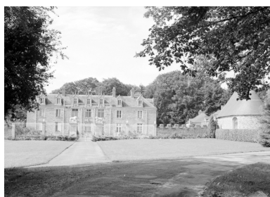
Élévation est : vue générale IVR53_19835602405X