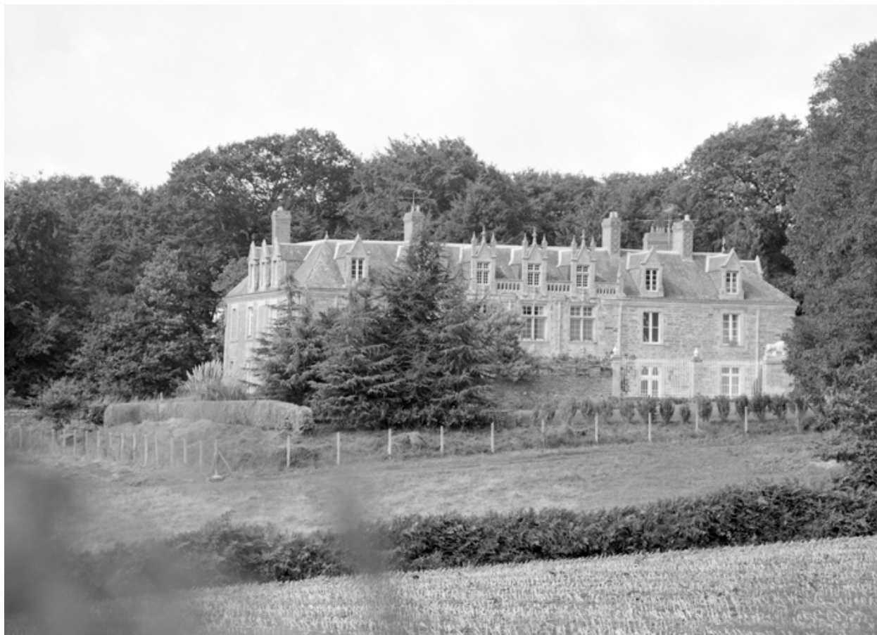
Vue de situation prise du sud-est