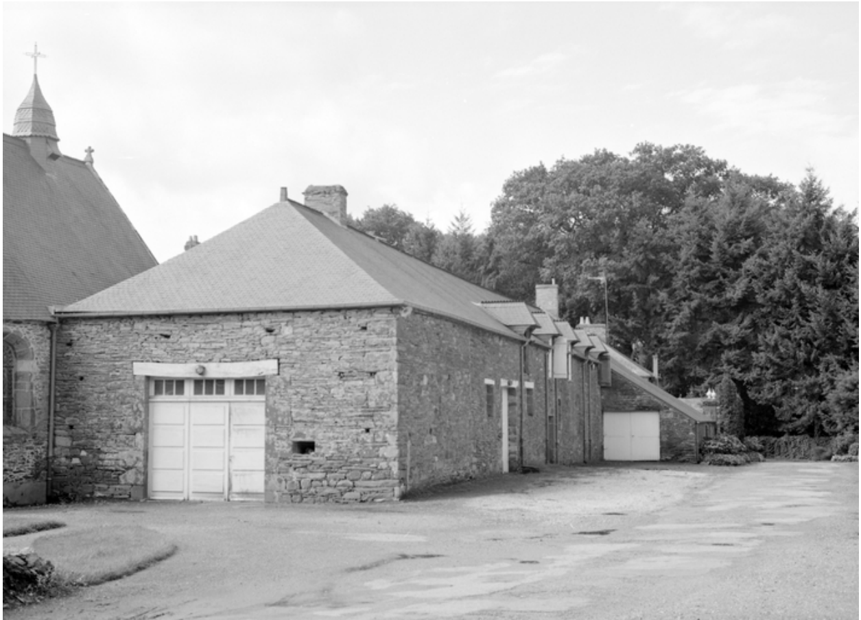
Communs, élévation nord : vue générale prise du nord-est