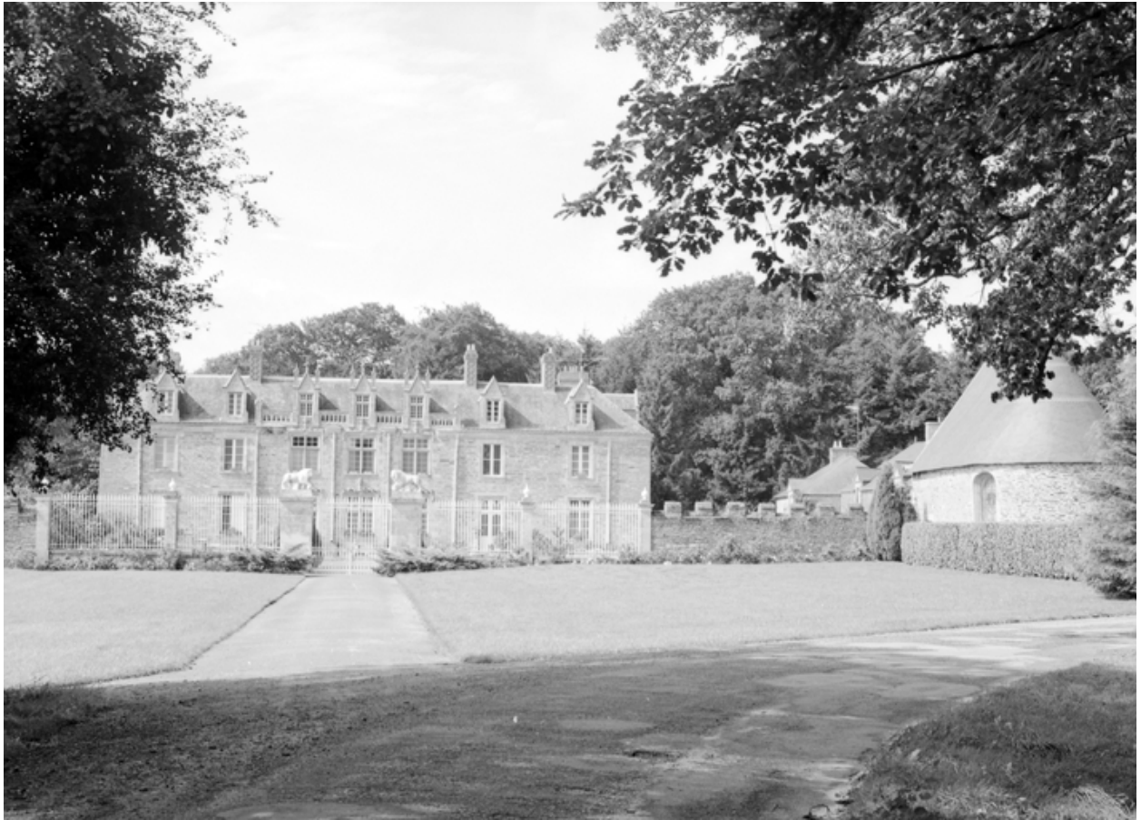
Élévation est : vue générale