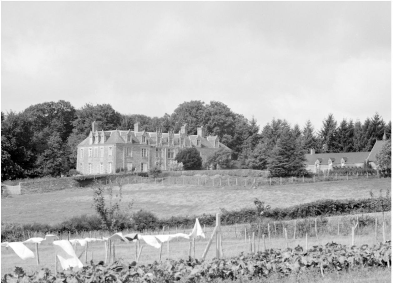
Vue de situation prise du sud-est