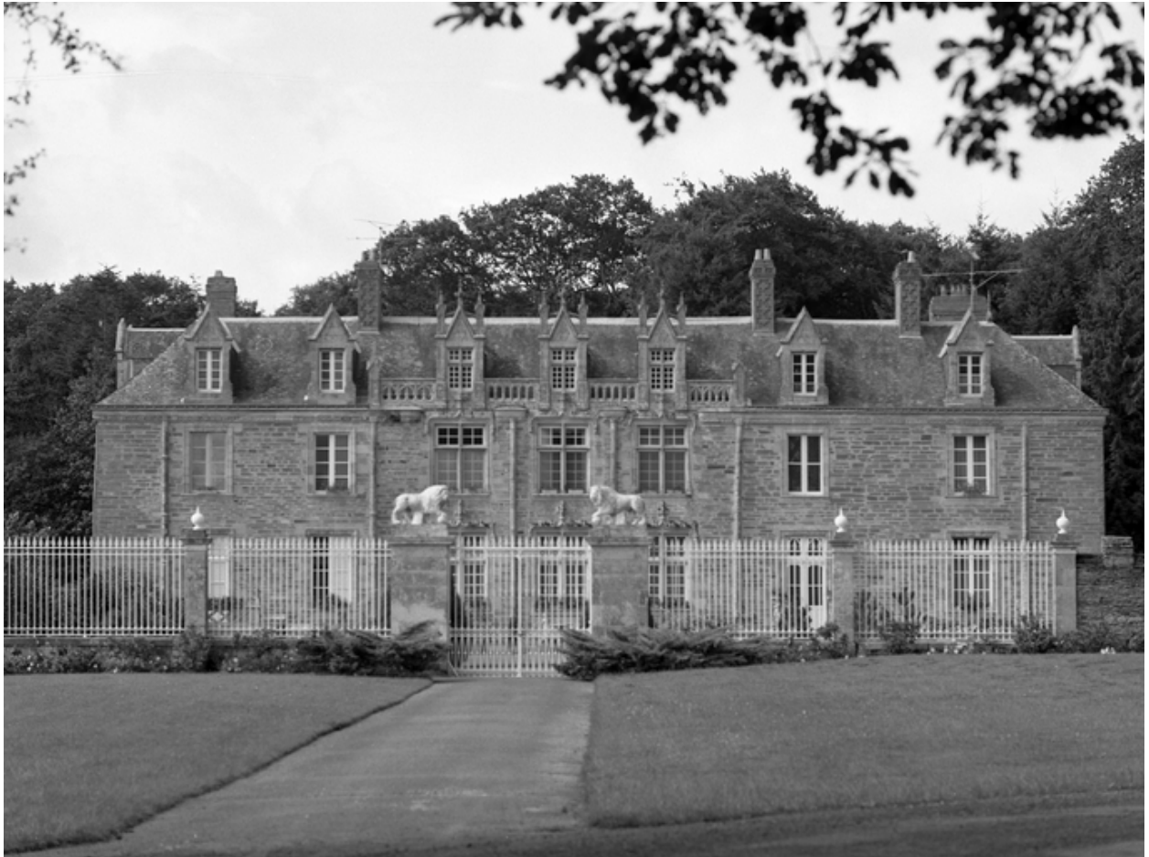
Élévation est : vue générale