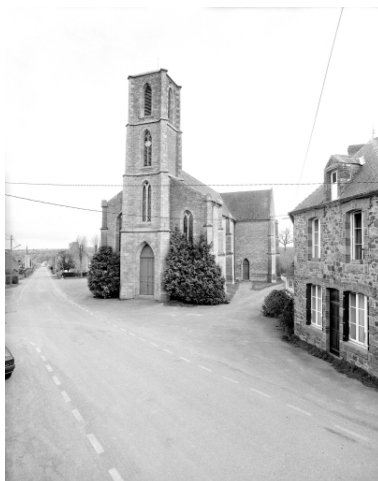
Vue générale ouest IVR53_19943500724X