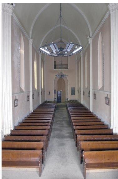
Vue intérieure prise du choeur vers la nef IVR53_20063500817NUCA