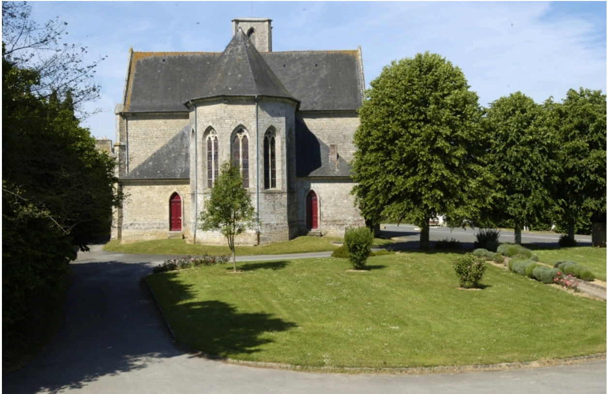
Vue générale Est