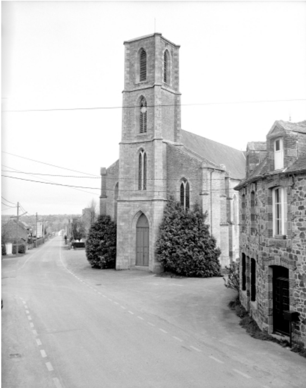
Elévation Sud-Ouest : vue générale