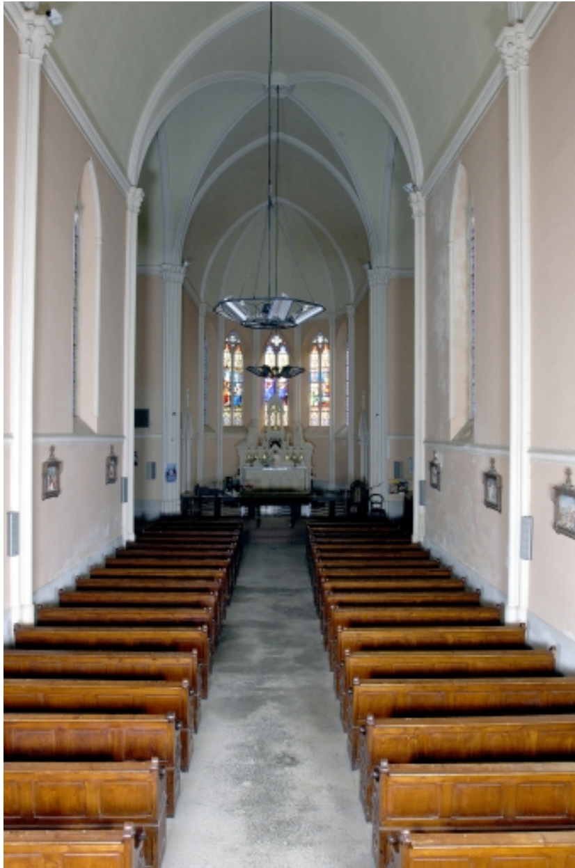
Vue intérieure prise de la nef vers le chœur