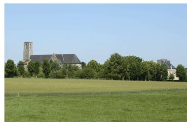
Vue de situation IVR53_20063501310NUCA