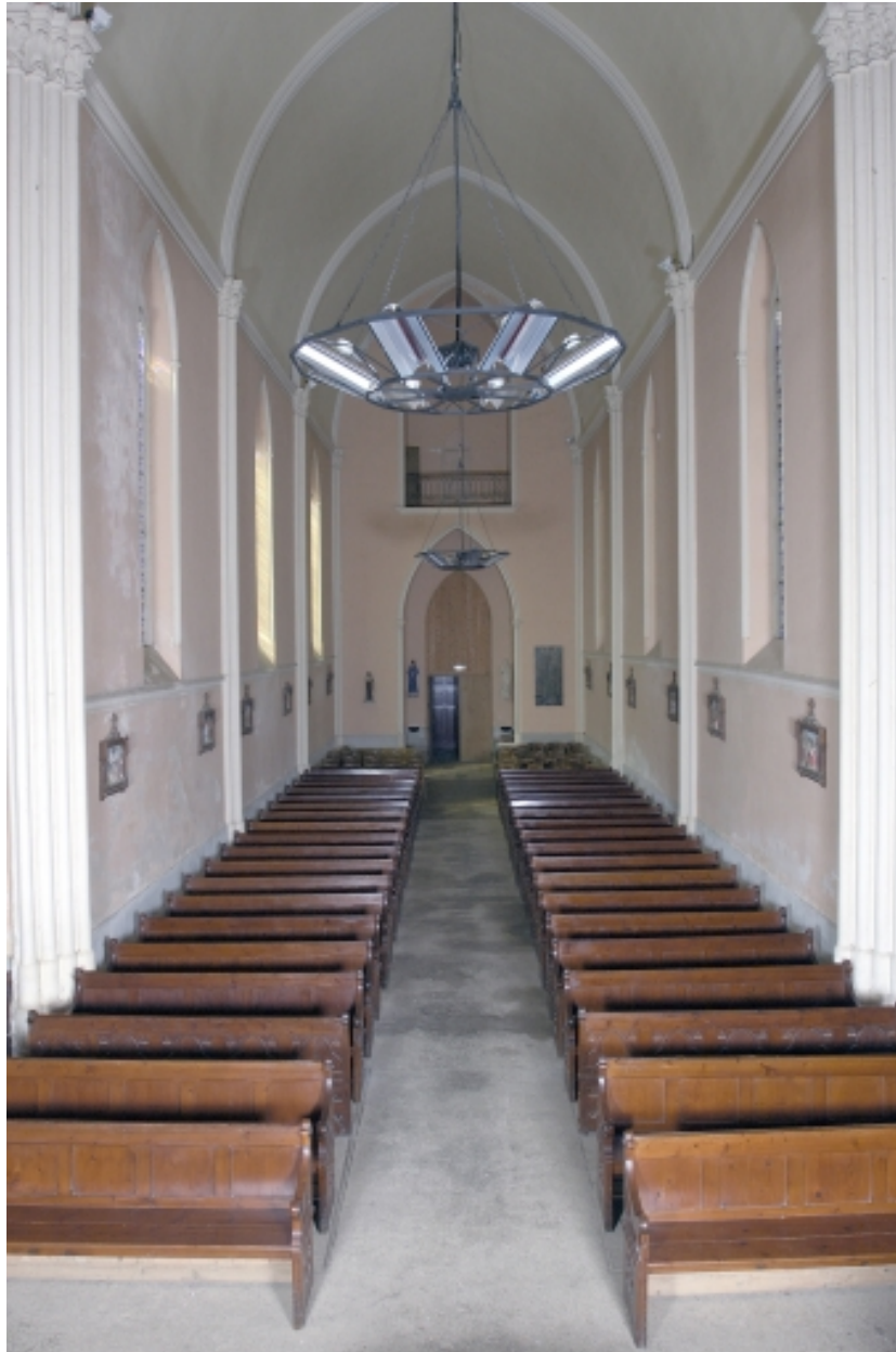
Vue intérieure prise du choeur vers la nef