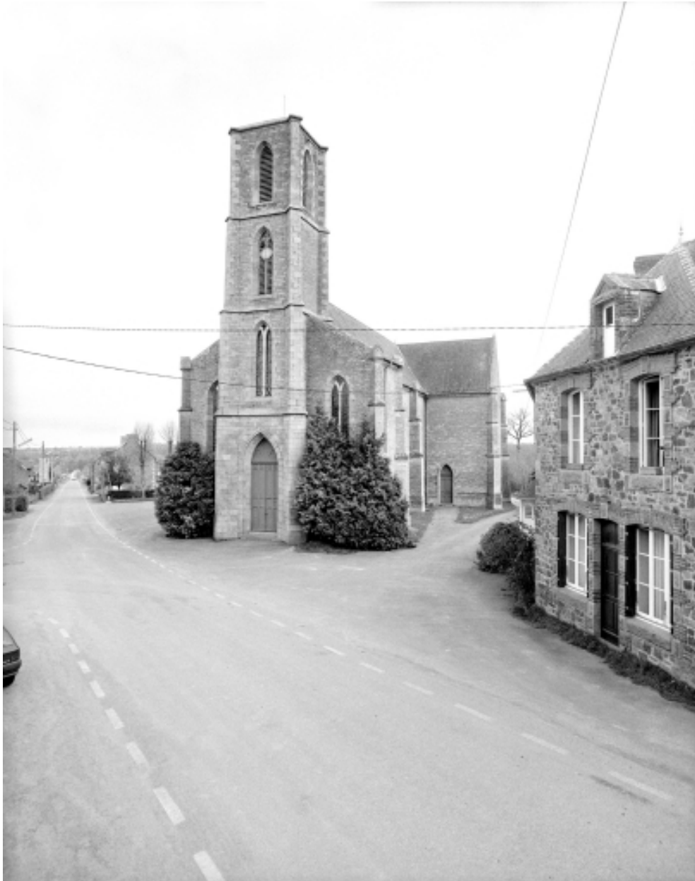
Vue générale ouest