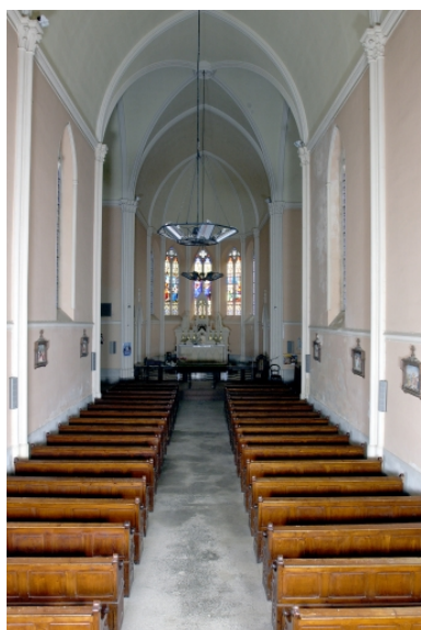
Vue intérieure prise de la nef vers le choeur