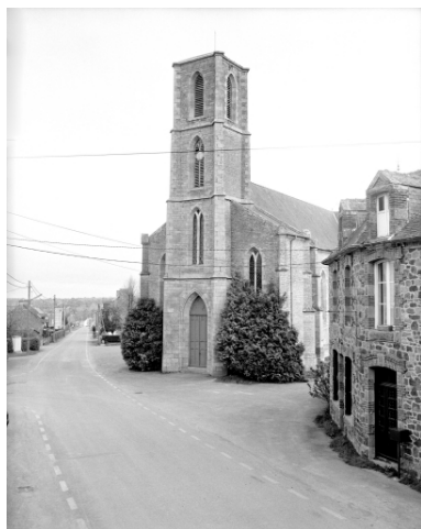
Elévation Sud-Ouest : vue générale IVR53_19943500725X