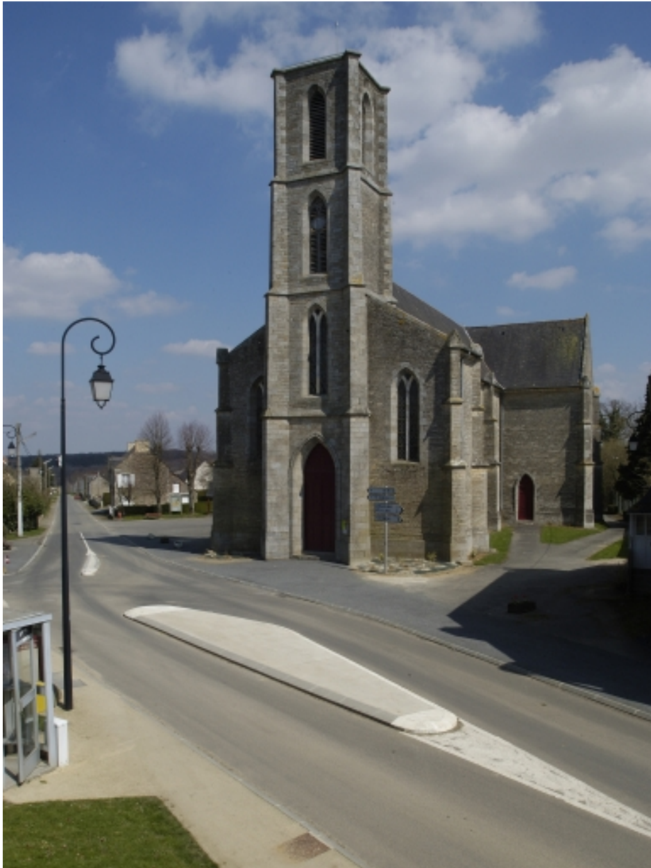
Vue générale ouest