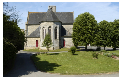
Vue générale Est IVR53_20063501295NUCA