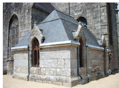
Plouneventer, église paroissiale Saint-Néventer : sacristie, détail