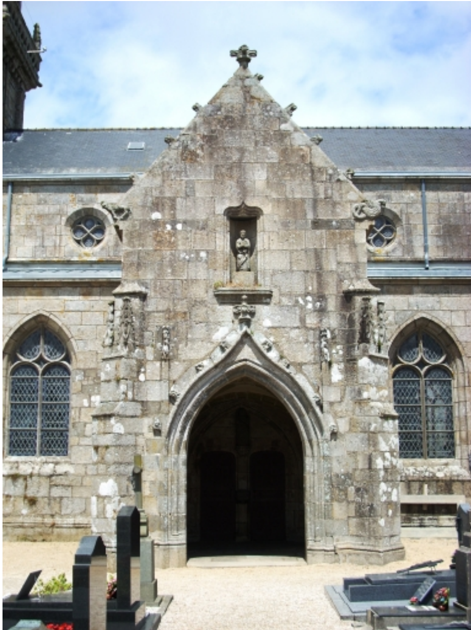
Plouneventer, église paroissiale Saint-Néventer : porche sud, détail