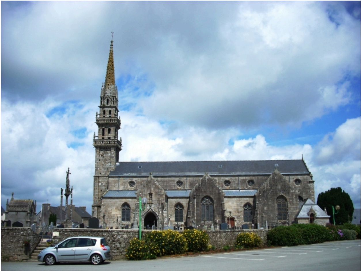
Plouneventer, église paroissiale Saint-Néventer : élévation sud