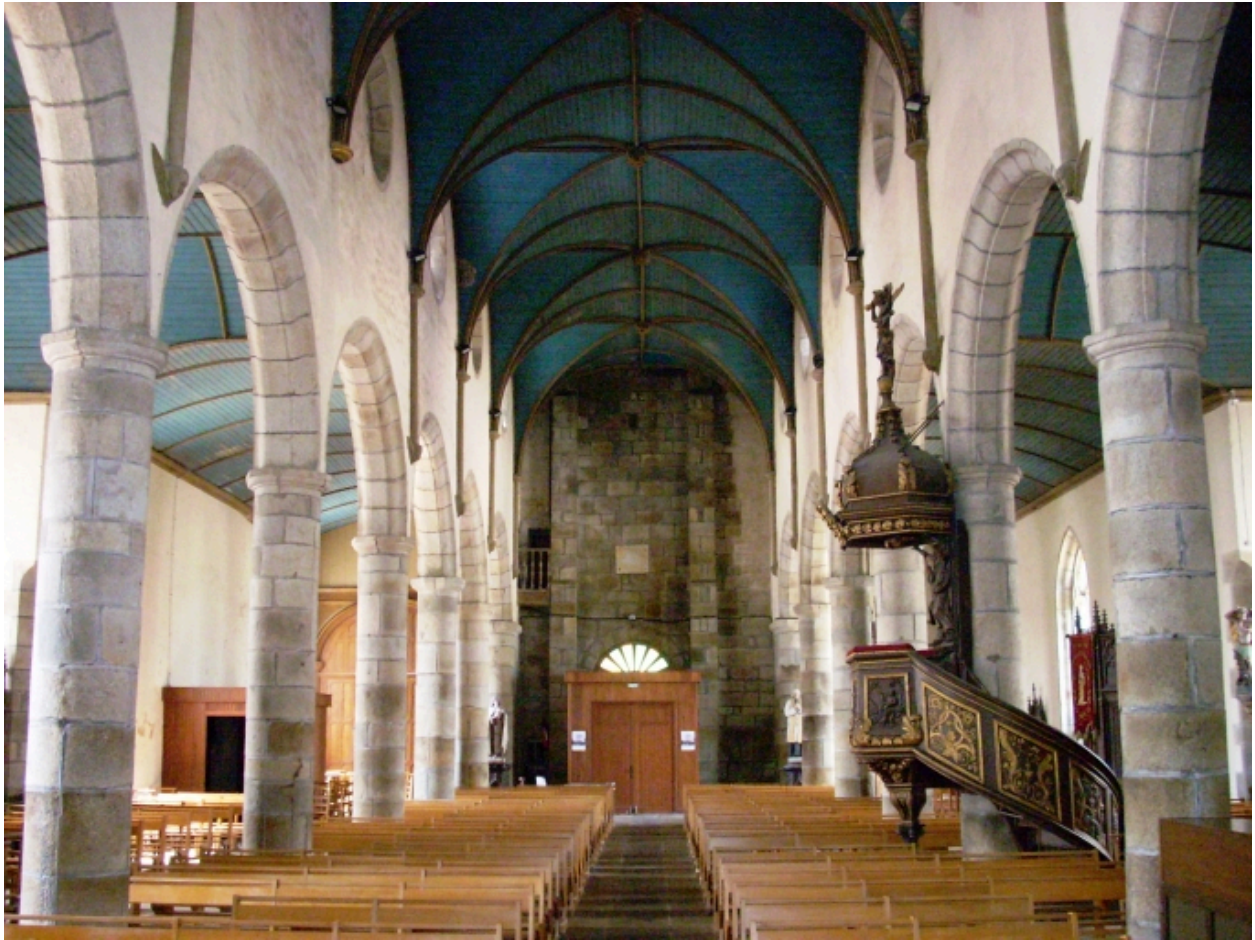
Plouneventer, église paroissiale Saint-Néventer : vue axiale ouest