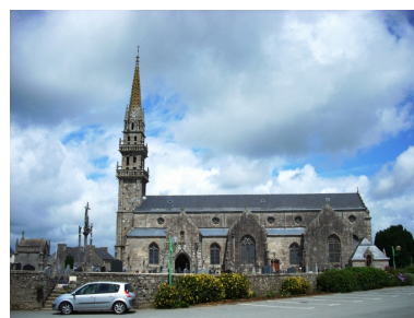
Plouneventer, église paroissiale Saint-Néventer : élévation sud IVR53_20082906459NUCA