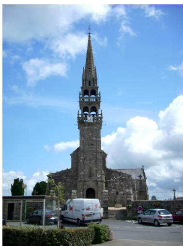
Plouneventer, église paroissiale Saint-Néventer : élévation ouest