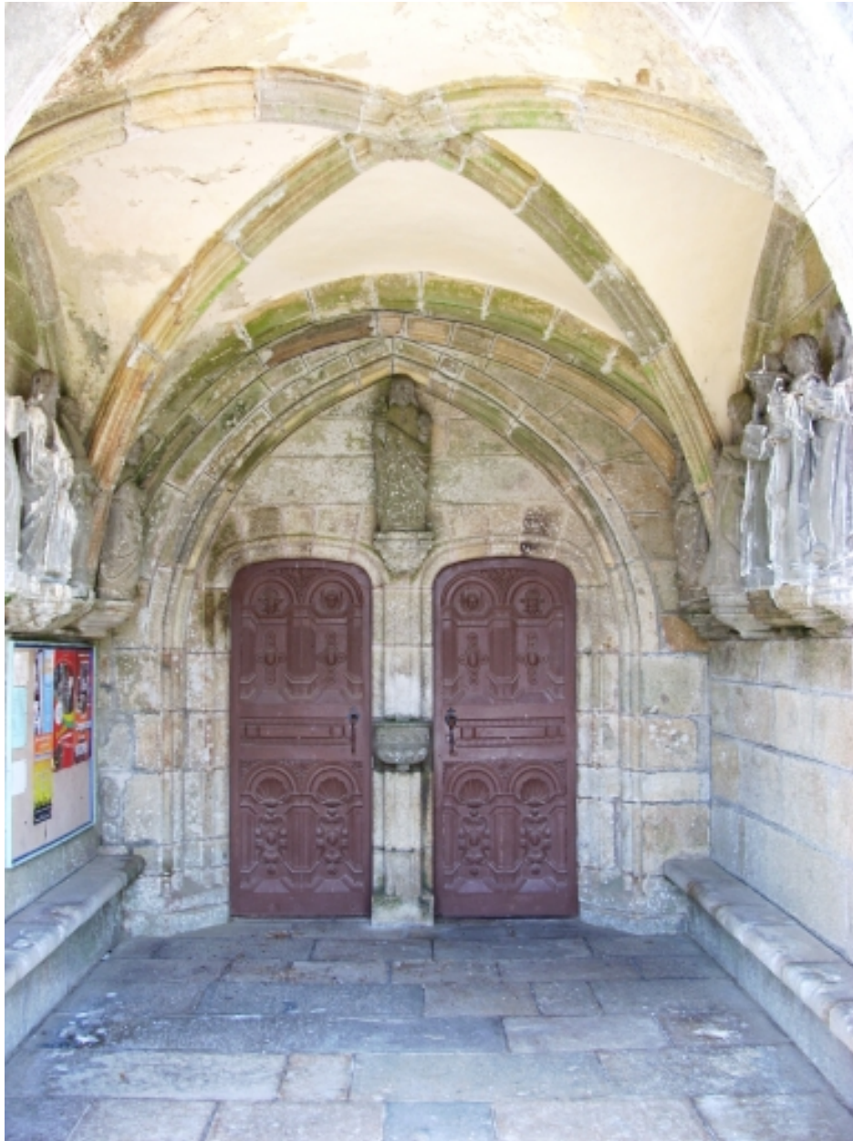
Plouneventer, église paroissiale Saint-Néventer : porche sud, intérieur, détail