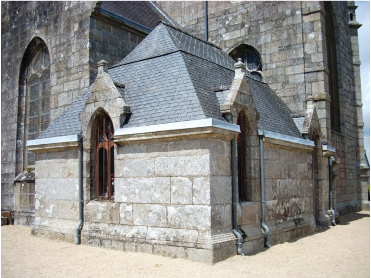
Plouneventer, église paroissiale Saint-Néventer : sacristie, détail