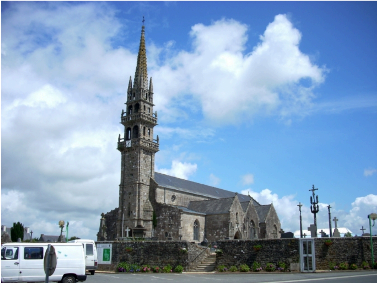
Plouneventer, église paroissiale Saint-Néventer : vue générale sud-ouest