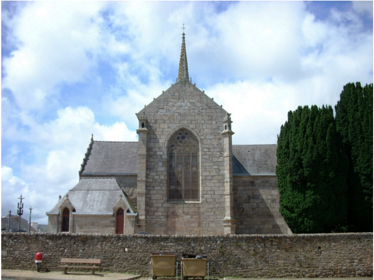
Plouneventer, église paroissiale Saint-Néventer : élévation est