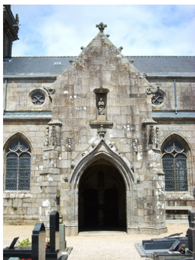
Plouneventer, église paroissiale Saint-Néventer : porche sud, détail IVR53_20082906463NUCA