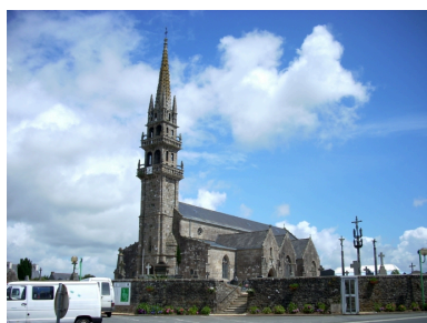
Plouneventer, église paroissiale Saint-Néventer : vue générale sud-ouest IVR53_20082906457NUCA