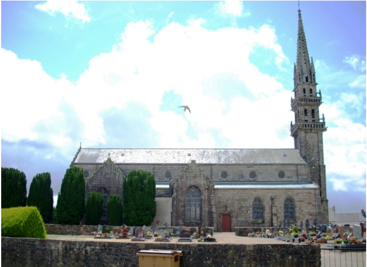
Plouneventer, église paroissiale Saint-Néventer : élévation nord