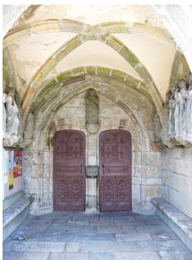
Plouneventer, église paroissiale Saint-Néventer : porche sud, intérieur, détail IVR53_20082906464NUCA