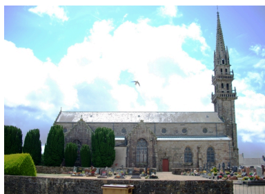
Plouneventer, église paroissiale Saint-Néventer : élévation nord IVR53_20082906460NUCA