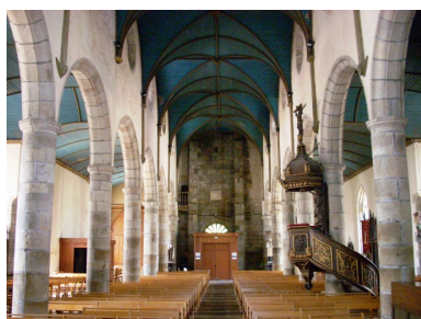
Plouneventer, église paroissiale Saint-Néventer : vue axiale ouest IVR53_20082906466NUCA