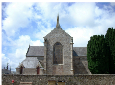
Plouneventer, église paroissiale Saint-Néventer : élévation est