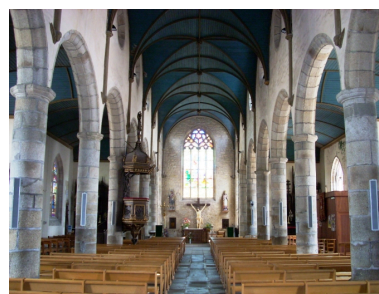
Plouneventer, église paroissiale Saint-Néventer : vue axiale est