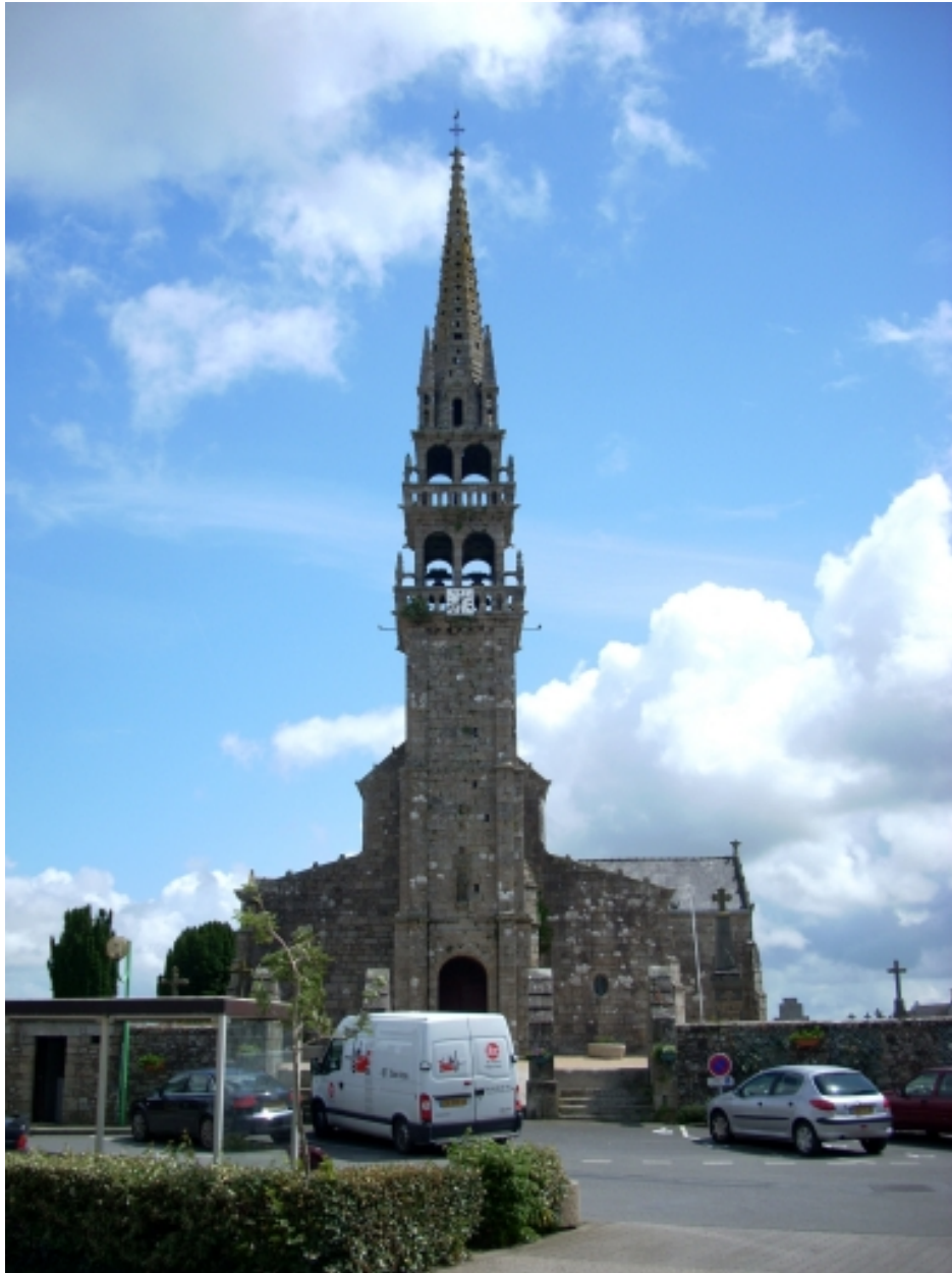
Plouneventer, église paroissiale Saint-Néventer : élévation ouest