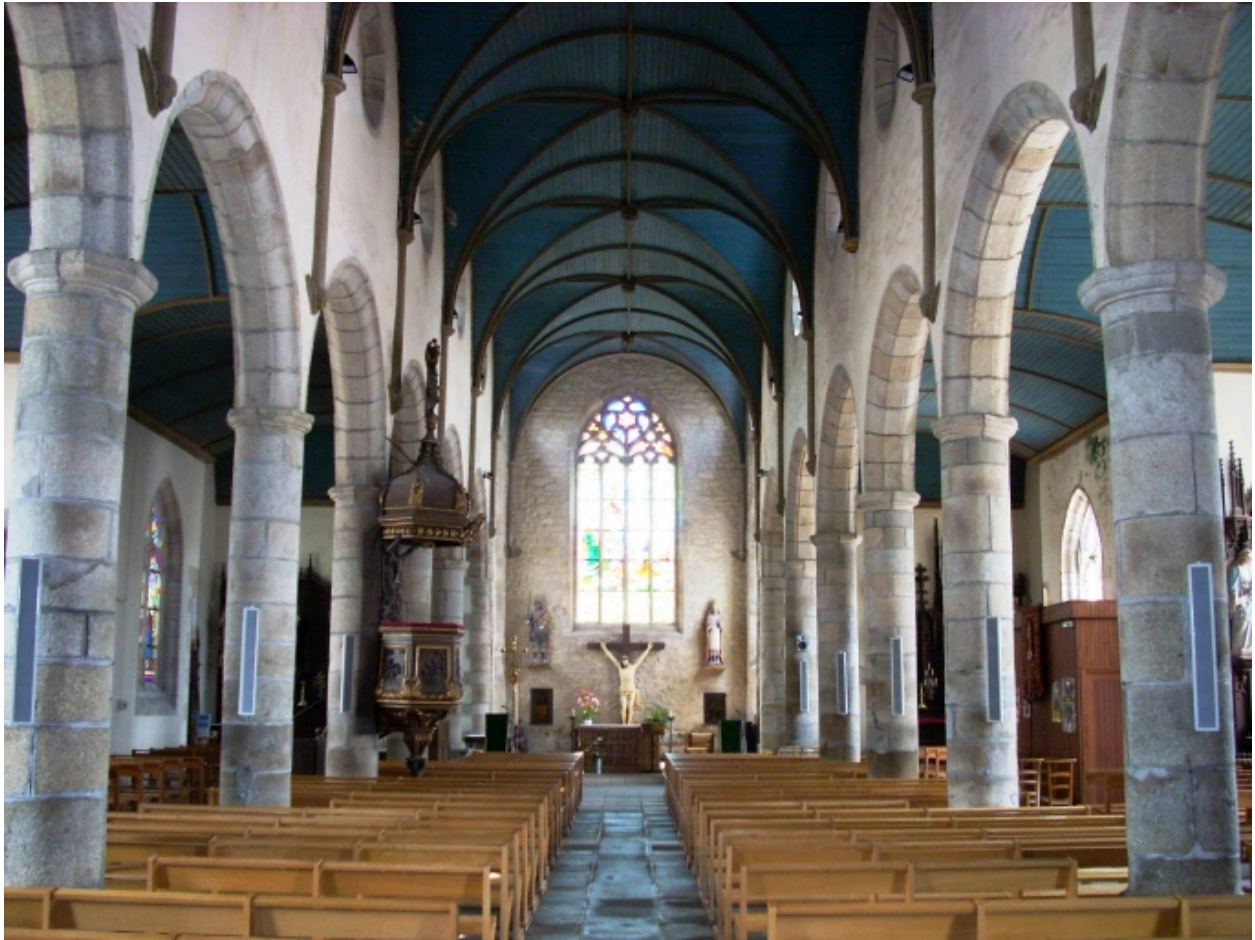
Plouneventer, église paroissiale Saint-Néventer : vue axiale est