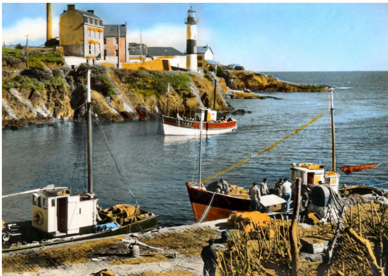
Ancienne conserverie Capitaine Cook dans les années 1950