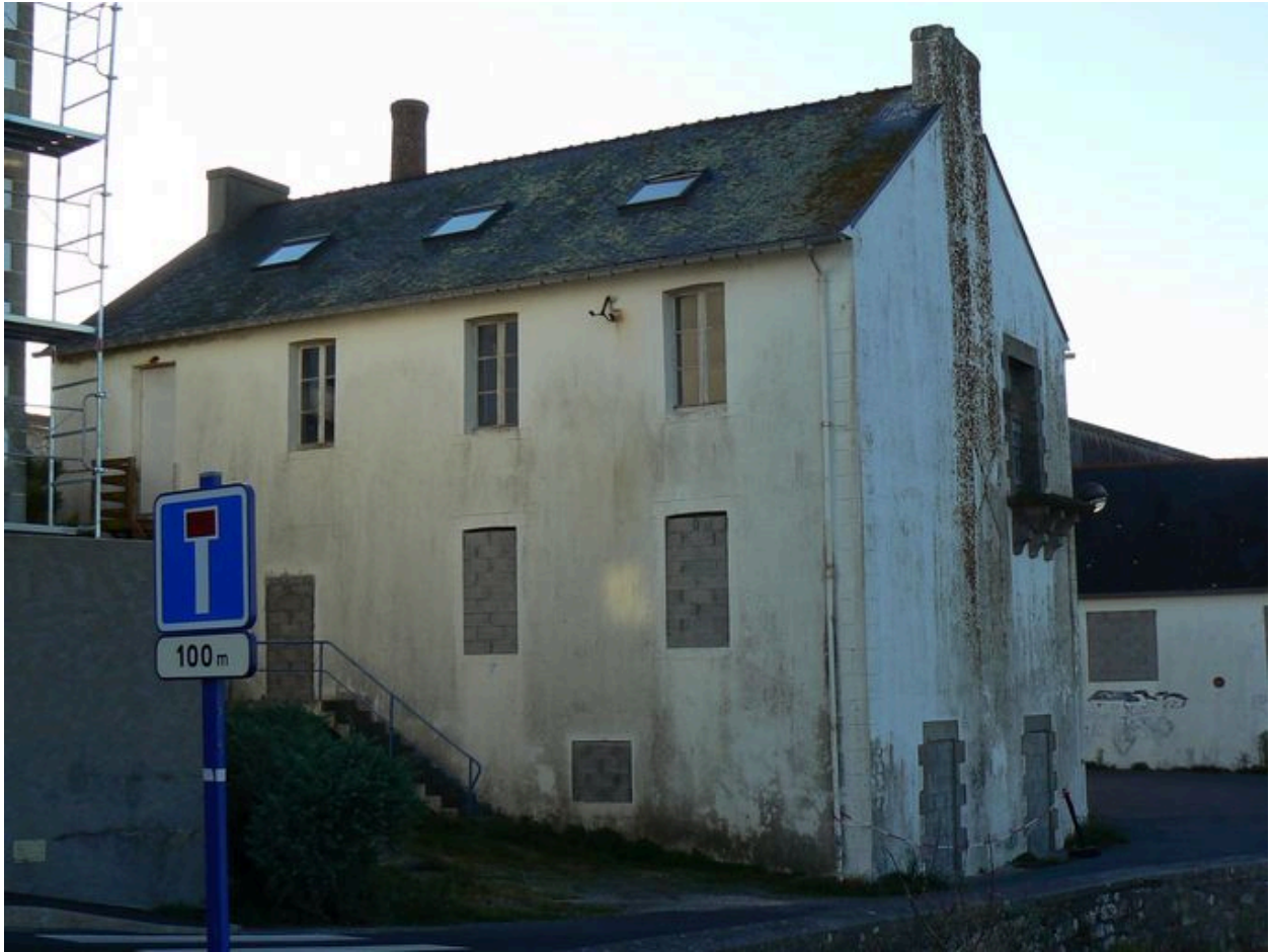
Façade arrière d'un des bâtiments nord de l'ancienne conserverie Capitaine Cook