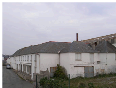
Ancienne conserverie Capitaine Cook, côté sud-est