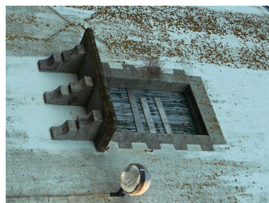
Balcon d'un des bâtiments nord de l'ancienne conserverie Capitaine Cook, donnant sur la ria