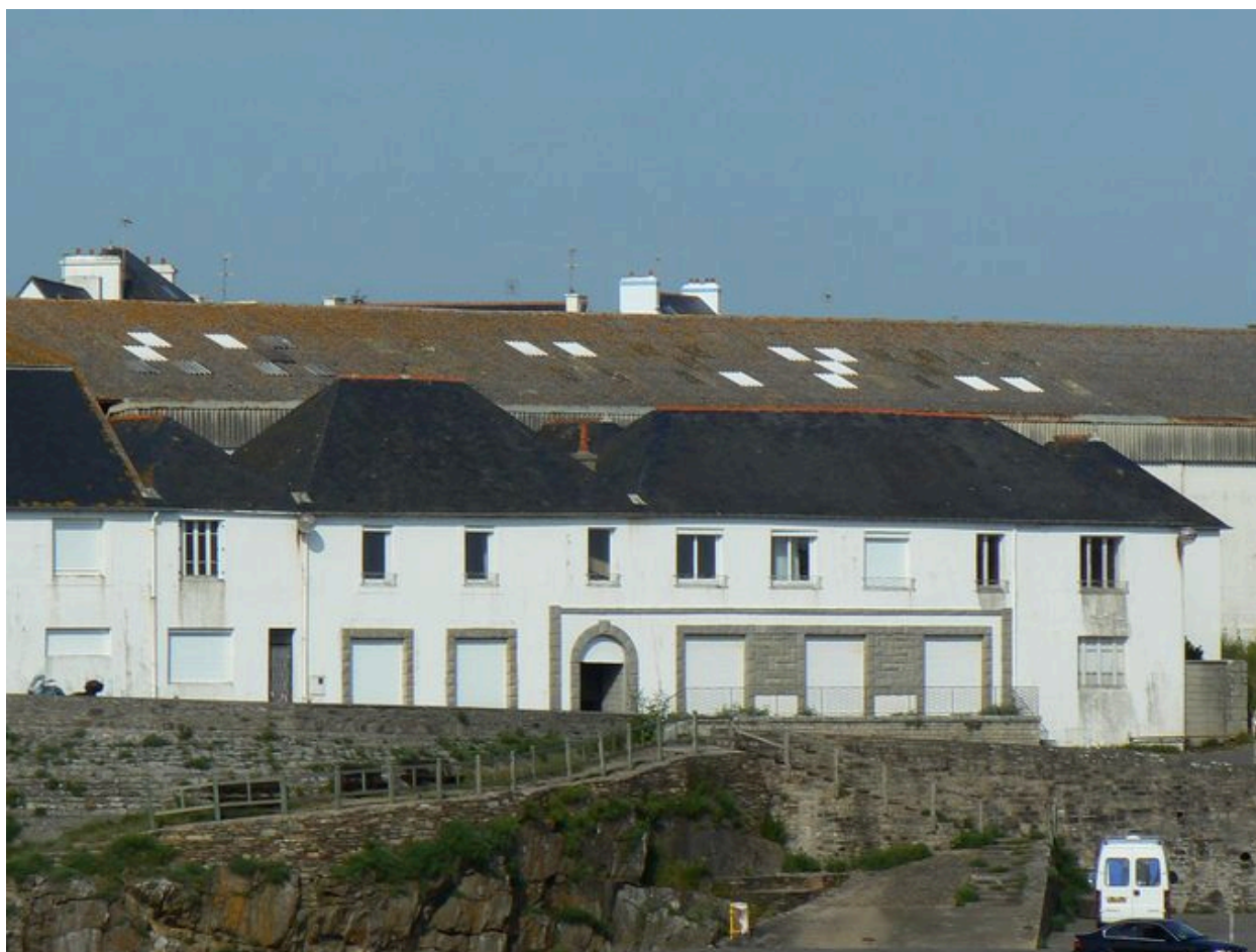
Ancienne conserverie Capitaine Cook, côté mer