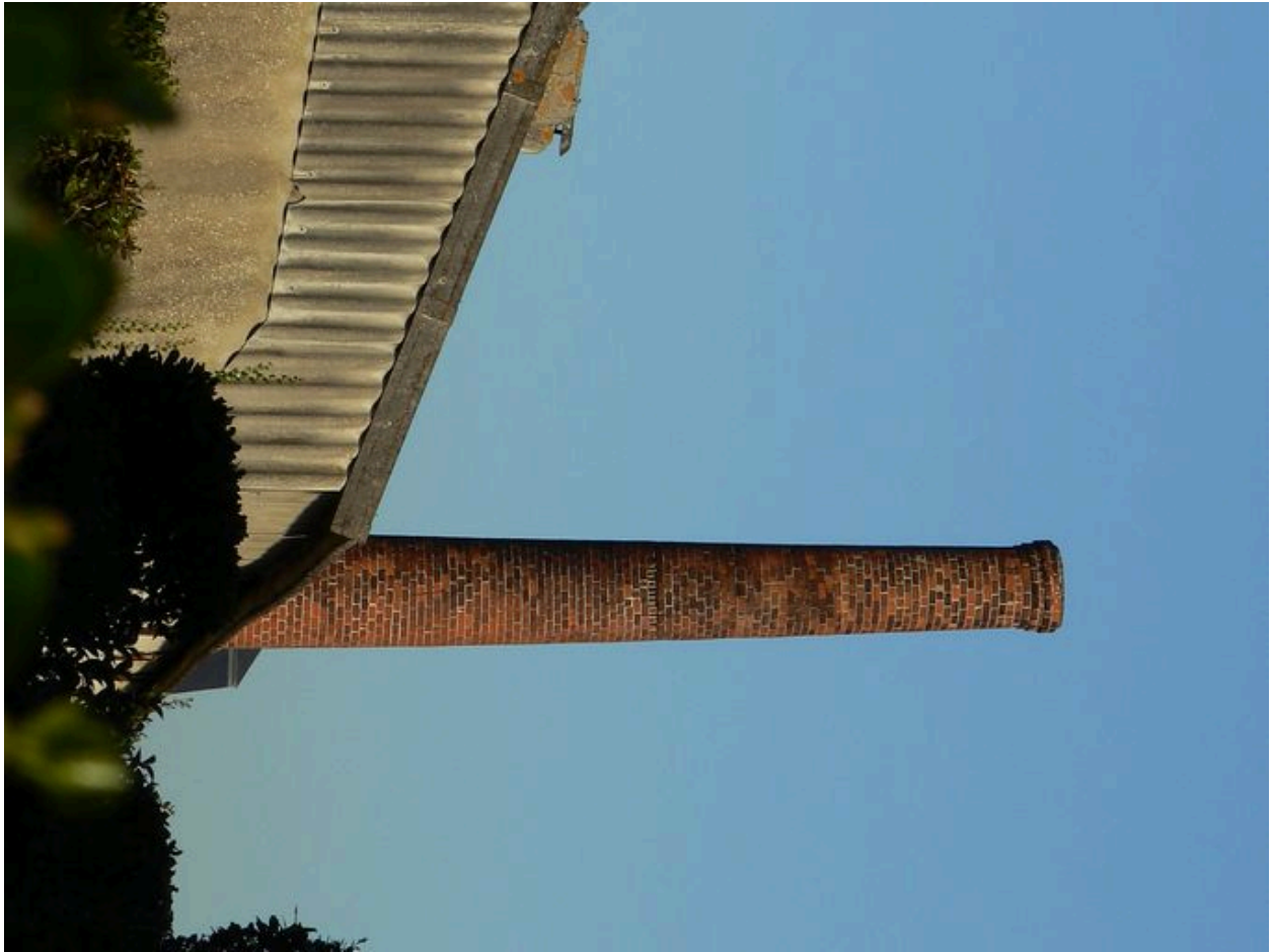
Cheminée de l'ancienne conserverie Capitaine Cook