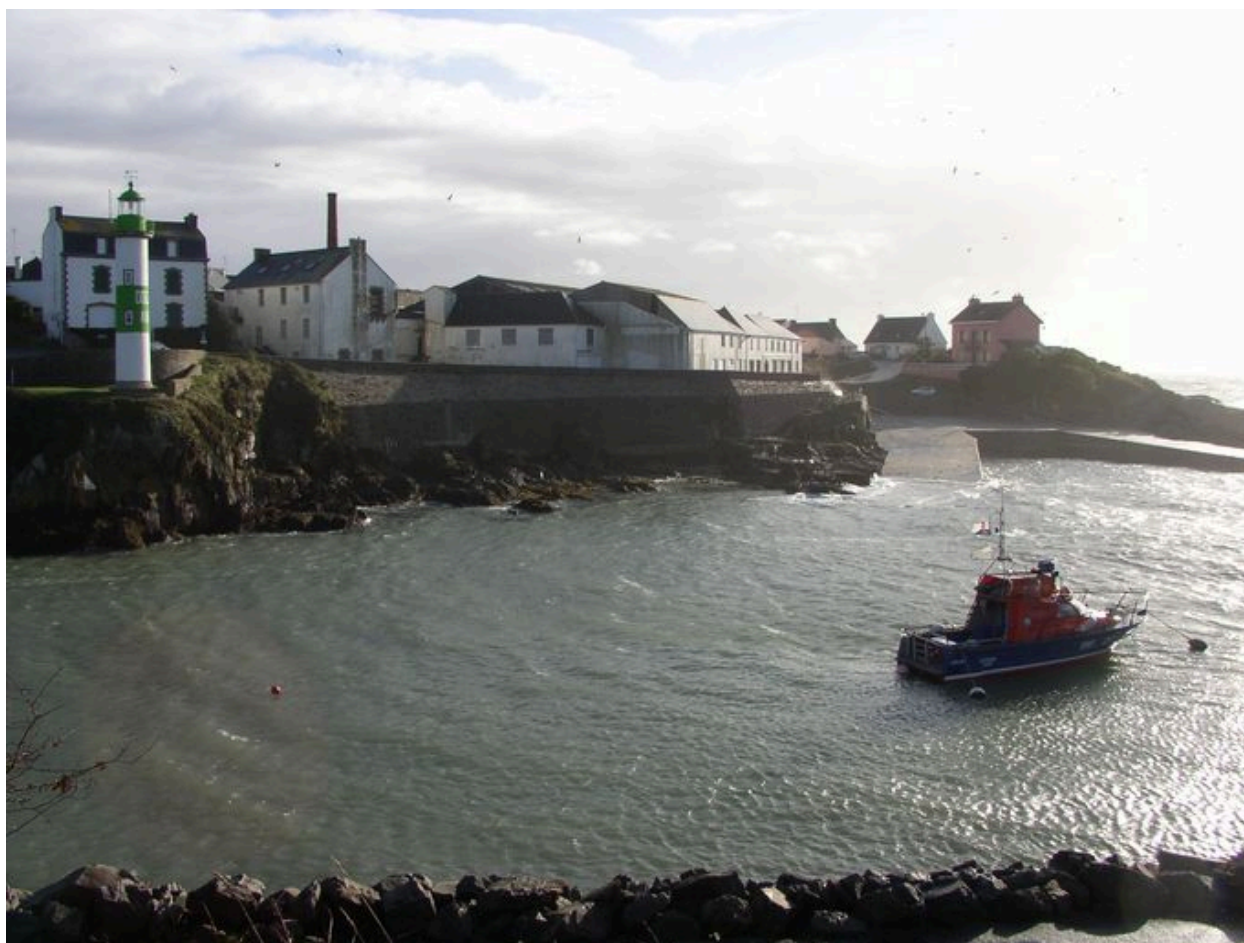
Ancienne conserverie Capitaine Cook vue de la rive droite