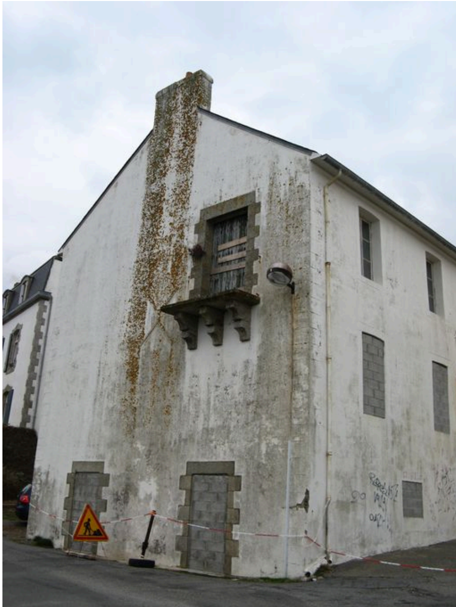
Un des bâtiments nord de l'ancienne conserverie Capitaine Cook donnant sur la ria