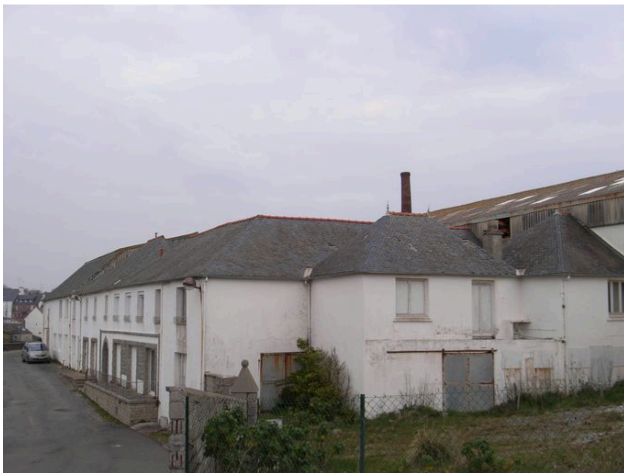
Ancienne conserverie Capitaine Cook, côté sud-est