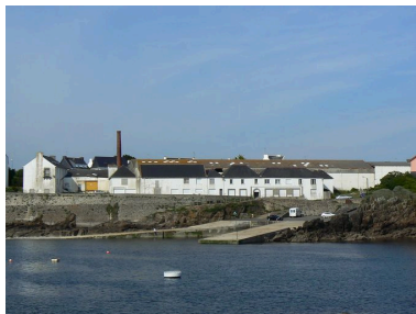
Vue générale de l'ancienne conserverie Capitaine Cook