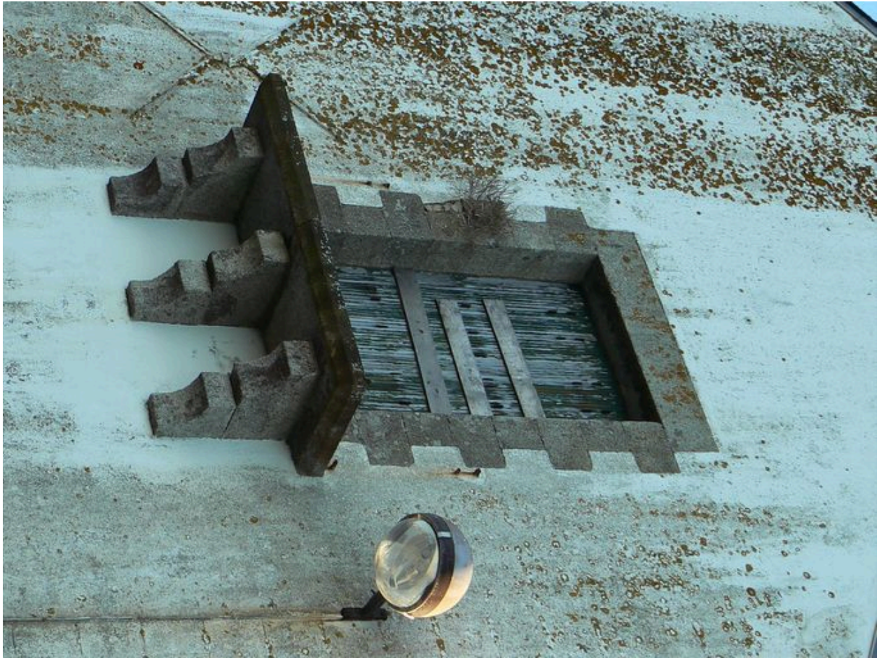
Balcon d'un des bâtiments nord de l'ancienne conserverie Capitaine Cook, donnant sur la ria