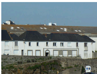
Ancienne conserverie Capitaine Cook, côté mer IVR53_20082908628NUCA