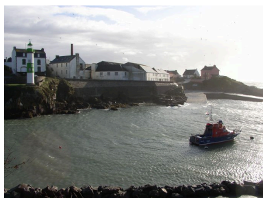
Ancienne conserverie Capitaine Cook vue de la rive droite IVR53_20062908664NUCA