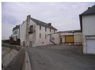
Ancienne conserverie Capitaine Cook, côté ria