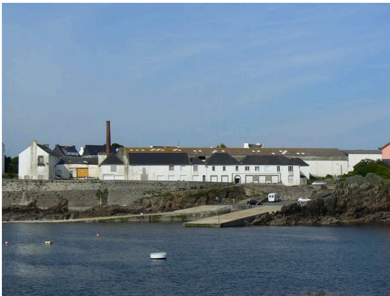
Vue générale de l'ancienne conserverie Capitaine Cook