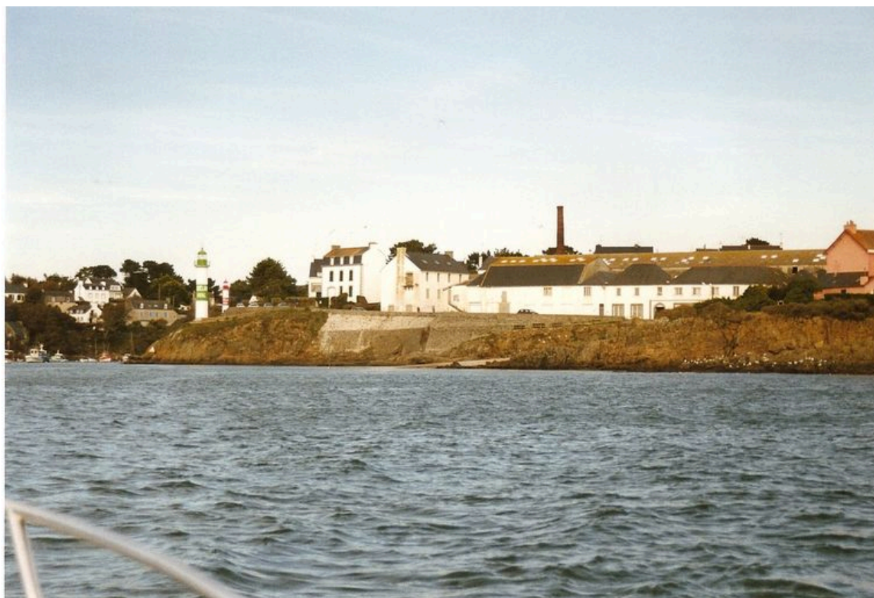
Ancienne conserverie Capitaine Cook, vue du large