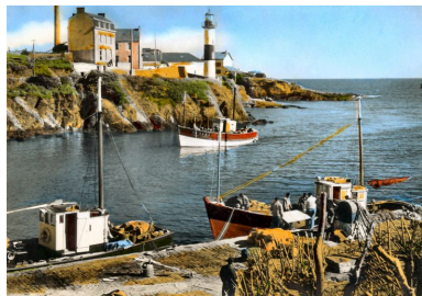
Ancienne conserverie Capitaine Cook dans les années 1950