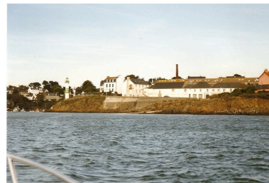
Ancienne conserverie Capitaine Cook, vue du large IVR53_20082908684NUCA