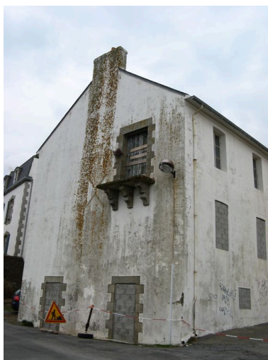
Un des bâtiments nord de l'ancienne conserverie Capitaine Cook donnant sur la ria