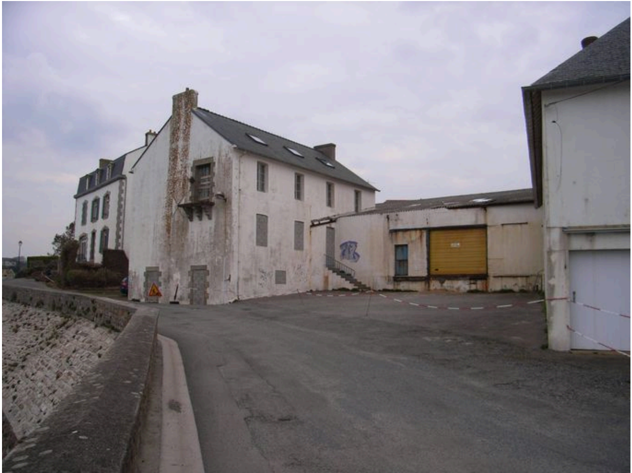
Ancienne conserverie Capitaine Cook, côté ria