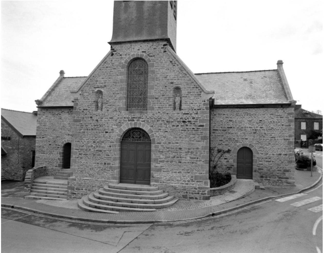
Vue générale ouest