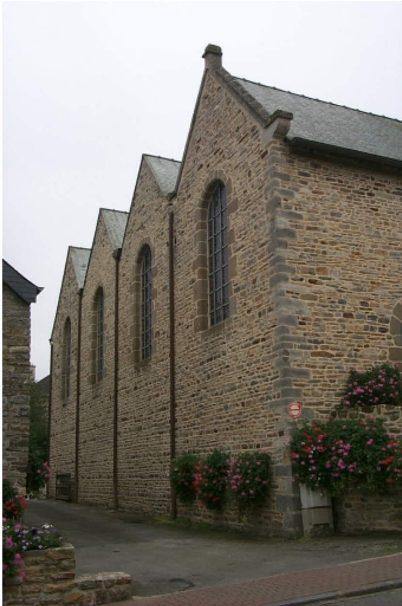
Vue partielle nord-ouest