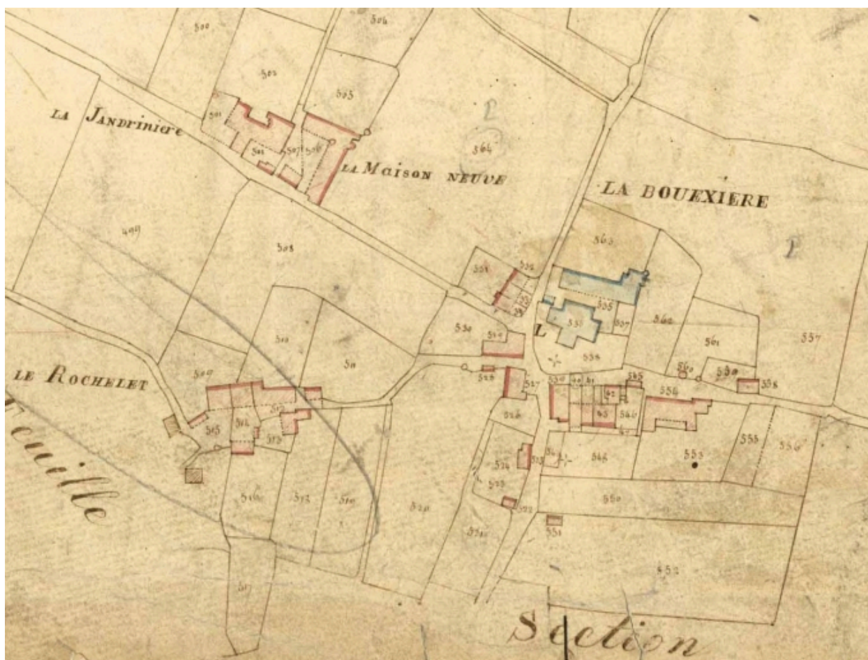
L'église sur le cadastre de 1826