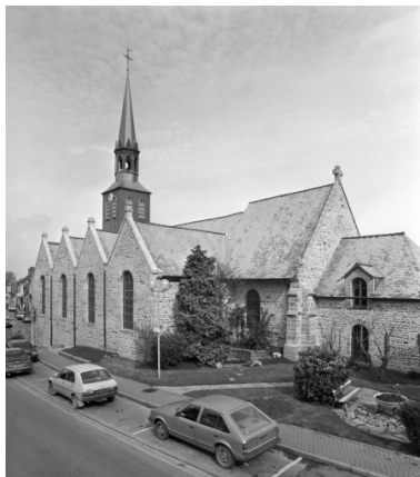
Vue générale sud-est, IVR53_19943500778X