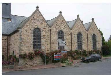
Vue générale sud-ouest IVR53_20013509926NUCA