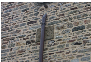
Détail : pierre gravée de la date 1844