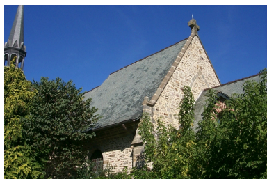
Vue générale sud-est, chevet