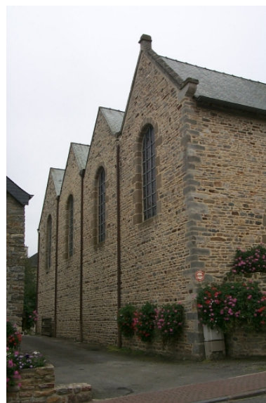
Vue partielle nord-ouest IVR53_20013509925NUCA