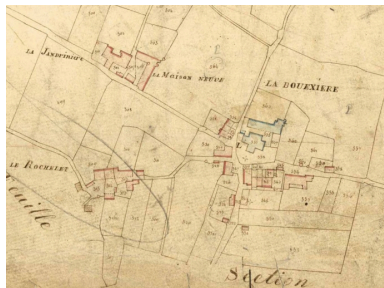
L'église sur le cadastre de 1826 IVR53_20013509139NUC