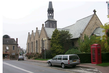
Vue générale sud-est IVR53_20013509923NUCA