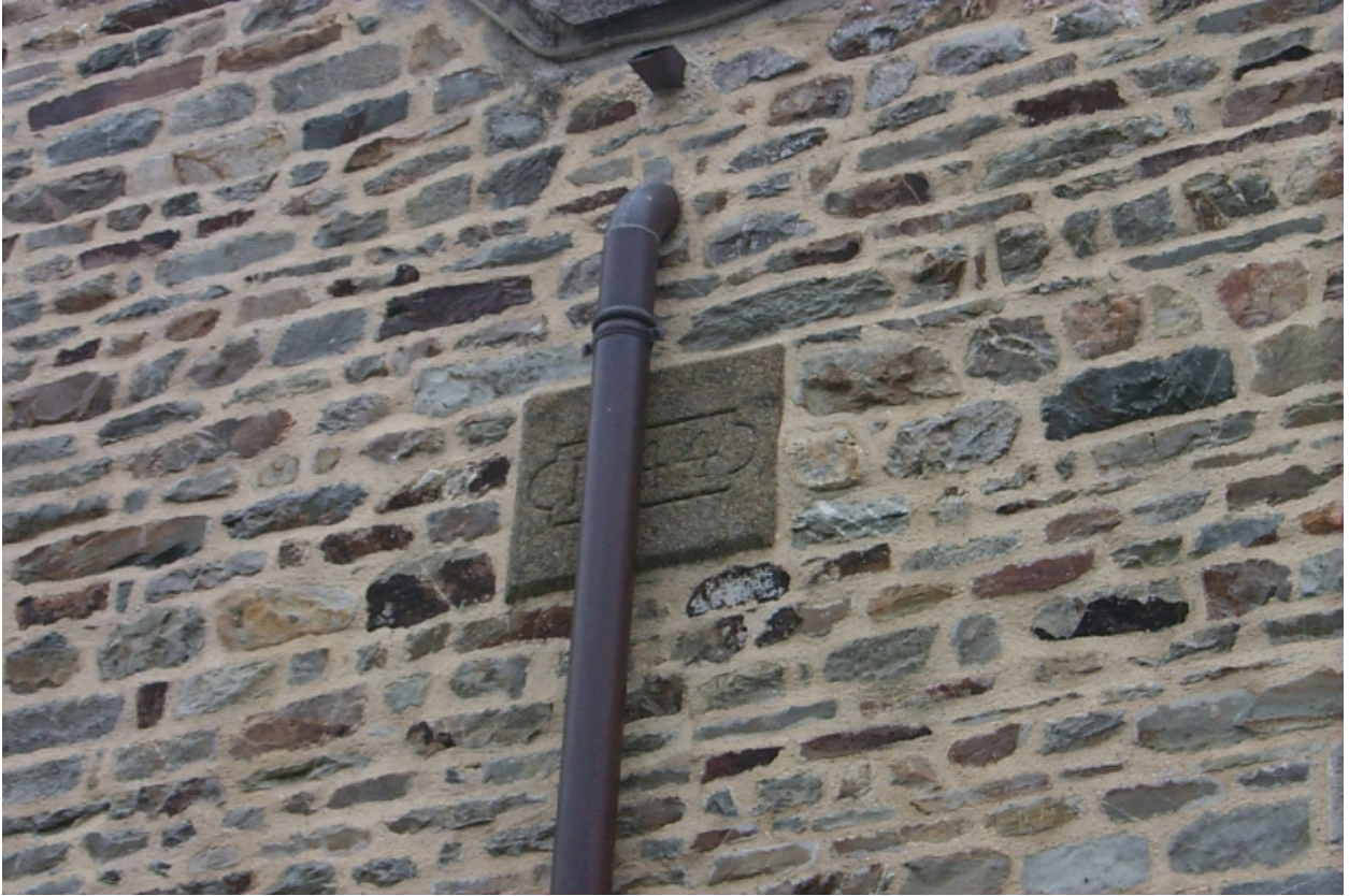
Détail : pierre gravée de la date 1844