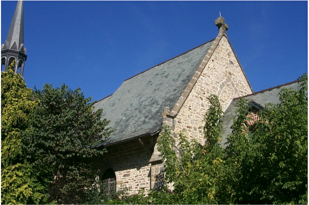
Vue générale sud-est, chevet