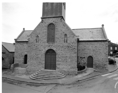
Vue générale ouest IVR53_19943508206X