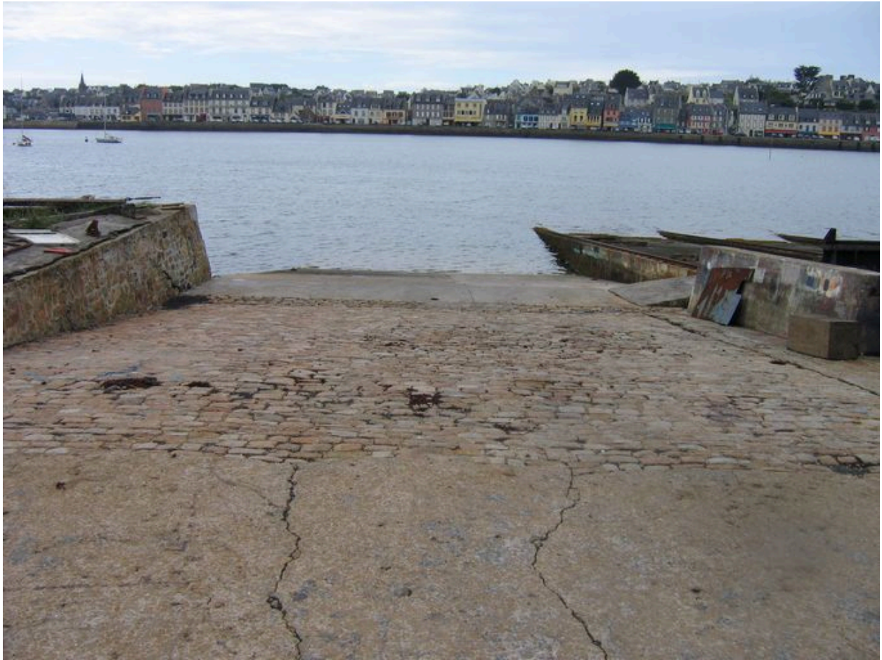
Vue générale de la cale des Viviers vers la mer