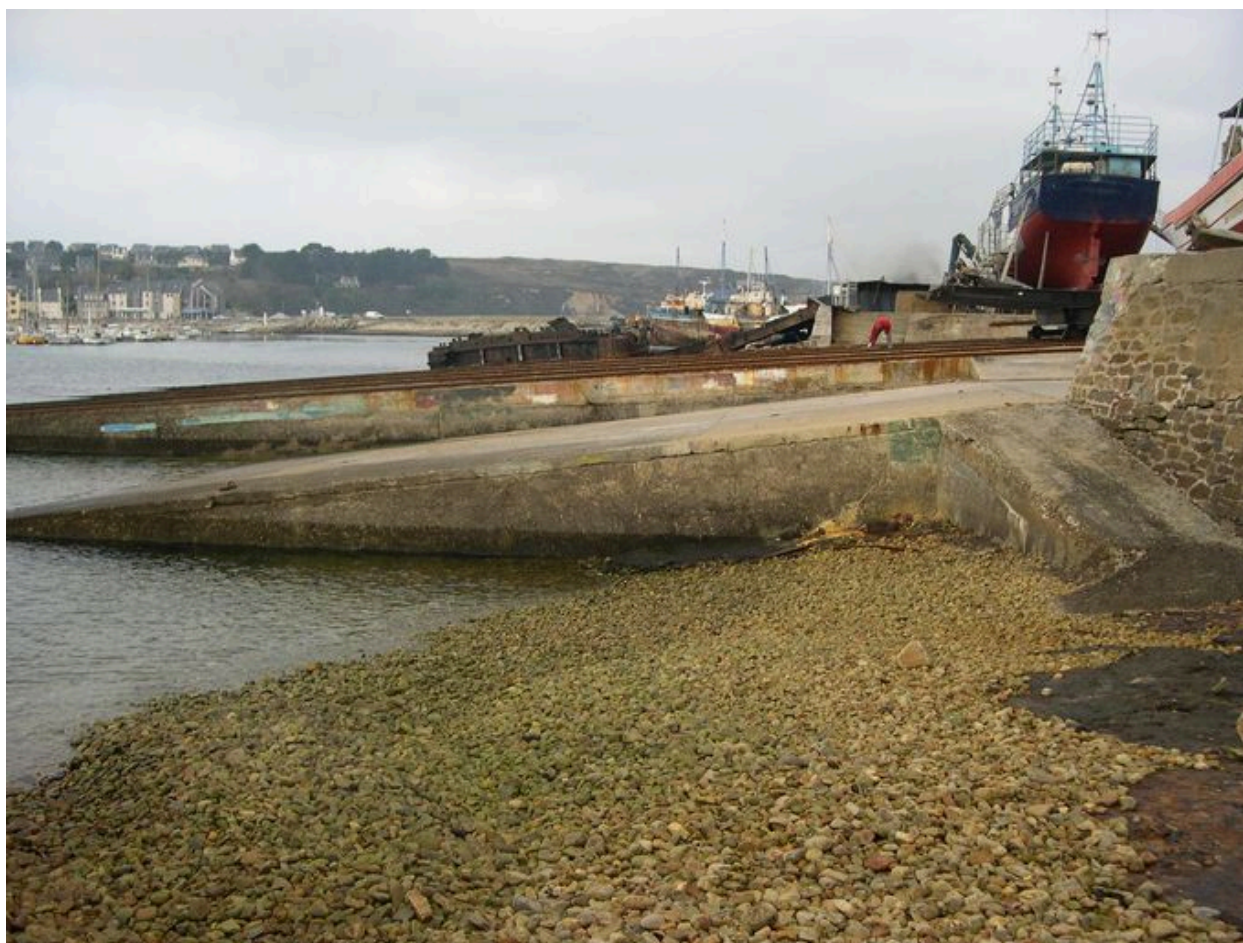
Vue latérale de la cale des Viviers