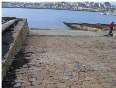
Vue générale de la cale des Viviers