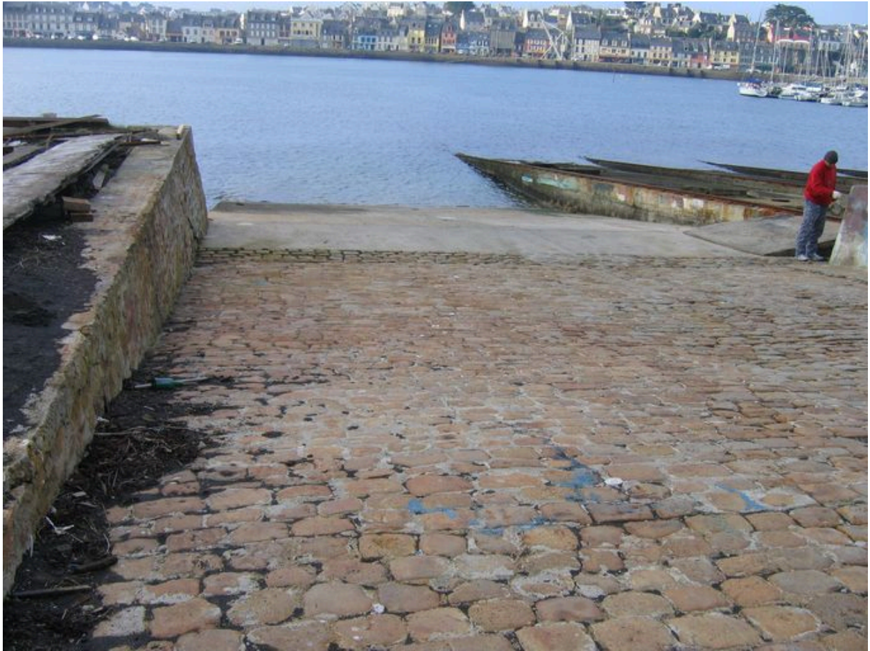
Vue générale de la cale des Viviers