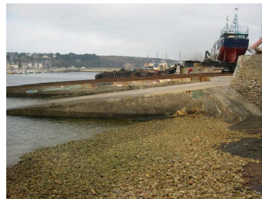
Vue latérale de la cale des Viviers IVR53_20062908370NUCA