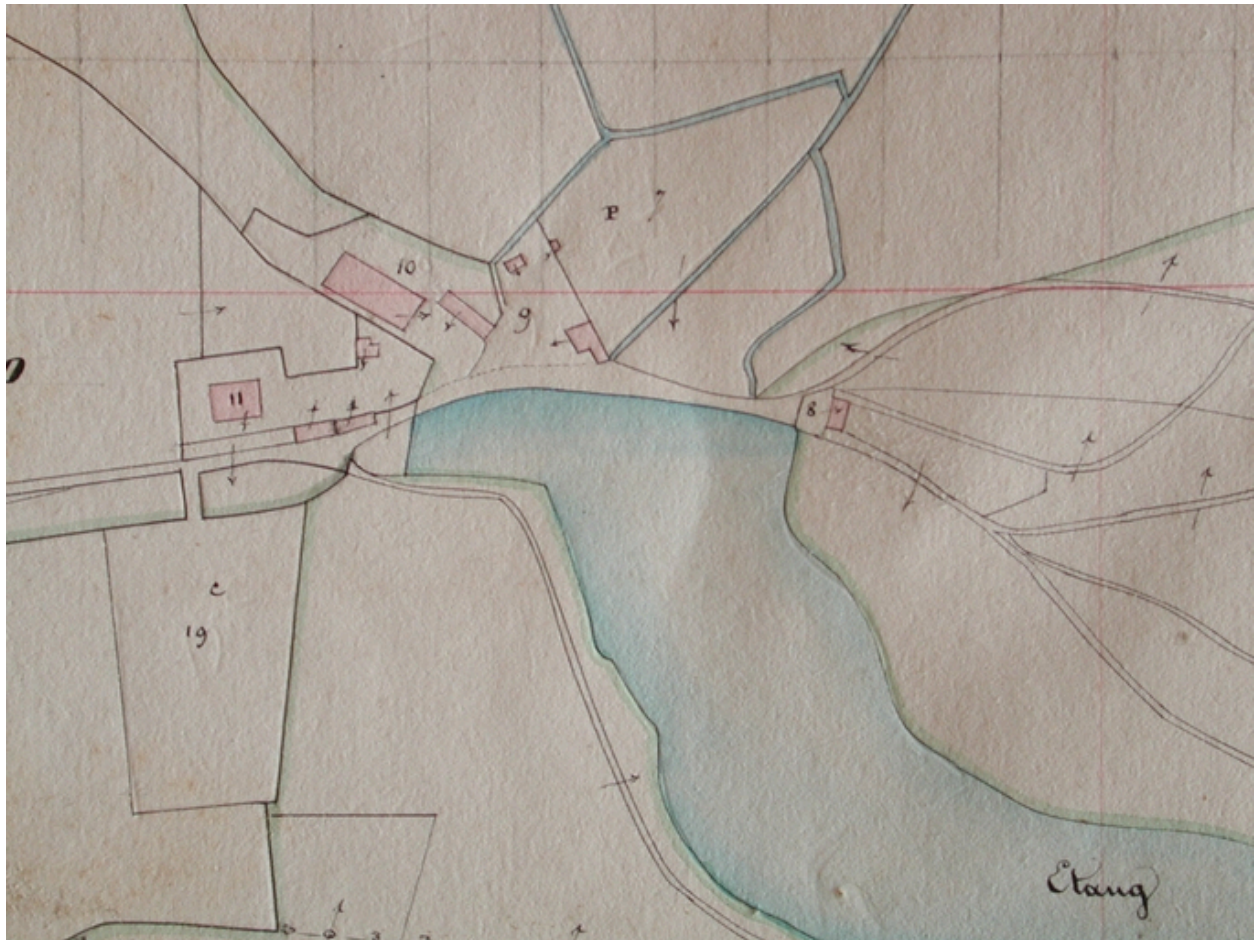
Le château de Bodélio et ses dépendances sur le cadastre de 1840 (A. D. Morbihan, série 3 P 443)