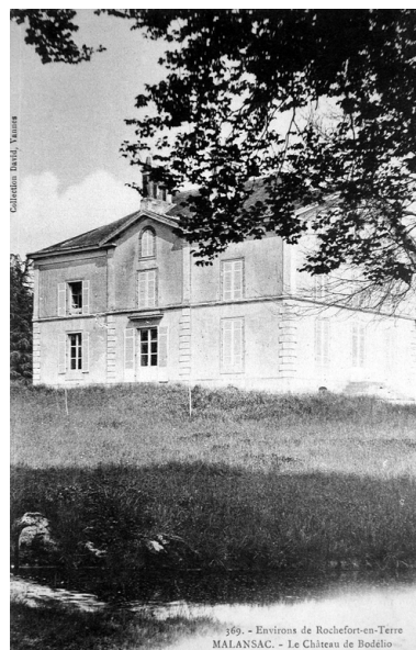
Le Château de Bodélio. Carte postale, limite 19e-20e siècles