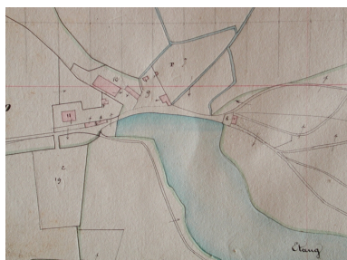
Le château de Bodélio et ses dépendances sur le cadastre de 1840 (A. D. Morbihan, série 3 P 443) IVR53_20045606192NUCB