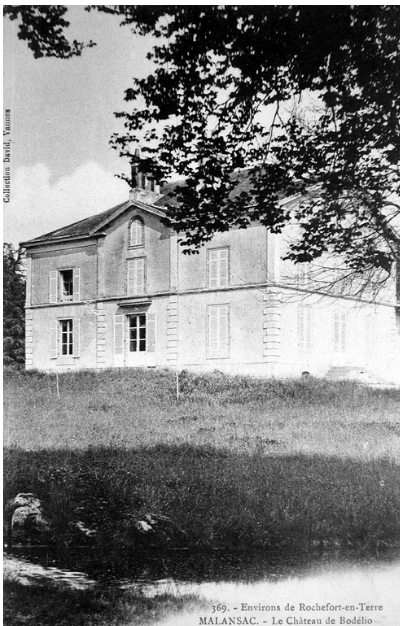
Le Château de Bodélio. Carte postale, limite 19e-20e siècles