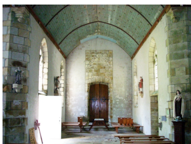
Plogonnec, chapelle Notre-Dame-de-Lorette : vue axiale ouest