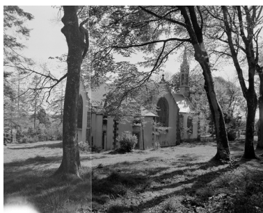
Plogonnec, chapelle Notre-Dame-de-Lorette : élévation nord-est, état en 1982 IVR53_19822900261X