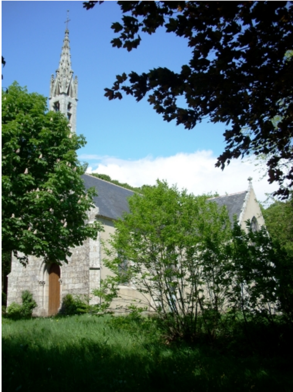
Plogonnec, chapelle Notre-Dame-de-Lorette : vue générale sud-ouest