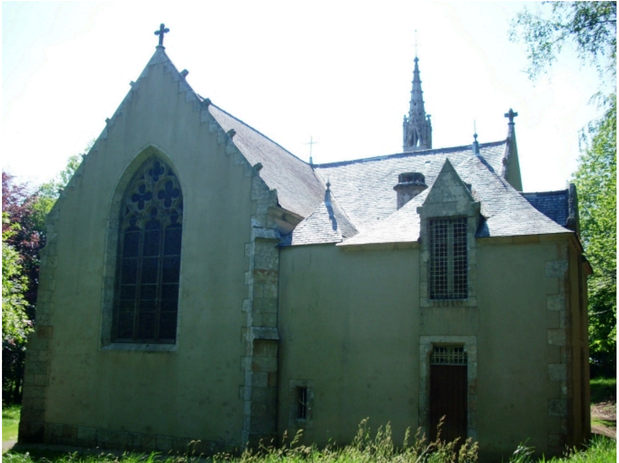
Plogonnec, chapelle Notre-Dame-de-Lorette : vue générale est