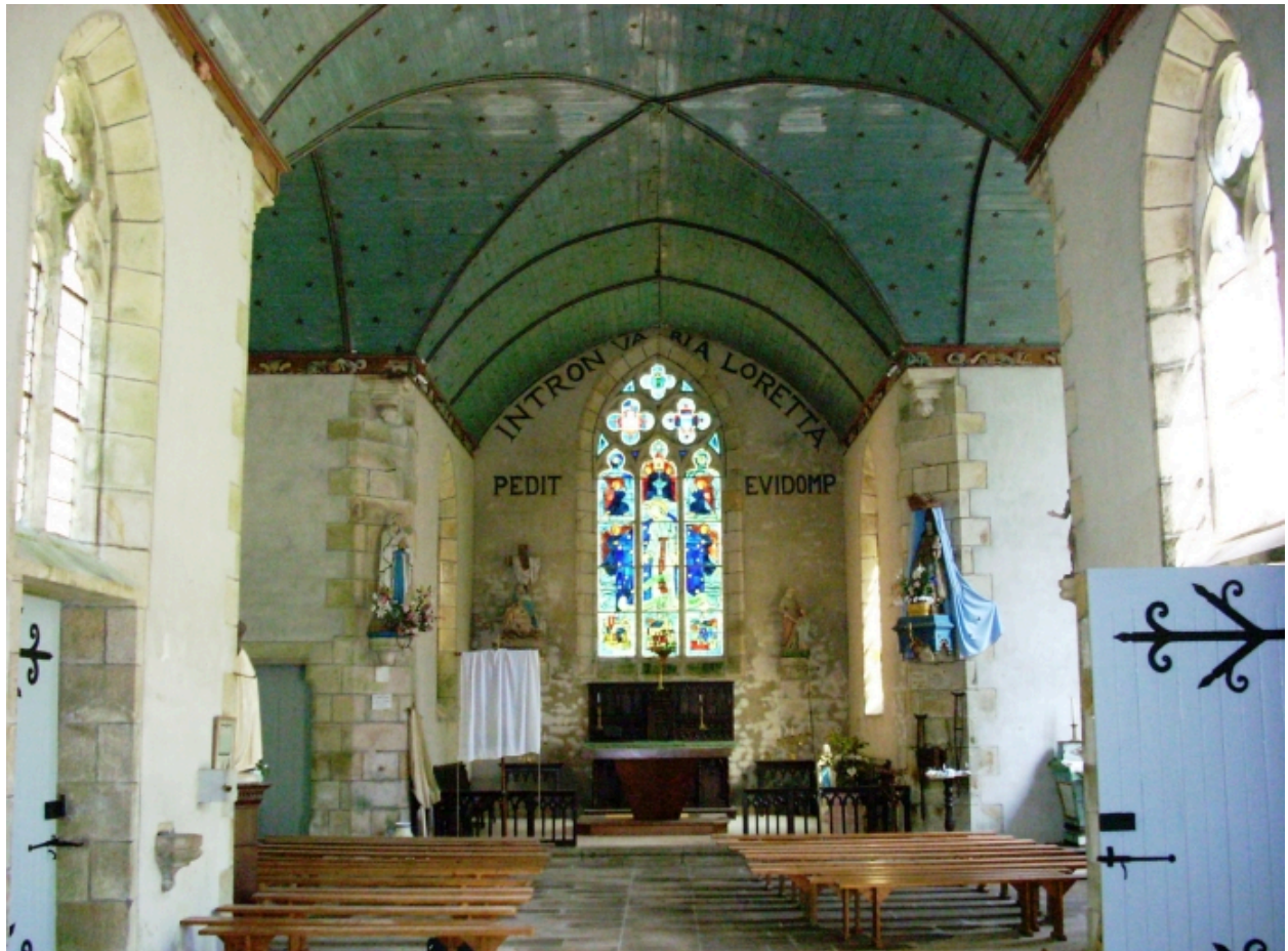
Plogonnec, chapelle Notre-Dame-de-Lorette : vue axiale est