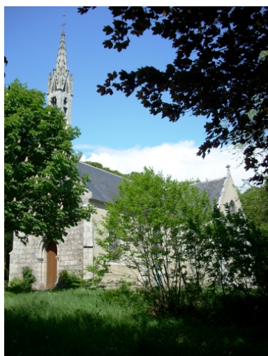
Plogonnec, chapelle Notre-Dame-de-Lorette : vue générale sud-ouest