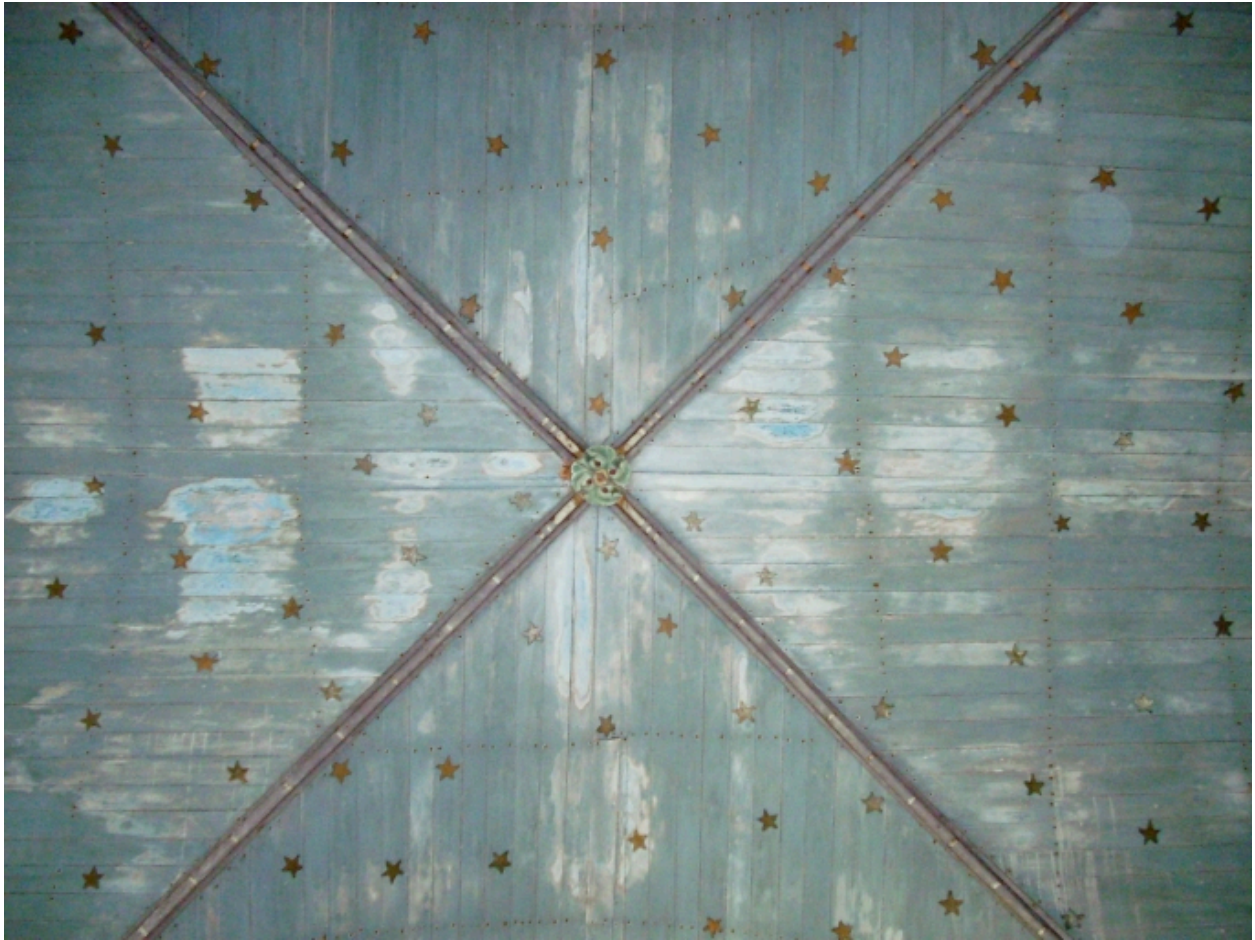
Plogonnec, chapelle Notre-Dame-de-Lorette : lambris de couverture à la croisée du transept, détail