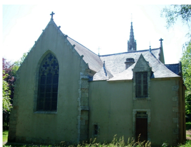
Plogonnec, chapelle Notre-Dame-de-Lorette : vue générale est IVR53_20082905922NUCA