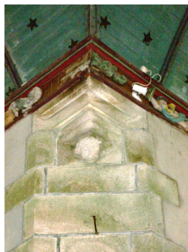
Plogonnec, chapelle Notre-Dame-de-Lorette : détail sculpture à l'angle nord-ouest de la croisée du transept IVR53_20082905925NUCA