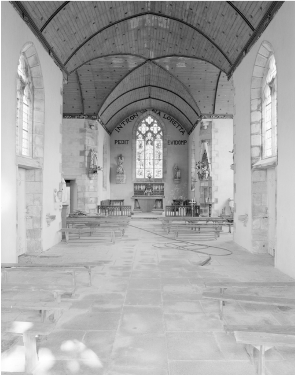
Plogonnec, chapelle Notre-Dame-de-Lorette : nef, vue vers l'est, état en 1982