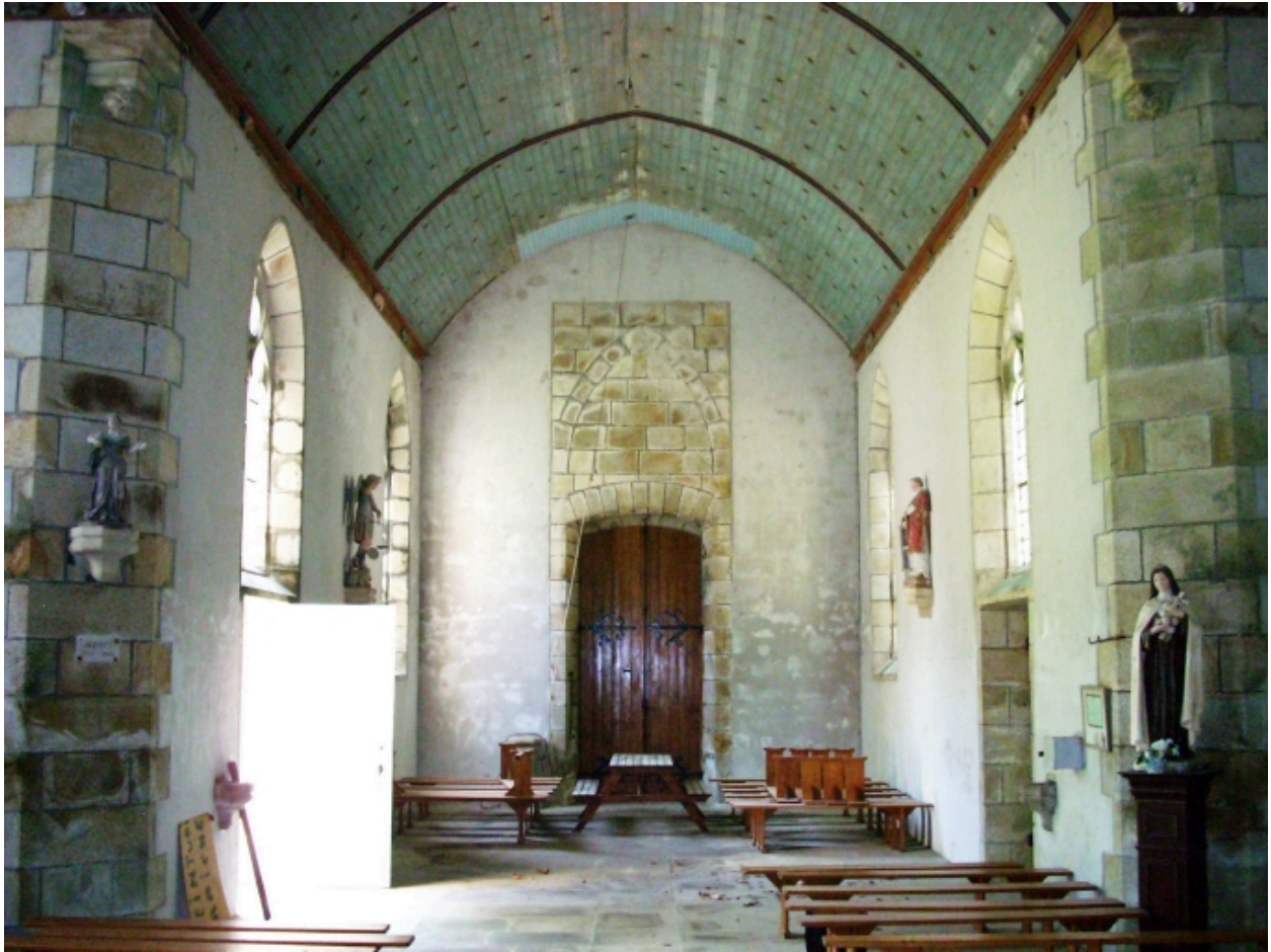
Plogonnec, chapelle Notre-Dame-de-Lorette : vue axiale ouest