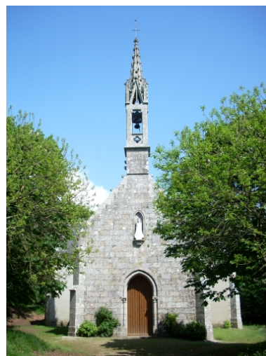
Plogonnec, chapelle Notre-Dame-de-Lorette : élévation ouest IVR53_20082905920NUCA