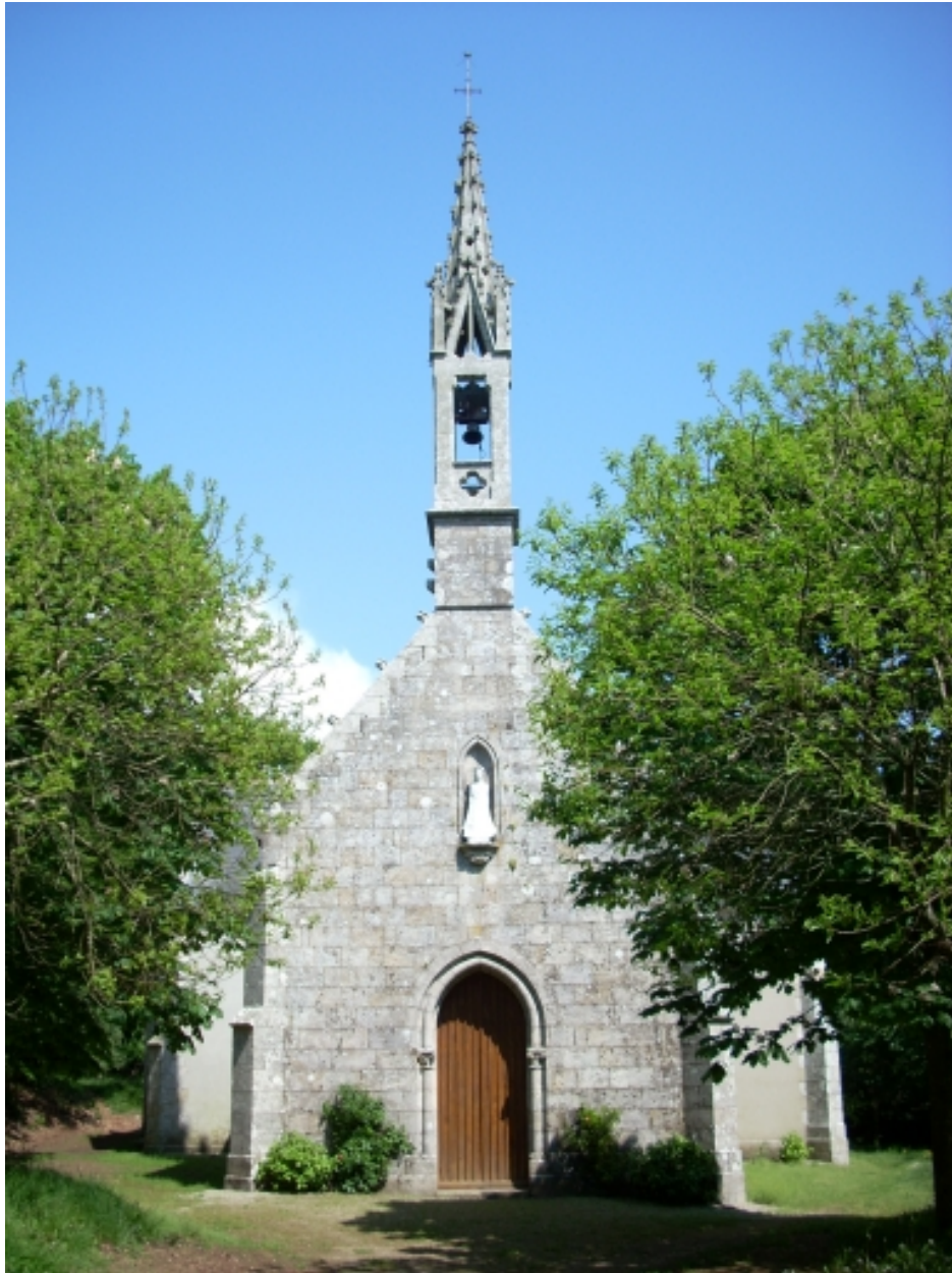
Plogonnec, chapelle Notre-Dame-de-Lorette : élévation ouest