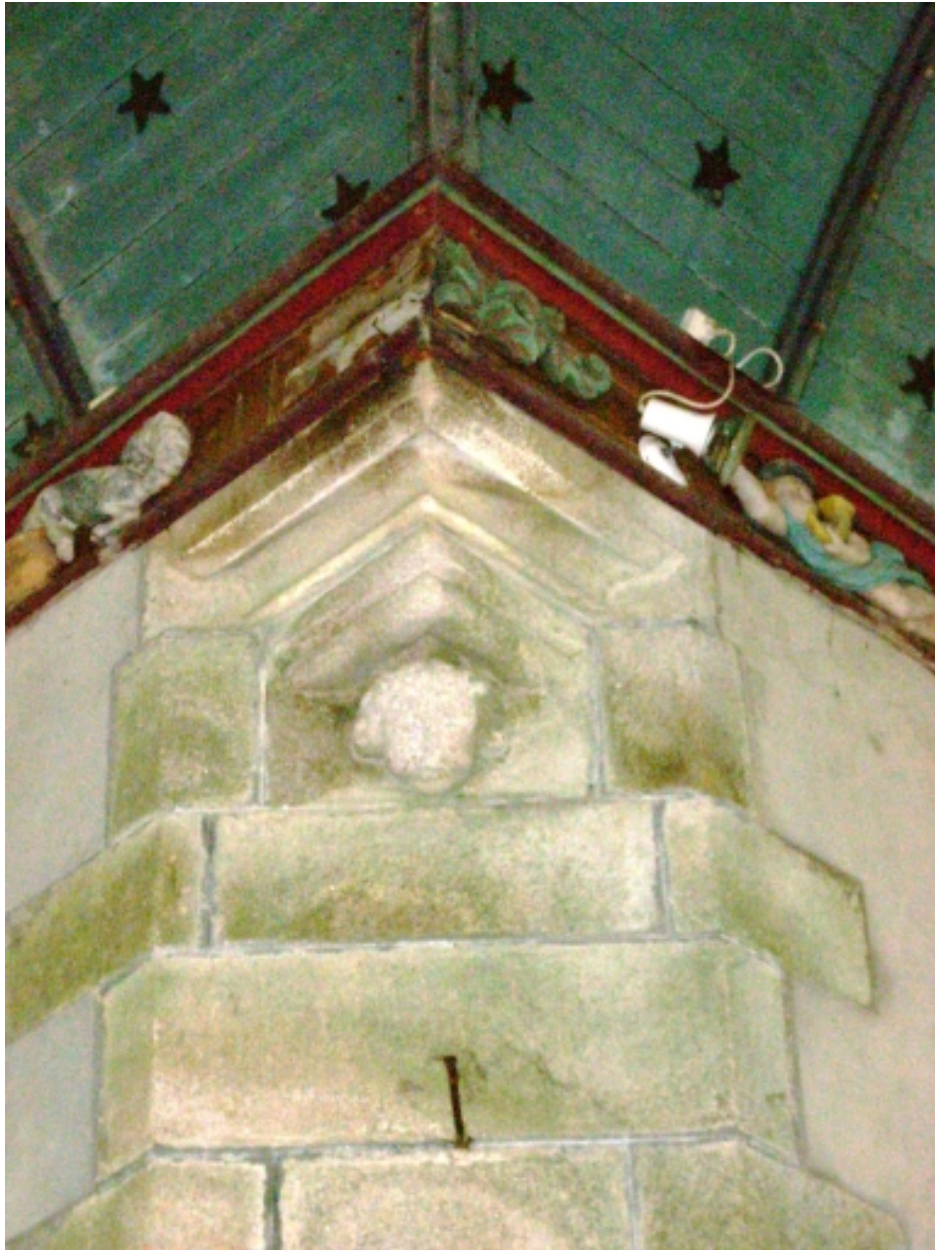
Plogonnec, chapelle Notre-Dame-de-Lorette : détail sculpture à l'angle nord-ouest de la croisée du transept