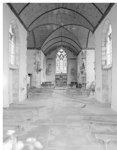
Plogonnec, chapelle Notre-Dame-de-Lorette : nef, vue vers l'est, état en 1982 IVR53_19822900259X