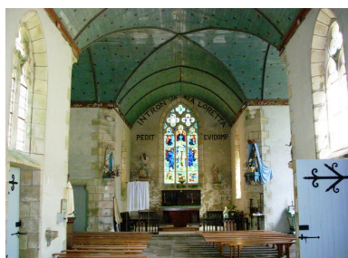
Plogonnec, chapelle Notre-Dame-de-Lorette : vue axiale est IVR53_20082905923NUCA