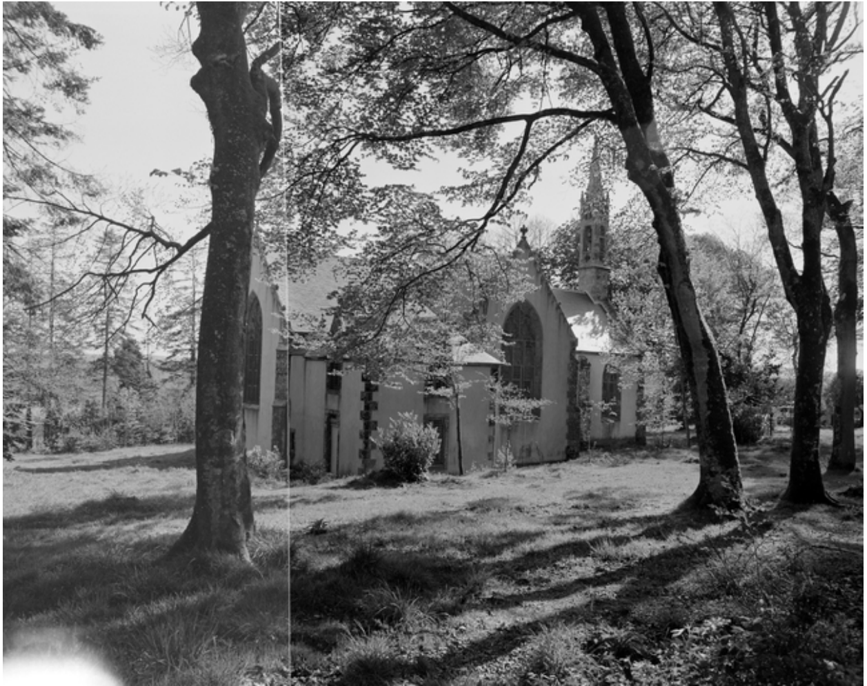
Plogonnec, chapelle Notre-Dame-de-Lorette : élévation nord-est, état en 1982