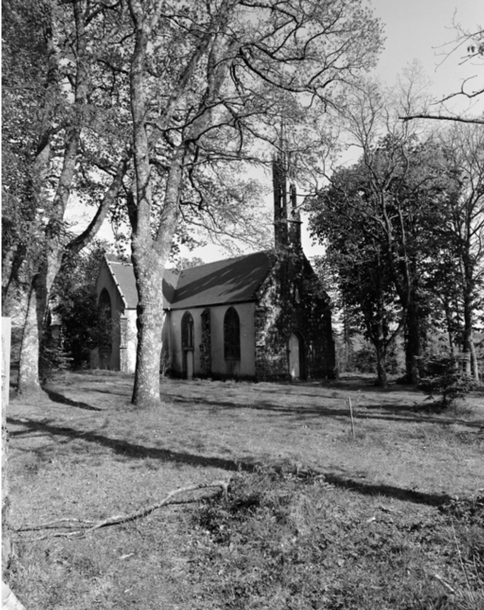
Plogonnec, chapelle Notre-Dame-de-Lorette : élévation nord-ouest, état en 1982